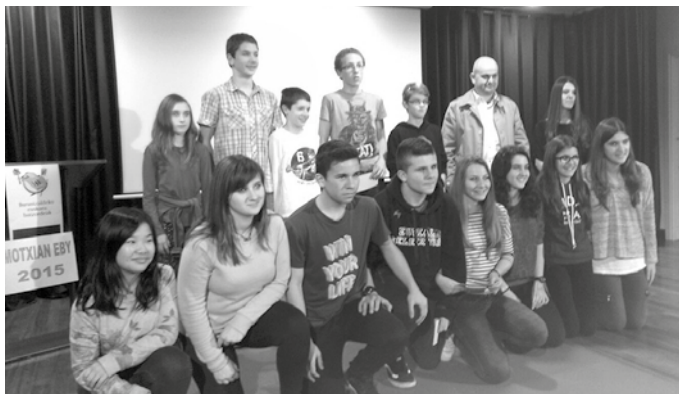
DBH 1 mailako talde batek nahiz Gaztelekuok eginiko lanak saritu dituzte.

O arsoaldean eta Buruntzaldean egin berri den esketx lehiaketan sarituak suertatu dira, usurbildar gazteek aurkezturiko lanak. Batetik, DBH 1. mailako gazte talde batek sorturiko "Udazkena" izeneko bideoa, Interneteko bozketan irabazle suertatu da. Gaztelekuok sorturiko "Plastifikatuak" izeneko lana berriz, Usurbilgo parte hartzaile onena. "Soka eta txapela horria" izeneko ikus-entzunezkoa ere aurkeztu zuen Gaztelekuak, Motxianeby lehiaketara. Egube-