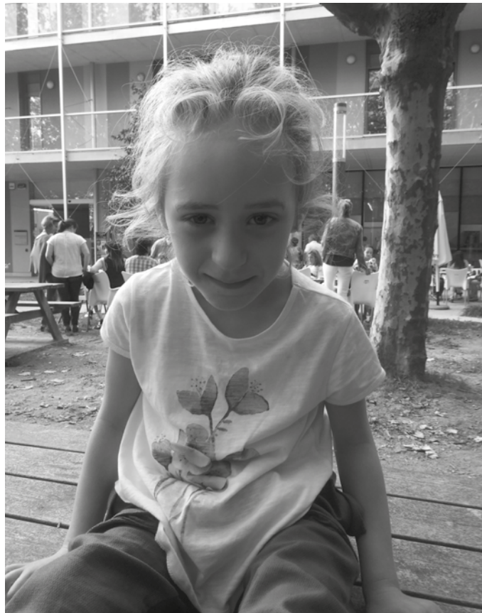
Gaixotasun hau dutenek ikasketa gaitasuna oso mugatua dute.

G. M. Kasu gehiago egon behar dute. Gertatzen dena da, orain arte diagnosis oso konplexua zen, analitika oso zehatza eskatzen zuen definizio horretara heltzeko. Geure kasuan adibidez beldur ginen, sindrome hau hilkorra izan zitekeelako. Egun, gaixotasun arraroak ikertzeko teknologia hobea dago. Azkenean jakin dugu, badela 44 urteko neska bat sindrome hau duena. Amerikarren arabera, beste edonork baino 10-15 urte txikiagoa izango omen du bizi-esperantza. Halere, ez dago frogatua