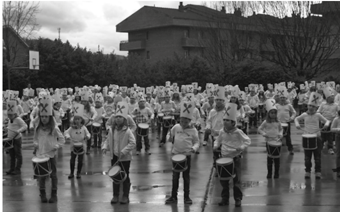
Udarregi Ikastolako haurren danborrada urtarrilaren 19an izango da, arratsalde partean Agerialden.

Ia hiru asteko oporraldiaz gozatu ostean, motzagoa izango den bigarren hiruhilekoari ekin diote ikastetxeek. Martxo amaieran baitituzte hurrengo atsedean egunak. Egu-berrietara ospakizun artean joan ziren Udarregi Ikastolako, nahiz Zubieta eta Aginagako eskoletako ikasle eta irakasleak. Eta itzuli berritan, jaialdi gehiago dituzte begi bistan.