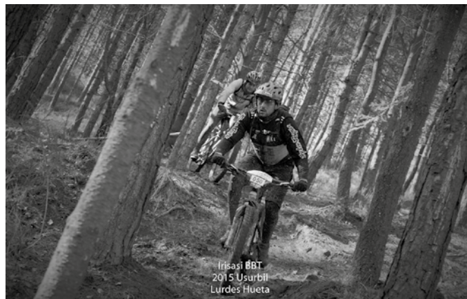
Iaz, 350 lasterkari batu ziren. Argazkia iazko ediziokoa da.

Parte hartzaileek bi ibilbide izango dituzte aukeran; bat motza, 25-30 kilometro ingurukoa; eta bestea, luzea, 40 kilometro ingurukoa.