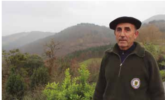
1994an hasi zen Andatzen, basozain lanetan.

Landareen lehortzearekin dago lotuta sutea. Espainian lehortea lehenago hasten da, bero handia egiten duelako udan eta dena sikatzen delako abuzturako. Hemen urrian hasten da desekazioa edo ihartzea. Eta gurean, suteen intzidentzia fuertea martxoan izaten da. Sute gehienak otsailean-martxoan izaten dira. Garoa, almitza, belarra, orbela, dena egoten da deshidrataziorik handienez eta usteldu gabe oraindik.