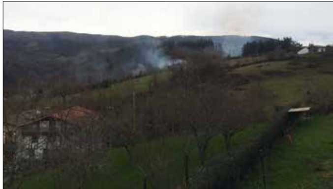
Orain urtebete piztu zen Izpirako sua. Sastrakak erretzeko piztu omen zuten sua eta haizearekin nahi baino gehiago zabaldu ziren suaren garrak.

Usurbilgoaz aparte, badira erreten talde gehiago? Zer nolako baldintzak bete behar dira erreten taldeko kide izateko?