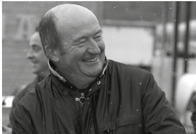
19:00etatik aurrera, Sutegin. Nafartarrak taldeak antolatu du omenaldia.