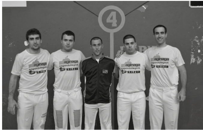
Datorren astean jokatu dute finala Amezketako Larrunarri frontoian, Tolosako Aurrera Saiaz taldearen aurka.

Amezketako Larrunarri pilotalekuan Huarte taldekoen aurka jokaturiko finalerdietako hiru neurketak irabazi eta gero sailkatu dira. Finala ere, frontoi berean jokatu dute usurbildarrek, urtarrilaren 23an. Tolosako Aurrera Saiaz izango dute aurkari, aurreko larunbateko finalerdian Zaramagakoekin lehiatu eta haien aurrean nagusitu ondoren.