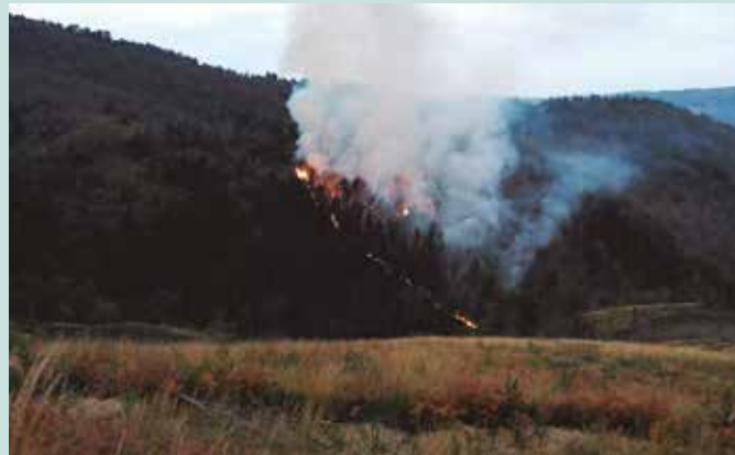
Azaroaren hasierakoa da argazkia. Andatzen, Zubieta partean piztu zen sua ez zen berehalakoan itzali.