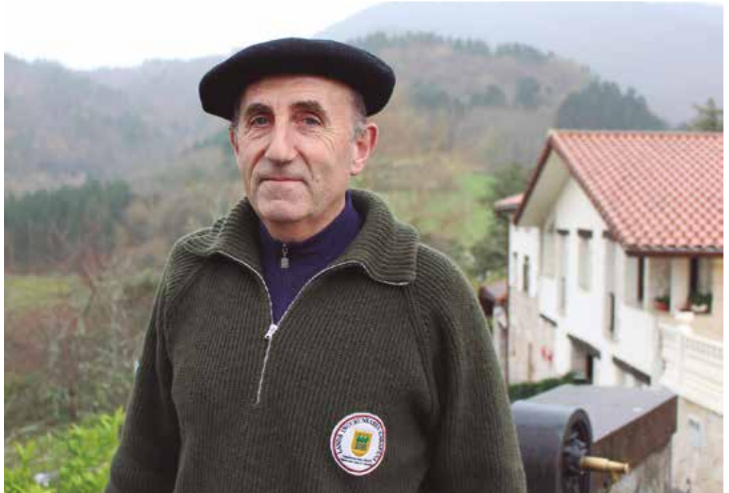
Garai batean, zuhaitzek helburu ekonomiko bat betetzen zuten. “Ingurugiroari, dibertsitateari, bertakoa izateari... Horrelako gauzei erreparatzen zaio orain”.

J. Z. Hori da, jendeak ez dezala egin sudur puntan jartzen