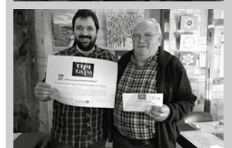
Irudiotan, abenduko pintxo festako saritua.