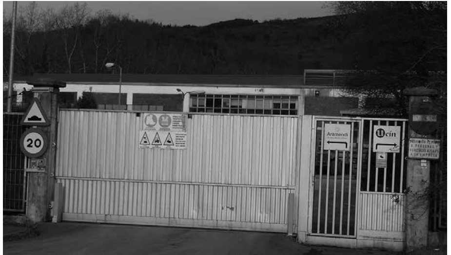
Enpresara bideraturiko edukiontzi gehiago aztertzen aritu da Ertzaintza.

H edabideetan, eguneko albisteetako bat izan zen urtarrilaren 6an, bi egun lehenago Ucin enpresan izandako gertaera; 100 kilo kokaina zituen edukiontzi bat aurkitu baitzuten. Itxuraz, zanpatutako freskagarri potoak baino ez zeuden bertan. Sutara bota eta ezohiko kea botatzen zutela ohartu ostean egin zuten aurkikuntza. Labea aztertzen hasi eta poto hauen barruan kokaina fardelak zeudela ikusi zuten langileek. 100 kilo kokaina guztira, 90 fardeletan banatuta. Itxura denez, edukiontzia Uruguatik iritsi zen Bilbora eta handik ekarri zuten Usurbilgo enpresara. Gertatutakoaren harira, ikerketa zabaldu du Ertzaintzak. Enpresara bideraturiko edukiontzi gehiago aztertzen aritu dira, aipatu enpresara halako bidalketa gehiago egon daitezkeen argitzeko.