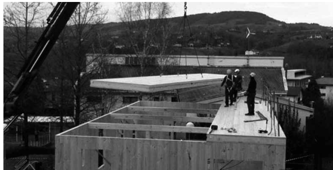
Lanbide Eskolan eraikitzen ari diren moduluka aurrefabrikaturiko eraikina aurrera doa. "Eraikin eraginkorren eta instalakuntza berriztaileen erreferente hezigarrian bilakatuko da", Eskolatik jakinarazi digutenez.

"Energia berriztagarriak eta eraginkortasun energetikoa gai hartuta eduki desberdineko postuak egongo dira. Eraginkortasun energetikoaren kultura eta energia garbieraren erabilera hedatzeko asmoz bertan hainbat gailu (berotze sistemak, kotxe elektrikoa, elektrizitate kontsumo neurgailuak, isolatzaile termikoak, bizikleta elektrikoak etab..) erakusgai egon-