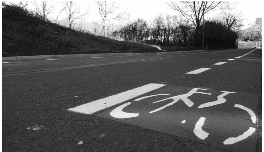
Puntapaxeko kalea egokitu dute. Bizikleta Planaren baitan, zati gehiago egokituko dituzte aurrerago.