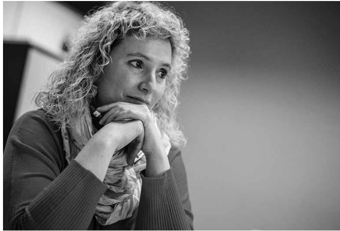
Ostiral honetan hitzaldia eskainiko du Potxoenean (irudia: Urola Kostako Hitzza).