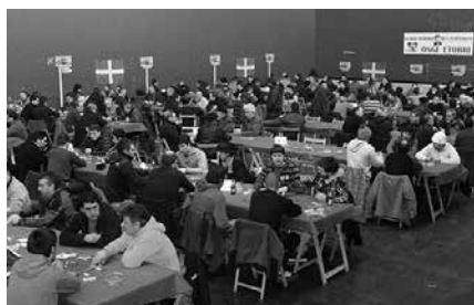
Bikote txapeldunak 3.000 euro eta Kariberako bidaia irabaziko ditu.

Larunbat honetan, goizeko 10:00etatik aurrera Mikel Laboa plazan, Usurbilgo Udala eta Lanbide Eskolak antolatuta.