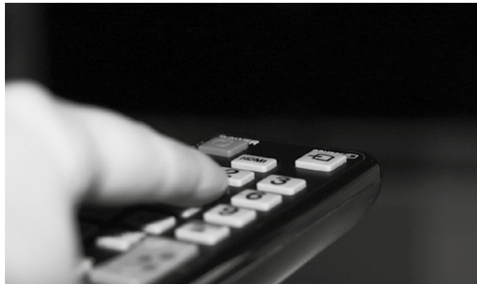
Telefono mugikorrek estazioetatik gertuen dauden eraikinetan Lurreko Telebista Digitalaren seinalean arazoak sor daitezke. Argibideak eman eta konponbideak proposatzeko abiarazi dute 'Llega800' kanpaina.

4 G teknologia berria, telefono mugikorretan orain. Aldaketak hedadura handieneko estaldura hobereana eskainiko du. Aurrerapen handia suposatuko du; besteak beste, Interneterako konexioaren abiada 150 Mbps-raino azkartzea ADSL-arena gaindituz. Bideoak esaterako, azkarrago igo edo deskargatu ahalko dira. Eta estaldura hobetuko da eraikin barruetan, udalerrri txikietan eta landa eremuan. 4G teknologia martxan dute dagoeneko Europako hainbat herrialdeetan.