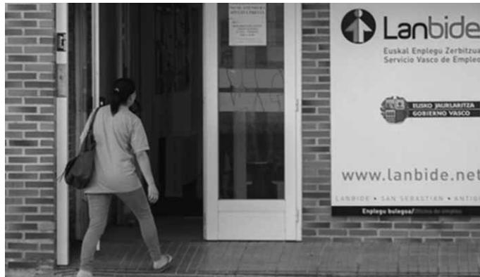
2015eko udan, gizonetako kontratazioak emakumezkoena bikoiztu zuen.

Emakumezko langabetu gehiago, gizonetako baino 2015ean irauli ez den errealita-