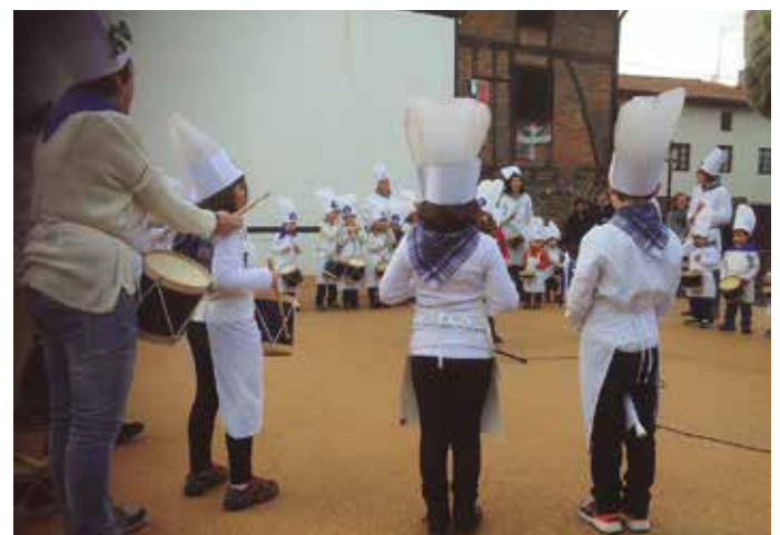
Eskolatik plazara irten ziren Zubietako ikasleak.