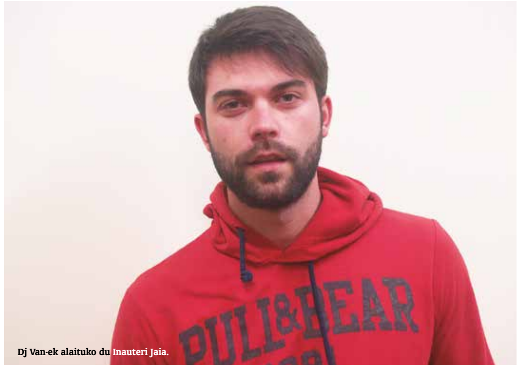
Dj Van-ek alaituko du Inauteri Jaia.

I. S. Herrian rock-a asko gustatzen zaie, urteko musika baita