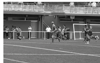
Larunbat honetan, futbola Haranen.