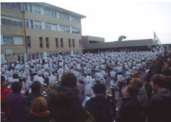
Agerialdeko patioan aritu ziren Udarregiko ikasleak.