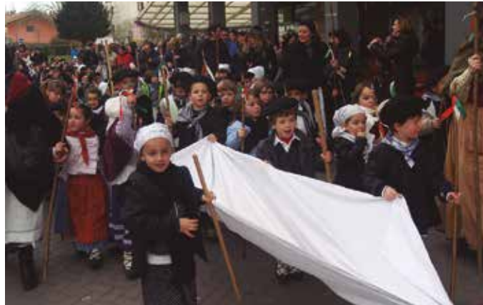
Asteburu bete ospakizun izango da hurrena.

Herri txiki honetako biztanle batzuek ere oso modan dagoen whatsapp martxan jarri eta elkarri animatuz, hortxe