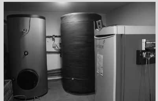
Zugasti baserrian ere, bi hilabete daramate eguzki panelekin eta egurra erretzeko galdara batekin, baserri osorako ura berotzen.

Tokia izan eta norberak dituen baliabideen arabera, energia berriztagarrien aldeko apustua egitera animatzen dute. Hasieran bai,