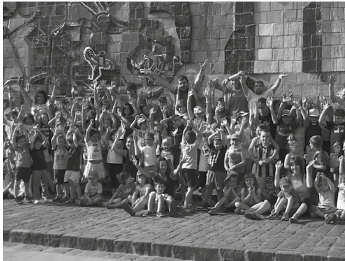
Datorren asteleheneetik aurrera banatuko dira Udajolaseko izen-emate orriak Udarregi Ikastolan eta Zubieta zein Aginagako ikastetxeetan. Baina apuntatzeko epea maiatzaren 2an zabalduko da.

A pirilaren 25eko astean banatuko dira Udajolasen izen emate orriak, Udarregi Ikastolan, Zubieta eta Aginagako ikastetxeetan. Izen emate orriok beteta, ordainketa eginda eta aurten, gizarte segurantzaren txartelaren kopia ere aurkeztu beharko dira, Udajolasen parte hartu ahal izateko. Usurbilgo Udalak NOAUA! Kultur Elkartearekin elkarlanean antolaturiko euskarazko aisialdi ekimenean apuntatzeko epea, maiatzaren 2an zabalduko dugu. Zehaztasun gehiagoren berri, datorren astekarian.