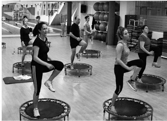
Ostiraleko saioaren ondoren, goizez nahiz arratsaldean egongo da jumping egiteko aukera. Baina adi, plaza mugatuak izango dira-eta.

Erakustaldira ezin baduzu agertu eta informazio gehiago