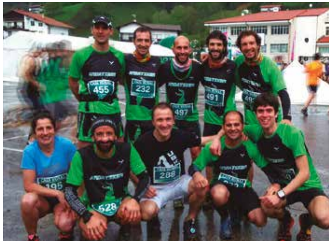
“Taldeko ia gehienak asfaltoan hasi ginen korrika baina mendian bukatu dugu”.

K. L. Iaz Andatzker taldeko kide guztien artean, 35 lasterketa