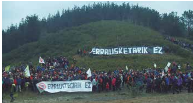
Artzabalen batuko dira. Larunbat honetan goizeko 11:00etan hasiko da bilera.

E rraustegiaren aurrean, “usurbildarrok gure aurkako jarreran tinko jarraituko dugu. Horretarako, beste urrats bat ematera goaz”. Gai honekin kezka izateaz gain, “konpromisoak hartzeko prest dauden herritar guztiei egiten diegu deialdia”, Errausketaren Aurkako Plataformatik aditzera eman digutenez.