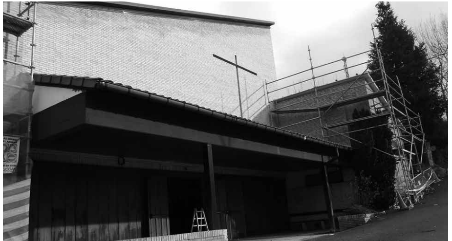
Argazkia azarokoa da. Konponketa lanetan ari ziren orduan. Honez gero amaitu dituzte berrikuntzak. Urteurren ekitaldia maiatzaren 1erako iragarri berri dute.

14:00 Bazkaria Aginaga Sagardotegian. Menuaren prezioa: 30 euro.