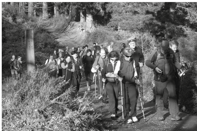
Maiatzak 7-8ko asteburuan izango da. Aukeran, bi eguneko edo egun bateko irteeretan eman daiteke izena.

Irteerarako izena eta 27 euroko ordainketa aurrez egin behar da, apirilaren 28a baino lehen. Maiatzaren 4ra arteko tartea izango dute egun pasa joan nahi dutenek. Kasu honetan, 10 euroko ordainketa egin behar da. Hain zuzen, Lizu-