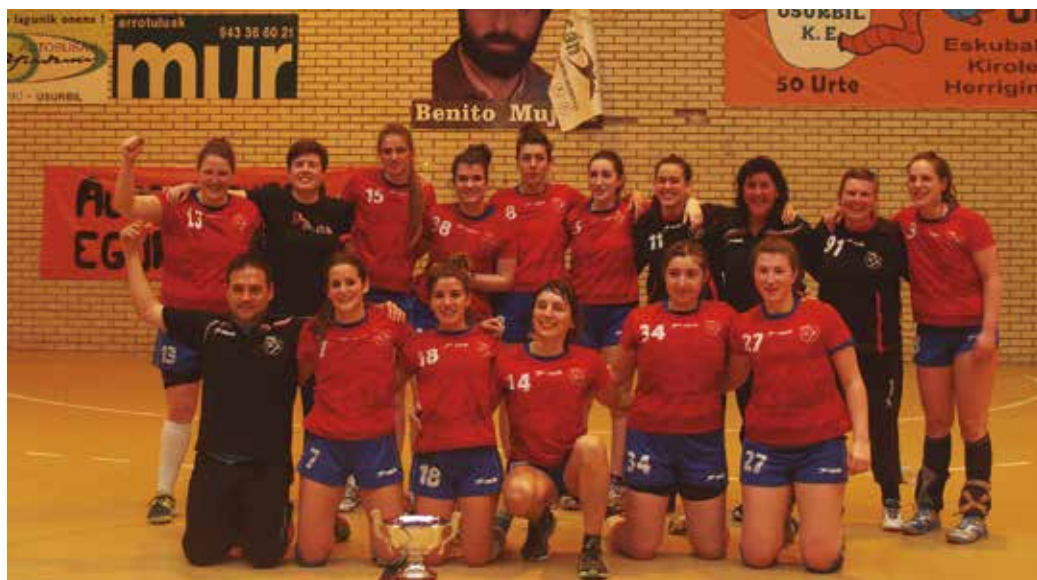
Jubenil taldeko jokalarien laguntza ere jaso zuten senior taldeko neskek.

Laguntzarako dei honekin batera, eskubaloi taldeen elkar-