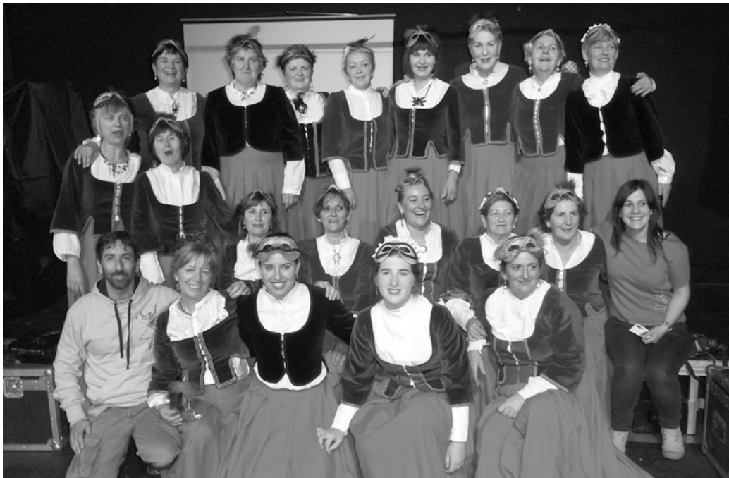
Argazkian, iazko Dantza Eguneko partaide batzuk. 75 bat lagun arituko dira larunbat gaueko ikuskizunean.

IV. DANTZA EGUNA OSPATUKO DA, ORBELDI DANTZA TALDEAREN EKIMENEZ