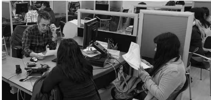
Ekainaren 25era arte zabalik dago errenta aitorpena egiteko epea.

Administrazioarekin ditugun harremanak euskaraz izatea eta Administrazioa bera euskalduntzea sustatu nahi dute, eremu honetan ere "euskarak merezi duen lekua