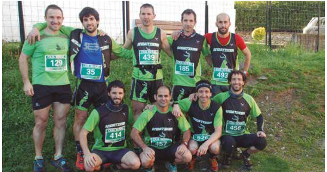
WhatsApp talde batean batzen dira Andatzker-eko kideak. Bertan egiten dituzte entrenatzeko nahiz lasterketara joateko planak. Argazkian, aurreko igandean Berako lasterketan partehartu zuten kideak.

K. L. Talde bat gara, baina ez dugu ez CIFik, ezta antzerik ere. Lagun talde bat gara, entrenatzeko eta lasterketara elkarrekin joateko. 20 bat lagun gaude, baina gero norbait mendian harrapatzen badugu ere, gure taldera batzera animatzen dugu. Alde horretatik oso informala da.