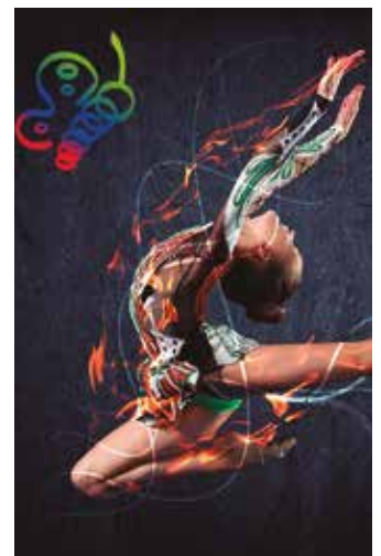
Donostia, Pasaia, Oiartzun, Usurbil, Astigarraga... 300dik gora neska-mutil hurbilduko dira Oiardo kiroldegira.