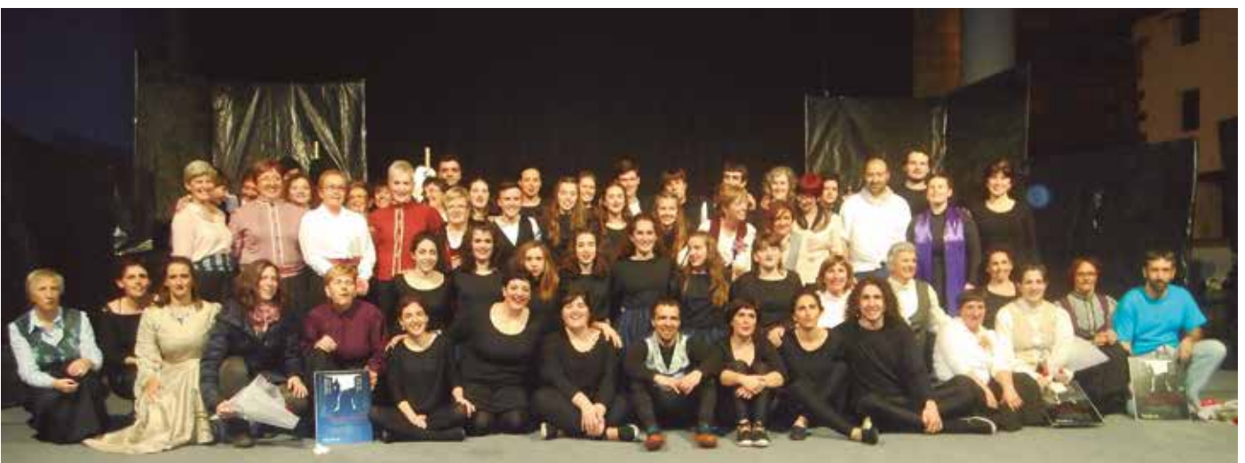
Orbeldi Dantza Taldekoen "Kanpaiak jotzean" ikuskizunak harrera ona izan zuen. Dantza Eguneko argazki eta bideo gehiago, noaua.eus web orrian ikusgai.