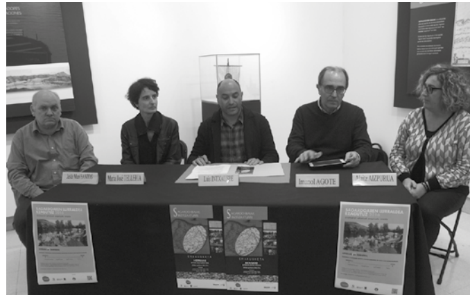
Erakusketa elkarlanean emaitza izan da. Sagardoaren Lurraldeak Aquarium-ekin eta Astigarraga, Hernani eta Usurbilgo Udalen laguntza izan du.