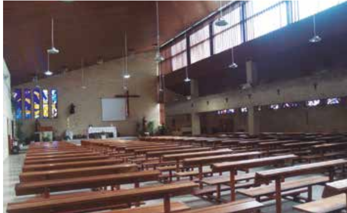
Denborarekin teilatua, “erditik behera jaisten ari zen. Arriskua handia zen”. Teilatua bere lekura igo, egitura indartu eta lehen zuen karga gutxitu dute.

Inauguratuta jada, eraikineko horma barruko gunean, gaur arte bizirik mantendu den mu-