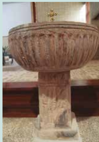
Aginagako elizan den ponteak 200 urte beteko ditu 2017an.

Zenbat eta zenbat aginagar ez ote dira bataiatu irudiko pontean. Pentsa, 1817koa dugu. Garai batean Aginagako Eliza Zaharrean baliatzen zuten. Gero egungo eraikina inauguratu zutenean, biltegian gorde zuten. Iaz egin zituzten berrikuntza lanetan eraberritu, txukundu eta egungo eraikinean jarri dute berriz. 50 urte bete ditu Aginagako Elizako eraikinak, 200 urte beteko ditu ponteak 2017an.