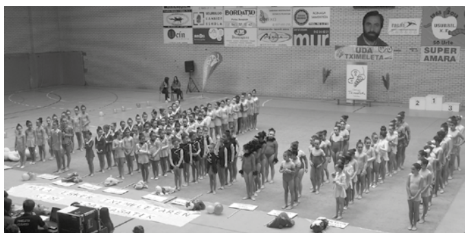
Larunbatean ospatu zen Tximeleta eguna Oiardo kiroldegian. Eguneko argazki eta bideo gehiago noaua.eus web orrian.

E rakustaldi bikaina eskaini zuten Tximeleta taldeetako kideek, larunbatean soinketa erritmikoko topaketan parte hartu zuten 300 neska-mutilek. Musika doinu ezberdinen erritmora txikienek pilota eta uztaiekin eta handienek berriz, uztai-mazoekin eta xingola-pilotarekin emanaldi ederra eskaini zuten.