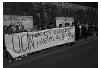
2012an, ITAYAK hainbat elkarretaratze egin zituen.

Bere aldetik, Usurbilgo Udalak 2015eko ekainetik Udalean jasotako