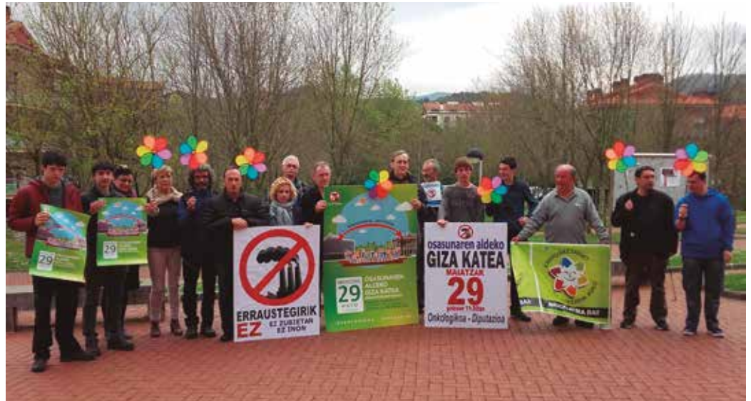
Argazkian dira talde berri honen eratze-batzarrean parte hartu zuten kideak.

Maiatzaren 29ko giza-katea girotzen hasteko, udalerriri mailako giza-katea antolatuko dute maiatzaren 7-8ko astebururako.