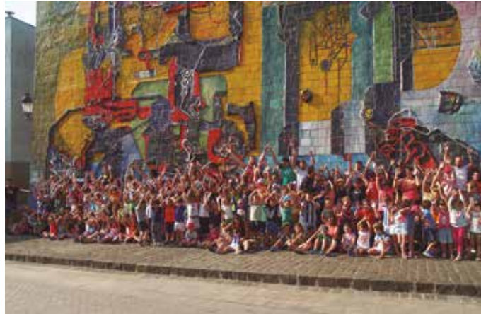
Maiatzaren 2an hasiko da izen-ematea. NOAUA! Kultur Elkarteen egoitzara etorri behar duzue, ondoko ordutegian: 10:00etatik 11:00etara goizez, eta 16:00etatik 18:00etara arratsaldez.

txartela edo familia liburuaren kopia ekarri behar da).