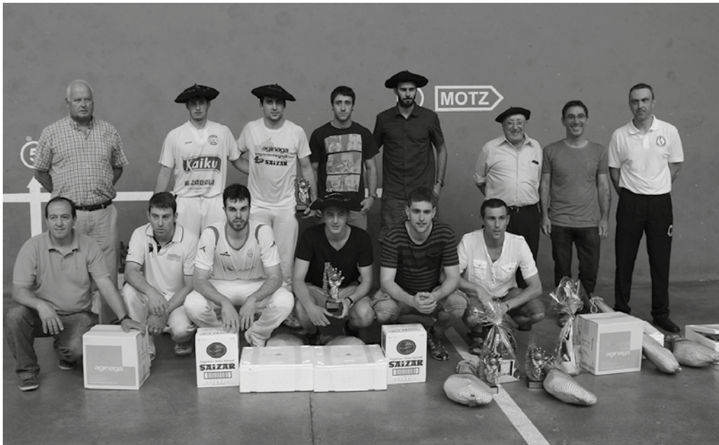
Iazko txapelketako garaileak, finalistak, antolatzaileak eta udal ordezkariak.

Larunbat honetan abiatuko da herriko pilota txapelketa beteranoe-na: Usurbilgo 44. Esku Pilota Txapelketa. Orain hasi eta Santixabel jaiak hasi bitartean, astebururo kanporaketak jokatuko dira. Finala, nola ez, jaietako egun handian jokatuko da: uztailaren 2an.