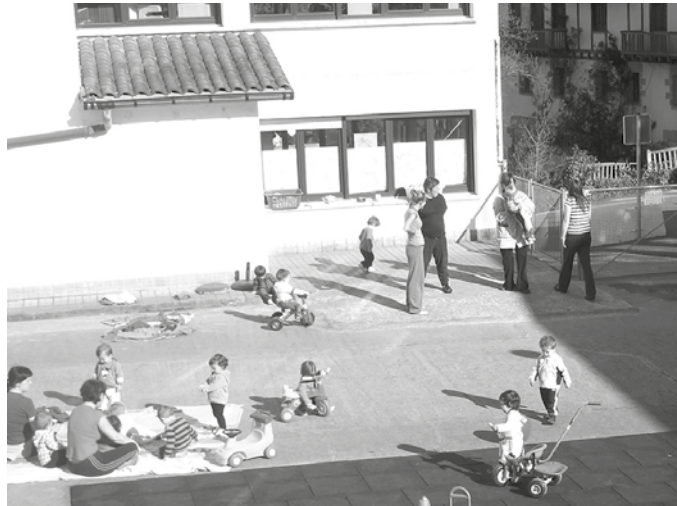
Matrikula osatzeko alde aurretik hitzordua eskatu behar da 943 374 061 telefono zenbakira deituta.

Bestalde, irailetik aurrera Lanbide Eskolan ikasten hasi nahi duenarentzako ate irekien egunak antolatu dituzte maiatzaren 7an, eta 14an, 11:00-13:00 artean. Maiatzaren 11n, 18:00-20:00 artean. Instalakuntzak ezagutzeko bisita gidatua egin eta hezkuntza proiektua aurkeztuko da. Erdi