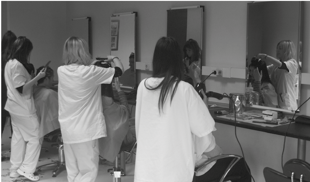
“Arrazoi ezberdinengatik DBH ikasketekin jarraitu ezin duten ikasleei alternatiba-baliabide errealak eskaintzen dizkio”.

D errigorrezko Bigarren Hezkuntzan (DBH), formazio aldaketa baten beharrean aurkitzen diren gazteen bidelagun izaten darama 25 urtez, garai batean Agerialden, eta egun Atallun kokatua dagoen Oinarrizko Lanbide Heziketa Programak. Mende laurdena igarota, zerbitzuaren balantzea egiteko unea heldu zaie egitasmo honetako sustatzaileei.