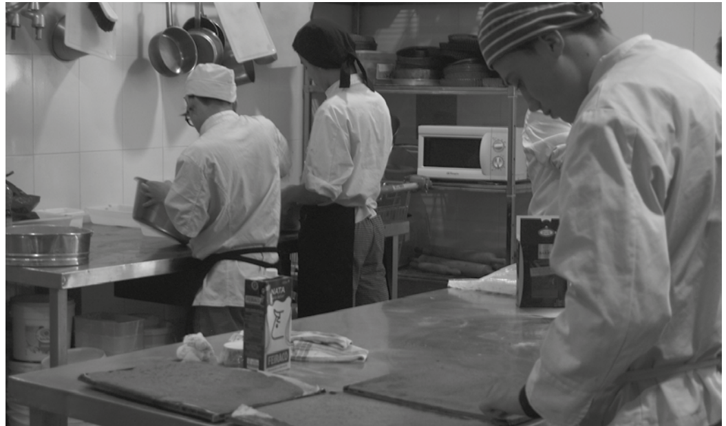
Oinarrizko Lanbide Heziketa Programaren baitan, oinarrizko titulua lor daiteke sukaldaritza eta jatetxe-arloan.

■ Ikasle kopurua: 23 ikasle. lortu dutenak: 6. nak: 1. ■ DBH graduatua lortu dutenak: 3. ■ Cebad-en matrikula egin dutenak: 1. ■ Sukaldaritzako ikastaroak (Lanbide): 2. ■ Praktikak amaituta lana ■ EPA-n matrikula egin dutenak: 1. ■ Erdi maila. Sukaldaritza: 1