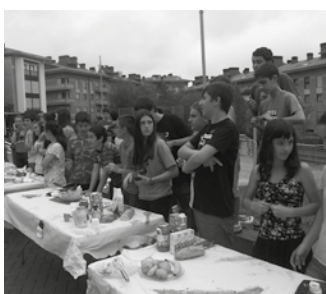
Maiatzaren 9a astelehena, Potxoenean.

Ekainaren 30etik uztailaren 3ra ospatuko diren festak antolatzen segitzeko Jai Batzordearen hurrengo bilera irekia, maiatzaren 9rako deitu dute. 18:00etan Potxoenean.