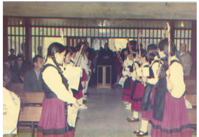
Euskal dantzak ere izan ziren 1966ko inaugurazio ekitaldian. Koloretan gordetzen den argazki bakarretakoa da hau.