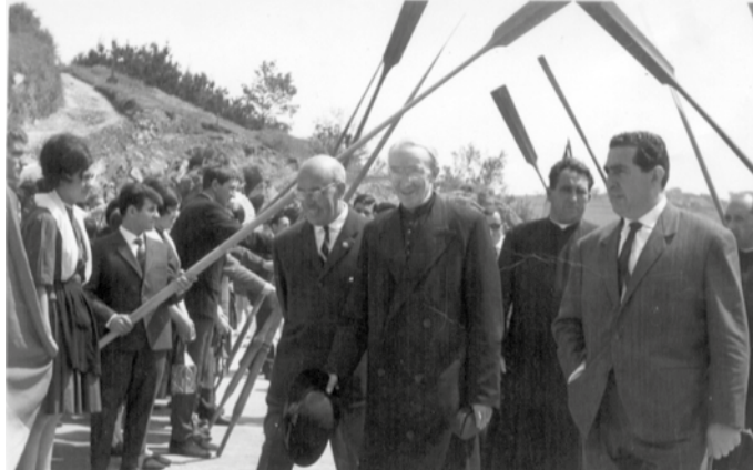
Autoritateak arraun artean sartu ziren eliza berrian.

Esaterako, eraikin berria finantzatzeko loteria jokatzeko hasi ziren Aginagan. “Apaizak ekartzen zuen loteria eta herritarrek partizipazioa hartzen zuten”, oroitu digu Aginagako Parrokiako Taldeak. Partizipazioa erosten zuenak, baldintza batekin eskuratzen zuten. “Loteria tokatzen bazen, sariaren erdia eraikin berrira bideratu behar zen”, adierazi digute. Esan eta izan. Loteria jokatzen hasi eta tokatu azkenean. “Partizipazioa zutenek sariaren erdia jaso zuten, beste er-