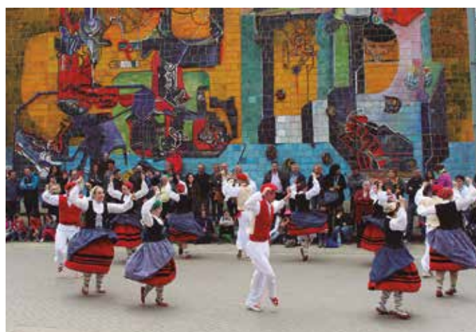
Iruñeko Ortzadar, Donostiako Goizaldi eta Usurbilgo Orbeldi Dantza Taldekoek ikuskizun ederrak eskaini zituzten larunbat goiz partean.