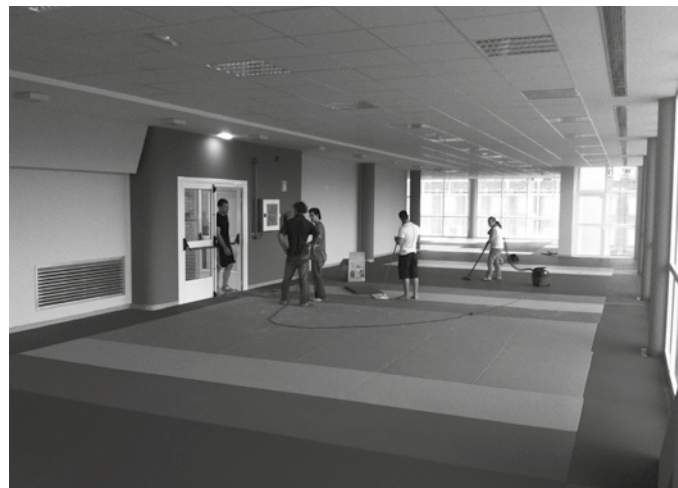
Agiriak edota informazio gehiago Udaletxean jaso daitezke.

Bi urtetarako kontratua izango da, "beste urte beteko bi epez luzagarria" izango dena. Esleipen deialdi honetan parte hartzeko interesa dutenek, 20 eguneko epean aurkeztu beharko dituzte eskabideak. Agiriak eta informazio gehiago jasotzeko, Usurbilgo Udalera jo dezakezue asteleheneretik ostiralera goizez, 08:00-14:30 artean, deitu 943 371 951 telefono zenbakira, edo idatzi email bat, kontratazioa@usurbil.eus helbidera. Prozesu honen berri ere usurbil.eus udal web orrialdean emango dute.