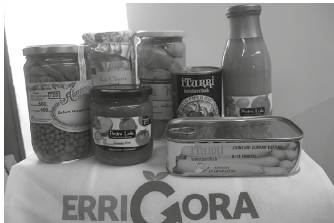
Eskaerak NOAUAn egin behar dira. Produktuak jasotzean pagatu beharko da.

Nafarroa hegoaldean ekointzitatiko produktu bakoitzetik 12 ontziko lotea duzue eskuragarri. Egin eskaera orain, eta loteok jasotzean ordaindu. Erriberako tokiko produktuak, eta bertako euskalgintza sustatzea helburu duen kanpaina honen bidez,