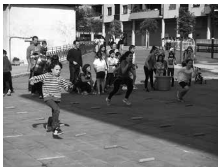
Zubietako Eskola Txikikoek ekitaldi asko iragarri dituzte datorren asterako.