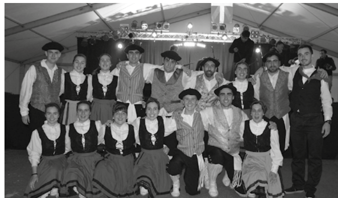
Pasa den asteburuan Musikaren Egunean hartu zuten parte.

Xokoa elkarteak antolatutako, musikaririk eta dantzarik ez da falta izaten larunbatez eta igandez. Kulturen arteko