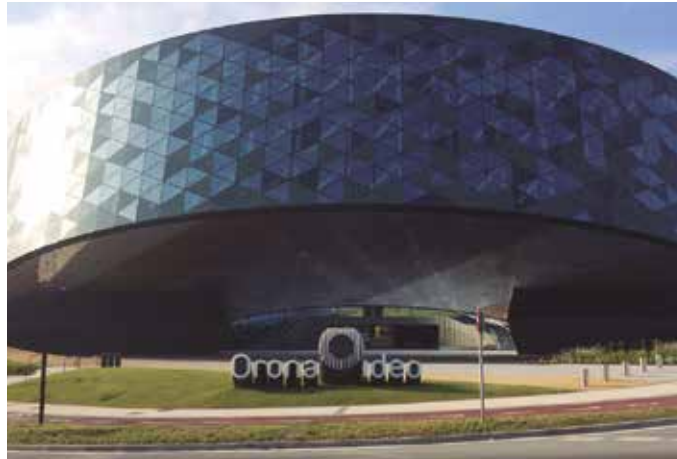
Jardunaldiak larunbat honetan arratsalde partean egingo dira, Hernaniko Orona-Ideo gunean.