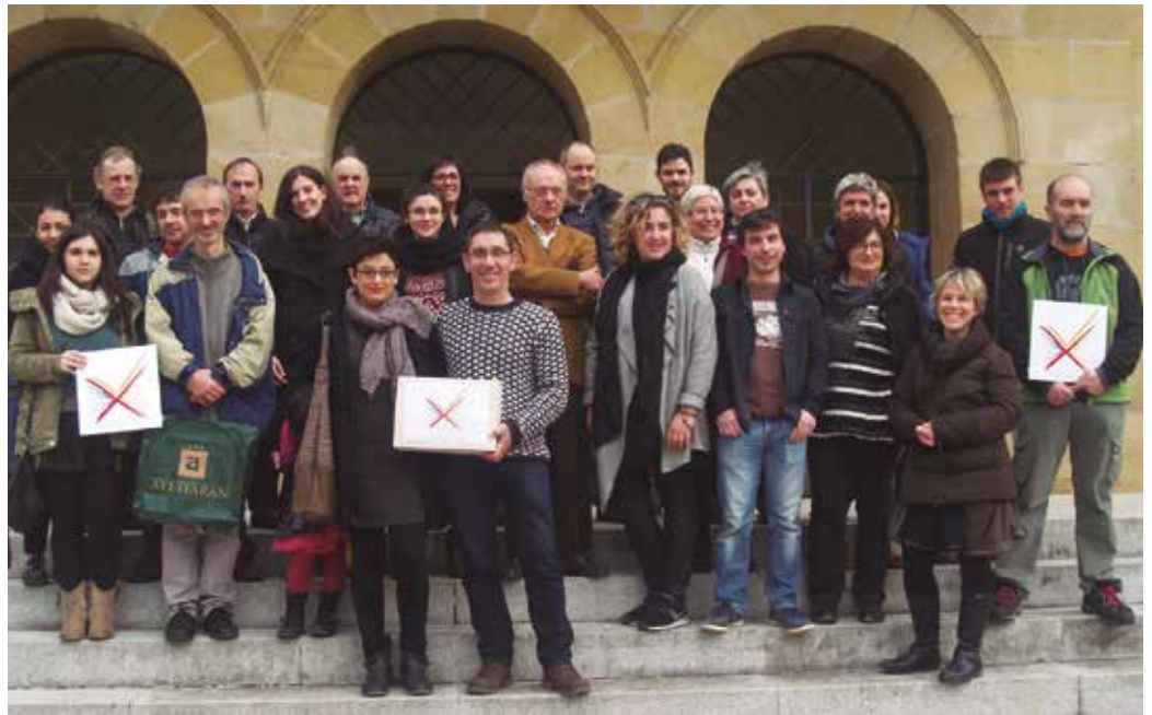
Erraustegia Erabakia herri plataformak 1.085 sinadura batu zituen. Ministroen Kontseiluaren ustez, “gaiak udal esparrua gaintitzen du”.

Espainiako Gobernuak aurreko ostiraleko Ministroen Kontseiluan hartu zuten erabakia argudiatzeko, “gaiak udal esparrua gaintitzen du” diote. Hauxe, Ogasun eta Administrazio Publikoko Ministerioak, galdeketa buruz dioena: