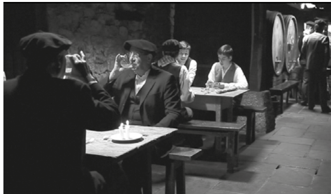
Ostiral honetan emango dute dokumentala. Arratsaldeko 19:00etan hasita.

“Urtean lau hilabetez, urtariletik apirilera, euskal sagardotegiek milaka pertsona erakartzen dituzte, bertakoak zein kanpokoak. Tradizioa bete nahi dute denek: tortilla, bakailaoa, txuleta eta gazta jatea, eta txotxera deitzen duen ahotsa entzundakoan sagardoa edatea. Tradizio modernoa da hau, baina erro sakonak ditu.