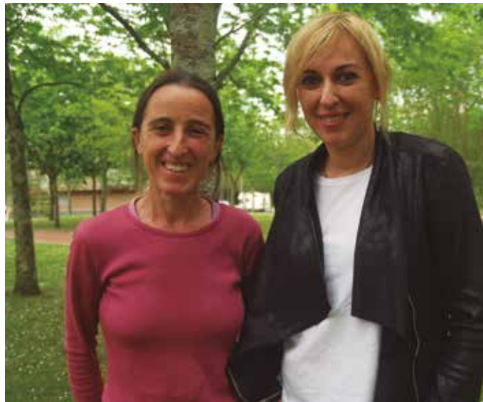
Ostiral honetan 18:00etan Potxoenean ekitaldi irekia antolatu dute.