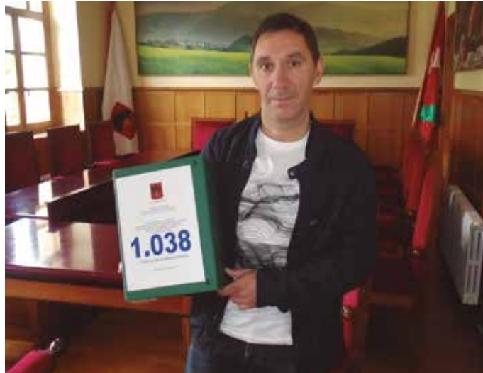
Alkatea, Usurbilen aurkeztu diren errekurtsorak esku artean dituela.

Usurbilen 1.067; Zubie- tan 327; Lasarte-Orian 575; Hernanin 500; Astigarragan 151; Andoainen 201; Gasteiz- eko kanpusean 300; Urnietan 40; Usandizaga Donostian 25; Tolosan 180; Ibarra 25; Ano- tan 80; Legazpin 137; Deba 20; Aiztondon 100; Arrasaten 160; Eskoriatzan 5; Bergaran 12 Elgetan; 7; Oñatin 105.