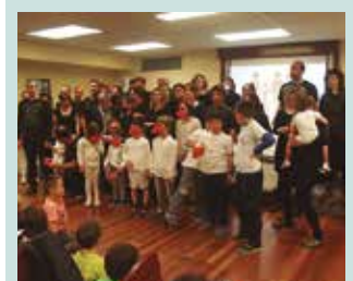
2.189 sinadura batu dituzte jada.