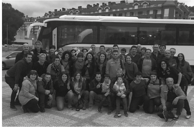
Kantabrian jokatu zen igoera fasean lortu dute txartela.

Taldetik eskerrak helarazi nahi dizkiete zaletuei, "Castro Urdialeseraino joateagatik. Urte osoko lanaren emaitzarekin oso gustura gaude. Eta hurrengo urtean Zilarrezko Ohorezko Mailan jokatzeko irrikitan?". Azken denboraldiotan behin eta berriz aipatu izan