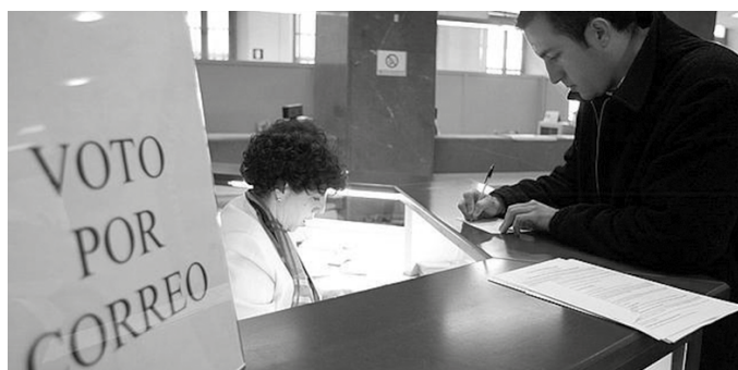
Posta bidezko botoa ekainaren 16a baino lehen bideratu behar da.

Honen harira, bada Usurbilgo Udaletik nabarmendu nahi duten ohar bat. "Posta bulegoan posta bidezko botoa emateko eskaera egiten dutenek, ezin izango dute inolaz ere hauteskunde egunean botoa eman, botoaren bidalketa egin ez dutenek ere ez, nahiz eta eskaera egin izan". Bada Udaletik zabaldu nahi duten bigarren ohar bat, maiatzaren 16a arte jendaurrean ikusgai izan zen hautesle-errolaren ingurukoa.