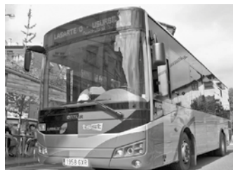
UK09 autobusa Donostiako geltoki berriraino iristen da orain.

Geltoki berria ibilbidean txertatzeak, Zumaia Donos-