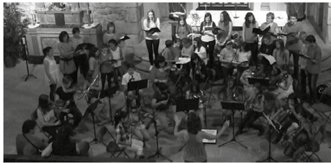
Maiatzaren 23an zabaldu eta maiatzaren 27an amaituko da matrikulazio epea.

Ordainketa egiterakoan, ikaslearen izena ipini kontzeptu gisa, eta ordainagiria jaso. Kontuan izan Kutxan ordainketak egiteko ordutegia hau dela: goi-