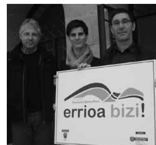
Udalak prestatu duen inkesta bat betetzeko aukera izango da laster.

Lehen fasean, Oriarekin nola baitaiteko lotura duten eragile eta norbanakoekin elkarriketa erronda bat egin da. Orain, herritar ororen txanda dator. Oria ibaiaren paisaiarako ekintza plana diseina-