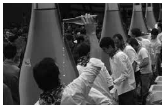
Festa-ingurune osoa itxita egongo da ibilgailuentzat.

Hainbat kale ere itxita egongo dira; kanposantu zahararren parean, Puntapax, Bordaberri eta Zu-