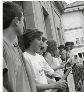
Kiroldegian, Sutegin edo Potxoenean dauden kaxetan utzi daiteke txupinazorako proposamena.

16 urtetik gorako usurbildarrek parte har dezakete. 8-10 bertso idatzi eta izengoitiz aurkeztu gutunazal batean, ekainaren 8a baino lehen, Usurbilgo Udala (40. Bertsopaper Lehiaketa), Joxe Martin Sagardia plaza, Usurbil 20.170 helbidera.