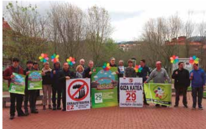
Gutxienez 400 usurbildar behar dira eta dagoeneko 350ek eman dute izena.

Osasunaren aldeko eta erraustegiaren aurkako giza-kateak Donostiako Onkologikoa eta Aldundia lotuko ditu, maiatzaren 29an. 9 eremutan banatuko da katea, eskualde edota udalerrri. Usurbildar eta zubietarrek 8 eta 9 guneetara gerturatu beharko dute; Londres Hoteletik Gipuzkoa plazarako tartera, goizeko 11:30etarako: