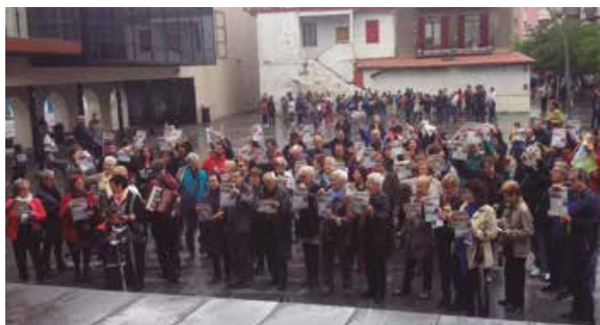
Aurreko asteburuan 600 bolondres aritu ziren Gipuzkoan, Erraustegiaren Aurkako Mugimenduaren esku-orriak banatzen.

Arrakastatsua suertatu da, Erraustegiaren Aurkako Mugimenduak erraustegiak dakartzan kalteez ohartarazteko 200.000 esku-orritik gora banatzeko asteburuan egin duen banaketa. Erraustegiaren aurkako mezua eta maiatzaren 29ko giza-katerako gonbita Gipuzkoa osora zabaltzeko 600 boluntariok baino gehiagok. Esku-orria erraustuez.org atarian ere eskura dezakezue.