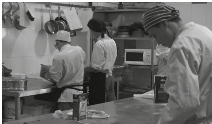
Maiatzaren 25ean zabaldu eta ekainaren 5ean itxiko da matrikulazio-epaia.

DBHko ikasketetatik Lanbide Heziketara igaro nahi duten 15-17 urte arteko gazteei zuzendua dago Atallun kokaturiko hezkuntza eskaintza. DBH amaitu ez, baina formazio aldaketa bat nahi-behar duten gazteei. Bi eremuetan lan egiteko prestatu daiteke bertan: ile-apainketa eta estetikan edota sukaldaritza eta jatetxe-arloan oinarrizko titulua eskuratzeko aukera dago. Oinarrizko Lanbide Heziketan aritzeko ezinbestekoa izango da DBH 3. maila egina izatea; salbuespen moduan, DBH 2. maila egina izatea eta irakasle taldeak, Oinarrizko Lanbide Heziketako ziklo batean sartzeko proposamena egin izana guraso edo legezko tutoreei. Bi ikasturteko iraupena du Oina-