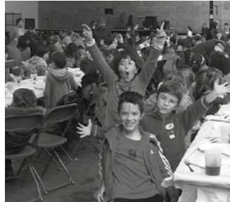
Bazkarirako txartelak Udarregiko idazkaritzan daude salgai.

Eguneko ekitaldien artean, ikasleen jolasak edota HH-koen ikuskizuna programatu dituzte. Baita herri bazkaria ere frontoian. Aurrez erosi beharko dira otordurako txartelak, ikastolako idazkaritzan. Ikastola Egunaren aurretik ere ekimen bat baino gehiago antolatu dituzte. Lehen hitzordua, maiatzaren 26an; ikastolako bazkideen batzar orokorra 18:00etan Sutegiko auditorioan. Ordu horretarako egin dute lehen deialdia, bigarrena,