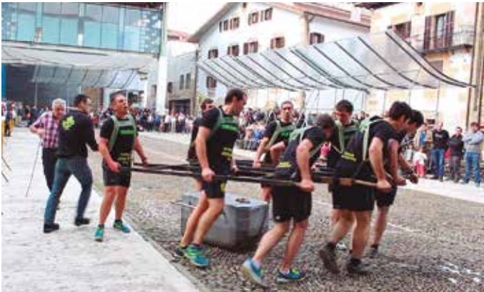
Heldu! Orioko giza-proba taldekoak, bete-betean.