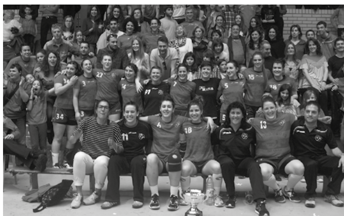
Zilarrezko Ohorezko Mailan jokatzeke eskubidea irabazi dute.

Haietatik seik txapeldun amaitu zituzten faseok. Taldeok: San Sebastian de los Reyes, Castro Urdiales, H. Sant Vicenç, A.M. Cargo Canyamelar C.H. Benetusser, CD. Agustinos eta C.B. Morro Ja-