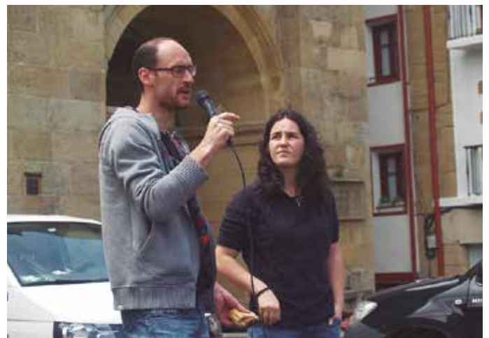
Bertsolariek eta trikitilariak alaitu zuten San Ixidro eguna.