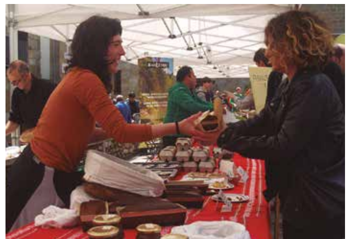
Herriko ekoizleek postu bana jartzeko aukera izan zuten.