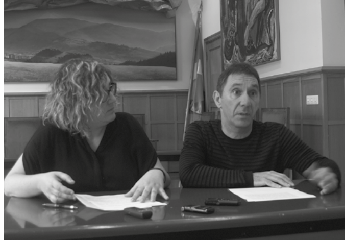
“Hondakinak erraustearen egokitasunari buruz inoiz ez zaigu galdetu herritarrei, eta Usurbilen saiatu izan garenean ere ez zaigu utzi”.

Espainiako Gobernuaren erabakia Udalak penaz hartu duela azaldu zuten, “herritarren aldetik 1.185 sinaduraren