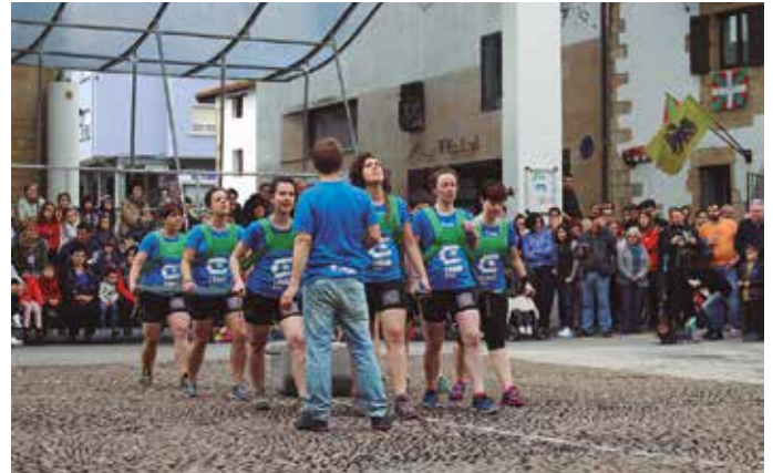
Astigarragako Emarri taldekoak, lanari ekiteko prest.