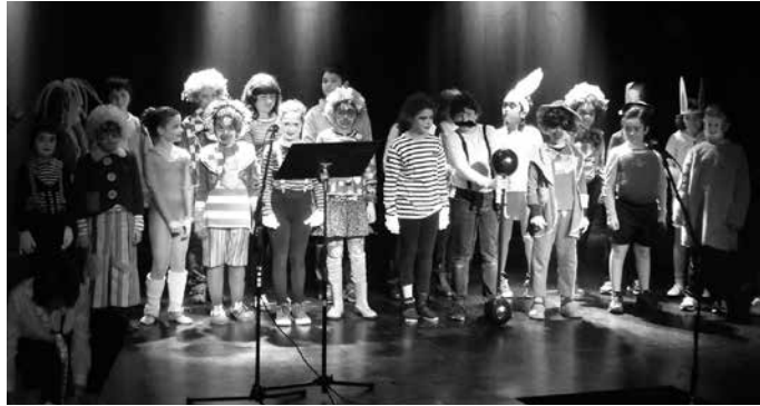
Matrikulazioa osatzeko epea ostiral honetan amaituko da.

Ordainagiria, zuen kontu korrante-ko zenbakia ( 20 digiturekin) eta argazki bat (ikasle berriak bakarrik) Zumarten entregatu eta inpresok sinatu.