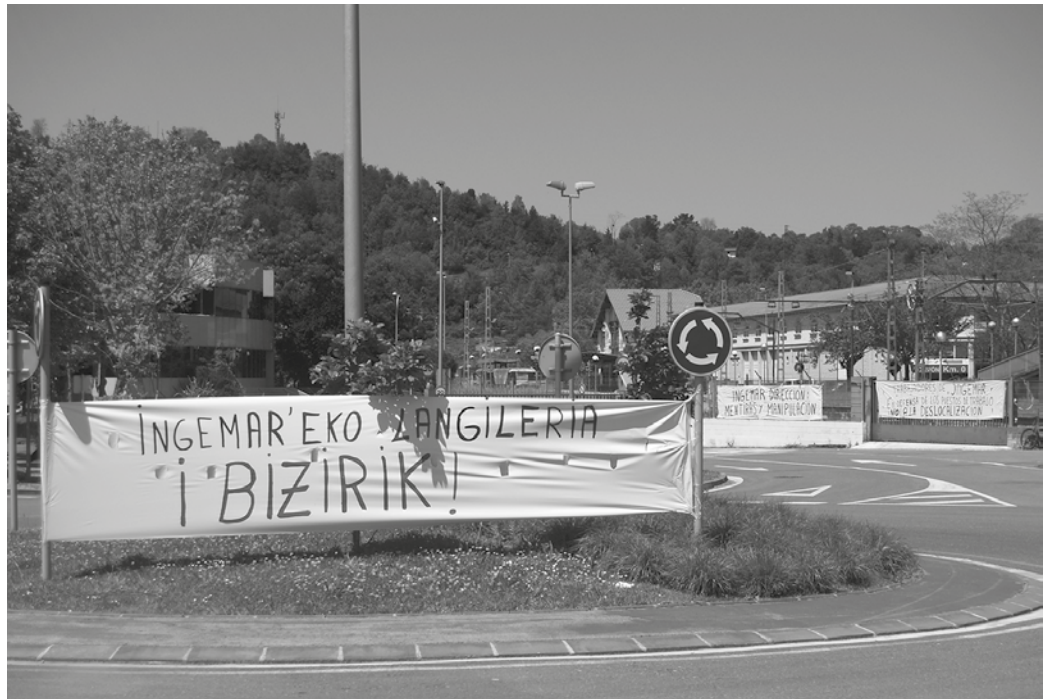
Egun Ingemarren lanean diren 77 langileak urte erdiz lanik gabe geratzeko arriskuan dira.

Galizian duten plantaren aldeko apustua egiten ari omen dira jabeak. Azaldu digutenez, orain arte aldi baterako lan enpresen bidez kontratatuak zeuden 30 langile baino gehiagori enpresak kontratua sina-