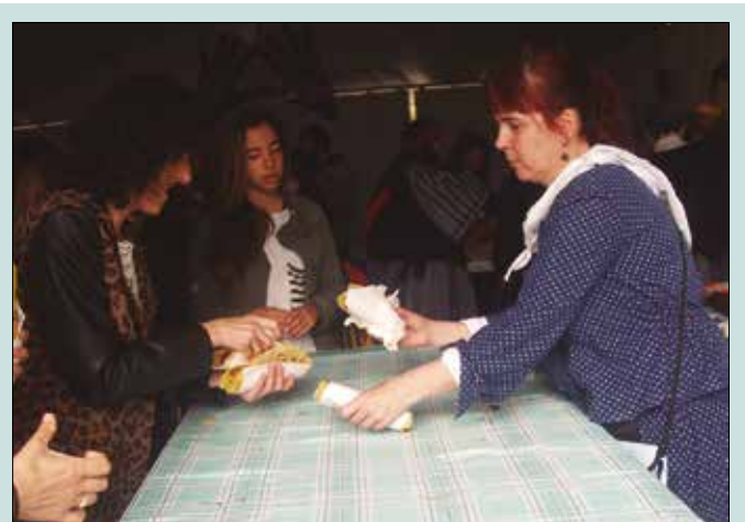
Iaz desegitear egon ondoren, indarberrituta itzuli dira talogileak 35. Sagardo Egunera. Lehengo kideekin eta taldera batu diren lagun berriekin, ez zitzairen lanik falta izan goizean zehar. Ilarak sortu ziren eguerdi partean.