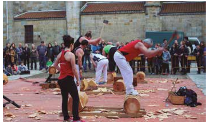
Aizkoran eta trontzan, binaka aritu ziren lehian.