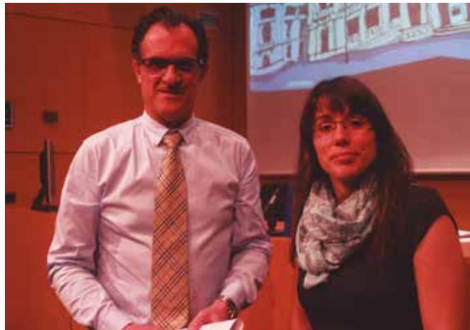
Maiatzaren 29ko giza-katean, “Onkologiko inguruan mediku asko batuko gara, eta osasun arloko langile mordoan”.

Hori da. Orduan nahiz eta 5 urtez ikertu, eta bakarrik arnas gaixotasuna, minbiziak eta beste malformazioak ez dituzte ikertuko, guk ditugun datuen arabera behintzat. Ez da denbora nahikoa, benetan ondorioak zeintzuk izango diren ikusteko. Eta gehien larritzen gaituena da ez dutela esan zer gertatuko den, benetan ikusiko balute to-