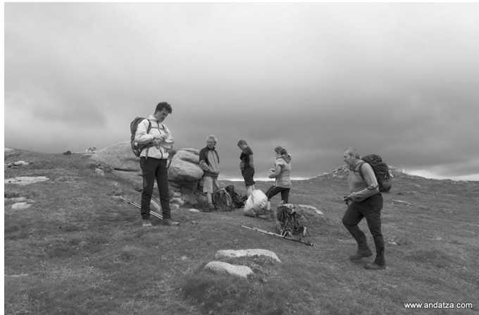
Senpereko irteeran, Andatzako hainbat kide.

-Otordua, ibilbidea amaitu-takoan egingo da. -Janaria norberak eraman behar du, edaria antolatzailleek. -Irteeran parte hartzeko derri-gorrezkoa da mendiko federatua izatea eta aseguru txartela indarrean edukitzea. "Federatu gabe dagoenari tramitea egingo diogu, hala nahi badu. Komeni da ahalik eta azkarren egitea". ■ Informazio gehiago: andatzamendizale.info