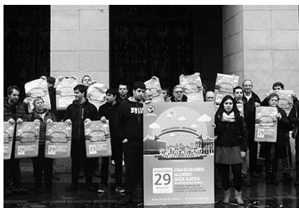
Giza-katea igandean egingo da, Onkologikotik Gipuzkoa Plazara. Izena eman behar da alde z aurretik.