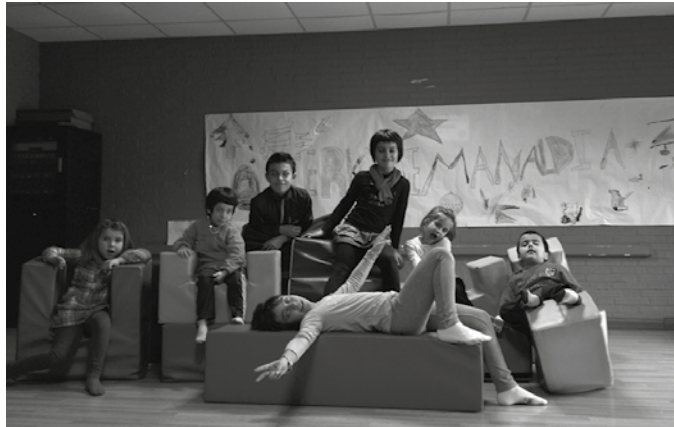
Ekainaren 5ean amaituko da izen-ematea (argazkia, artxibokoa).

Izen emateak itxita daude jada NOAA! K.E.-k eta