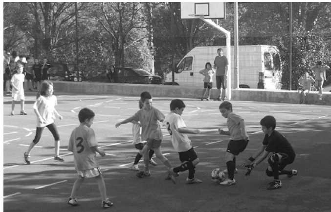
LHko lehen mailatik hasi eta DBH2 maila bitarteko ikasleei zuzendua dago.

Aurten Lehen Hezkuntzako lehen mailan ikasten ari denetik hasi, DBH 2an dabilzangana dago zuzendua kirol