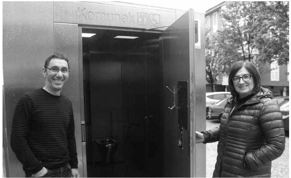
Askatasuna plaza ondoan dago komun publikoa.

Komun barrura sartzen denak, 15 minutu baino gehiago irauten baditu, atea