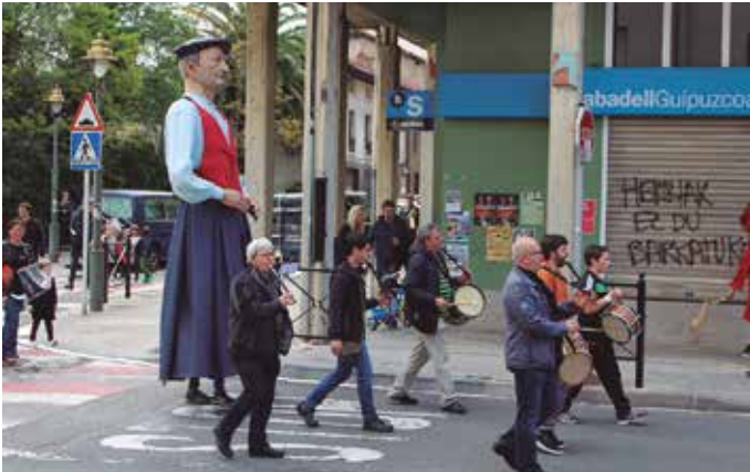
Erraldoi eta buruhandien kalejira, herriko txistularien erritmoan.