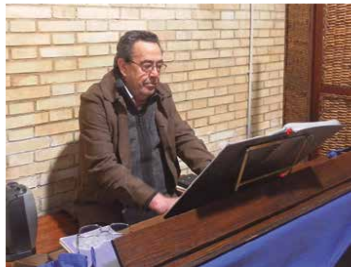
Aureskua Bittorianorentzat ere izan zen. Ezustean harrapatu zuten.