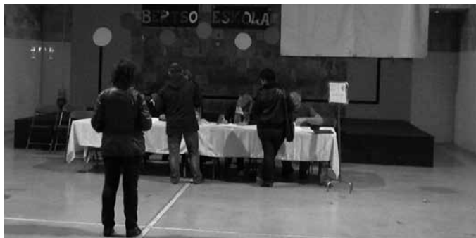
Posta bidez bozkatzeko eskatzeko epea ekainaren 16an itxiko da.

Ekainaren 26an Espainiako Gortearako hauteskundeak izango ditugu. Madrilgo Diputatuen Kongresu eta Senatu berria osatzeko bozketa egun horretan, Usurbilgo Udalak egokituko dituen 8 hauteslekuetarako mahaietan herritarrek egongo dira. Ohi bezala, azken osoko bilkuran zozketa bidez erabaki zen nortzuk osatuko dituzten hauteslekuotako mahaia. Gogoan izan, mahai bakoitza lehenakari batek eta bi bokalek osatu eta hauetako bakoitzak, ordezkoko beste 2 lagun izan behar dituela.