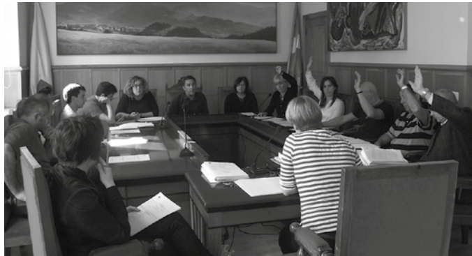
EAJ-PNVk aurkeztu zuen mozioak PSEren babesari jaso zuen. Hala ere, ez zen onartua izan.