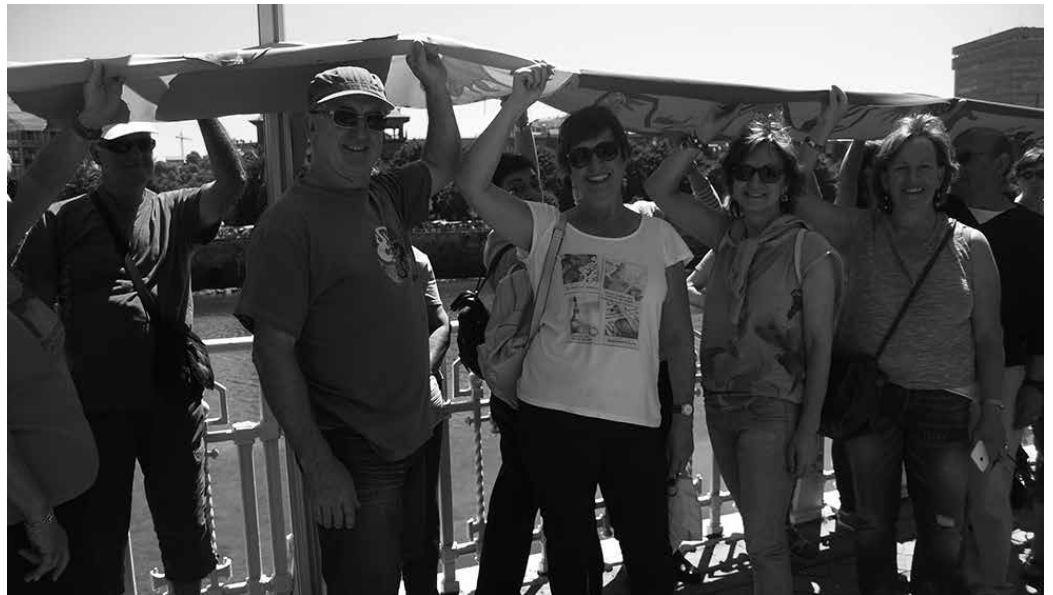
Udaberri honetan 34 udalerrietan egin dira herri galdeketa. Datorren urtean beste 60 udalerrietan egingo dira.

%95,2a (35.174 lagun) euskal estatuaren alde agertu da. Oro har, %30aren bueltakoa izan da parte hartzea. Hainbat udalerriatan %50eko muga gainditu du parte hartzeak, eta batzuetan %70etik gorakoa