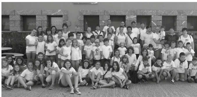
Iazkoan, Oilasko biltzaile lanetan ere gaztetxo asko animatu ziren. Bazkarirako txartelak ekainaren 15etik 21era egongo dira Kaffan salgai.

Uztailaren 3rako antolatuko dute, iganderako honenbestez, Atxega jauregian. Bazkaritarako txartelak aurrez eskuratu behar dira, ekainaren 21a baino lehen, edota agortu aurretik, Artzabalgo Gure Pakea, Santueneko Gure Elkarte edo Agi-