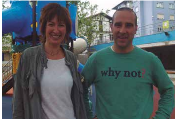
“Indar politikoei gai honekiko despolitizazio, gizarteratze eta birbideratze prozesuan lagundu dezaten eskatzen diegu”.

Indar politikoei bestalde, “gai honekiko despolitizazio, gizarteratze eta birbideratze prozesuan lagundu dezaten eskatzen diegu; ikerketa komisioren ekimena bertan behera utziz edota birplanteatuz eta ezta-