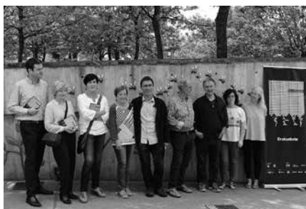
Aurreko ostiralean egin zen Artzeren in-guruko erakusketaren inaugurazio ekitaldia.

12:00-14:00. Arratsaldeaz asteazkenetik larunbatera: 18:00-20:00.