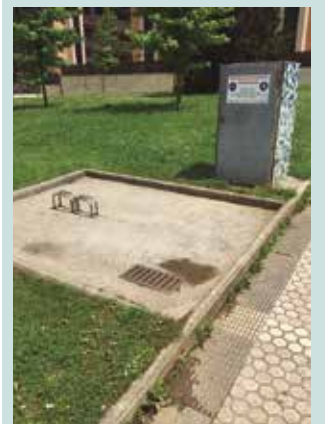
Errazkin eta Irisasi BTTkoek bidali digute argazkia. Antzekoa ipintzea eskatzen dute.

Usurbilen bizikleten garbigunea nahi eta behar dutela diote, udalerririk honetan halako zerbitzu bat faltan sumatzen dute eta. NOAUA!ra helarazi digute eskaera hau, Errazkin eta Irisasi BTTkoek. "Herrirako beharrezkoa ikusten dugu", adierazi digute.