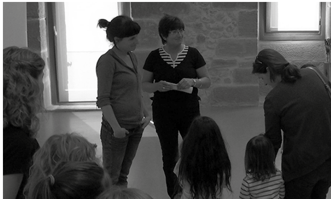
Usurbilgo Udalak babesten du ekimen hau. Argazkian, aurreko batean egin zen harrera ekitaldia.

M artxan da aurten ere “Oporrak Bakean” egitasmoa. “Helburua 9 eta 12 urte bitarteko haurrak saharar errefuxiatu kanpamentuetan bizi duten egoera gatazkatsutik urrunduz, beste errealitate bat ezagutzeko aukera ematea da eta bide batez, desertuan udako bi hilabete horietan (uztaila eta abuztua) pairatzen den tenperatura altuetatik babestea”, ohartzarazi dute elkartasun ekimenarekin bat egin duen Usurbilgo Udaletik. Azken lau urteetan babestu du egitasmoa Udalak. Tarte horretan, bi haur saharar izan dira oporretan Usurbilgo familiek harreran hartuta.