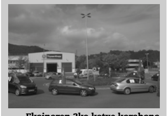
Ekainaren 3ko kotxe karabana Ingemarretik abiatu zen.

Prekarietatearen aurka, lana eta aberastasuna banatzearen alde LAB sindikatuak deituriko Borroka Astearen baitan, eskualdeetan kotxe karabana antolatu zituzten ekainaren 3an. Buruntzaldean kinka larrian diren bi lantegi lotu zituen; Usurbilgo Ingemar eta Adunako Unipapel. Atallutik abiatu ziren ekimenaren baitan, Ingemar aurreko biribilguneari hainbat itzuli eman zizkieten, jada greba mugagabearen diren langileei elkartasuna adieraziz. Ingemar eta Unipapel ez ixtea eskatu zuten. Honez gain, protesta ekimena, prekarietatearen aurkako astean egin zuten, 1.200 euroko soldata eta 35 orduko lan astea izateko aldarrie ere tartea egin zieten. Diru-gosearen aurrean, langileen osasunaren defentsan irten ziren LAB-eko kideak errepidera.