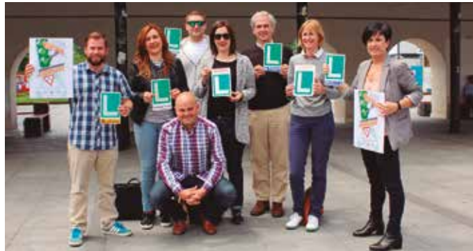
400 euro irabazi daitezke, teorikoaren gastua ordaintzeko adinako saria.

B uruntzaldeko udalek eta autoeskolek zati teorikoa prestatu eta azterketa egiteko euskara hautatzeko gonbita luzatu die beste behin, gidabaimena ateratzeko asmotan direnei. Euskara hautatzeak saria baitu eskualde honetan. Zati teorikoaren gastua ordaintzeko adinako dirusaria; 400 euro ere irabazi ditzakezue.