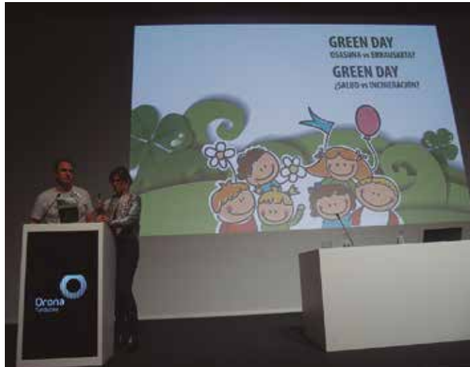
GuraSOSek maiatzaren 21ean Orona Ideon antolatu zituen jardunaldietan datu deigarriak plazaratu ziren: “20 sustantzia kaltegarri inguru egongo lirarteke kontrolatu gabe, horiek sortzen dituzten patologiekin”.