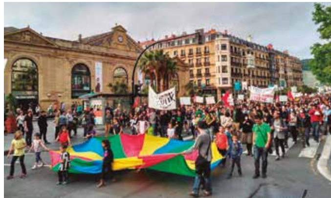
Maiatzaren 29ko giza katearen ondoren gorpuztu zen Gipuzkoa Zutik ekimena.

Asanbladak, elkarretaratzea, hitzaldi, emanaldi eta deialdien gunea izan da. Biltzeko, hitz egiteko eta erabakiak modu asanblearioan hartzeko tokia. Gipuzkoa Zutik hartzen ari den indarraren adierazgarri, aurreko larunbatean eginiko manifestazioa. 2.000 lagun bildu zituen mobilizazio koloretsuak.