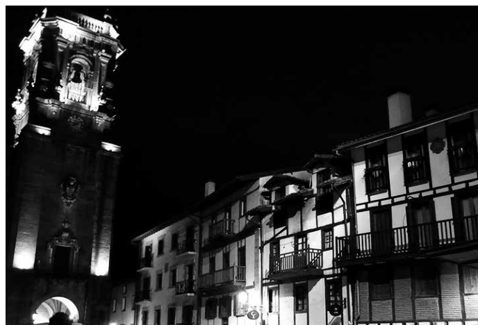
2017an uztailaren 2a igandearekin egokituz, Usurbilgo jai eguna ekainaren 30a izango da, ostiralarekin.

2017ko Usurbilgo jai egutegirako aldaketa proposamen hau, maiatzaren 31ko osoko ohiko bilkuran aurkeztu zuen EHBilduk. Aho batez onartu zuen udalbatzak. Aldaketa honek, 2017ko egutegiari eragingo dio soilik.