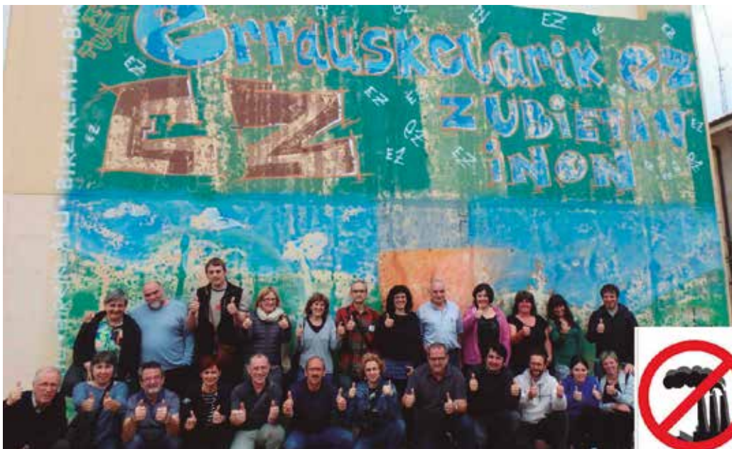
Erraustegiaren aurkako muralaren parean ondoko argazkia atera zuten.

Erraustegiaren Aurkako Mugimenduko kideak Zubietan bilduta, ondoko argazkia atera zuten larunbatean.