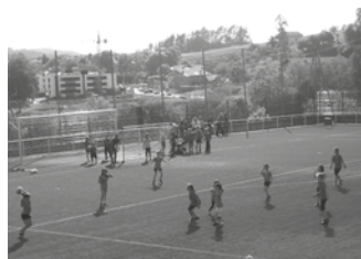
Nesken taldeak osatzeko entrenamenduak Haranen egingo dira datorren astean, ekainaren 17 ostirala, 17:30ean hasita.

2016-17 denboraldirako prestaketa lanetan da Usurbil F.T. Batetik nesken taldeak osatu nahi ditu, kadete, jubenil eta erregional mailan. Alebinen taldea ere osatu nahi du. Animatzen zareten guztiokin, entrenamendu saiook antolatu dituzte asteotarako Haranen: