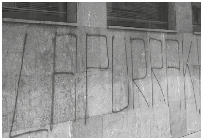
Ekainaren 2an egin ziren bankuetxeen aurkako hainbat ekintza.

H erriko zenbait banketxeen aurkako sabotajea egin zuen ekainaren 2an. Zenbait banketxe atari kaltetuta esnatu ziren. Rural Kutxan esaterako "Lapurrak!" pintada egin zieten, kutzazaina kaltetzearekin batera. Kutxabank atariko kutzazaina ere kaltetu zuten, baita BBVA banketxeko sarbidea ere.