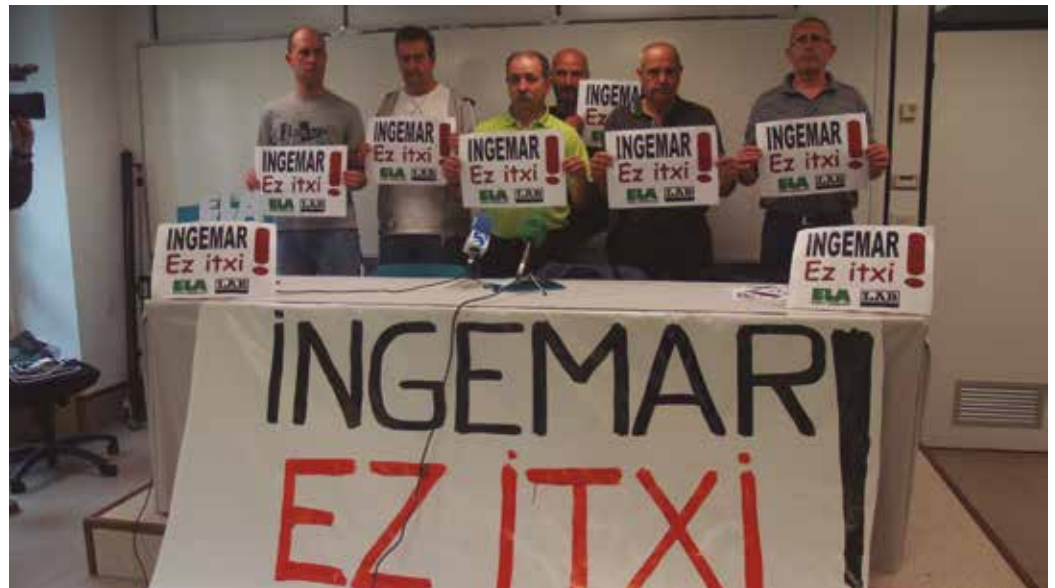
Egoera azaltzeko, Ingemarreko langileek agerraldia egin zuten aurreko astean.

Iragarri genizuen etorkizuna kinka larrian duela Ingemarrek. Enplegu Erregulazio Espediente (EEE) berri baten atarian zirela. Maiatzaren 23an izan zuten batzarrean, 6 hilabetez langileak etxera bidal ditzakeen erabakia jarri zuen mahai gainean enpresako zuzendaritzak. Kotsultetarako 15 eguneko epea izan dute gero. Baina negoziazioek ez dute lan gatazka konpondu. Ekainaren 6tik aurrera enpresak bere eskura du, EEEa aplikatzea. Hala egingo balu, urte erdiz lanik gabe geratuko lirakeke, egun Atalluko lantegian lanean diharduten 77 bat langileak.