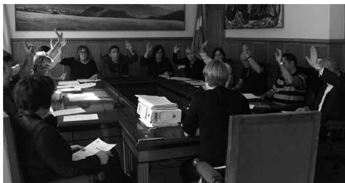
Udal kirol zerbitzuei loturiko zerga ordenantzan ere aldaketak egongo dira.

Honez gain, hilerri zaharra husteko bidean da. Bertan diren gorpuak ateratzeko ordain-