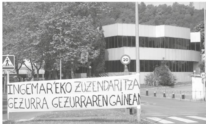
Udal gobernuaren ustez, “aukerak badaude, baina konpromisoa eta plan serioa behar da horiek martxan jartzeko”.

langileek pairatu behar izan dituzte egoera larriaren ondorioak, zinez latzak eta mingarriak.