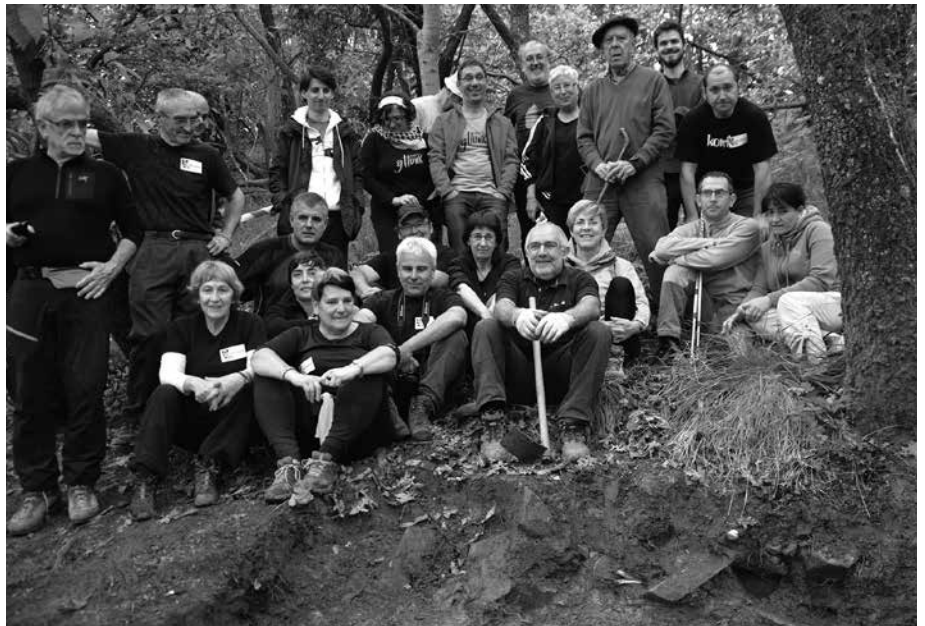
Argazkian, Islada Ezkutatuak taldeko kideak, Usurbil eta Lasarte-Oriako udal ordezkariekin batera.