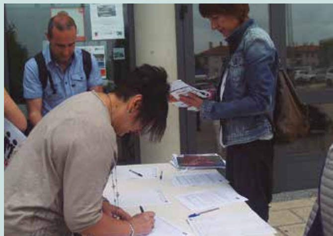
Ikastolaren Egunean sinadurak biltzen aritu ziren.

Aste hasierarako jada 6.700 atxikimendutik gora bilduak zituen GuraSOSen manifestuak. Larunbatean ospatu zen Ikastola Egunean Oiarde Kiroldegi atarian ikusi genituen, Haur Hezkuntzaren jaialdira gerturatu zirenen artean sinadura gehiago jaso zituzten. Gogoan izan, noiznahi bat egin dezakezue erraustegia geratzeko manifestuarekin, gurasos.org atarian sartuta.