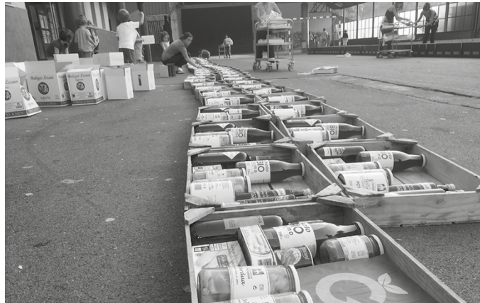
Guztira 97 loteren eskaera egin da Usurbilen. NOAUA!tik pasa behar da orain eskatutakoa jasotzera.

A rakastatsua suertatu da Errigoraren azken kanpaina. Nafarroa hegoaldeko tokiko produktuen salmenta sustatu eta euskalgintza bultzatzeko kontserba loteen azken ekimenak, egitasmo honekiko atxikimendu kopurua gorantz doala argi erakusten du. Pentsa, eskaerak egiteko epearen baitan, NOAUA! Kultur Elkartean, Udarregi Ikastolan eta Internet bidez, guztira 97 kontserba lote eskatu dira.