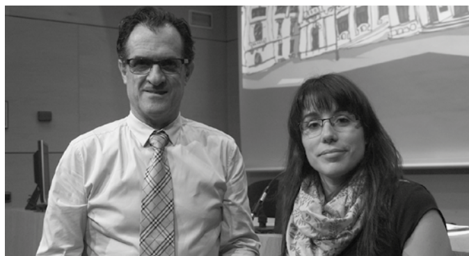
“Gurekin batu daitezela eta entzun ditzatela azken urteetan argitalpen zientifikoetan argitaratu diren datuak”, hori eskatzen dute OEITko kideek.

E z da eskaera plazaratzen duten lehen aldia. Baina hilabeteak pasa eta erantzunik ez dute jaso. Ez dute ulertzen zergatia, baina berriz saiatu nahi dute. “OEIT-tik, berriro ere, aldebakartasunez erraustegia eraikitzeke erabakia hartu duten politikariei bilera eskatu nahi diegu”, adierazi dute OEIT taldetik.