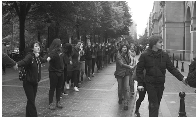
Aurreko astean Donostiako Gipuzkoa plazan egin zuten giza-katean, bizitzaren alde eta erraustegiaren aurkako oihuak entzun ziren.

G uztion osasuna arriskuan jar dezakeen erraustegia sustatu asmo duen Aldundiko eta ondoko Kutxabank egoitza inguratu zuten bizitza babesteko aldarriek, Gipuzkoa Zutik-ek aurreko ostiralean antolatu zuen giza-kate luzean. Hain luzea, bi kate lerro ere osatzera heldu zirela. Bulebarreko asanblada jendetsuarekin borobildu zuten, ekimenean zehar etenik gabe bizitzaren alde eta erraustegiaren aurkako oihuak entzun ziren mobilizazioa.