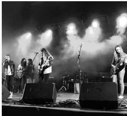
Kontzertua Askatasuna plazan izango da. Biltzen den dirua Zarauzko sorosleek osaturiko Basque Lifeguards taldearentzat izango da.

18:00 Pop-Rock-Folk taldeen emanaldia Askatasuna plazan.