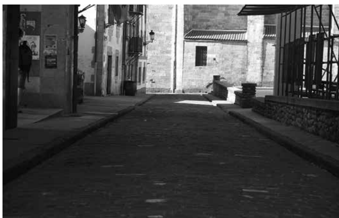
Lanak zatika egingo dira. Beraz, kalea ez da osorik itxita izango inoiz.

Kontu handiz egingo dituzte lanok. “Harriaren alineazioa mantendu nahi da. Harri bakoi-