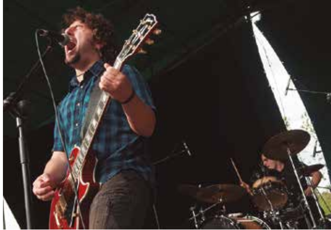
Lehen kontzertua ostiral honetan eskainiko dute. Gaueko 23:00etan, Zapparra taldekoekin batera. Sarrera, doan.

Topiko bat den arren, gu ez gara oso etiketa zaleak. Batez ere, ez dakigulako jartzen! Kar kar kar! Hasiera batean guk pop-rocka esaten genion baina behin baino gehiagotan "Izebergek nun du ba popa?"