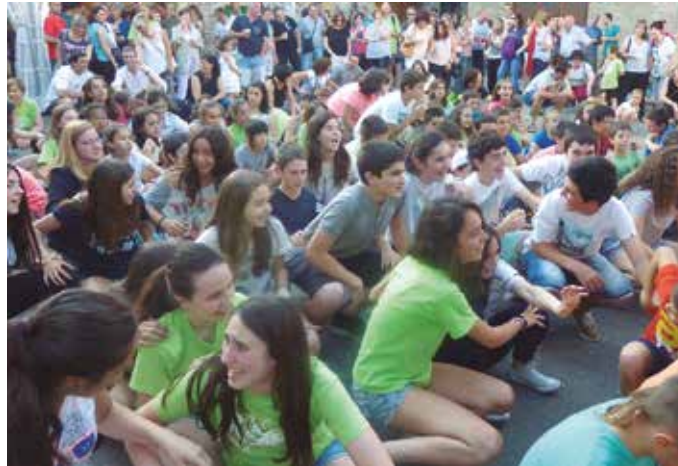
San Juan bezperan hasiko dira festak. Oilasko biltzaileen eguna larunbatarekin egokitu da aurten. Igandean, Umeen Egunarekin amaituko dira festak.

23:30etan: Kontzertuak: Floxbin, Eratu, Erokomeri taldeekin.