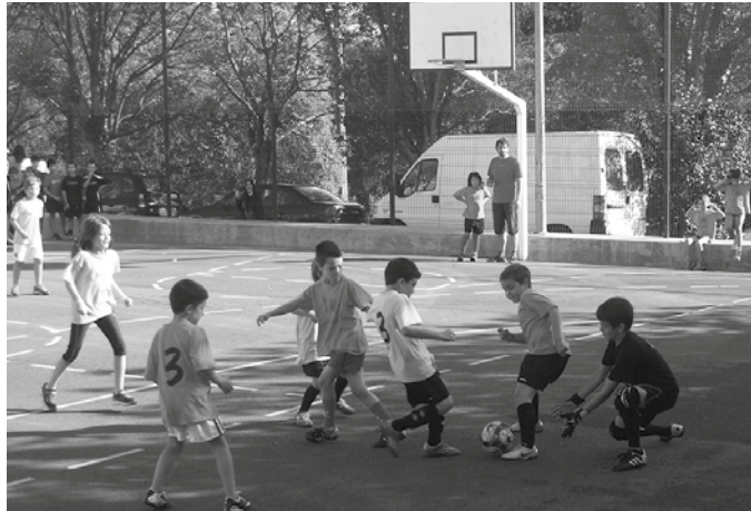
Izen-ematea ekainaren 3an amaitu zen. Oraindik asko falta denez, aurrerago emango dituzte partiden inguruko xehetasunak.

I az Kilometroak jaialdia zela eta, ekainera aurreratu bazuten ere, aurtengo ediziotik hasita, Usurbil Cup ekimena etorkizunean irailean antolatze-ko asmoa du Usurbil F.T.-k. Datorren ediziorako izen emateko epea ekainaren 3an itxi zuten. Lehen Hezkuntzako lehen mailan ikasten ari denetik hasi eta DBH 2an dabiltzanengana dago zuzendua kirol ekimena. Antolatzaileek aurrerago emango dituzte Usurbil Cup-i buruzko xehetasun gehiago.