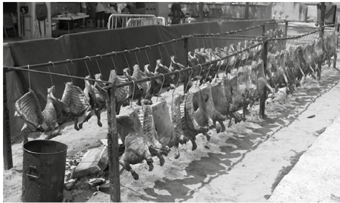
Txartelak mugatuak izango dira. Beraz, alde aurretik errostea komeni. Bordatxon, Aitzagan eta Txiribogan daude salgai.

Herriko jaien baitan, uztailaren 2an ospatuko den kantuzikiro janerako txartelak salgai jarri dituzte jada, Bordatxon, Aitzagan eta Txiribogan, 25 eurotan. Ikasle eta langabetuek 15 eurotan eskuratu ahalko dituzte. “Txartel mugatuak! Ez izan azkena erosten!” ohartarazi dute antolatzaileek. Usurbilgo Kantu Taldeak eta Kuxkuxtu txarangak girotuko duten herri bazkaria, uztailaren 2an, 14:00etan Askatasuna plazan izango da.