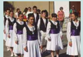
Larunbatean, arratsaldeko 17:00etan hasiko da dantza saioa.

Orbeldik, herriko dantza taldeak girotuko du oilasko biltzaileen bazkalostea.