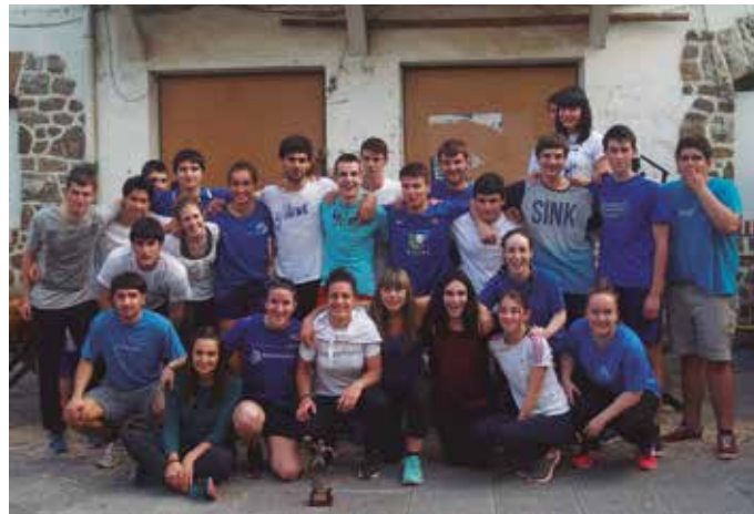
Goizean goiz abiatuko dira oilasko biltzaileak. Eta arratsaldean, auzotarren arteko jokoak. Egun borobila izango da larunbatekoa.

Bazkarirako txartelak Kaffa kafetegian egongo dira salgai. Baina kontuan izan ekainaren 22a baino lehen erosi behar direla oilasko biltzaileen bazkarirako txartelak.