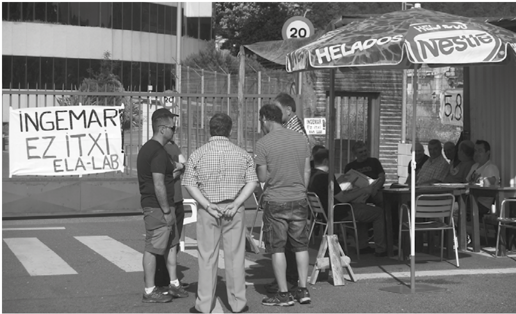
Mugarik gabeko lan uztea hasi zuten ekainaren 6an, lan gatazkari aterabideren bat bilatzeko ahaleginean.

A tarik hesiak alderik alde ixten du sarbidea. Lantegia geldirik dago, isilik. Eta enpresa atarian, kalean, "Ingemar ez itxi" dioen