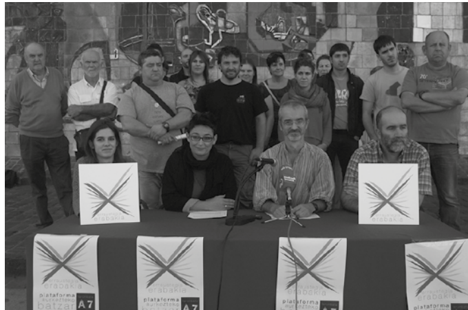
Larunbatean goizeko 11:00etan batuko dira Udarregi ikastolako eraikin gorrian. Batzar horretan erabakiko dute galdeketa antolatu ala ez.

Erabili duten argumentua oso ahula da. Ezin da esan Udal batek bere eskumen bat mankomunitate bati uzteagatik, eskumen hori galdu duenik. Udalak