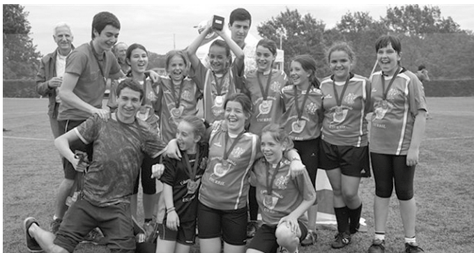
Eskola Kiroleko nesken taldeak Gipuzkoako Liga irabazi du.

Gipuzkoako Liga irabazi dute Udarregi Ikastolako neskek, igandean Realaren Fundazio Festan, Zubietako zelaian, Arrasateko Leintz eskolaren aurkako neurketan, 2-1 emaitzarekin nagusitu ostean. Usurbildarren bi golak Uxue