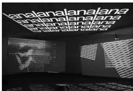
Donostian eta Miarritzen egon da ikusgai. Orain Potxoenean topatuko duzue.

■ Laguntzailea: Gipuzkoako Foru Aldundia.