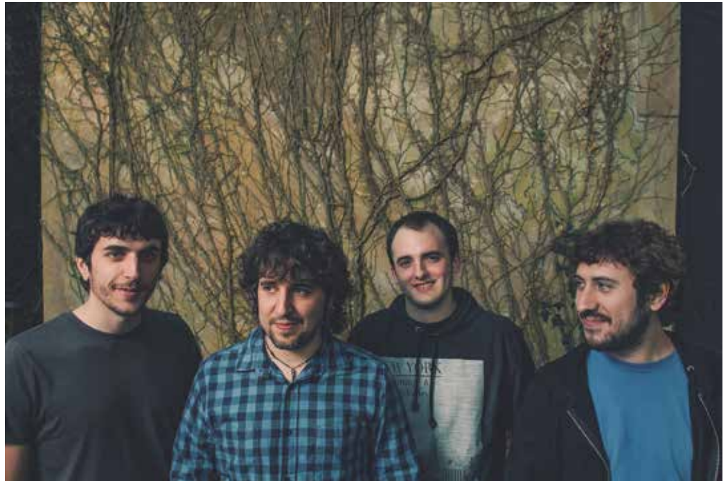
Urdaia grabatu dute diskoa, Haritz Harreguyren Higain estudioan.

N. Haritz Harreguyren estudioan aritu zarete. Nolako izan da grabazio prozesua? Haritzek kantuei egin dien ekarpenarekin pozik zaudete? Haritz laguna dugu lehenagotik eta honek grabazio-prozesuan naturaltasunez eta konfidantzaz jokatzeko lagundu digu. Momentu gogorak izan ditugu noski, baina orokorrean