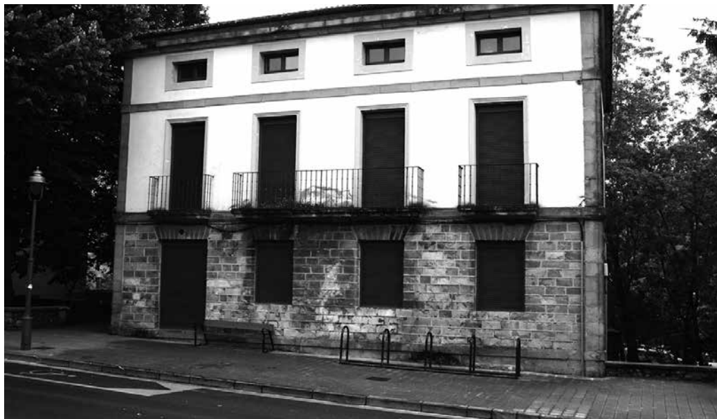
Lau arkitektura taldeei proposamenak aurkeztea eskatu die Udalak.

Lau arkitektura taldeei proposamenak aurkeztea eskatu die Udalak. Proposamenok uztailera hasierarako mahai gainean izango ditu. Horietako bat aukeratu beharko dute gero. Urte amaie-