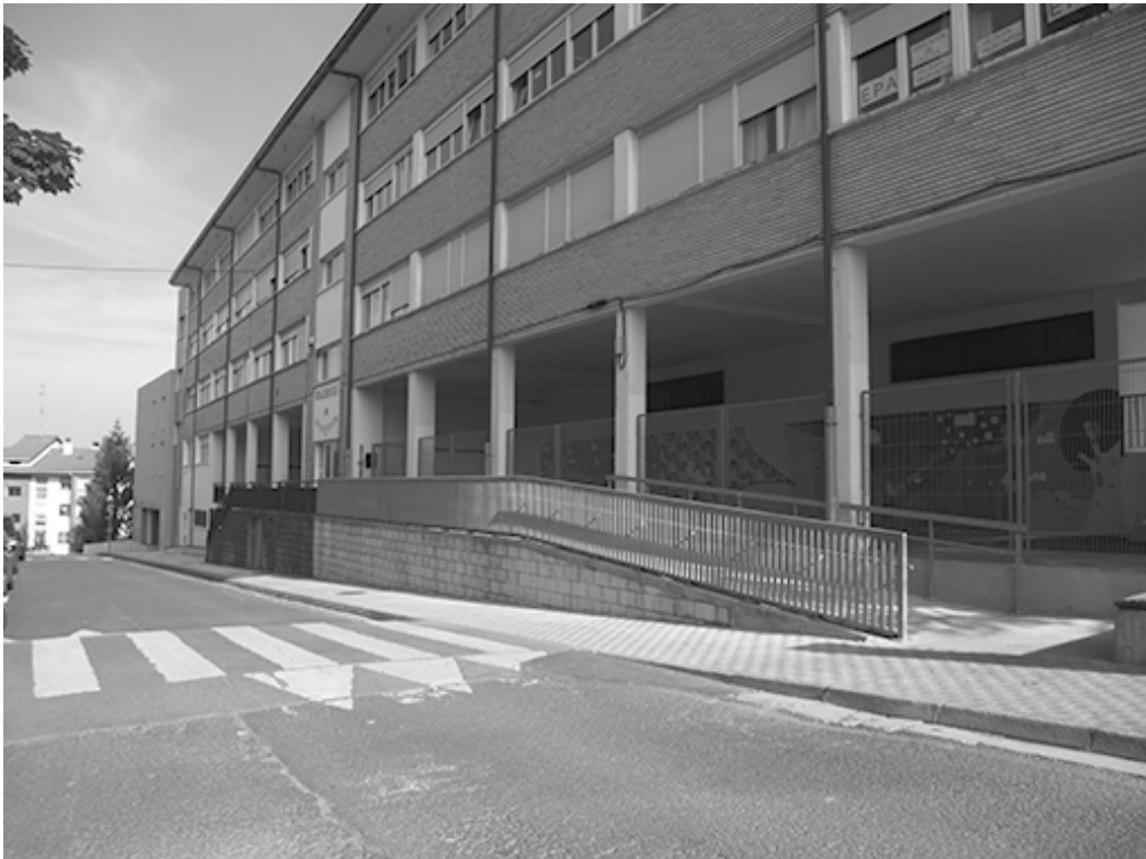
Agerialde atzealdeko patiotik aldapan behera jaisteko baranda babestuko dute, zebrabidea eta aparkalekuak egokitu. Errepideari ere eragingo diote berrikuntzek. Ikasleen jolasgaraian, eta ikastolara sartu eta ateratzeko orduetan eremu hau autoen joan etorrirako itxita geratuko da.