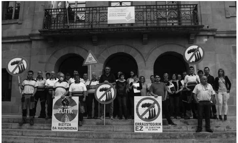
Udaleko Langileen Batzordeak bat egin du Donostian abiarazi den ekimenarekin.

Gu ere, erraustegiaren kontra gaude, bizitzaren alde. Egungo ereduak herri-tarren %99 zanpatzen du; ezinbestekoa da %1a bakarrik asebetetzen duen eredu hau iraultzea. Beste eredu sozial bat behar dugu: justuagoa, ama lurra errespetuz hartuko duena, osasungarriagoa, partehartzaileagoa, solidarioa-