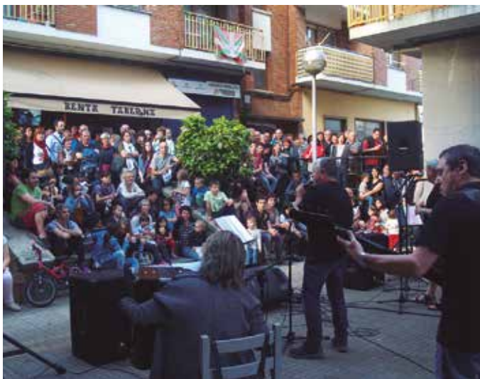
The Hastelen's taldekoekin lagun, senide eta herritarrekin agurtu nahi izan zuten ikasturtea. Egunotan, Zumarteko gainerako taldeak egiten ari diren moduan.

Kontzertuetarako eskenatoki berria deskubritu diguten taldekoen poteo taberna atarian, Benta aurreko plazatxoan. Lagun, senide eta herritarrekin agurtu nahi izan zuten ikasturtea, egunotan, Zumarteko gainerako taldeak egiten ari diren moduan.