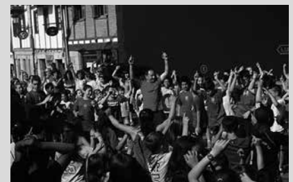
Partehartu nahi duenak email hau du eskura: santixabelak.umeen.eguna@gmail.com

Guraso talde batek goizetik arratsaldera antolatu duen egitarau zabalaren baitan, ginkanan parte hartzea animatzen dituzte haurrak. "Ginkanan izena eman ez duten haurrek (LH-ko ikasleei bideratua) aukera izango dute bertan parte hartzeko ekainaren 24a arte, azken egun hau barne. Horretarako eskaera bidali beharko dute norbere izen abizenak eta ikasten ari den maila azalduz. Eskaera bidali helbide honetara: santixabelak.umeen.eguna@gmail.com ", ohartarazi dute antolatzaileek.