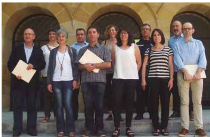
Aurreko astean sinatu zen protokoloa.

Emakundek diruz lagundu duen protokoloak finkatuak dituen jarraibideen arabera joka-