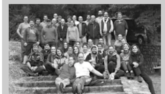
Asteartean joango dira lehen txandako gazteak.

Asteartean doaz lehen txandakoak, uztailearen 19ra arte egongo dira. Eta egun horretan helduko dira bigarren txandakoak, hilaren 29ra arte egongo dira Errioxa aldean. Kanpaldia abuztuko lehen asteburuan desmuntatuko dute. “Desmuntaketa eguna abuztuak 7an dugu! Oraindik izen eman ez baduzu gogoratu ziortzage@gmail.com bidez egin dezakezula. Eskerririk asko!”, ohartarazi dute Ziortzakoek.