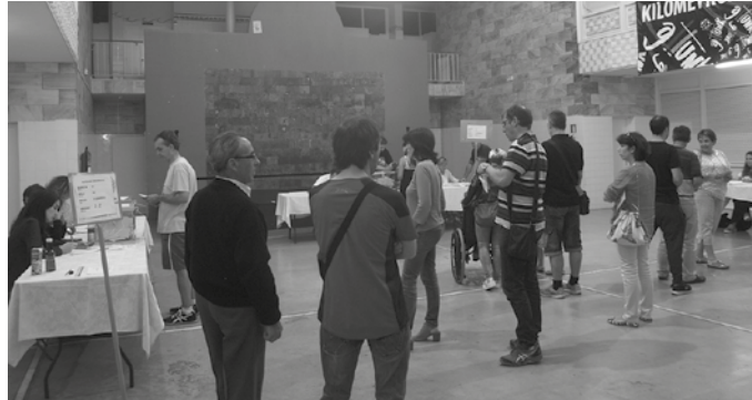
Abstentzioak ere gora egin zuen ekainaren 26ko hauteskundeetan.

E HBildu nagusitu da Usurbilen, Espainiako Gorteetarako hauteskundeetan. Bozken %23,71 eskuratu, guztira 1.109 herritarrek babestu dute koalizioaren hautagai zerrenda. Atzetik, 300 bat bozketara geratu da Ahal Dugu; 868 bozka (%18,56) eta hirugarren EAJ. Jeltzaleek 550 bozka (%11,76) jaso dituzte guztira.