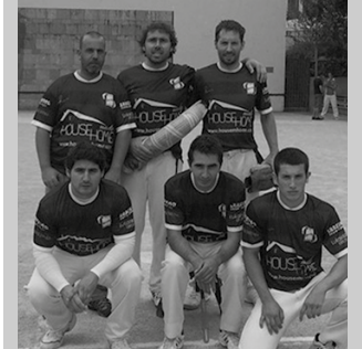
Baigorriko Zarrer Segi taldearen aurka galdu zuten 13-3.

Euskal Herriko Errebote Txapelketako finalerdia jokatu zuen Zubietak igandean Hasparrenen, Baigorriko Zarrer Segi taldekoen aurka. 13-3 galdu zuten zubietarrek.