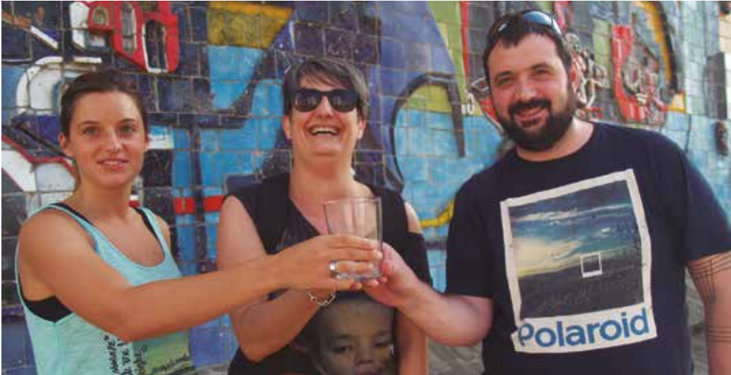
Edalontzi berrerabilgarria, tabernariekin batera adostutakoa, edalontzi garden eta ikurrik gabekoa izango da.

P lastikozko edalontzi berria, gardena, ikurrik gabekoa, herritar askoren eskutan ikusiko dugu jaietan. Txosnetan trago bat eskatuz gero, edaria edalontzi honetan zerbitzatuko digute. Jende asko ibiltzen den orduetan baita tabernetan ere. Bestela, edarrietan beirazkoak lehenetsiko dituzte. Hala adostu dute, Usurbilgo tabernariak, Hurbilago Elkarteak, Usurbilgo Udalak eta txosnaguneko antolatzaileek. Kilometroak jaialdirako eta gerora, jai hauei begira eginitako lanketa eta elkarlanaren