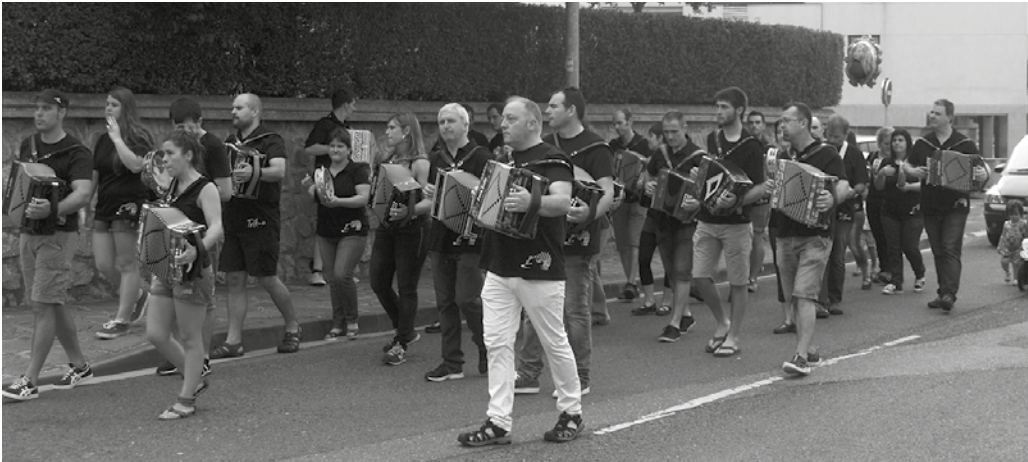
Iaz bezala, Triku taldekoak Santixabel egunean arituko dira kalejiran.