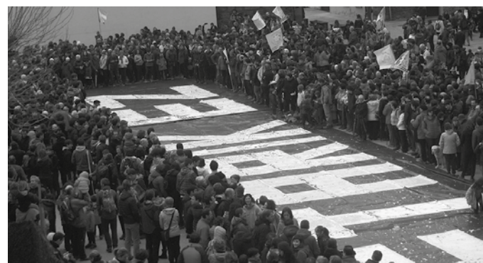
Ostegun honetan egingo da. 18:30ean abiatuko dira txosnagunetik.

16 urtetik gorako herritarrek parte hartu ahalgo dute. Galdetuko dena: "Erraustegia egitea nahi al duzu?"