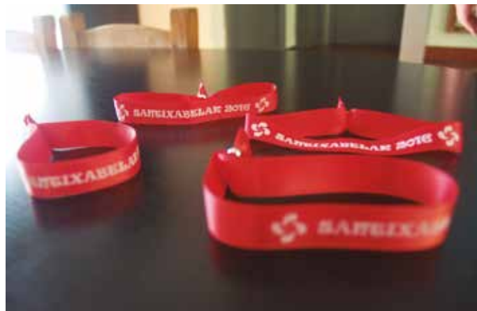
Batuko den dirua konpartsako materiala eta erraldoi zein buruhandien mantentze lanetarako erabiliko da.

Kolore gorrikoak, “Santixabelak 2016” diotenak. Konpartsa izena omenduz, lauburu bat daramate. Herriko saltoki eta tabernetan eskuratu ahalko dituzue jaiak amaitu