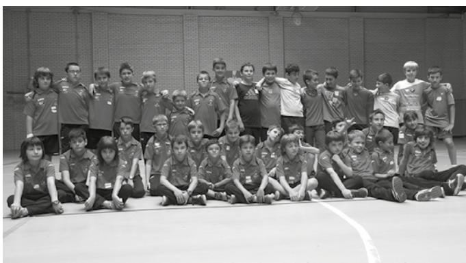
LH-koen jolas eta bazkariaren ondoren, klubeko kideen afaria egin zuten ekainaren 25ean.