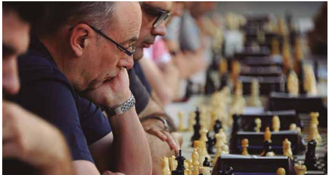
Arratsaldeko 16:00etan hasiko dira partidak Olanoenean eta, euria egingo balu, Askatasuna plazako aterpean.

Jolaserako proposamen berri bat jaiotan; xakea. Mahai joko ezaguna, plazara aterako dute formatu erraldoian, igande arratsaldeko 16:00etan. Xakezaleok gerturatu beraz, eguraldiaren arabera, Askatasuna plazako estalpean edo Potxoenea ondoko Olanoeneko plazan ospatuko den ekimenera. “Herrian seguru afizioa badela baina ez dakigu, ez baitago xake talderik. Horregatik, herrian ze afizio dagoen ikusteko animatu eta etorri jolastera”, luzatu dute gonbita.