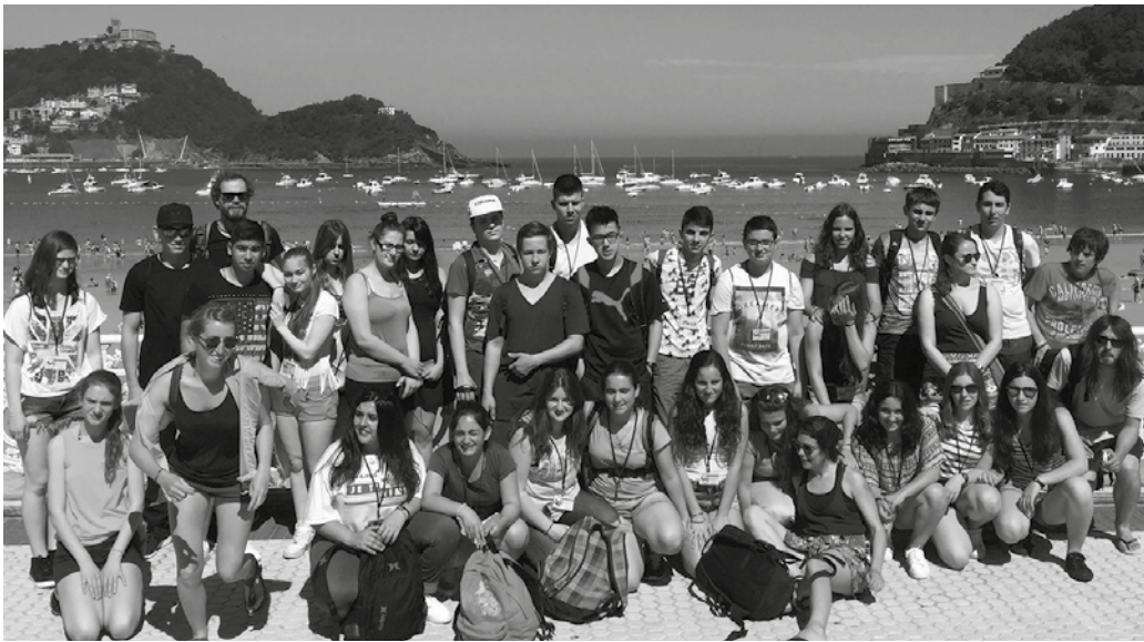
Foru Aldundiak sustaturiko "Instant1ean Europa!" izeneko ekimenean parte hartzen ari da Usurbilgo Gaztelekua.

Gipuzkoako Foru Aldundiak sustaturiko "Instant1ean Europa!" izeneko ekimenean parte hartzen ari da Usurbilgo Gaztelekua. "Erasmus+ programak eskaintzen dituen aukerak aprobetxatuz, herritartasun digitala nazioarteko mailan landu nahi da, beste herrialde bateko gazteekin batera".