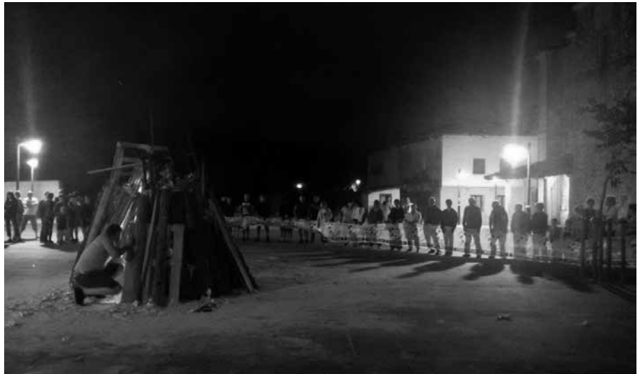
Zubietan, errausketaren aurkako pankarta asko ikus zitezkeen.

erraustegiaren aurkako gaua ere izan zela adierazten duten adibide batzuk baino ez dira honakoak. Gipuzkoa Zu-