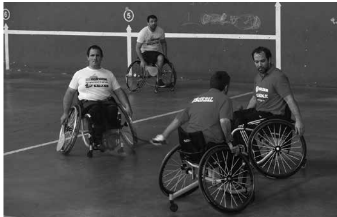
Gipuzkoako Kirol Egokituen Federaziokoek egiten duten lana ikusteko aukera izan zen.

Emakumezko kirolarien arteko lehia ere izan zen. Eta kirol egokituko erakustaldi bikaina. Eremu honetan Gipuzkoako