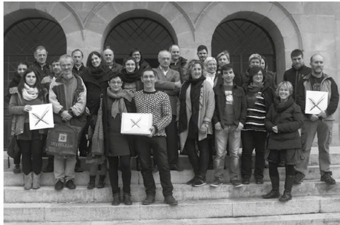
Larunbat honetan, eguerdiko 13:00ean agerraldia egingo dute udaletxe aurreko plazan.

Txosnagunea erraustegiaren aurkako ekimenetara batu da. Jaien hasiera ofizialaren atarian, manifestazioa deitu dute. Ostegun honetan, 18:30ean abiatuko da txosnagunetik. Herri erdigunea zeharkatuko du.