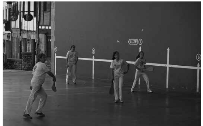
Txapelketako lehen lau bikoteek saria jaso zuten. Emakumezkoek ere pala partida jokatu zuten.