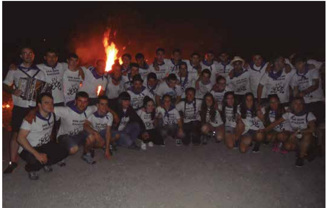
Gazte asko batu ziren San Joan eskearen irteeran. Eta gainontzeko ekitaldietan ere jende ugari ibili da Kalezarren.