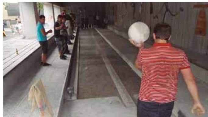
Talde bat osatu nahi da, eta ez jaietarako bakarrik.

Hitzordu bikoitza aurtengo jaietan, Askatasuna plazako bolatokian. Gipuzkoako Bola Federazioak helduez gain, haur eta gazteentzako txapelketa antolatu du larunbat arratsalderako. Eskaera Udarregi Ikastolatik jaso zuten. Ikasleek interesa zutela eta jaietan ekimena antolatzea erabaki dute. Ia taldea osatzen den, ez bakarrik jaietarako. Urtean zehar ere boloetan aritzeko. Proba modukoa izango da, parte hartzera deitzen dute antolatzaileek.