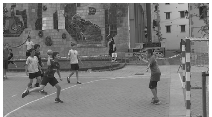
Elkarteko kideen arteko partidak jokatu zituzten, eta herri afari bat egin zuten ekainaren 25ean.