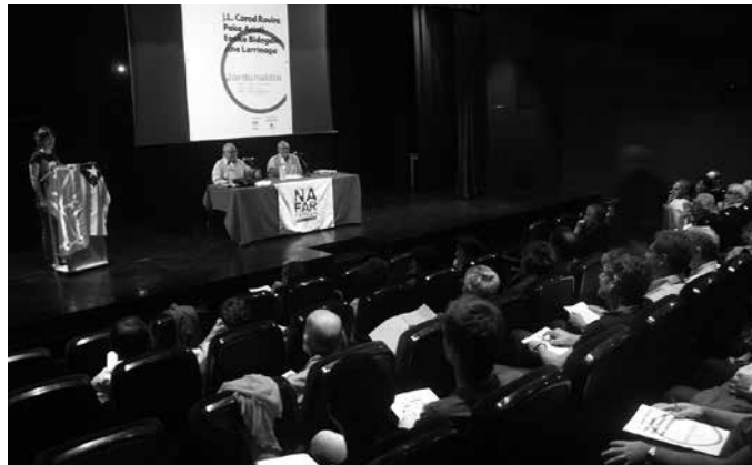
120 lagunek hartu zuten parte Nafartarrak taldeak antolaturiko jardunaldietan.

Urteotan jorratu duten independentziarantzko bidearen errepasso bat egin zuten. Hainbat datu argigarri eskaini zituen. Independentziari beldurra izatetik, beldurrarengandik independizatzera heldu direla, zapalketaren aurka manifesta-