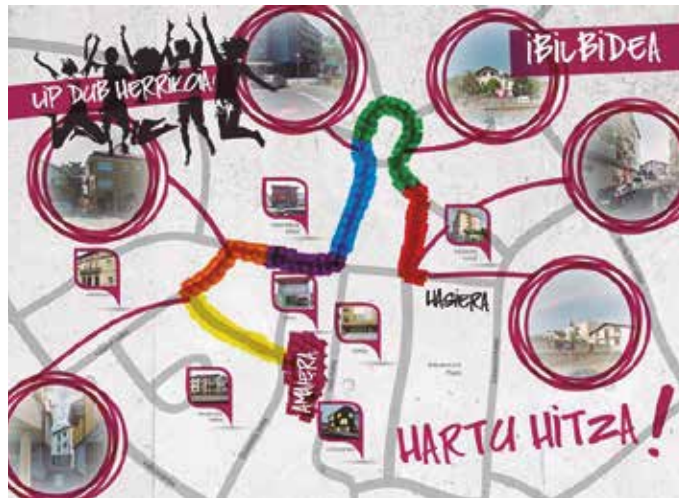
Goizeko 11:00etan kaxkoan elkartzeko deialdia egin dute antolatzaileek.

Gogoan izan hitzordua: igandean goizeko 11:00etan gertu-