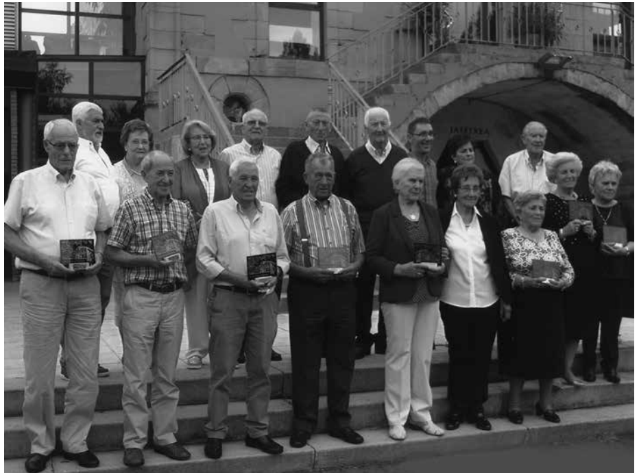
Urriaren 2an, Atxega jauregian batu ziren.