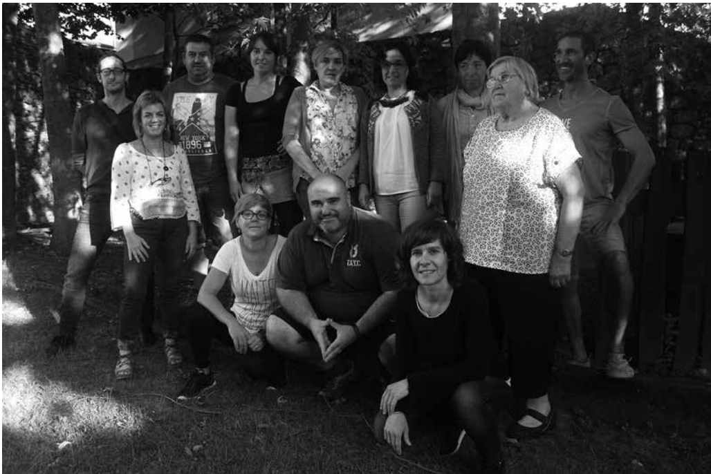
Urriaren 3an hasi zituzten klaseak Etumeta AEK Euskaltegian.

E uskalduntzeko ahaleginak ikasturte berria abiatu du Usurbilen. Urriaren 3an hasi zituzten klaseak Etumeta AEK euskaltegian. Hiru talde osatu dituzte oraingoan; goizez, EGA prestatzeko matrikulatu direnekin. Arratsaldean, B1 eta B2 mailako beste talde bana lanean da baita. Ondoko irudi honetan dituzue hain zuzen, azken bi talde hauetako kideak, irakasleekin batera.