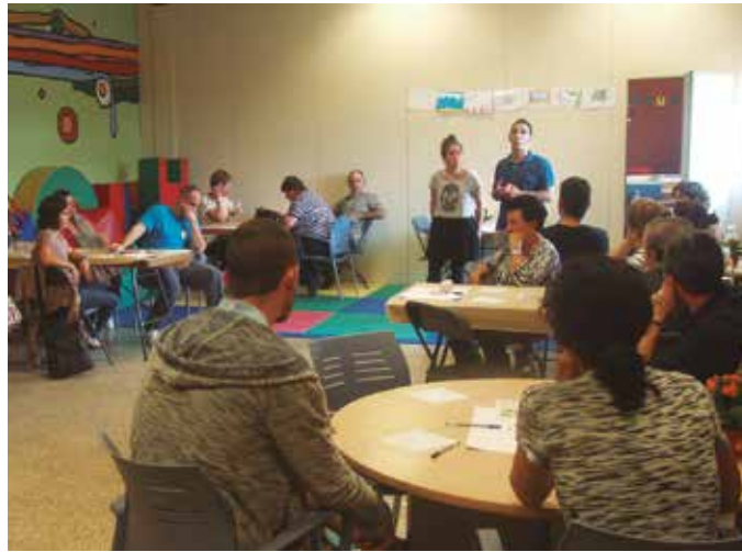
‘Kale Irekiak’ egitasmoko lehen bilerak Aginagan (argazkian), Zubietan eta Kaxkoan egin dira. Datozen asteetarako batzar gehiago iragarri dituzte.

Potxoenean: bideo emanaldia eta hausnarketa. “Ikuspegi propioa daukagu Usurbilen inguruan, eta ezinbestekoa da gure parte hartzea! Gazte, heldu zein adineko zatoz zure bizipenak kontatzera. Denon artean guztiontzako herri hobeto bat eraikiko dugu! Geure