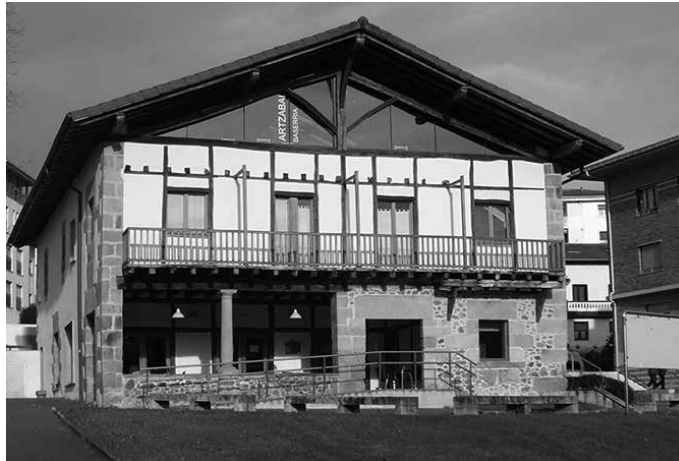
Urriaren 19tik aurrera, asteazkenero abiatuko dira goizeko 11:00etan Artzabaldik.

A dineko pertsoneri eta dibertsitate funtzionala duten herritarrei zuzendua egongo da, nahiz edonork parte hartu ahalko duen, Usurbilgo Udalak hainbat eragilerekin elkarlanean antolatu duen "Goazen Kale-ra" egitasmoa. "Ekimen horren bitartez, herritik zehar joango diren ibilbide ezberdinak planteatuko dira, ohitura osasuntsuak bultzatuz", Usurbilgo Udaletik berri eman dutenez.