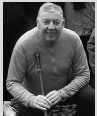
Urriaren 21ean Tiburtzioren omenezko afaria egingo da Aitzagan.

iluntzeko 20:30ean Aitzaga Elkartearen antolatu duten afarian. Otordura, bilaketa lanetan parte hartu zuten lagun guztiak daude gonbidatuak. Antolatzaileek jada hainbat laguni jakinarazi diote deialdia. Baina jakinarazpena jaso ez duzuenok, izena aurrez eman beharko duzue, urriaren 19a baino lehen, Aitzaga tabernan jarria egongo den zerrendan. Edaria baino ez da ordaindu beharko.