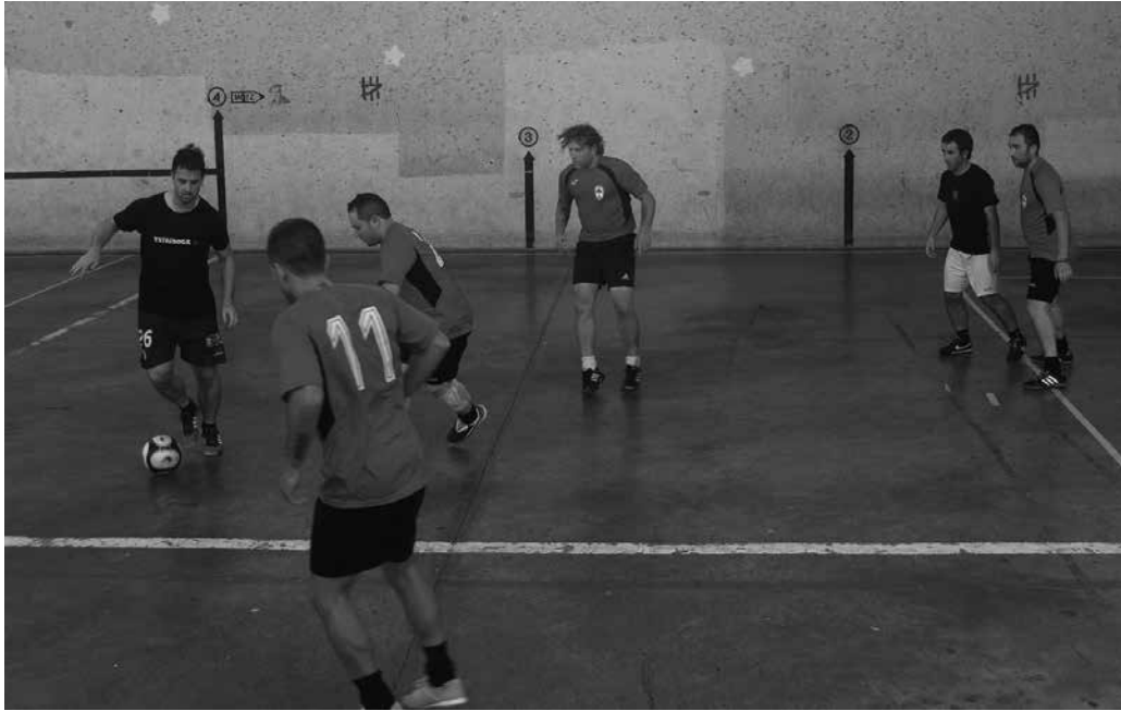
Tiketak urriaren 19ra arte egongo dira salgai Bentan, Txiribogan eta Bordatxon. Argazkia: 2014ko Usurbil FT eguna.

L au hamarkada bete ditu Usurbil F.T.-k eta ospatzera doaz. Urriaren 22rako bazkaria antolatu dute Saizarren. Sarrerak jada salgai dituzue urriaren