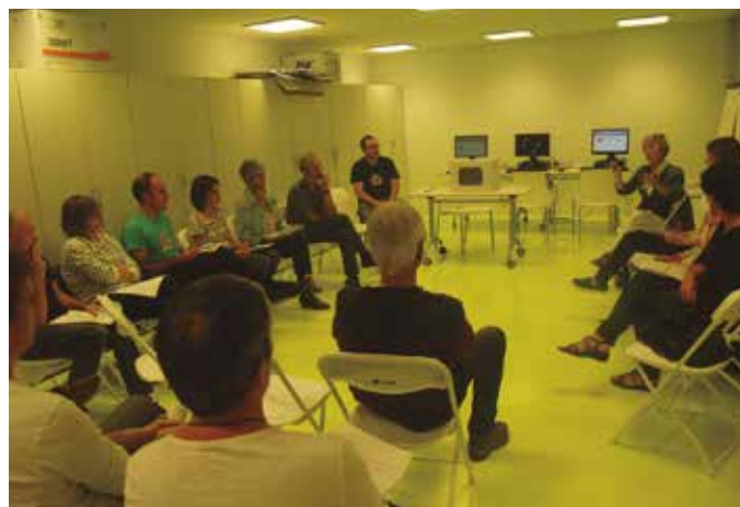
Galdeketa arituko diren bolondresak Potxoenean elkartu ziren aurreko astean.

Herritarrek auzolanean antolatua izango da, Erraustegia Erabakia herri plataformatik astebete barrurako deitu duten erraustegiari buruzko herri galdeketa. Urriaren 21, 22 eta 23an Aginagan, Santuenean, Zubietan eta Kaxkoan egokituko diren hautesmahaietarako behar zuten bolondres taldea osatu dute jada antolatzailleek. Egin beharreko lanen argibideak jasotzeko, aurreko astean batzartu ziren Potxoenean.