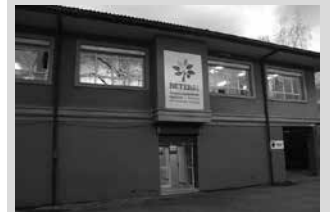
Hernaniko Gabriel Zelaia Eraikinean egingo da ikastaroa.