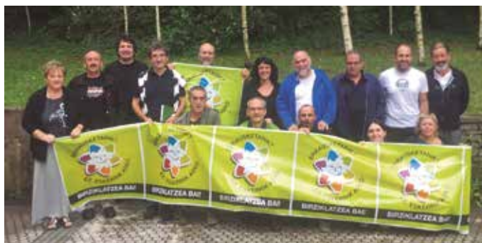
Larunbat honetan, eguerdiko 12:00etan abiatuko dira Gipuzkoa Plazatik, Foru Aldundiko egoitza paretik, Banco Santanderreko egoitzaraino.

Ohar bidez iragarri dutenez, Erraustegiaren Aurkako Mu-