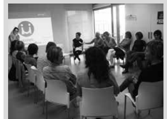
Ostegun honetan, hilak 13, arratsaldeko 18:00etan Potxoenean.

Irailaren 21ean prozesua kokatu eta bigarren Berdintasun Planerako lehen erronkak planteatu ostean, lanketa honetan sakontzeko bigarren bilera deitu dute Usurbilgo Udalak eta Elhuyar Aholkularitzak ostegun honetarako, urriak 13, 18:00etan Potxoenean. Bilera irekia izango da, herritar nahiz eragileentzat.