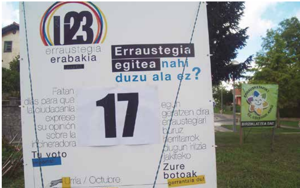
Herri galdeketaren gastuei aurreko egiteko lagundu nahi duenak eskura du kontu korronte zenbaki bat.

B adator, kezka eta hasereira eragin duen gai baten inguruan herritarrek hitza hartzeko ordua. Astebete baino ez da geratzen, Erraustegia Erabakia herri plataformak antolatutako herri galdeketa ospatzeko, herritarrok erraustegia nahi dugun edo ez erabakitzeko, eta gai honen inguruko iritzia ezagutzeko. Atzera kontua abian dela gogorarazten digu, Bordatxo aurreko errotondan eta beste zenbait tokian jarri