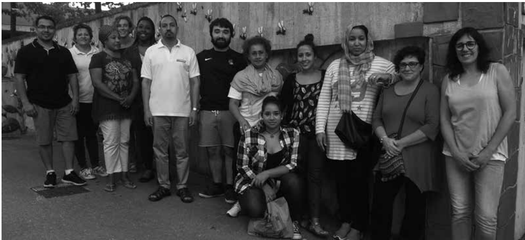
Usurbil Herri Anitza jaialdiko antolakuntza taldea.

HERRI ANITZA JAIAREN BARRUAN, EKITALDI UGARI ANTOLATU DITUZTE LARUNBATERAKO