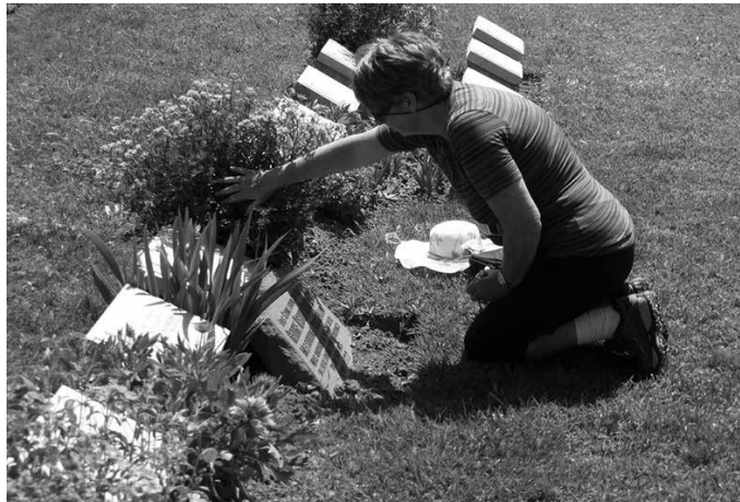
“Heriotza bizitzako zati gisa integratzeko, hezkuntza gune garrantzitsua da”.

“Heriotza, galera. Zirrara sortzen duten kontzeptuak dira. Bizitza naturaltasun osoz bizitzen badugu ere, heriotza, bizitzaren azkena, tabua da gure eguneroko elkarriketetan, eta txikienek ere entzun egiten dituzte. Helduok, gorrak eta itsuak balira bezala jokatzen dugu haiekin. Heriotza bizitzako zati gisa integratzeko, hezkuntza gune arras ga-