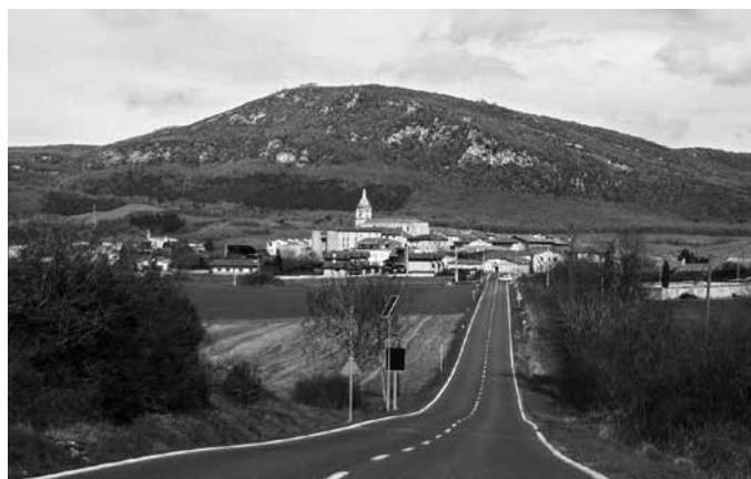
Urizaharra (irudian) eta Bastida arteko ibilbidea osatuko dute lehenbizi, eta ondoren Candido Besa upategian bazkalduko dute.

■ Izen-ematea: Azaroak 1 baino lehen. Izena ematerakoan 40 euro ordaindu behar dira, garraioa eta otordua barne.