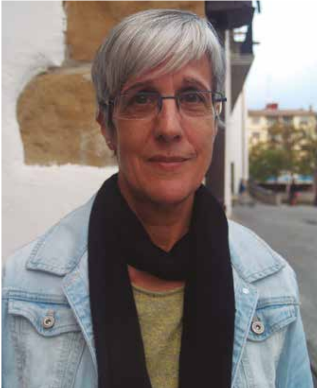
“Bozkatzeko lekuak bilatu, argindarra, mahaiak, aulkiak... Baliabideak bilatzea izan da gure eginbehar nagusia”.

1.- Bozka egunetarako baliabideak bilatzea izan da gure taldearen eginbehar nagusia; bozkatzeko lekuak bilatu, argindarra, mahaiak, aulkiak... Pixkanaka bati galdetu eta besteari eskatu eta osatzen zoaz. Gero baita ere bozka egun horretan zeintzuk egongo diren mahaietan. Hasieran 12 lagun bakarrik ginen. Gero pixkanaka zerrenda luzatzen joan da, 42 laguneko zerrenda osatu dugu. Ordezkoak ere baditugu jada. Argi utzi dugu, galdeketa eginda, bildutako datu guztiak ezaba-