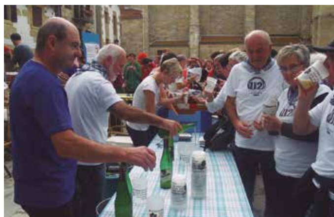
Lip-dub-aren amaierako hamaiketakoa, urtean zehar hainbat ekimenetan gogotik lan egiten duten gaztaingileek prestatu zuten. Bildutako dirua plataformara bideratuko da.

800 lagunek baino gehiagok parte hartu zuten lip-dub grabazioan. “Parte hartze izugarria”, nabarmendu dutenez. “Kopuru ederra da, gizartearen parte hartzea aktibatuta