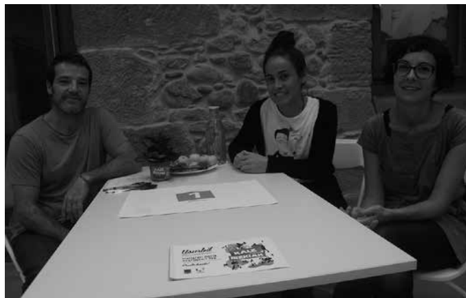
Urak Bide taldekoek aditzera eman digutenez, "hainbat eta oso anitzak izan dira herritarrek egin dituzten ekarpenak".

Hainbat eta oso anitzak izan dira herritarrek egin dituzten ekarpenak; baina, bai! Diagnostikoaren helburua adostasuna bilatzea ez bazen ere, orokorrean, Usurbilek toki atsegin asko dituela eta gustuko dituztela antzematen da. Gainera,