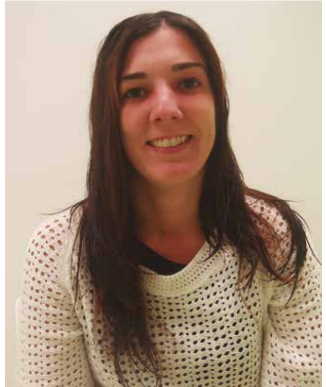
“Ekimenak antolatu eta jendeari parte hartzeko deia egin diogunean, beti baieztokoak jaso ditugu”.

1.- 6-7 bat partaide gara. Lan dezente eskatuko zuela ikusita, talde honen barruan bospasei laguneko azpitalde bat ere osatu genuen, lipdub grabazioa antolatzeko. Antolatu ditugun ekimenen zabalkundea egin dugu. Gaia jendarteratu eta parte hartzea sustatu nahi izan dugu, galdeketa egunetan herritarren ehuneko handi batek botoa ematea nahi baitugu. Ekimenak antolatu eta jendeari parte hartzeko deia egin diogunean, beti baieztokoak jaso ditugu, azkenean erraustegiarena denok inplikatzin