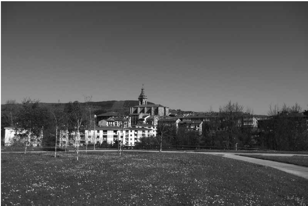
Bi kategoria daude: 4-16 urte arteko haur eta gazteak batetik, 17 urtetik gorakoak bestetik.

Hurbilago Elkarrekin, Usurbilgo irudiekin apaindu nahi ditu herriko denda eta establezimenduak. “Usurbilgo txokorik eder eta berezienen” izeneko argazki lehiaketa antolatu du horretarako. Argazkilari amateur zein profesionalei zuzendua dago txapelketa. Bi kategoriatan banatuko dute ekimena, 4-16 urte arteko haur eta gazteek eta 17 urtetik gorako helduek parte har dezaten.