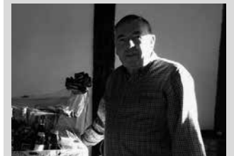
Ostiral honetan, Aitzagan.