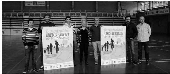
Buruntzaldeko Ibilbideen Eguneko bederatzigarren edizioa izango da hauxe.