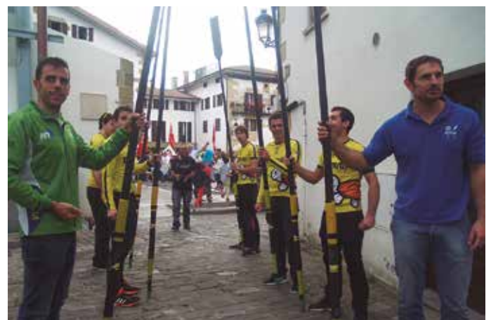
Iragan igandeko lip dub-aren grabazioko irudi bilduma osoa: noaue.eus atariko Argazkitegia atalean.