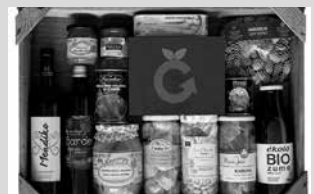
Eskaerak egiteko azken egunak dituzue.

■ Informazioa: errigora.eus / NOAUA!n (943 360 321).