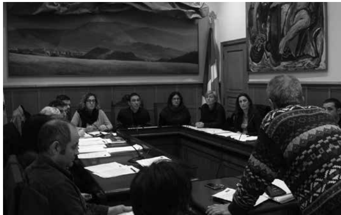
Auzi honetan Udala ordezkatu duten abokatu eta prokuradoreak izendatu dituzte jada.

Urriaren 25ean egin zen osoko ohiko bilkuran, dekretu bidez hartutako erabaki hau berretsi zuen udalbatzak ge-