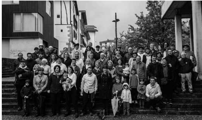
Aurtengo Sagardo Egunean hasi ziren urteurren ospakizunak. 20 urte lehenago, NOAUA!ko bazkideak batu ziren toki berean.

Urteotan, aldizkaria bideratzeaz aparte, NOAUA! Kultur Elkarateak beste hainbat lan sustatu ditu: baserrien eta baserriarren liburua, ondarearena... Astekari bat plazaratzeaz gain, herritarrentzat eta bereziki herriko taldeentzat plataforma komunikatibo batean bilakatu da, ezta?