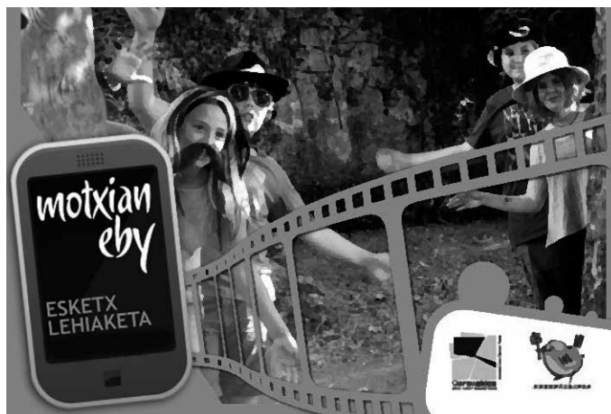
Motxianeby 12-16 urteko ikasleei zuzenduriko txapelketa da.

Aurkeztu nahi diren lanak 608 170 384 telefono zenbakira bidali beharko dira whatsapp bidez, edo kaixo@motxianeby.