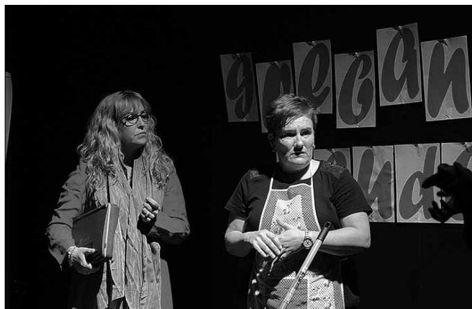
Umorea nagusi izaten da Lakrikun Antzerki Taldearen obra guztietan.