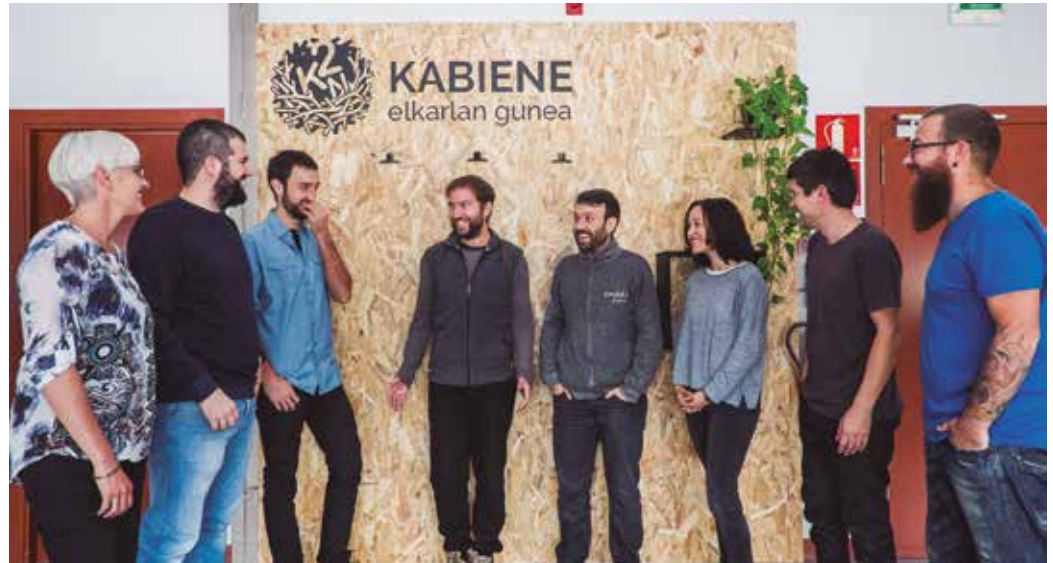
Autonomo eta freelance ororentzat irekia dago Kabiene bilgunea.