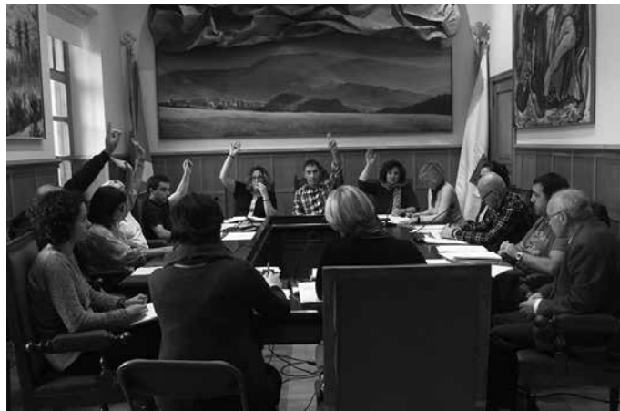
Udalbatzak hartutako erabakiari erreklamazioak aurkezteko 30 eguneko epea izango da, erabakia udal iragarki taulan eta Gipuzkoako Aldizkari Ofizialean argitaratu ondoren.

Aipatu moduan, 2017ko zerga-ordenantzan ez du igoera orokorrik aplikatuko Usurbilgo Udalak. Baina badira zenbait salbuespen. Udal gobernu taldetik argitzen dutenez, badira beste erakundeek hartutako erabakien eraginez aplikatu beharko dituen zenbait igoera. "Ez dira Udalak bere kabuz hartutako erabakiak", nabarmentzen dutenez. Ondasun Higiezinaren Gaineko Zerga (OHZ edo erdarazko "IBI") da hain