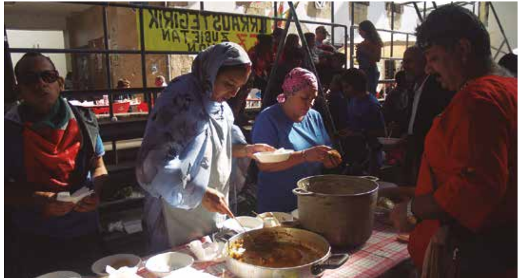
Azaroaren 13an ospatuko da “Bizilagunak” izeneko egitasmoaren edizio berri bat. Argazkia Herri Anitza eguneko da.