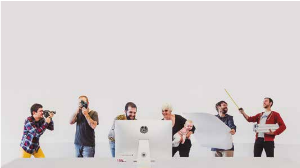
kabiene.com web orrian topatuko duzue elkarte berri honi buruzko informazio gehiago.

NOAUA! Gaur egun zuen ibilbidea jorratzea bideragarria da? Zein da abiapuntua?