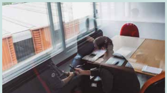
“Erraztasun handiak eman dizkigute Elhuyarren”.

Jon A.: Aurkezpena oso positiboa izan zen. Beraien partetik oso jarrera irekia izan dute hasieratik. Erraztasun asko eman digute proiektua martxan jartzeko eta aurkeztuta gero ere inguratu zitzaizkigun bertako langileak proiektuaz interesaturik. Elhuyar motore, gure laguntzaile izatea, guretzako