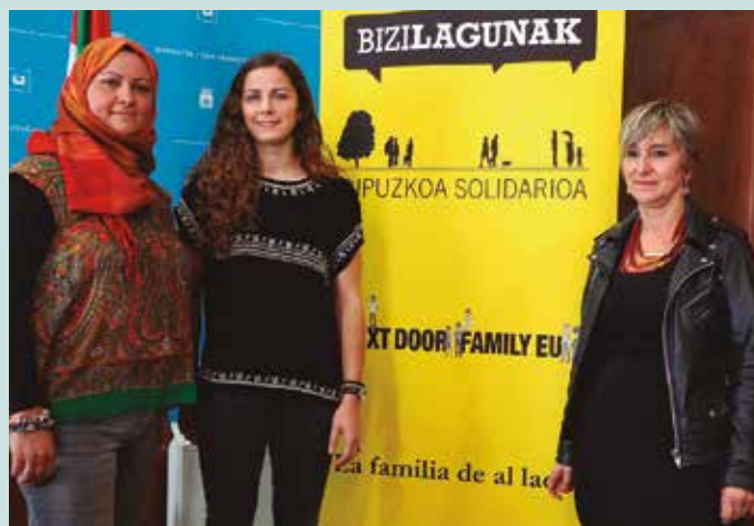
Urriar aurkeztu zen kanpaina. Izena emateko: mugak.eu webgunean, 943 321 811 telefonora deituz edo sosracismobizilagunak@gmail.com helbidean.