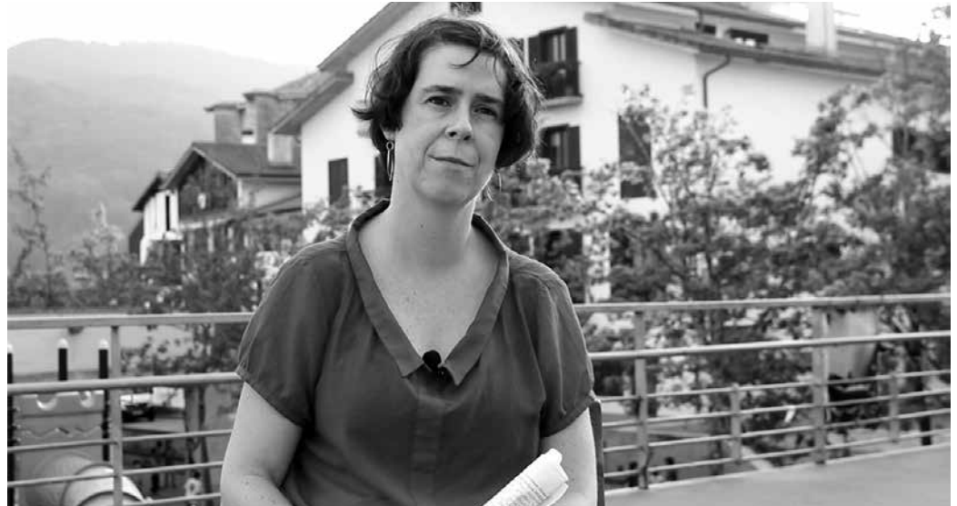
Ostiralean Sutegin eskainiko dugun ikusentzunezkoan topatuko dituzue adierazpen hauek, eta beste batzuk.

Ongarri egokia zegoen NOAUA! sortu aurretik. Esperientzia eta eskarmentu handiko jendea batu zen. Gazte jende asko bagentozen, ilusioz gainezka etorri ere. Denak lanerako gogoz ginen. Eta hori dena ongarrri onena izan zen NOAUA!