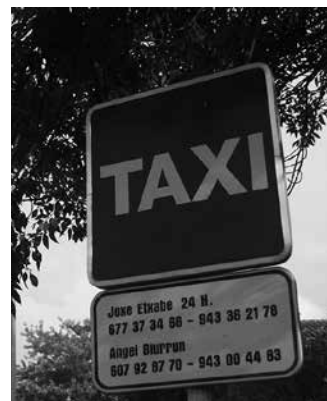
Aho batez onartu ziren 2017ko taxi tarifak.

Egindako kilometroak: 1,7436. Itxaronaldia, orduko: 32,8274.