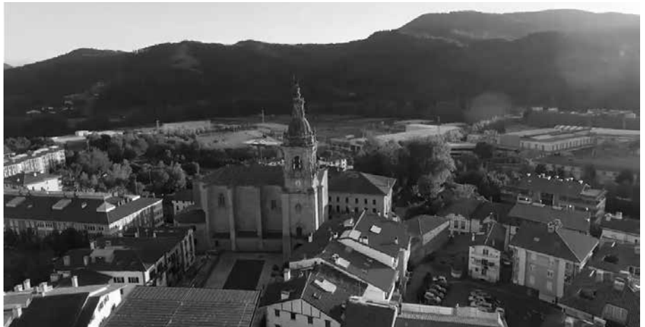
Azaroaren 15ean amaituko da Hurbilagok antolatu duen argazki lehiaketan parte hartzeko epea.

■ Argazkiak aldeztu aurretik argitaratu gabea izan behar du, urriaren 1etik azaroaren 15era arteko tartean eginikoa; argazkiko edukien erantzule bakarra argazkia aurkeztu duenarena izango da. "Identifika daitezkeen pertsonak agertzen diren argazkien kasuan, lehiakideek pertsona horien baimena izan beharko dute.