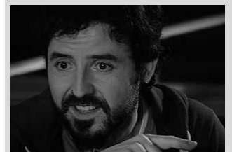
Azaroaren 10ean, SuteGIN.