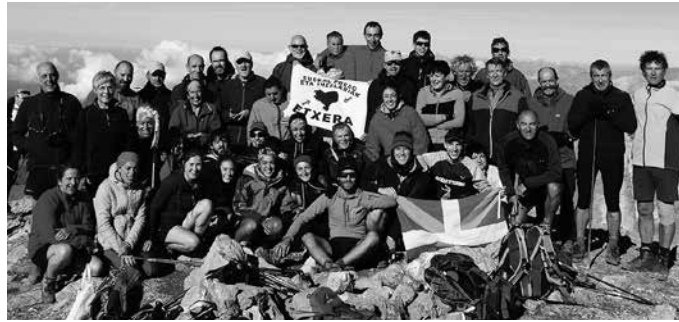
Irailan Monte Perdidon izan ziren. Irteera honen inguruko ikusentzuzkoa eskainiko dute azaroaren 23an, Sutegin.

■ 8:00etan, Frontoi atzetik abiatuta, mendi irteera Usurbilgo inguruetan. Ondoren, bazkaria Patri jatetxean ospatuko da. Bazkarira joateko izena alde aurretik eman beharko da, ikus-entzuzko saioak programatu diren egunetan, Sutegin jarriko den mahaietan.