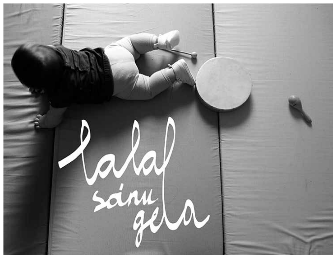
Azaroaren 26an egingo da tailerra, baina izena aldeztu aurretik eman behar da.

■ Izen-ematea: azaroak 7-11 bitarteko astean. Astearte, ostegun eta ostiralean 18:00-19:30 bitarte Zumarteko bulegoan.