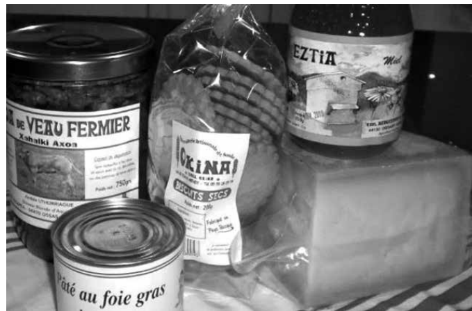
2003az geroztik antolatzen duten elkartasun kanpainak bi helburu ditu: “Xiberoko tokiko janariak ezagutaraztea eta ikastolaren egoera ekonomikoa hobetzea”.

Gure laguntza beharrean dira, eta horretarako, haiek ekoiztako produktuak erostera animatzen gaituzte. Jasotako laguntza eskertuko dute. 2003az geroztik antolatzen duten elkartasun kanpainak bi helburu baititu; batetik, “tokiko janariak ezagutaraztea, Xiberoko etxalde eta enpresetan otarreak osatzen dituz-