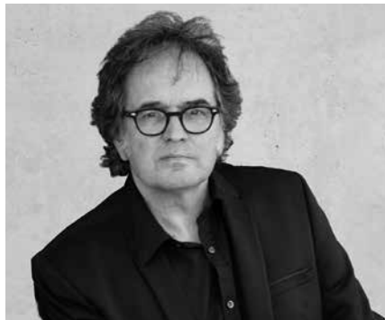
Igande honetan Sutegin arituko da. Arratsaldeko 19:00etan hasiko da kontzertua.

Sarrerak: 10 euro (Aldez aurretik Bordatxon, Artzabalen, Lizardin eta Noaua!ko egoitzan). Noaua!ko bazki-