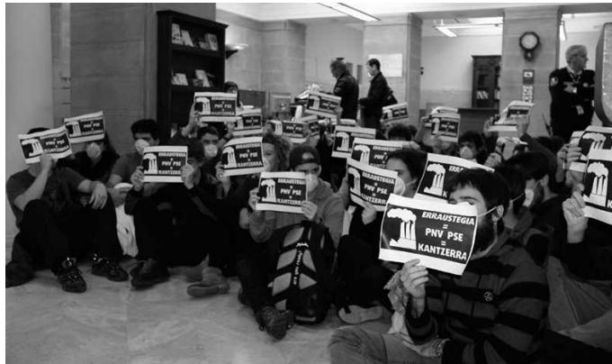
Urriaren 31n Diputazioko egoitzan bertan erraustegiaren aurka mobilizatu zen Ernai gazte erakundea.

Foru Aldundiak lizitazioa aurkeztu diren enpresa taldeen berri eman eta gutxira, urriaren 31n Diputazioko egoitzan bertan erraustegiaren aurka mobilizatu zen Ernai gazte erakundea, atera zuten ondoko irudian ikus daitekeen moduan. “Ekimenarekin erraustegiaren inposaketa salatu, eta PNV eta PSEren erantzukizun politikoa jarri nahi izan dugu jo puntuan”, adierazi dute Ernaitik.