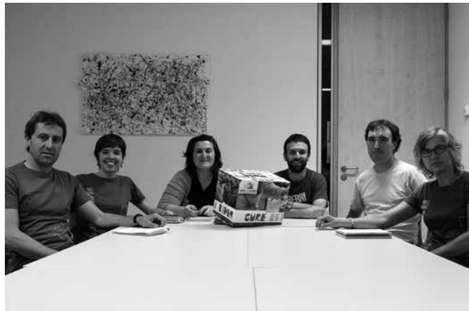
Lasarte-Orian eta Usurbilen ere egingo da herri galdeketa, eta aldi berean. Hori dena bideratzeko jendearen partehartzea funtsezkoa izango da. Bilera ireki baterako gonbitea luzatuko dute laster.

2017rako hain zuzen, "herri-tarrak pixkanaka ahalduntzen jarraitzeko" herri galdeketa egingo dira Euskal Herriko txoko askotan. Martxoaren 19an Oarsoaldean, Tolosaldean, Hernanin eta Astigarra-gan. Apirilaren 2an Lea Artibai eta Uribe Kostan. Maiatzean