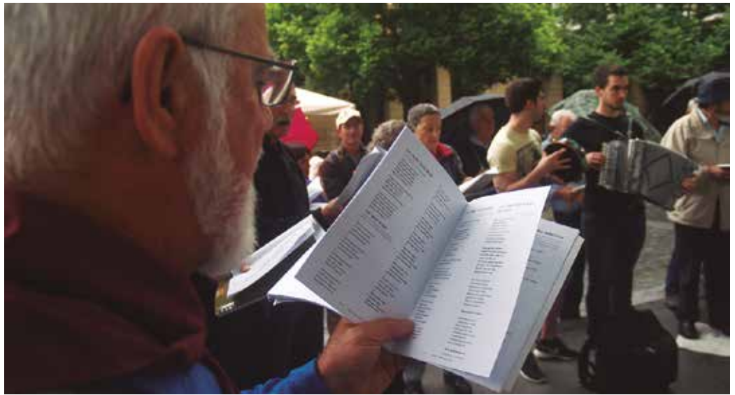
Liburuxka berria plazaratu du Usurbilgo Kantu Taldeak, "kantuan aritzea erraztuko digun argitalpena".

Kantu-jira eta kantu-bertso-afaria antolatuta du Kantu Taldeak NOAUA!rekin elkarlanean ostiral honetarako,