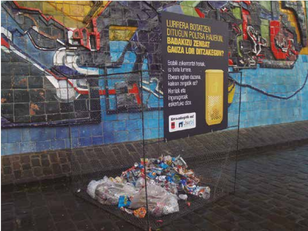
Astlehenean itxura hau zuen kaiolak. Aurreko asteburuan lurretik bildutako hondakinak ageri dira bertan.

Etxean ziurrenik ez, baina kalean hondakinak beti ez dira birziklatzeko jarriak dauden ontzietan sartzen. Oraindik lurrera botatzeko ohitura bada. Horren erakusle Usurbilgo Udalak Mikel Laboa plazan azaroaren 4an, ostiralez jarri zuen kaiola. Udal langileak kalean botatuko poltsak bildu-litxarrerria poltsak, pipa azalak, edota freskagarri latak bildu dituzte gehienbat- eta kaiola honetara botatzen hasi dira,