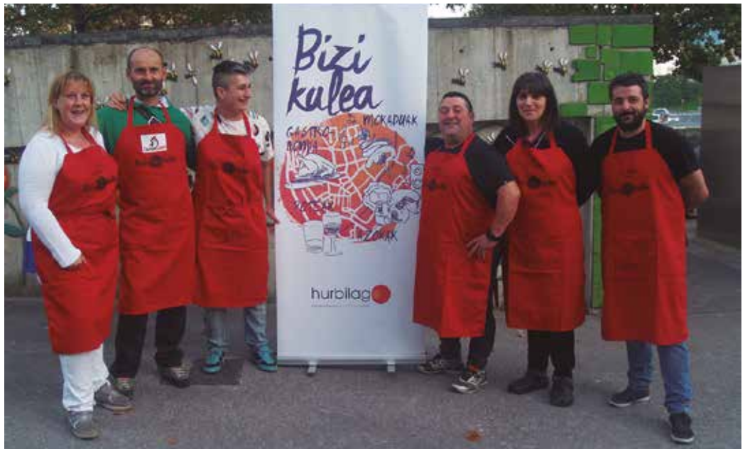
Azaroaren 13an, Bizi Kalea ekimena: Lumagorri oilasko pintxoak jan eta sagardoa txotxetik edateko aukera izango da. Herriko trikitilariak girotuko dute Hurbilagoren ekimen berria.

Hurbilago Elkarteko kide diren tabernariak dira egitasmo hau elkarlanean aurrera atera dutenak. Kalea girotzea dute helburu, hortik egitasmoaren izena; "Bizi Kalea". Tipi-Taparekin jorratu duten bidean aurrerapuso bat eman nahi dute, kale giroa indartzen segi. Alde horretatik, azaroaren 13an Mikel Laboa plazan kokatuko duten karpa gunea, azoka ibiltari berri honen abiapuntua baino ez da izango. Aurrerantzean hilean behin, karpa gune hau herriko gune ezberdinetan kokatuko dute, igandeko formula bera baliatuz; jan edana