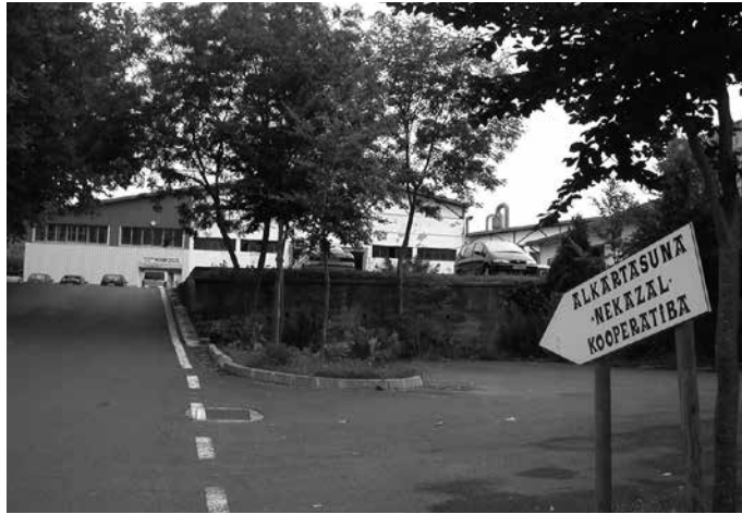
Azaroaren 2an erabakia argitaratu zenetik, interesdunek 20 egun dituzte proiektua aztertu eta alegazioak aurkezteko.

Joan den irailaren 27an Eginiko Tokiko Gobernu Batzarrean hasieraz onartu zuen Usurbilgo Udalak, “Hiri Antolamenduko Arau Subsidiarioetako A-59 (Ugartondo) Eremuari dagokion Urbanizazio Proiektua”. Alegazio epean da orain. Udalak azaroaren 2ko Gipuzkoako Aldizkari Ofizialean erabakia argitaratu zuenetik, 20 eguneko epea dute interesdunek, “proiektua aztertu, eta hala badagokio, bidezko alegazioak aurkeztu ditzaten”.