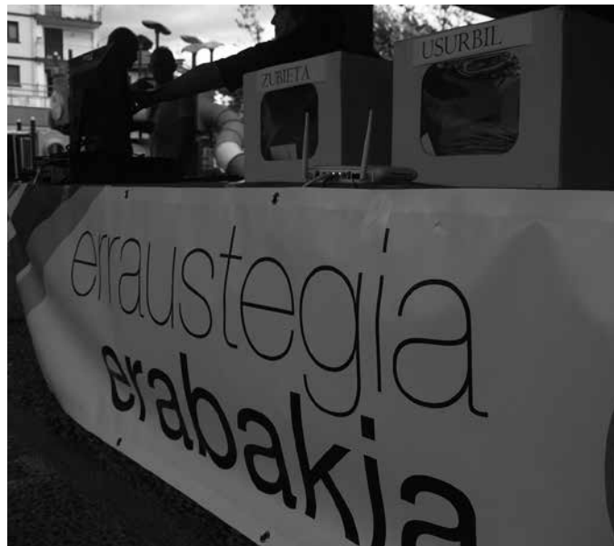
“Auzolan erraldoia izan da honakoa. Izugarritzko ariketa demokratikoa egin dugu”, Erraustegia Erabakia Herri Plataformak aditzera eman duenez.