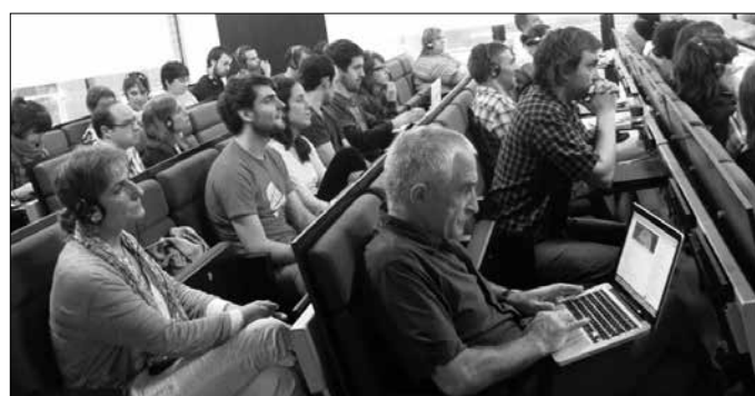
TOKIKOM Jardunaldien aurreneko edizioak, 2012koak, onarpen zabala izan zuen. Bigarren edizioā datorren astelehenean egingo da Arrasaten.

Tokian tokiko komunikabideok euskararen transmisio katean betetzen dugun papera