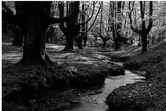
Santuenea Kultur Elkar-teak antolatu duen lehiaketa 4-14 urteko gazteei zuzendua dago.