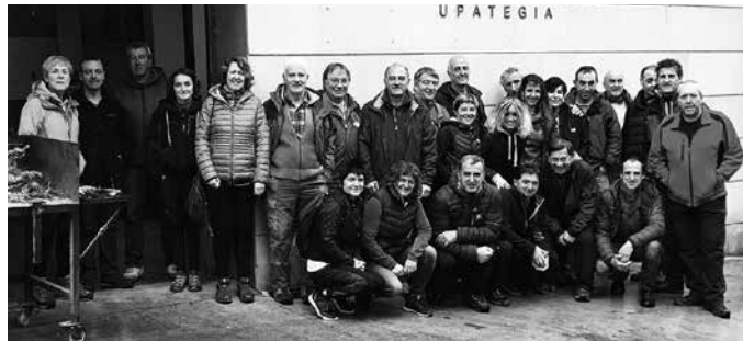
Aurreko asteburuan Toloño mendian izan ziren. "Urizaharrik Bastidarako bidea egin ondoren, Eskuernagako upategian ospatu genuen merezitako otordua".

Mendi irteerari, 2017rako txangoek emango diete jarraipena. Urte berriko mendi irteeren egitaraua hain zuzen, herritarren proposamenekin osatu nahi dute. Ekarpinak egitera animatzen gaituzte. "2017ko egitaraua prestatzen hasi behar dugu eta ibilbideak proposatzea eskertuko genuke. Buruan duzun mendi irteera hori aurkeztu ezazu ahal den xehetasun eta ezaugarri gehienekin. Krokisa edo mapa, ibilbidearen luzera, abiapuntua, amaiera tokia eta igotzen diren lepo edo gailurrak oso datu interesgarriak dira ibilaldia aurkeztetarakoan. Proposatzen dituzun ibilbideak aurkezteko, Andatza Mendi Elkarteko egoitzan