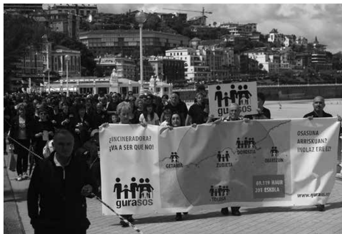
Azaroaren 26an arratsaldeko 17:00etan egingo da manifestazioa.

Erraustegiaren lizitazioa geratzea eta parte hartze prozesua zabaltzea eskatu eta gai honen inguruan adostasuna lortzeko oraindik denbora badela aldarrikatzeko manifestazioa deitu du GuraSOsek azaroaren 26rako Donostian. Laster emango dituzte mobilizazio honen inguruko zehaztasunen berri. Antolaketa lanetan lagundu nahi duenak, idatzi dezala komunikazioa@gurasos.org helbidera.