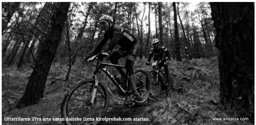
Urtarrilaren 27ra arte eman daiteke izena kirolprobak.com atarian.

Federatuek 15 euro ordaindu beharko dute, 18 euro federatu gabeek. 500 lagunentzako lekua egongo da Irisasi BTT Hotzak Akabatzen proban. 26 km eta 36 km inguruko ibilbide bana egiteko aukera izango