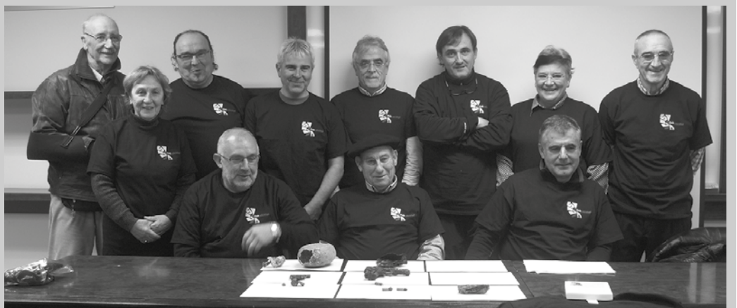
Islada Ezkutatuak taldeko kideak.

Argi erakusten dute froga hauek. Islada Ezkutatuak taldearentzat, Zubieta gainean ezkutuan segitzen duena azaleratzen bada lanik oraindik, “Txaldataxurren historia zabaltzen segi beharra dago”.