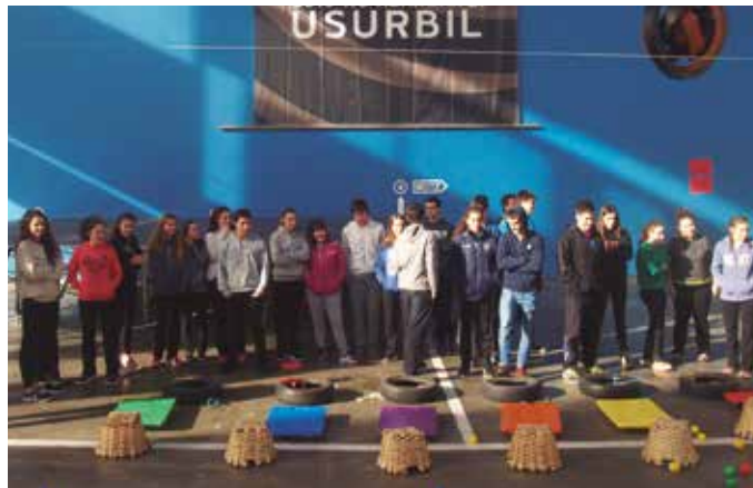
Datu bilketatik abiatuta, hainbat erronka marraztu dituzte etorkizunerako. Esaterako, jaien antolaketa lanetan edota aisialdian soilik ez, "beste alorretan gazte aktibazioa bermatzen eta sustatzen jarraitzea".