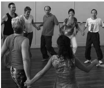
Apirilaren 7ra arte iraungo du Parekidetasun Sailak antolatu duen ikastaroak.

■ Oharra: usurbildarrek lehentasuna izango dute.