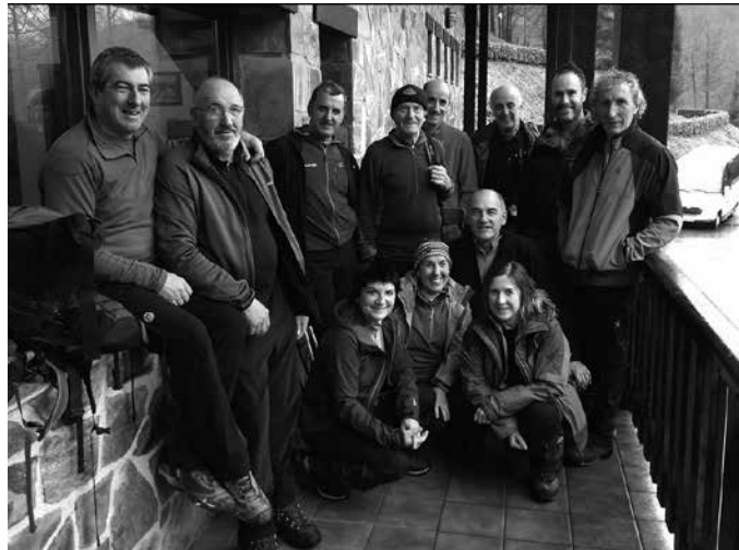
Andatzakoak Aritxulegiko Harritxulo aterpean, Hendaiaetik Aritxulegirako ibilbidea osatu berri. "Erreak eta mendia urez beteta ikusteko aukera izan dugu". Argazkia aurreko igandekoa da.