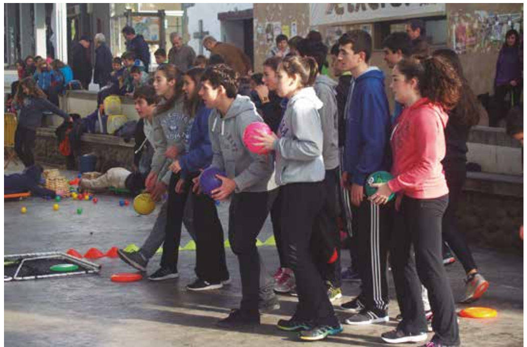
Azaroan Gazte Eguna ospatu zen. Usurbilgo Ernaik gazte eragileekin bildu eta jasotako datuekin azterlan bat osatu du.

Eta datu bilketatik abiatuta, hainbat erronka marraztu dituzte etorkizunerako; esaterako, jaien antolaketa lane-