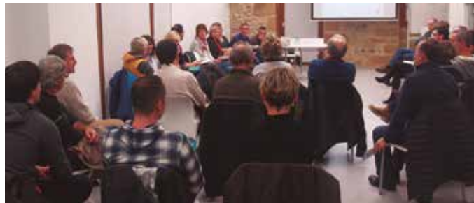
Hondakinen kudeaketa eredu propio bat lortzeko dauden aukerak aztertuko ditu Udalak herritar zein eragileekin. Urtarrilaren 26rako bilera deitu dute.