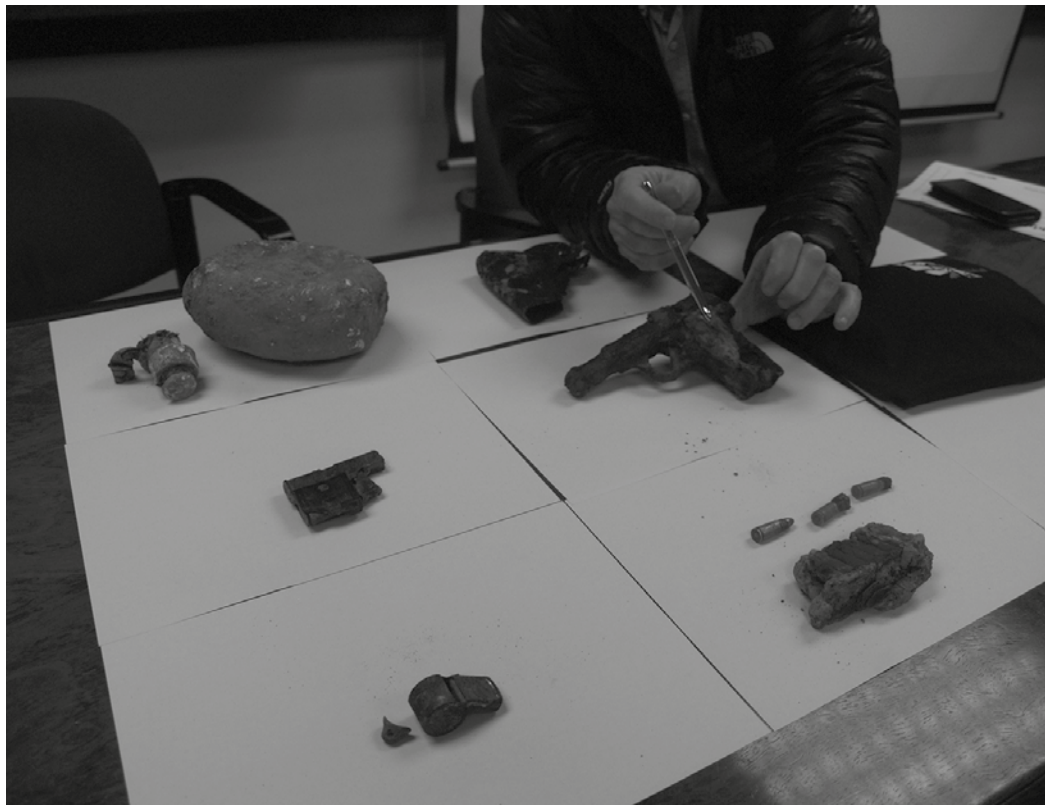
Urtarrilaren 10eko agerraldian erakutsi zuten aurkitutakoa, tartean balak eta pistola bat.