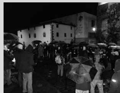
Urtarrilaren 28an larunbata, Mikel Laboa plazatik abiatuko dira arratsaldeko 19:00etan.

Kantu Taldekoak kalez kale kantuan arituko dira datorren larunbatean, urtarrilaren 28an. Arratsaldeko 19:00etan abiatuko dira Mikel Laboa plazatik. Gogoan izan, ikasturte berria hasia dutela. Asteartero biltzen dira Kantu Taldekoak 18:30-19:30 artean, Udarregi Ikastolako kantu gelan entseatzeko.