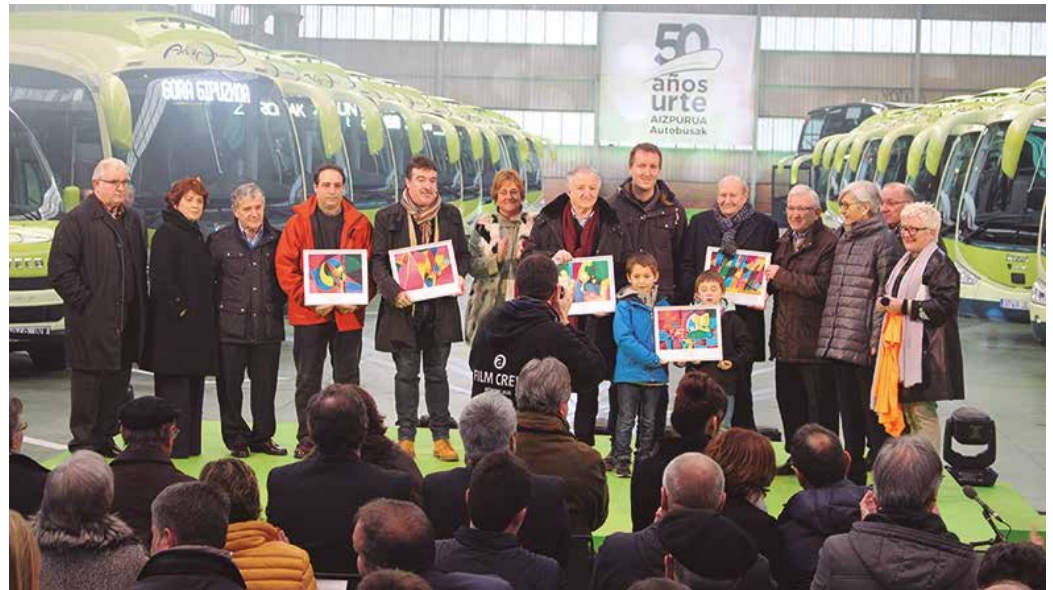
Pasa den larunbateko 50. urteurren ekitaldian, Aizpurua Autobusak enpresak bost erakunde saritu nahi izan zituen: Tolosako CIT elkarteak, Laskorain Ikastola, Caritas, Beasaingo Kirol Lagunak eta Herri Ametsa Ikastola.