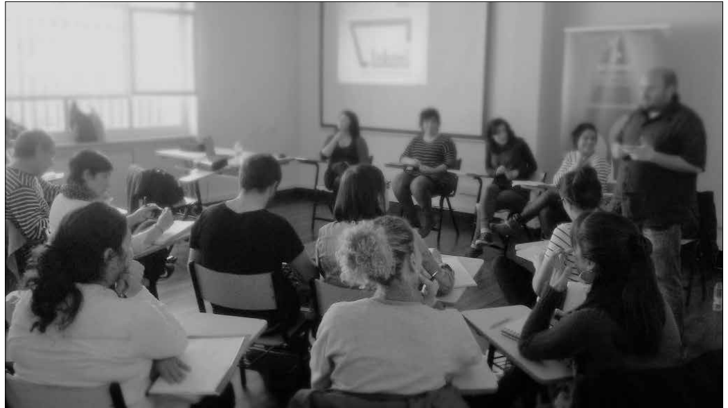
Lehen aldiz, hiru eskualdeetan eskainiko da formazio programa: Beterri-Buruntzan, Debagoienan eta Oarsoaldean.

Programan parte hartzea doakoa da baina plazak mugatuak daude. Asteotan parte-hartzaileekin elkarrizketa fasea irekiko da, otsailaren 1ean formazioari hasiera emateko. "Horregatik dei egin nahi diegu Beterri-Buruntzan proiektu bat elkarlanean garatu nahi duten pertsona, talde edo enpresei