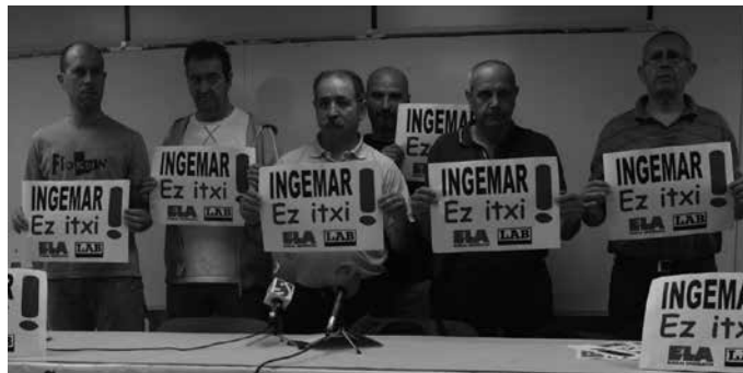
5 hilabeteko greba mugagabea alde guztiek onartutako akordio batekin amaitu zen. Orain, enpresako zuzendaritzak hartzekodunen lehiaketa aurkeztu du.

Zoritxarrez, Usurbilgo langileak, erakundeek eta bankuek