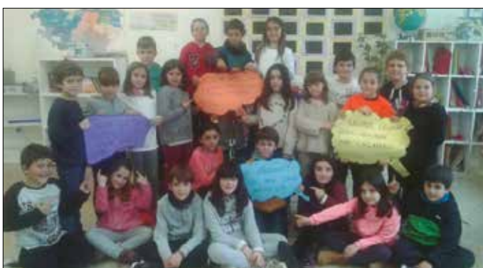
“Gure ikastola ere, KIVa ikastola izango da hemendik aurrera. Dagoeneko hasi gara harremanei dagozkien asmo onak bereganatzen”.