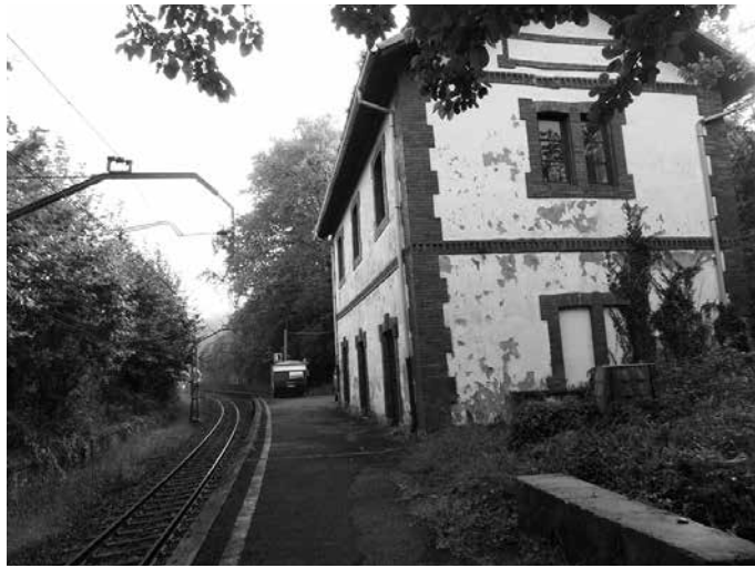
Proposamenak aurkezteko epea otsailaren 10ean amaituko da.

T xokoaldeko tren geltokia zena biziberritzeko ekimena jarri du mar txan Usurbilgo Udalak. Gunea jarduera soziokulturaletara bideratu nahi du. Horretarako, Eusko Trenbide Sarearekin elkarlanerako hitzarmena sinatu du, eraikinaren erabileraren lagapena gauzatzeko. Kultur ekimen bat garatu nahi duenarentzat, aukera egokia izan daiteke. Hauek dira deialdiaren ezaugarri nagusiak: