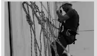
Beterri-Buruntzako udalek antolatuta dute formakuntza ikastaro hau.

“Lan munduan sartzeko baliagarri izango zaizkizun praktikak eta lan poltsa aktiboan sartzeko aukerak”, izango ditu parte hartzaile bakoitzak. Gizarte eta lan orientazio eta integrazioarako teknikak; espezialista soka bidezko sarbide teknikan, eta praktikak burutzeko behar diren beste hainbat preskakuntza jasoko dira.