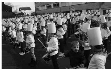
Euria egingo balu, Agerialdeko frontoian egingo litzateke danborrada.