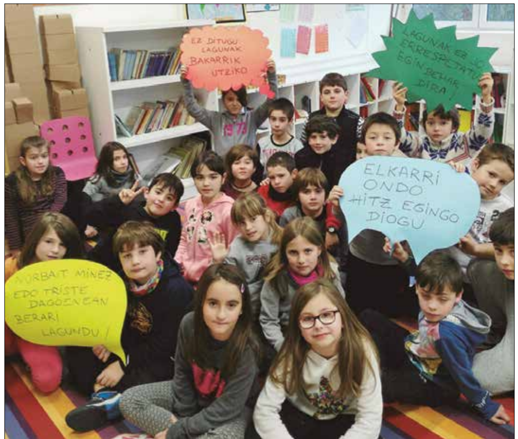
KIVak ikastolako komunitate osoa hartzen du bere barnean; ikasleak, irakasleak, langileak eta gurasoak. Era horretan, eskola jazarpenari aurre egitea guztien eginkizuna dela azpimarratzen da.

“Jakingo duzue, ikastola askotan KIVa programa martxan jarri da, baita geurean ere. Horren adibide, LH 3. mailan egin ditugun horma-irudiak. LHko gela guztietan egin genituen joan den astelehenean. Beraz, gure ikastola ere, KIVa ikastola izango da hemendik aurrera. Dagoeneko hasi gara harremanei dagozkien asmo onak hartzen...”, Udarregitik aditzera eman dugutenez.