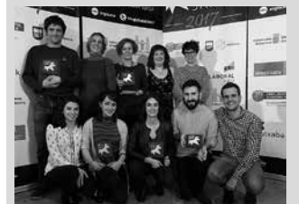
Saritutakoaren familia argazkia, aurreko ostiralean Atxegan.