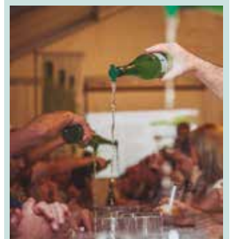
“Sagardoa munduko toki askotan egiten da, baina hemen ezagutzen dugun sagardo naturalik ez”.

Une honetan Amerikako Estatu Batuetako iparraldean sagardoa oso modan dagoela jakinarazi zuen eta laguntzak ematen ari direla, gainera, sagastia berreskuratzeko. “Beste sagardo mota bat da hangoa. Sagardoa munduko toki askotan egiten da, baina hemen ezagutzen dugun sagardo naturalik ez. Modan dago bai, baina oso zaila da hara iristea. Gure ekoizleentako batzuk zerbait saltzen ari dira 6-8 urteko lanaren ondoren. Baina oso konplexua da. Hemengo ekoizle handiena ere mundu zabaleko erakuslehoan txikia da. Gure sektorea txikia baita”.