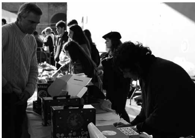
Zuberoan ekoiztutako produktudun otarrak salduz, 8.852 euro bildu zituzten.

Zuberoan ekoiztutako produktudun otarrak salduz, 8.852 euro bildu ziren Usurbilen. Lerrootatik Nafartarrak taldeak eskerrak helarazi nahi dizkiete, elkartasun ekimen honetan parte hartu duten guztiei.