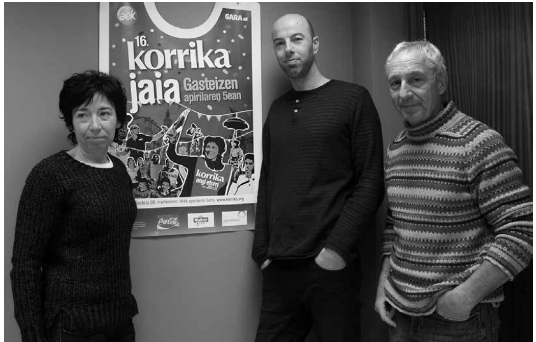
Antolaketarako ekarpenak egitera animatzen gaituzte eragile eta herritarrei Etumeta AEK-ko irakasleek; hilaren 9an osteguna, 19:30ean euskaltegian bertan egingo den lehen batzarrean.

Lasarten hartuko dugu lekukoa, hipodromoko zubi in-