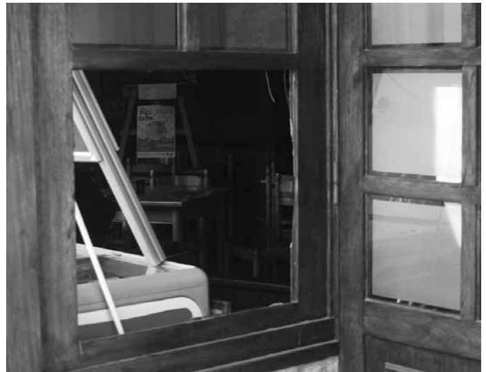
Zendoian (ezkerretara) leiho zati bat desmuntatu zuten. Txapeldunen (eskubitara) ate ondoko leiho zati bat puskatu ondoren sartu ziren.

B iak egun berean gertatu ziren. Ondoko itxura zutela esnato ziren biak hilaren 27an.