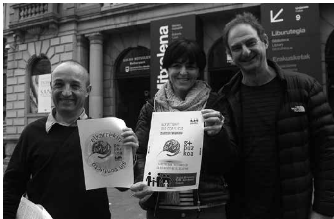
Irtenbideak akordioan, legearen errespetuan eta parte hartze demokratikoan oinarritu behar duela uste duten herritar guztiak deitu dituzte manifestaziora.

Ekimen juridiko berria iragarri dute gainera, azkena. Astearte honetan, errekursoa aurkeztekoa zen GuraSOS, Gipuzkoako Foru Aldundiaren 2017rako foru aurrekontuen araudiko zortzigarren xedapen gehigarriaren aurka. Xedapen honek 2002-2016 urte artean izan dugun Gipuzkoako Hiri Hondakinen Plan Orokorren