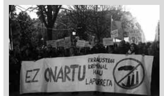
Autobusa antolatu da. 11:30ean abiatuko da kiroldegitik.

Manifestazio honen bidez, Txingudiko erraustegia atzera bota zen bezala, Zubietakoa ere atzera botatzeko presioa egin nahi dute Gipuzkoako agintarien aurrean. Horregatik erraustegiaren nahiz zabortegiaren aurka borrokatu diren gipuzkoarrei bertaratzera deitzen diete. “Borroka berdinean gaudete eta elkar lagundu behar dugu”, diote deitzaileek. Irungo eta Hondarribiako udalei ere gaikako bilketan berehala pauso eraginkorrek ematea eskatuko zaie.