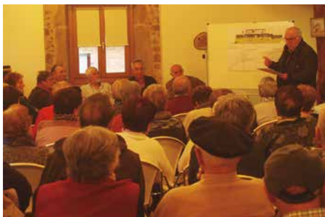
2016ko balantzeaz eta 2017ko egitasmoen aritu ziren.

Gure Pakea Elkarteko zuzendaritzaren erdia berri, 2016ko balantzea egin eta urte berriko egitasmoak jorratzeko urteroko batzar