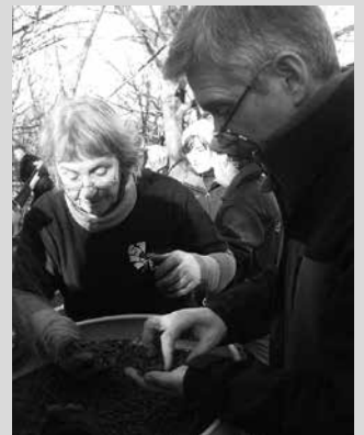
Islada Ezkutatuak eta Aranzadi elkartekoak aritu ziren indusketa lanetan.