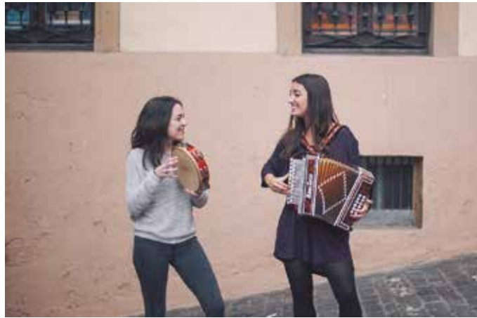
“Munstrokeria hau ez genuen inondik inora ere espero. Ez irratian eman den fenomeno, ezta Durangoko Azokan izan zuen oihartzuna ere”.

N. Erromeria baino, kontzertu gisako saioa izango da Usurbilen eskainiko duzuen?