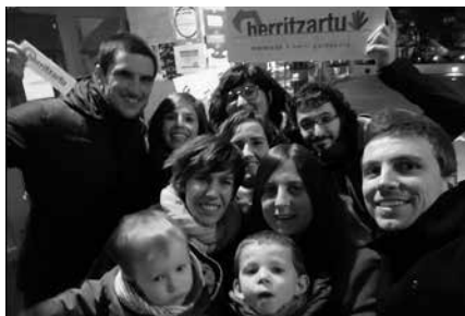
Igandean, eguerdiko 13:00ean Dema plazan batzeko deia egin dute. Euria egingo balu, frontoian egingo litzateke argazkia.

Usurbilgo Udalak Ziortza Gazte Elkartearen laguntzaz negu parterako antolaturiko euskarazko zine zikloaren baitako proiektioa izango da igandean, otsailak 5, arratsaldeko 17:00etan hasita Sutegiko auditorioan. Sarrerak egunean bertan izango dira salgai, 3 eurotan.