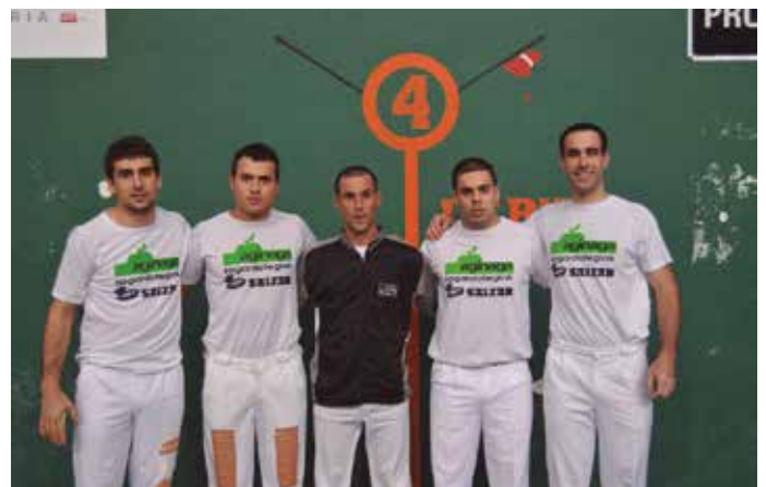
Igandean jokatuko dute finala Amezketan, Aurrera Saiatz taldearen aurka.

Igandean, arratsaldeko 16:30-etik aurrera Amezketako frontoian: Aurrera Tolosa-Pagazpe. “Animatu herritarrak gure pilotariei babesa emateko eta an-