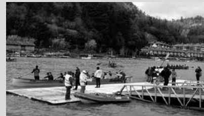
6.000 metroko estropada Mapildik abiatuko da. 4.000 metrokoa, Saikolatik.

Neguko estropada garrantzitsuenak jokatu da otsailaren 11n larunbatarekin: Oriaren Traineru Jaitsiera. 16:00etatik 18:00etara.