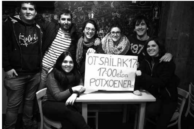
Otsailaren 17rako bilera irekia antolatuta dute: 17:00etan Potxoenean.

Gazteok, Alternatiba hauen eraikuntzarako, autogestioa izango dugu oinarri. Hau da, guk geure bizitza ekonomiko, politiko, kultural zein soziala-