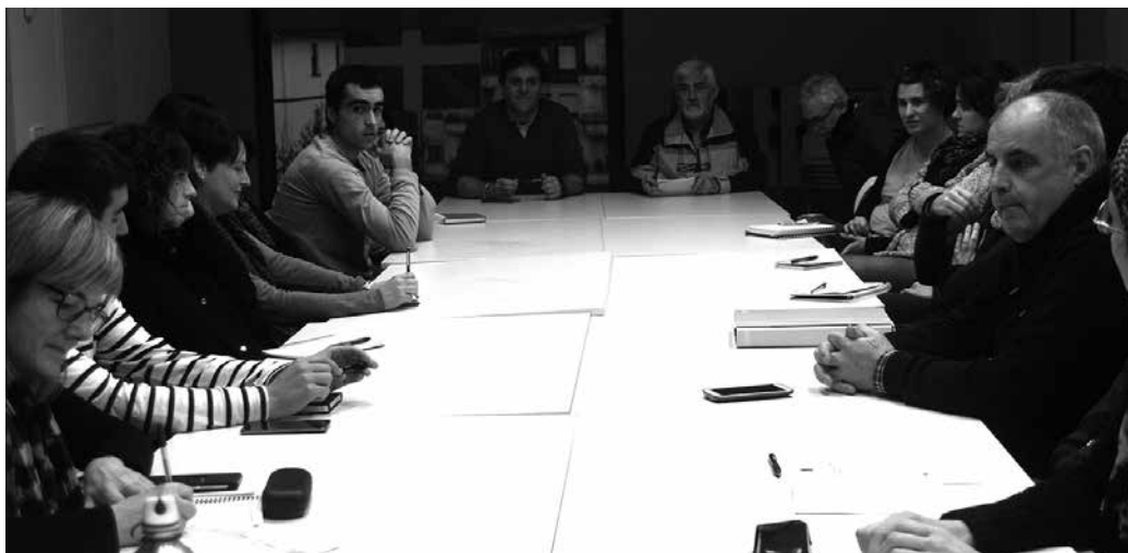
Otsailaren 2ko Kultura Aholku Batzordean herriko talde ezberdinak elkartu ziren.

Usurbilgo Udalak eta kultur eragileak biltzeko garai bateko ohitura berreskuratu zuten otsailaren 2an ospatu zen Kultura Aholku Batzarrarekin. Diru-laguntzez, edo udal materiala erabiltzeko irizpideez gain, Elhuyar nahi duten Usurbilgo kultur eta kirol eragileekin elkarlanean lantzekoa den “Zirrara: diru-laguntzen inpaktua neurtzeko metodologia” proiektua aurkeztu zuten.