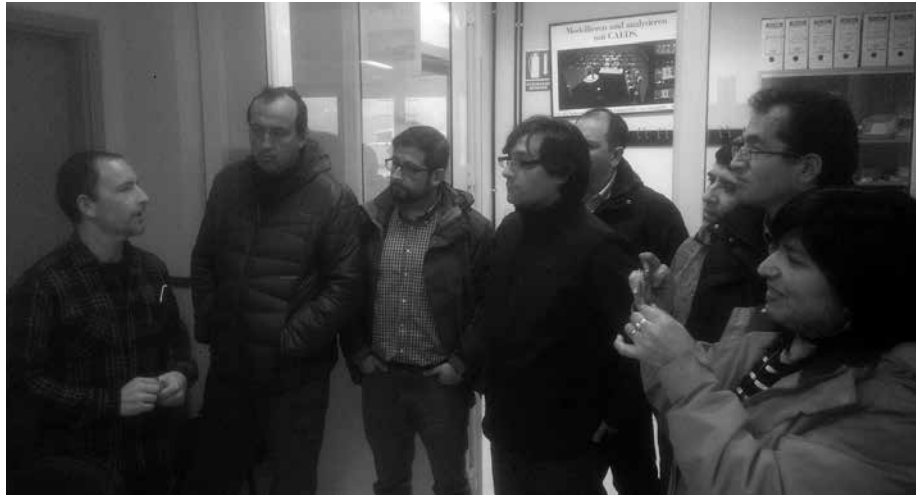
Hamar egunez izango dira Usurbilgo Lanbide Eskolako martxa jarraitzen.

Aventus lanbide heziketa eskolako hamasei irakasle izan ziren bisitan aurreko astean.