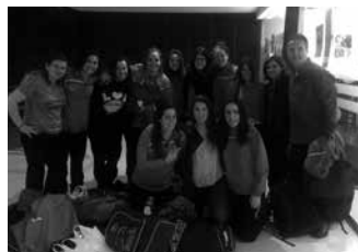
Larunbat honetan arratsaldeko 19:30ean, Usurbil KE-Aiala Zarautz.

Asteburuan promozio fasea jokatu dute usurbildarrek