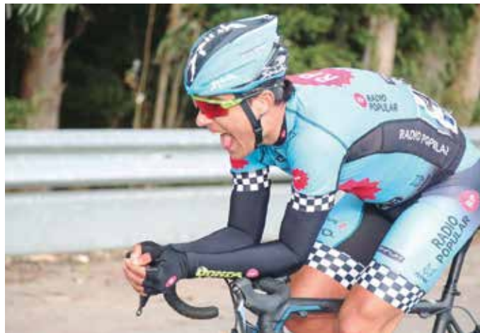
Denboraldia profesional mailan hasi du usurbildar txirrindulariak. Aurreko astean, Rádio Popular Boavista taldearekin Abertura proban aritu zen.

Iaz denboraldia Zarauzko taldean hasi nuen, 23 urtez azpikoen mailan. Lasterketetan irabazten hasi nintzenez, Baque taldearekin urte erdiz