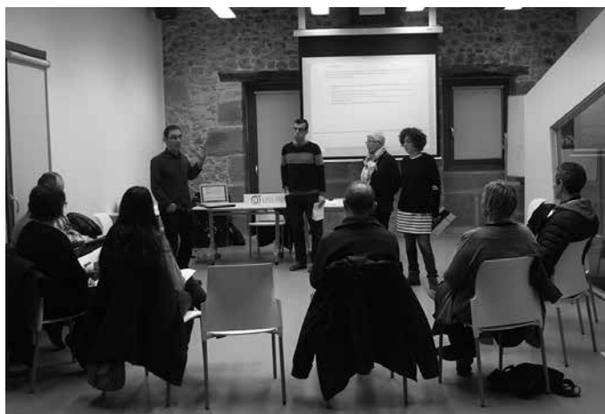
Egitasmo honen ibilbide orria usurbil.eus web orrian topatuko duzue.

“Usurbil 0.0” hondakinen kudeaketa eredu propioa izateko ibilbide orria aurkeztu eta egitasmo honetarako herritar eta eragileen ekarpenak biltzen hasi da Udala. Ondoko irudian, urtarrilaren 26an Potxoenean antolatu zuten lan saioa duzue. Gaiari buruzko informazioa eta abenduaren 22an aurkeztu zen behin behineko ibilbide-orria Usurbilgo Udalaren web orrialdean, usurbil.eus atarian duzuen “Usurbil 0.0” estekan klikatuta jaso dezakezue.