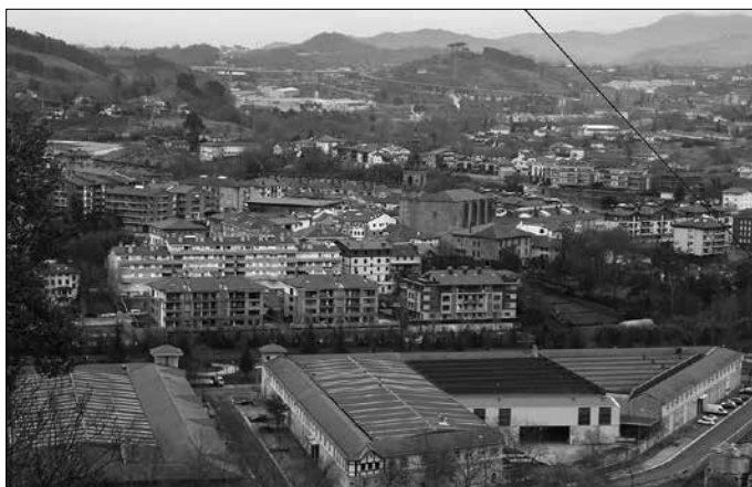
“Kualifikazio maila handiko postuetarako, lanbide heziketako formakuntza duten langileak beharko dira”.

Besteak beste, barne produktu gordina (32.000 euro per capita) edota langabezia tasa (10-12%): “Eskualdea, 70.000 biztanlerekin, erdibideko lehiakortasun mailan dago Gipuzkoako beste eskualdeekin alderatuta. Ezaugarri nagusia dibertsifikazioa da; ez dago sektore espezializazio garbirik. Denetik du pixka bat. Horrek irakurketa negatiboa izan dezake. Hau da, lehiakor den bitartean ondo ibiliko da, baina zailtasunak sortuz gero, azkar batean ataka estuan jar daiteke. Alde positiboa, historian zehar moldatzeko erakutsi duen gai-