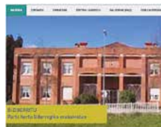
biziberritu.wixsite.com/hasiera web orria zabaldu dute.

Web orrialde honetan, besteak beste, maiatzean egingo den ikastolako Batzar Nagusian erabakitzeak gaiak pro-