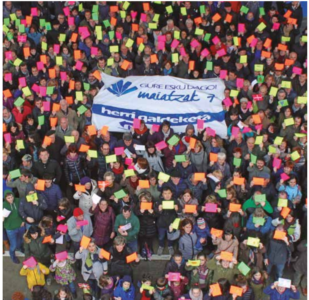
600 herritar baino gehiagoren eta 29 eragile ezberdinen babesa jaso dute Herritzartukoek.

Hau hasiera baino ez dela gogorarazten dute. “Asko gara eta pozik gaude, baina gehiago izan nahi dugu”, diote. Atxikimenduak biltzeko epeak zabalik segiko du datozen hilabeteotan, baina aldi berean, maiatzaren 7ko galdeketa antolatzen segitzeko urrats berriak ematen hastera doa Herritzartu. Hilaren 5eko argazki erraldoiarekin bigarren faseari ekingo diote orain; galdera adosteari. Lanketa honetarako hilabete pasatzoko tar-