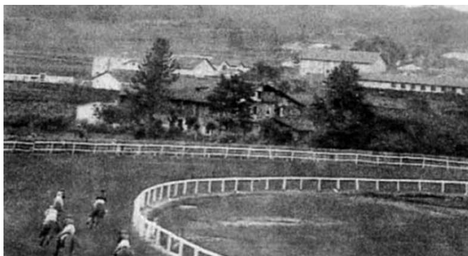
Zubietako Artutxa baserrian jaio zen. Irudian ageri da. Gaur desagertua dago.