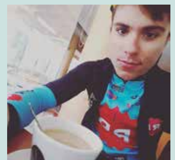
Bi klasika eta Algarveko Itzulia egingo ditu denboraldiaren lehen zatian.