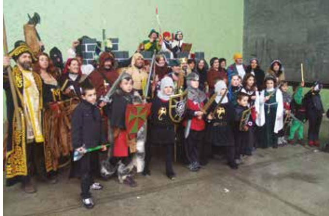
Otsailaren 25ean, Inauteri Jaiak Usurbilen. Bezperan, Udarregi ikastolako ikasleak izango dira mozorrotuko direnak.