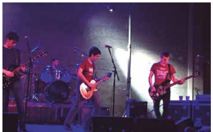
The Hastelen's, Huntza eta Zaparra taldeek girotu zuten Hurbilagok antolaturiko 'Bizi Kalea' festa.