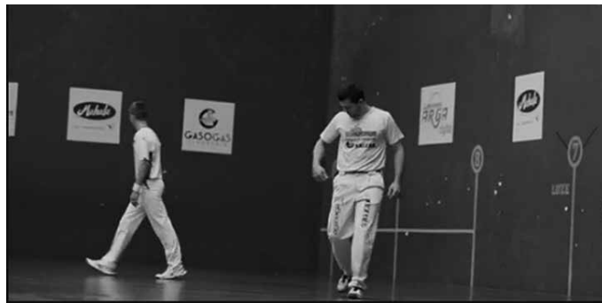
Aurrera Tolosak atera baina Pagazpeko pilotariak erantzun ez. Horrela egin zuten protesta Pagazpekoek.

Igandean zen jokatzekoa Euskal Herriko 3. Klub Artek Nazio Txapelketako finala, bertan behera geratu zen azkenean. Usurbilgo Pagazpe elkarte eta Aurrera Tolosa taldeak lehiatzekoak ziren Amezketako frontoian, baina aurreikusitako zeuden hiru partidetatik bakarria baino ez zen jokaterik izan, usurbildarrek egin zuten protesta ekintzagatik.