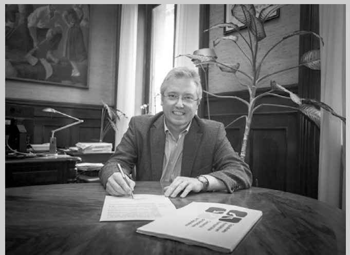
2019rako eraikia eta probetan izatea nahi dute.