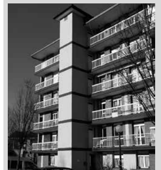
Igogailuen kasuan, eskaera bakoitzeko diru laguntza gehienez 1.000 eurokoa izango da.

Bada ordea berrikuntza bat aurten. Etxean igogailua jartzeko diru-laguntza ere eskatu ahalko baita. Horretarako, Udalak guztira 10.000 euroko diru-partida erreserbatu du. Zenbait baldintza bete beharko dira ordea, laguntza honen onuraduna izateko. "Instalazioak 2016an jaso beharko luke Usurbilgo Udalak emandako obra amaiera ziurtagiria, eta balizko onuradunek sei hilabeteko antzinasunarekin erroldatuta egon eta bertan bizi beharko dute. Horrez gain, udalerrri berean igogailua duen bigarren etxebizitzaren jabe ez izatea beharrezkoa izango da. Diru laguntza honetarako, Gipuzkoako Aldizkari Ofizialean argitaratu eta hiru hilabeteko epean aurkeztu beharko dira eskariak. Eskaera bakoitzeko diru laguntza, gehienez, 1.000 eurokoa izango da", ohartarazi du Udalak.