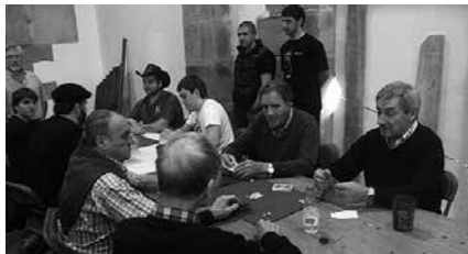
Larunbat honetan, Aginagako Eliza Zaharrean. Izen-ematea 15:30ean hasiko da.

Mus txapelketan: Lehen saria: Txapela, Bi arkume eta bi txangurru. Bigarren sa-