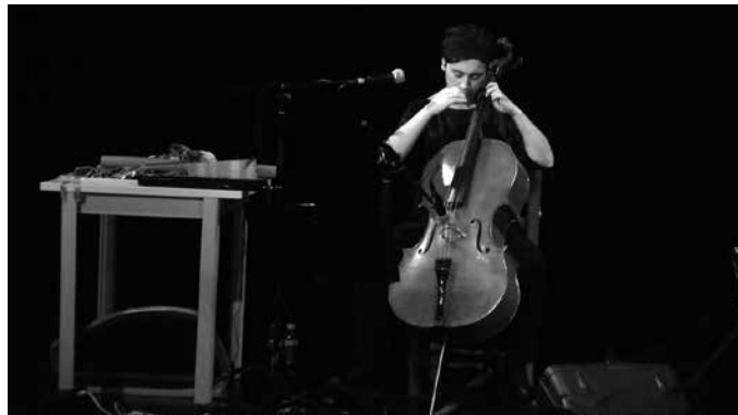
Aurten, diru kopuru hori bideratuko du kultura, kirola, gizartegintza, nekazaritza eta abeltzaintza, ingurumen eta igogailuen instalakuntza proiektuak sustatzera.

Guztira honenbestez, 168.000 euro bideratuko ditu Udalak, usurbildar norbanako nahiz eragileen egitasmoak laguntzera. Honakoa izango da diru-laguntza deialdiak jorratuko duen bidea. "Usurbilgo Udalak 2017 urteari dagozkion diru laguntzen deialdi orokorra ireki du dagoeneko. Diru-laguntza hauek norgehiagoka erregimenean erabakiko dira eta 168.000 euroko diru partida erabiliko du Udalak zeregin