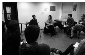
20 urtetik 35 urtera bitarteko gazteei zuzendua dago ekimen hau.

Gazte enplegua sustatzeko, Garapen Agentzien Euskal Elkarteak 6.000.000 euroko ekarpena egin du. 2014-2020 aldirako Euskadiko Programa Operatiboan kokatzen da proiektua, eta Europako Gizarte Funtsak finantzatzen du %50ean, eskualde-garapeneko 20 agentzien parte-hartzearekin.