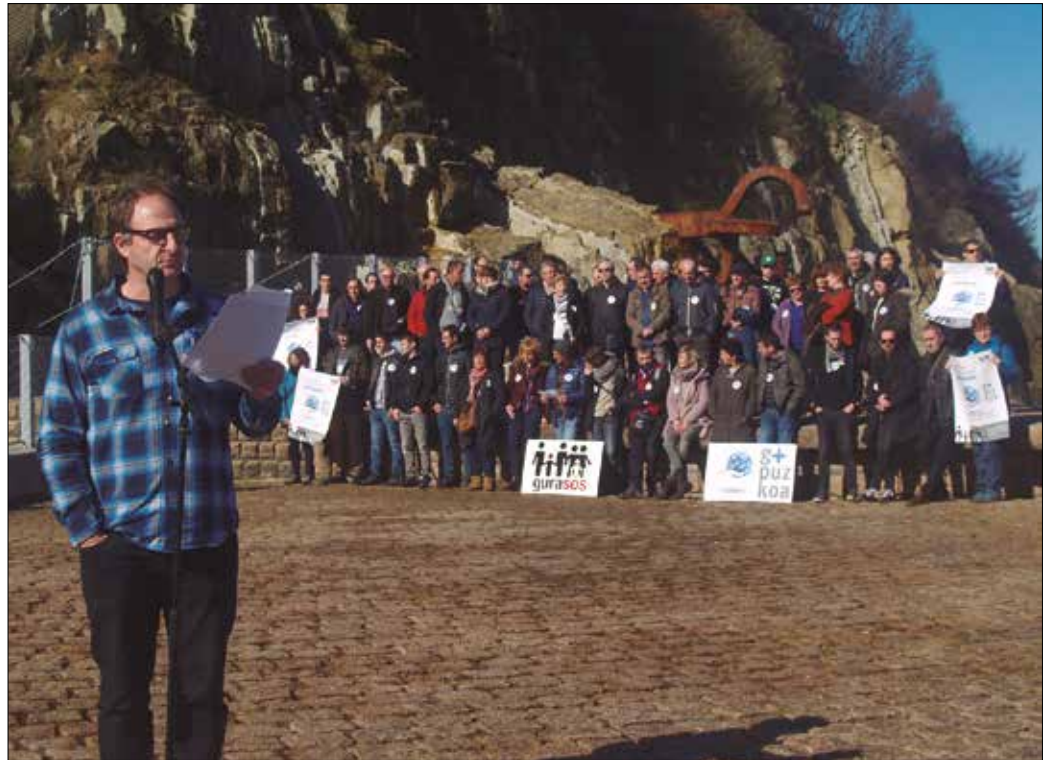
Igande honetan, Donostiako Artzai Onaren Katedraletik abiatuko da manifestazioa eguerdiko 12:00etan.

Iganderako deitu duten mobilizazioa, ez erraustegiaren aurkakoa ezta foru gobernua- ren aurkakoa ez dela izango nabarmendu dute. GuraSOSek landu eta aurkeztua duen bide-orria babestean, hondakinen kudeaketaren gaiari guztion artean irtenbide adostu bat ematearen aldekoa baizik. Horregatik, konponbide adostu batera heltzeko, “adostasun batera eramango gaituen gizarte eztabaida bat beharrezkoa dela uste dugu. Gehiengo lortuta ere inposizioak baliorik ez dutelako. Etiketarik gabeko gizartearen lekua aldarrikatu nahi dugu. Demokrazia aberastu nahi dugu zuzeneko parte hartzearen bidez. Zubiak eraiki