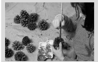
Otsailaren 28a baino lehen bidali behar dira kurrikulumak.

Aginagako Guraso Elkarteak begirale lan-poltsa osatu nahi du. "Aginagan antolatzen diren Gabonetako, Aste Santuetako eta udako txokoetarako eta baita goizetako zaintza zerbitzurako ere. Bidali zuen kurrikulumak aginata@eskolatxikiak.org emailera otsailaren 28a baino lehen".