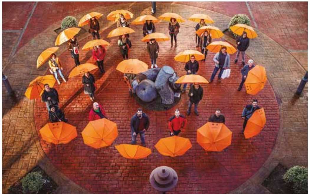
Doan hartu, erabili eta berriro itzultzeko aterkiak ipini ditu Hurbilagok bere bezero guztientzat.

“Bezeroari zerbitzu eta tratua on bat eskaini nahian, Usurbil bertako denda eta establezimendu txikiek abian jarriko duten ekimen honek, oinarrian badu esanahi bat ere; aterkia, euritik babesteko erabiltzen