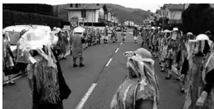
Arratsaldeko 16:00etan ekitaldia egingo dute Zubietan. Handik Lasarte-Oriara joko dute.