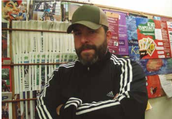
Otsailaren 25eko Inauteri Jaian arituko da Dj lanetan. Bezperan, Udarregi ikastolako ikasleak izango dira mozorrotuko direnak.

Musika entzule fina dugu aginagarra. Ez du bolo-bolo dabilen kantu hori entzun nahi izaten. Nahiago du abesti sortu berriari bere ibilbidea egiten uztea, “klasikoan” bihurtzean