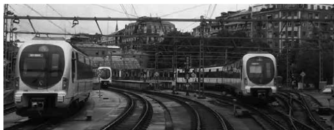
Ostiral honetan lan uzteak ordu hauetan izango dira: 6:25-8:35-17:25-19:35 .

■ Otsailak 27 astelehena: 7:25-9:35/18:25-20:35.