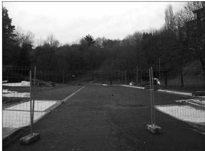
Lanak martxan dira. Ez dute baztertzen etorkizunean gunea handitzea.

Fase berri honen "helburu nagusia aparkaleku kopurua handitzea izango da. Mendebaldean ezarritako aparkaleku lerro zuzena aldatu eta bateriako lerro bat jarriko da. Fase honen exekuzioa sinpleagoa izango da aurrenekoa baino, instalazio eta ekipamendu guztiak aurretik prestatuak izango baitira", iragarri du Usurbilgo Udalak. Lasuen Construccionesek bideratuko dituen lanok, 13.830,05