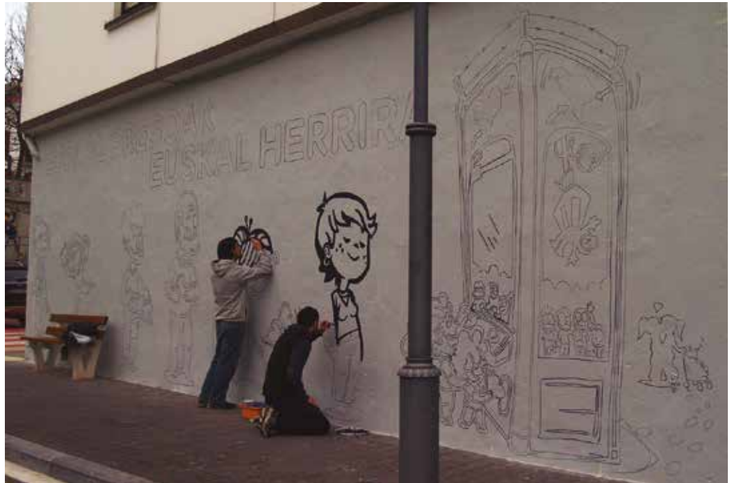
Muralak landu eta diseinu grafikoaren eremuan aritzen da Ugarrri taldea.

Txanponak botatzeko makina bat marrazten ari direla ikusiko duzue. Bertatik, noiz edo noiz panpinen bat ateratzen duen makina bat da. Espetxe barruan preso segitzen