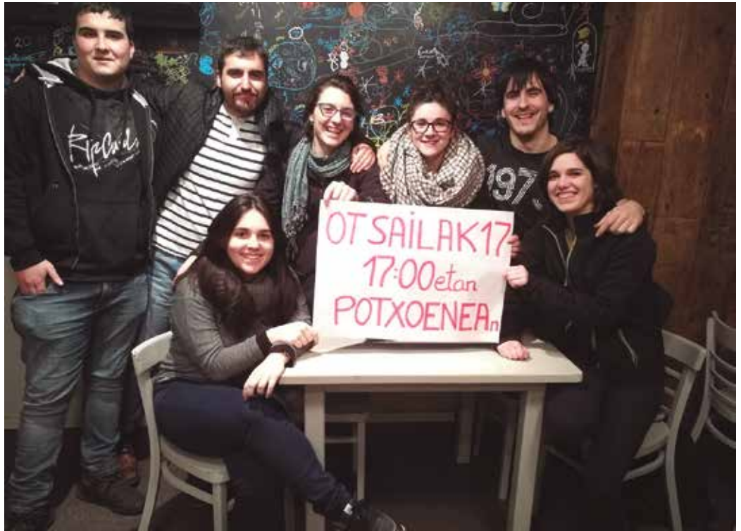
“Bertaratzeko gonbita luzatzen dizugu, Usurbilen ere gazteok baditugulako kezkak eta ezintasunak, ametsak eta beldurrak. Baditugu beraz, Alternatibak sortzeko baldintzak”.

“Hamaika dira aurrera eraman daitezkeen proiektuak, eta herrian ditugun gabeziei aurre egiteko, Usurbilgo gazteok proiektu horiek definitzen hastera goaz otsailaren 17an, 17:00etan, Potxoenean egingo dugun bilera irekian”, halaxe zioten aurreko asteko NOAUA!n argitara eman zuten idatzian.