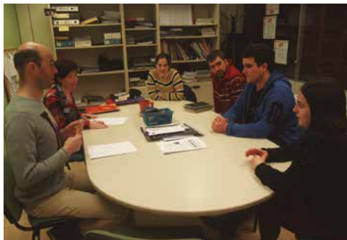
Aurreko astean batu zen Korrika Batzordea lehen aldiz. Dagoeneko zabalik da kilometroa erosteko aukera, edota Korrika Laguntzaile egiteko kanpaina.