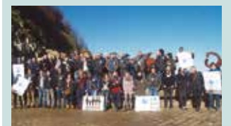
“Elkarrekin gehiago gara. Adostasuna, besterik ez” lemak zabalduko du igandeko manifestazioa.