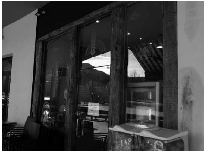
Otsailaren 8tik 9rako tartean behartu zuten Laukoteko sarbidea.

Otsailaren 8tik 9rako tartean, atea behartu zieten, baina ez zuten ezer eraman. Iazko martxoan sartu zirenean triskantza handiagoa egin zieten, beira apurru, atea behartu eta barruan zuten diru apurra eraman baitzuten. Oraingoan aldiz ez zuten dirurik utzia kafe-tegian. Azken aldian lapurreta gehiago izan dira; Zendoia eta Txapeldun tabernetan esaterako.