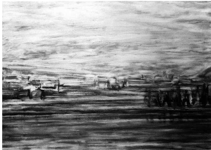
“Alejandro Tapiaren hiletatik irten ginenean, eguzkia sartuta zegoen, baina Oria inguruko paisaia ez zegoen ez isilik, ez argirik gabe”.

Ondratu hitzaren erabilera gaitzesleaz aritu naiz orain arte. Baina ondratu adjektiboak ba al du ba tokirik arteaz jarduterakoan? Hitzak karga morala du, zilegi al da ondradutasunaz mintzatzea arteaz ari garenean? Ondradutasunaz zer ulertzen den. Kulturaren alorrean ondratu izatea da leiala izatea buru-