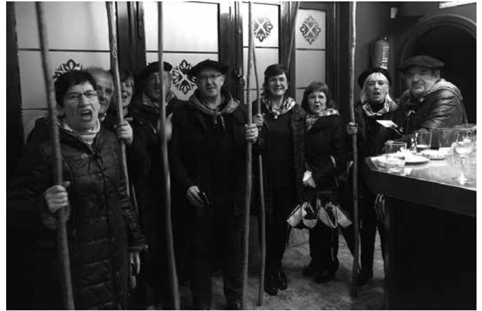
"Bederatzi laguneko talde bat osatu genuen eta bi orduz ibili ginen Santa Agedako kanta zaharrak eta koplak kantatzen".

Santa Agedako koplak zaharrak berri gabe geratu zirela idatzi genuen aurreko astean. Ez zela talderik osatzerik izan eta, horren berri emateko, iazko argazki batekin osatu genuen 'Klik batean!' atala. Ba ez ginen zuzen ibili. Irakurle ba-