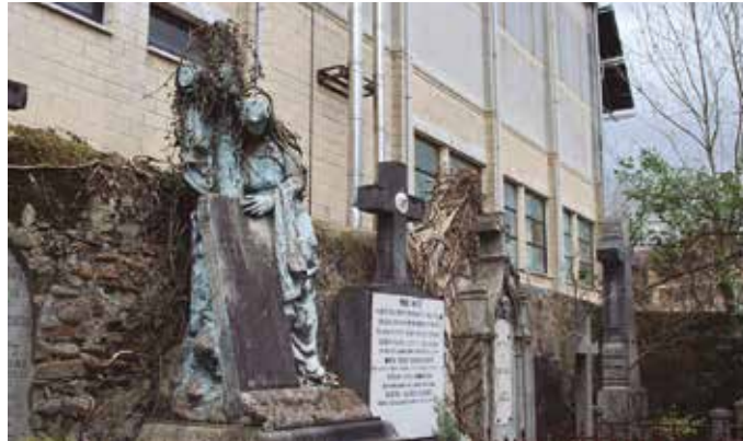
Hilerrri zaharra azaroan itxiko da behin betiko. Familiak hilerrri zaharretik berreskuratzen ez dituzten gorpuzkiak erraustu egingo dira. Ondoren, hilerrri berriko Errautsen Parkean eramango dituzte.

Espazio berri horrek hileta zibilak era irekian egiteko aukera eskainiko du. Orotara, handitze obrek 120.000 euroko aurrekontua izango dute eta aurten ber-