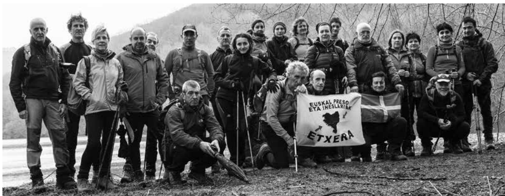
Andatza KE-ko kideek Bidasoako Kontrabandistak ibilbideko bigarren etapa osatu zuten aurreko igandean.

Spainiaiko Txapelketa, torneo pribatuak, dirua... Gai asko nahastu dira polemika honetan. “Egunkari desberdinetan erruduntzat jartzen dituzuen arrazoiak beti izan dira pilotan”, diote Pagazpekoek beren komunikatuan. “Pilota ez da atzo asmatua eta pilotariak beti murgildu izan dira ongi zurrumbilo honetan. Baina sekula ezagutu ez duguna horrelako antolakuntza bat. Bertako baten jarrera autoritario eta errespetu faltek ez dute lagundu egia esan. Igandean (otsailak 5) kadeteekin joateko egin zitzaigun luzapena adibide garbi bat da”.