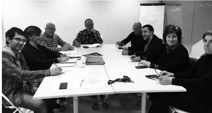
“Galdera zehazteko ardura hartu duen lantaldea anitza da eta herritar orori irekita dago”, halaxe aitortu digu Herritzartu taldeak.

Otsaila amaieran, batzar irekia Behin proposamenak jaso eta aztertu ondoren, Herritzartu-