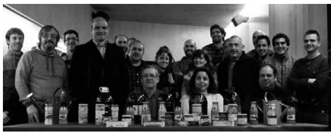
errigora.eus web orrian edo NOUA!n egin daitezke eskaerak.