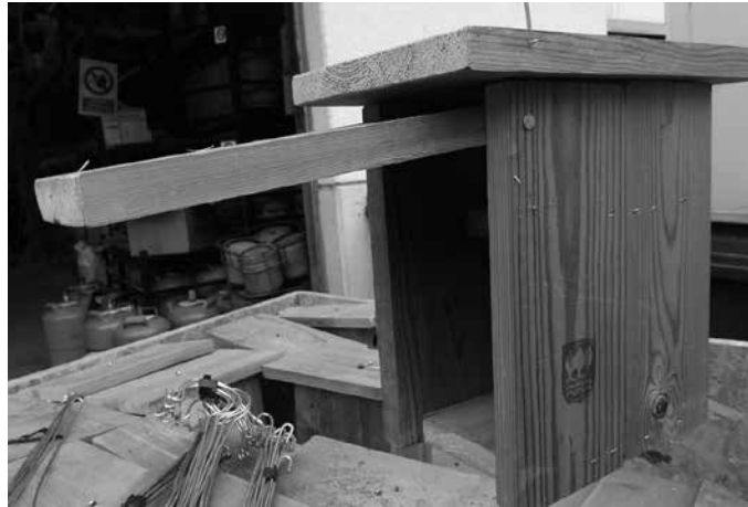
Alkartasuna Nekazal Kooperatibaren eskura daitezke, doan.

2-5 metro arteko altueran jarri, hegoekialdera begira, pixka bat aurrerantz inklinatua, inor bertara ez iristeko