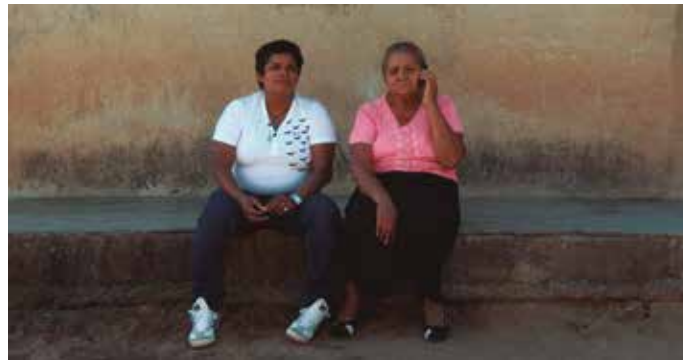
“En tránsito” filma igande honetan emango dute Sutegin.

Nikaragua eta Euskal Herria artean grabaturiko ikus-entzunezko lan honetan, handik hona ezinbestean, etorkizun hobe baten bila, haur nahiz helduen zaintza eta etxeko lanak egitera datozen emakumeen bizimodua eta sorterrian uzten dituzten senideena erre-