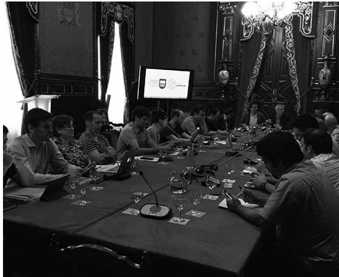
Irudian, GHK-ko bilkura bat.