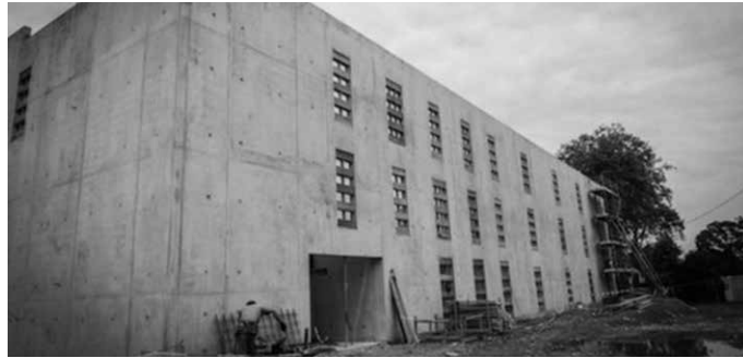
450 ikasleentzako lizeoa eraiki eta hornitzeko laguntza premian dira.