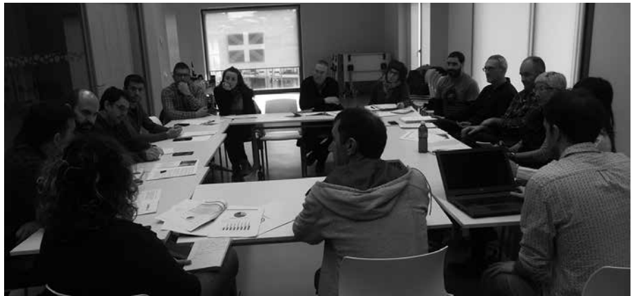
Herrialdeko hainbat udal ordezkari Potxoenean batu ziren, “Usurbil 0.0” egitasmoa ezagutzeko xedez.

N-634 errepidearen egoera berraztertzeko bilera egin zuten Usurbilgo Udalak eta Gipuzkoako Foru Aldundiko Bide Azpiegitu-