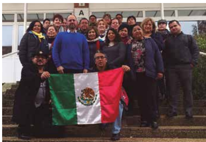
Mexikoko irakasle talde bat izan da egunotan Zubietan.

Irakasle hauen hitzetan oso esperientzia aberasgarria izan da. Usurbilgo Lanbide Eskolan ezagututakoa bere eskoletan jorratuko dutela adierazi dute.