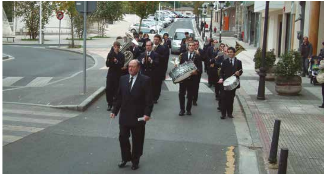
Azkoitiko Musika Banda arituko da martxoaren 26an.

■ Martxoak 25, 12:00 Zumarteko pop-rock taldeen kontzertua Mikel Laboa plazan.