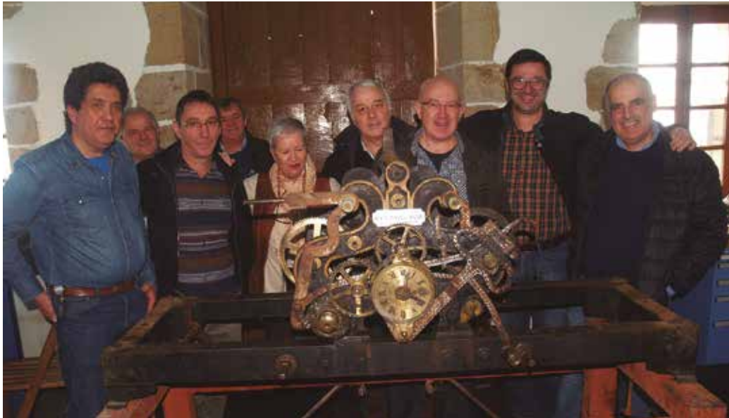
Erlojua berritzeko lankidetzak hitzarmena sinatua dute Usurbilgo Udalak eta Salbatore Parrokiak.

1912an muntatu eta martxan jarri zuten Salbatore Parrokiako erlojua zaharberritu eta lehengoratzeko doaz auzolanean. Egitasmo honetan lankidetzan jardungo dute, batetik hitzarmena sinatua duten Usurbilgo Udalak eta Salbatore Parrokiak; 1912an Usurbilgo elizako ordularia muntatu eta garai hartan eginiko lanen ondarea gizarteratzen ari den Yeregui familiako egungo kideek osaturiko elkarteak; Usurbilgo Lanbide Eskola eta egitasmo honen sustatzaile nagusietakoa den “Erlojeruak”, bolondres lanetan jardungo duen herritar taldea.