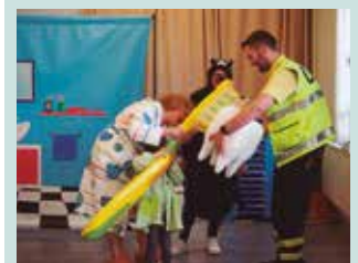
Martxoaren 17an, 17:30ean.

Martxelina eta Bitxi paila-zoek gorputz garbitasunari buruzko saioa eskainiko dute martxoaren 17an ostirala, 17:30ean Bihurri ludotekan.