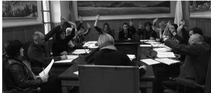
EHBilduren mozioa PSEren ekarpenarekin osatu ondoren, ahobatez onartu zen.

EHBilduk gai honen inguruan aurkeztu zuen mozioak udal ordezkari guztien babes jaso zuen, egoki-