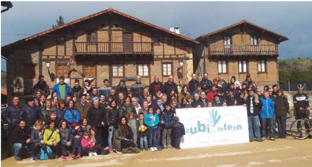
Aurreko larunbatean aurkeztu zuten ekimena.

Zubietar moduan “parte hartu nahi dugu, erabakitze eskubidearen alde gaudelako. Gure etorkizunari buruz, guk hitza hartu nahi dugulako”. Eta hitza, maiatzaren 7rako antolatzen ari diren galdeketa propioan hartuko dute zubietarrek.