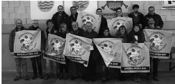
Erraustegiari alternatiba aurkeztuko diote, eta hura babesteko manifestaziora deitu dituzte herritarrak: martxoaren 25ean Donostian.

Alternatiba hau babesteko gainera, atxikimendu bilketari ekingo diote. Eta manifestazio erraldoia deitu dute, martxoaren 25erako, larunbata, Donostian. Arratsaldeko 17:00etan abiatuko da Anoeta futbol zelai paretik. Leku berean, baina astebete lehenago martxoaren 18an aurkeztuko dute mobilizazio handi hau, herritarren parte hartzearekin deitu duten prentsaurreko masiboan. Honatx beraz Erraustegitaren Aurkako Mugimenduari datozen deialdiak: