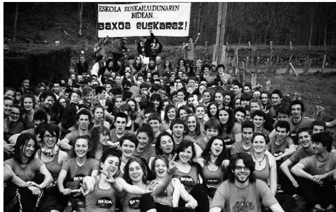
300.000 euro behar dituzte egoitza berria hornitzeko.