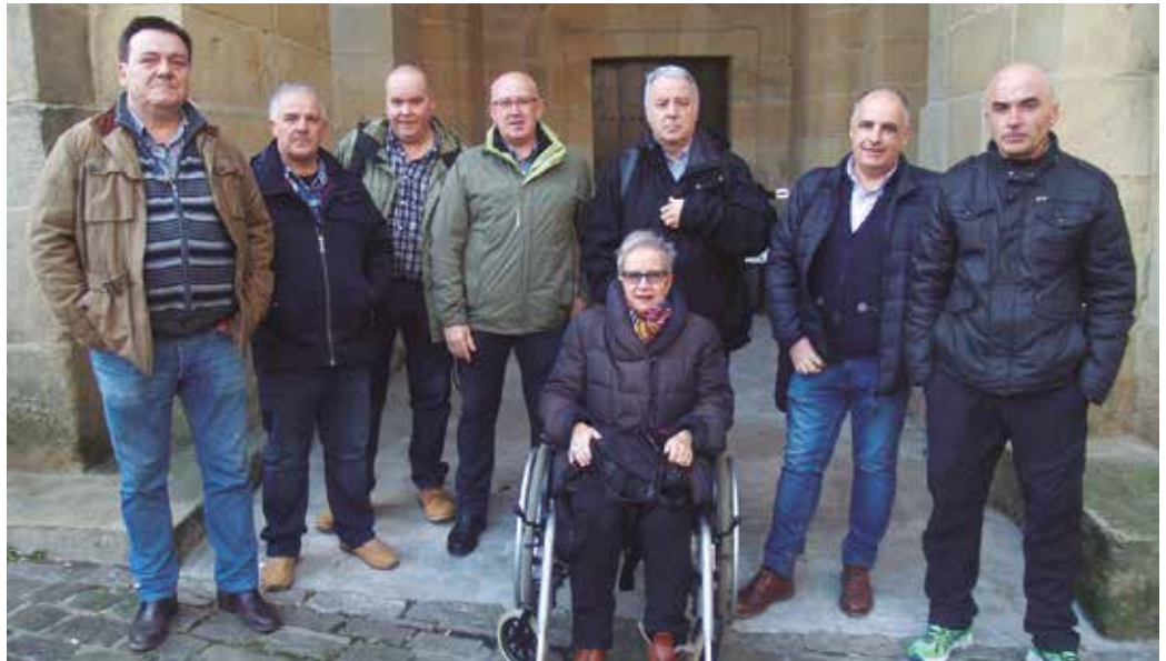
Herritar talde baten ekimenez, Salbatore Parrokiako erloju zaharra berritzera doaz.

Bere lanak, Aginaga, edota “Aguinaga de Usurbil” izena-