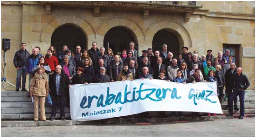
Atzoko eta gaurko udal hautetsi gehienek Herritzarturen ekimenarekin bat egin dute.

1979tik honako garai eta alderdi ezberdinetako hautetsiek beren babesa adierazi diote Herritzartu plataformari. “Gure sinaduraren bidez, babesa eta bul-tzada ematen diogu Usurbilen maiatzaren 7an egingo den herri kontsultari. Herriak hitza hartzeko garaia iritsi da”, hala adierazi zuten igande eguerdian udaletxe aurrean egin zen ekitaldian.