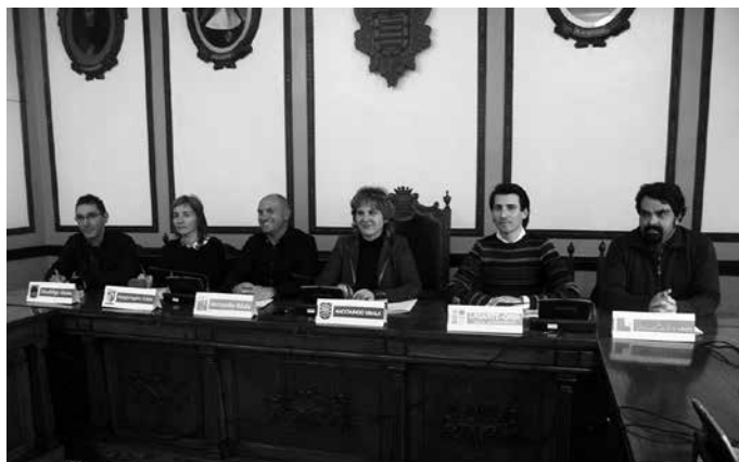
Beterri-Buruntzako alkateek lankidetzaren hitzarmena sinatu zuten.

Gipuzkoako Foru Aldundiak gipuzkoarren partaidetzarako erakunde arteko espazio bat sortzeari buruzko Foru Dekretua onartu zuen joan den urtarrilaren 17an. Partaidetzaren eremuan udalerrirarteko sarea osatzea da asmoa. Usurbilgo Udalak erakunde arteko espa-