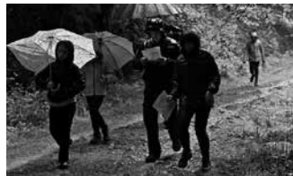
Gipuzkoako Orientazio Ligako laugarren proba izango da.

Gipuzkoako Orientazio Taldeak azarotik ekainera antolatutako 2. Gipuzkoako Orientazio Ligako laugarren proba, Andatza mendiaren magalean, Txokoalde inguruan ospatuko da martxoaren 19an.