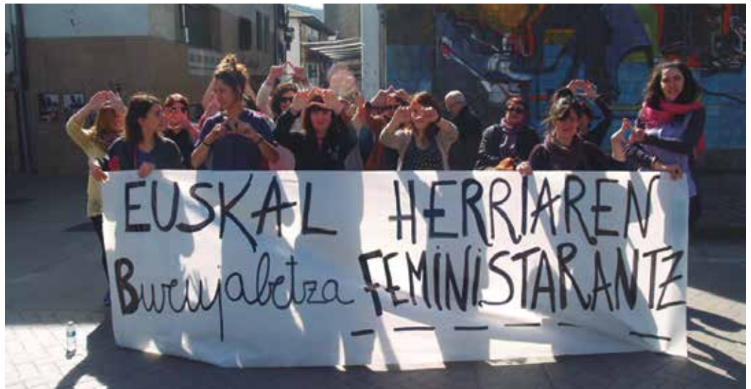
Emakumeen Egunari begirako mozioa onartu zuen aho batez Usurbilgo Udalak.

Aurtengo Martxoaren 8ari begirako mozioak, erabakitze guneetan gizon eta emakumeen arteko parte hartze orekatua bermatzea sustatu nahi du. Esparru publikoan azken urteotako murrizketek desoreka honetan sakontzea eragin duela nabarmentzen du testuak eta hainbat datu aipatzen ditu. EAE-ko alkateen %24,7 dira emakumezkoak eta herritarren %18,82 ordezkatzeko dute. 2015ean alderdi politikoei %32,58an soilik aukeratu zituzten emakumeak hauteskunde-zerrendako zerrendaburu. Emakumeak abiadura motelagoz igotzen dira maila eta denbora gutxiagoz irauten dute lidergoan. Elkarrekin “tradizioz rol femeninoa duten elkarrekin gehiago dira emakumeak”. Gutxiago gainerakoetan. Emakumeen elkarrekin aurre-