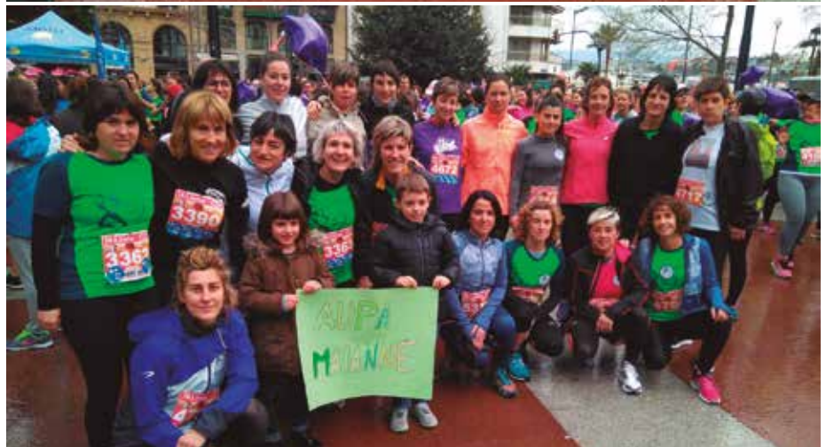
Gero eta gehiago dira Lilatoia egitera animatzen direnak. Aurten, 4.821 emakume.