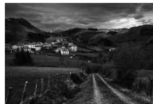
Beintzako herrian amaituko dute igandeko irteera.