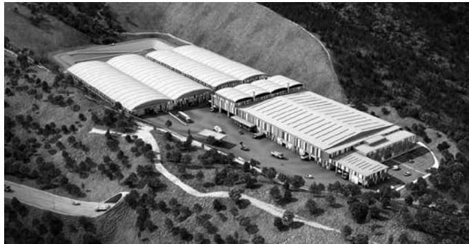
Errausketaren Aurkako Mugimenduak erraustegia alboratu eta Tratamendu Mekaniko Biologikorako (TMB) planta eraikitzea proposatzen du.

Gainerako hondakin zati birziklagarrien tratamendua (papera eta kartoia, beira eta ontzi arinak) hobetzea ezinbestekoa dela nabarmentzen