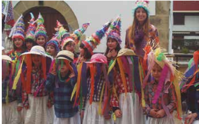
Aginagako Eskola Txikiko ikasleak txantxoz mozorrotu ziren Inauterietan.

Egin duen azterketa NOAUA!ko irakurleokin partekatzeaz gain, kaxoi batean gorde asmo du. Datuok eguneratzen joan nahiko luke eta urte batzuk barru, egin duen lanketa eredu gisa hartuta, datu bilketa egin berriz. Egun dituen zenba-