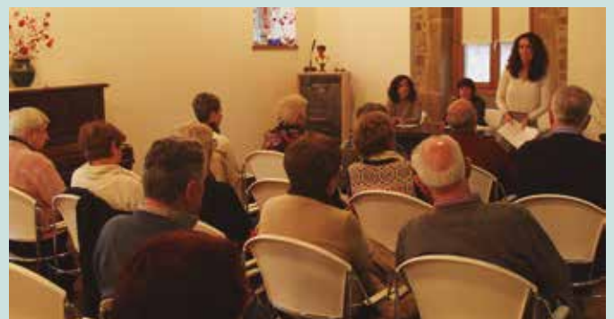
Astelehenean “Ekonomia, interes tipoa” izeneko hitzaldia egin zen Artzabalen.

■ 14:00 Bazkaria Atxegan. Antolatzailea: Gure Pakea Elkarte.