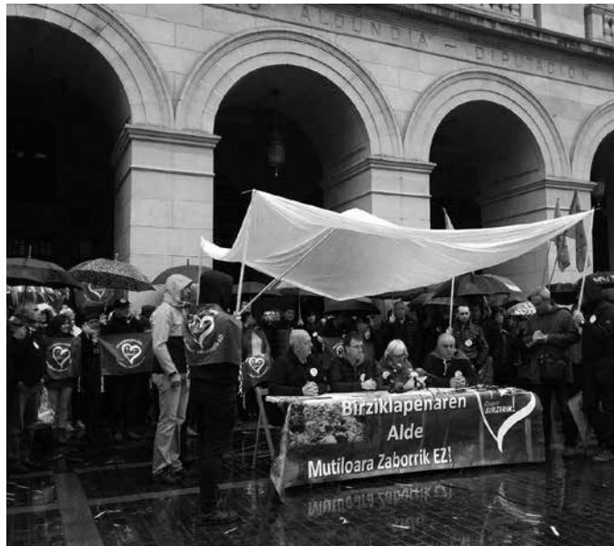
Mutiloako Lurpe zabortegira Gipuzkoako errefusa eramateko hartutako erabakiaren aurka protesta egin zuten igandean.

Birziklapenaren aldeko mobilizazioa ere izan zen martxoaren 12koa. Erraustegiarekin birziklatzea Europak ezarritako gutxiengoetara mugatuko dela ohartarazten dute. Horregatik, hondakinak murriztu eta sortutakoa ahalik eta gehien birziklatzeko neurriak abiatzea eskatzen diote Aldundiari. “Egin dezagun denon artean benetako ahalegina banaketa gainditu eta azken