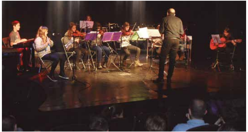
Zumarteko pop rock taldeen kontzertua Mikel Laboa plazan izango da. Martxoaren 25ean, eguerdiko 12:00etan.