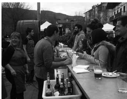
Eguerdiko 15:00ak arte luzatuko da festa.

Gastronomia, musika, mokaduak, po-teak, azokak, zozketak... Eta honakoan, Herrizarturen tonbola. Antolatzaileak: Hurbilago eta Hurbilago Elkarteko tabernariak, Usurbilgo Udalaren laguntzarekin.