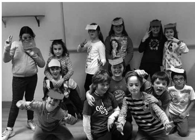
Asteburuan egindako lan guztiaren erakusgarri izan zen Hondarribiko Amute auzoko Kaputxinoen Elizan eskaini zuten kontzertua.