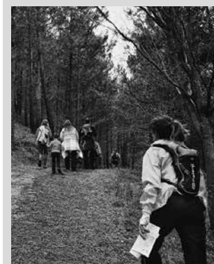
Txokoaldeko pilotalekutik abiatuko dira igande honetan goizeko 9:30ean.