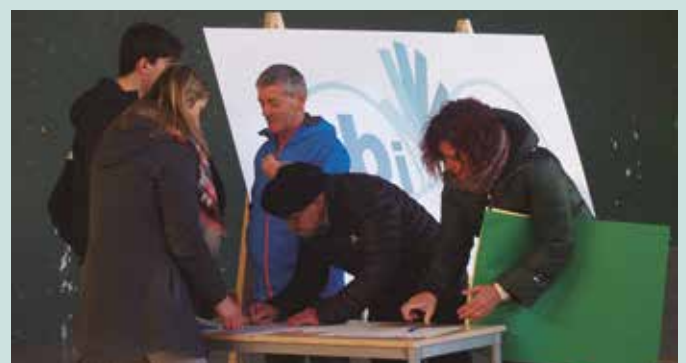
Zubietan ere, maiatzaren 7an egingo da herri galdeketa.

Bideotatik eman diezaioketue zuen atxikimendua manifestuari eta baita galdera proposatu ere: zubiartean@gmail.com Facebook: Zubiartean