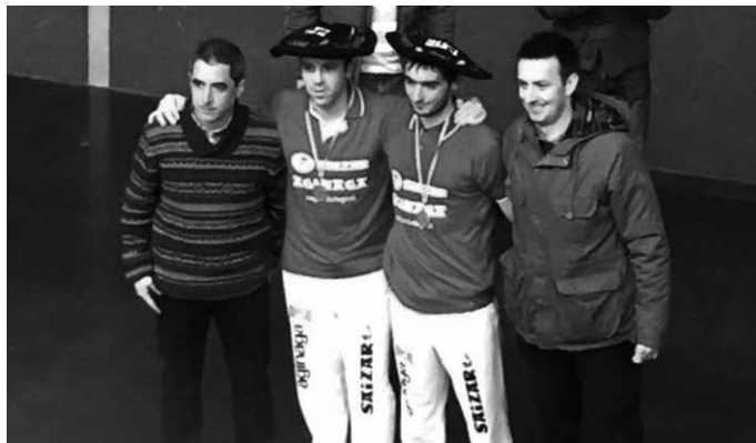
Arruti eta Millet, sariak eskuratu berritan.

dute Arrutik eta Milletek. Gipuzkoako Kluben Arteko Txapelketan ere onenak izan ziren.