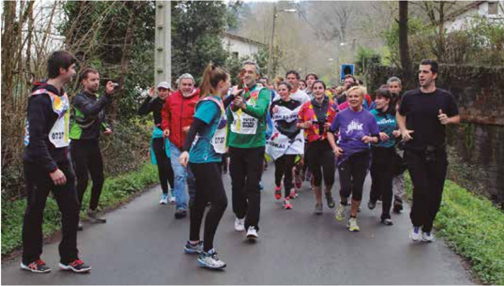
NOAUA!ko lekukoa eramango duen bazkidea nahi al duzu izan? Jarri gurekin harremanetan.