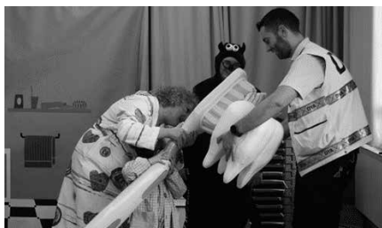
Ostiral honetan, Bihurri Ludotekan 17:30ean.

"Parte hartuko duten antzezleen aurkezpena egingo da, eta ondoren, sorosleek argi eta garbi azalduko dituzte jarraitu beharreko pausoak: eskuak garbitzea, dutxa, hortzak garbitzea". Ostiral honetan 17:30ean, Bihurri ludotekak antolatuta.