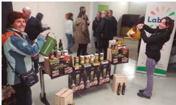
Oliba olio bidaien banaketa martxoaren 30 eta 31 aldera bideratuko da. Kontserbena, ekaina hasieran.

Martxoaren 14ra arte eska zentzaketan, Nafarroa hegoaldean ekoiztiko oliba olio bidaiak eta kontserbak. Errigoraren elkartasun kanpainako oliba olio bidaien banaketa martxoaren 30 eta 31 aldera bideratuko dugu. Kontserbena ekaina hasieran. Jasotakoan eskatu dituzuenekin hartuemanetan jarriko gara. Ordainketak produktuok jasotzerakoan egin beharko dira. Informazio gehiago: errigora.eus