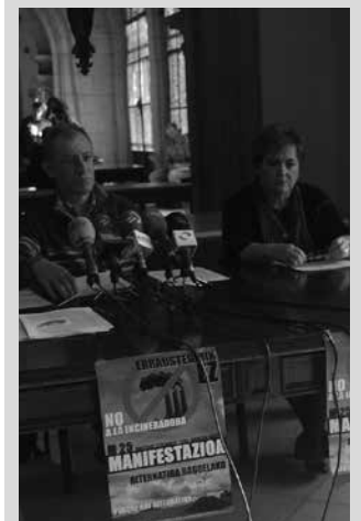
Erraustegiaren aurreko alternatiba babesteko manifestazioa Donostiako Anoeta futbol zelai paretik abiatuko da.