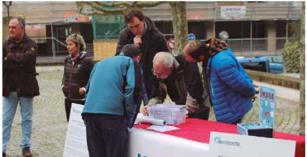
Igande honetan, Herritzartukoek galdeketaaren aldeko tonbola ipiniko dute Bizi Kalea festan. Kontsultarako galdera ere aurkeztuko dute, eta baita prozesu osoa girotuko duen kantua ere. Hori dena Munalurran izango da.

Tonbolarekin batera, maiatzaren 7ko kontsultarako galdera eta abestia ere aurkeztuko ditu Herritzartuk. Abestia, herriko musikariek sortu dute erabakitze eskubidearen egun han-