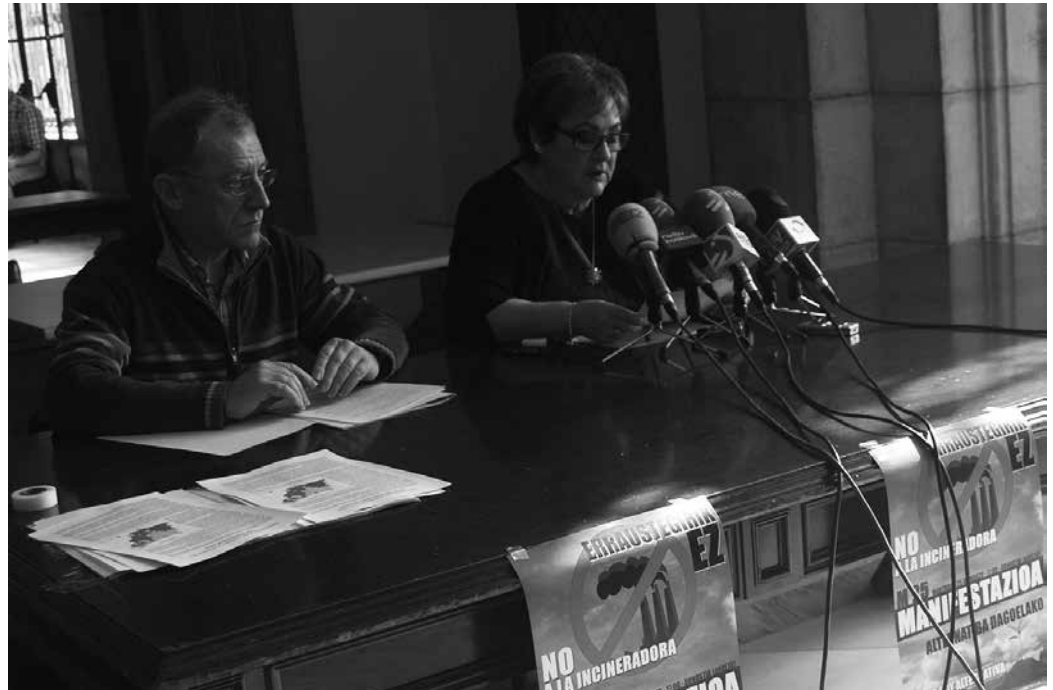
2011-2015 legealdian Gipuzkoako Hondakinen Kontsortzioak landua zuen proiektuaren aldeko apustua berretsi dute.

Errausketaren Aurkako Mugimenduko ordezkariak Donostian zioten moduan, aurreko legealdian Gipuzkoako Hondakinen Kontsortzioak (GHK) landua izan baina “kaxoian gordea duten” alternatiba da aurkeztu dutena. Erraustegia guztiz alboratzen duena. Eguno Gipuzkoako Foru Aldundiak 2019rako Zubietan eraiki asmo duen errauste planta baino errazago eta azkarrago egingarri bilaka dezakeen alternatiba. Hondakinen kudeaketari irtenbide merkeago eta osasuntsuagoa emango diona. Aurreko