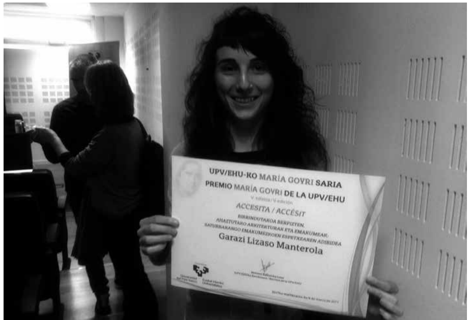
Master amaierako lanetan genero ikuspegia barne hartzen dituen lanak nabarmentzen ditu Maria Goyri Sariketak.