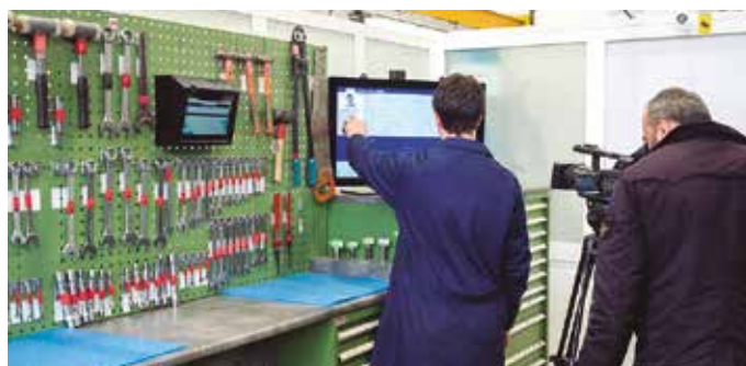
Grabatu duten erreportajea apirilaren hasieran eskainiko dute.

taideek bi urtez egindako lanaren ondorio da biltegia. “Lehenengo urtean biltegia-