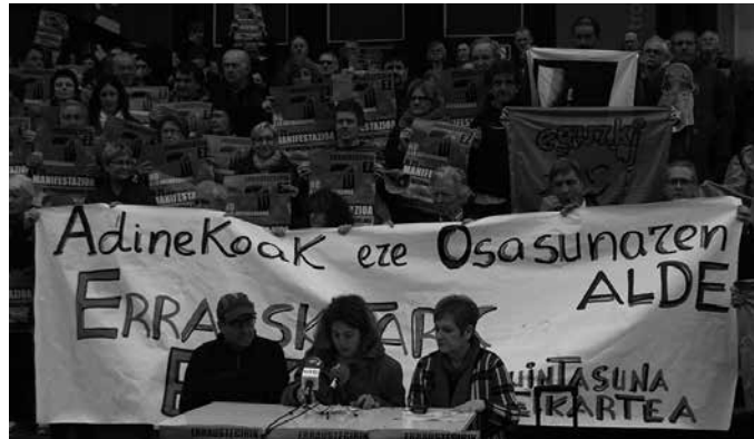
80 eragileek baino gehiagok babesa adierazia diote Errausketaren Aurkako Mugimenduak larunbaterako Donostian deitu duen manifestazioari.

“Alternatiba dagoelako, errausketarik ez” aldarripean egingo den mobilizazioak Donostia erdiguneko kaleak zeharkatuko ditu 17:00etan Anoetatik abiatu eta Bulebarrreraino. “Manifestazio handia izatea nahi genuke. Hor bilduko gara “erraustegirik ez” esateko eta beste jendarte eredu bat aldarrikatzeko”, iragarri dute. Gipuzkoako Foru Aldundian agintean diren alderdiei mezu argia helarazi nahi diete: “Gelditu ezazue proiektua, hartu ezazue hondakinen kudeaketa onaren norabidea. Egin kasu herritarrok eskatzen dizuegunari”.