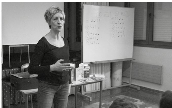
Guraso, hezitzaile, irakasle eta bitartekariak zuzendutako saioa eskainiko du.

Apirilaren 26an asteazkena, Miren Gorrotategiren "33 ez- kil" eleberria aztertuko dute 19:00etan Sutegi udal liburu-