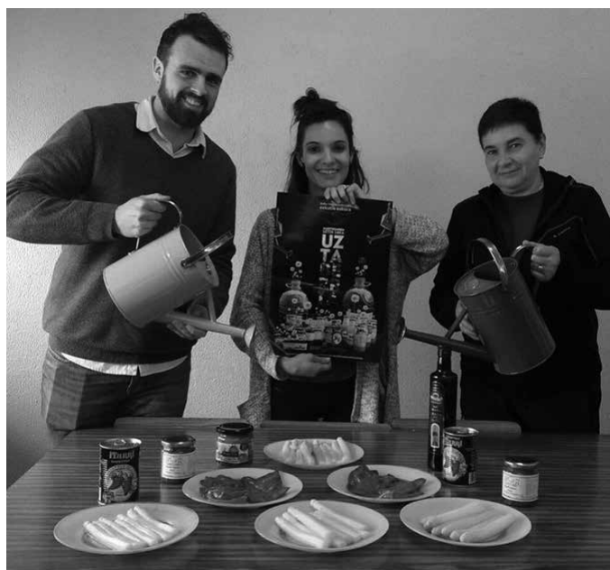
Oliba olio bidoiak martxoaren 30 eta 31n banatuko ditugu NOAUA!n bertan. Kontserbak, ekainaren 1 eta 2an.

Esku-orrien bidez 30 eskaera eta Internetez beste 22 eskaera jaso ditugu NOAUA!n. Guztira honenbestez, 52 lagunek eskatu dituzte, Errigorak abian jarritako "Uztaberria" elkartasun kanpainen baitan, eskuragarri zeuden Nafarroa hegoaldean ekotzitako oliba-olio bidoi eta kontserbak. Adi orain banaketei. Oliba olio bidoiak martxoaren 30 eta 31n banatuko ditugu NOAUA!n bertan. Kontserbak ekainaren 1 eta 2an, NOAUA!ren egoitzan baita. Produktuok jasotzerakoan egin beharko dituzue ordainketak. Argibide gehiagorako: errigora.eus 943 360 321 elkarte@noaua.eus