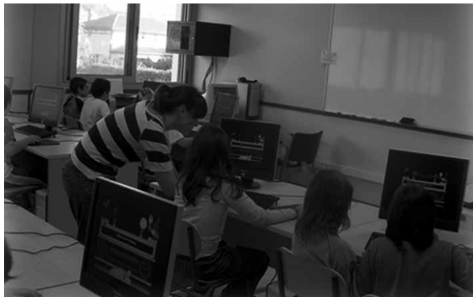
Udarregi ikastolak galdetegi bat prestatu du.