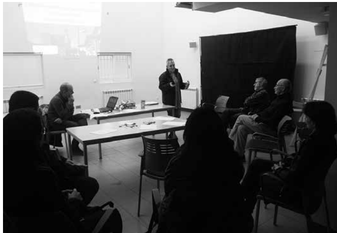
Parte hartze prozesuak antolatu ditu Donostiako Udalak baina Zubietan prozesu propioa abiatzea erabaki dute.

Etorkizuneko herria diseinatu nahi dute. Diagnostika osatuko dute, norbanakoen eta kolektiboaren asebetetze faktoreekin etorkizuneko Zubieta irudikatu; etorkizuneko agertokiak mahaigaineratu eta dakartzaten mehatxuak eta aukerak ikusi nahi dituzte; eta gaurtik aurrerako es-