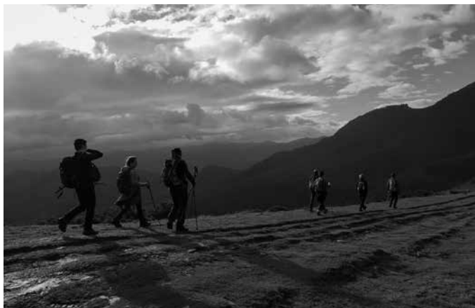
Bidasoako Kontrabandisten ibilbideko laugarren etapa osatuko dute apirilaren 9an.

Beintza eta Ziga lotuko ditu 32 kilometroko txangoak. "Autobusa Belaten 20. kilometroan zain izango dugu, nahi duenak Zigaraino Belatetik autobusez joateko", ohartarazi du Andatza M.K.T.-k. Bazkaria norberak eraman beharko du, mendi ibilbidean zehar egingo baita otordua. Izen emateko epea zabalik egongo da apirilaren 5era arte. Plaza kopurua mugatua izango da. 10 euroko ordainketa egin beharko da kontu zenbakiotako batean: