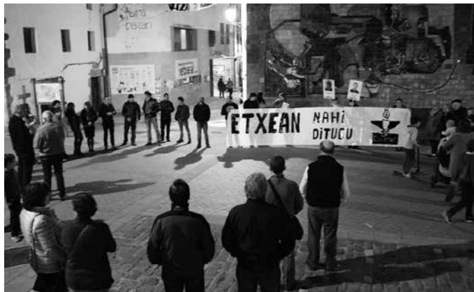
20:30ean hasiko da martxoaren 31ko elkarretaratzea. Apirilaren 1ean, harpidetza afaria egingo dute Aitzagan. Txartelak Aitzaga tabernan eta Aizpurua okindegian ipiniko dituzte salgai.

Xua naiz eta eskerrak eman nahi dizkizuet niri ongi etorria eman ez eta amonari, amaxori eta aitaxori elkartasuna adieraziz, idatzi eta elkarretaratzeetan bildu zareten guztiei. Udalari ere bai, egindako guztiagatik. Eta bereziki, txoko-marrubizko muxu pila helarazi nahi dizkizuet marrazki polit-polittak bidaliz, ama-