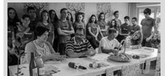
300.000 euro batu behar dituzte.

Diru ekarpinak eginez, sagarrondoak erosteko aukera duzue apirilaren 7ra arte, NOAUA!n, Alkartasuna Kooperatiban, Lizardi liburudendan eta Udarregi Ikastolan. Honez gain, eragile, elkarte, kooperatiba eta enpresei ere deia luzatzen zaie kanpaina honetan parte hartzeko. Honatx harremanetarako telefono zenbakia: 688 639 910.