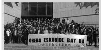
Apirilaren 27ra arteko lanuzteak iragarri dituzte.