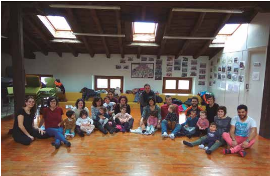
Argazkiko gurasoek eta hurrek “LaLaLa soinu gela” ikastaroan hartu zuten parte aurreko larunbatean.

Musika instrumentu batean trebatzen ari den ikaslearentzat ikasten ari den hori plazara ateratzeak, ikasitakoa praktikan jartzen ahalbidetzen dio eta motibagarria suerta daiteke. “Abestiak taldean gusturago jotzen dira. Zure lana jendaurrean eta taldean erakusteak motibatzen zaitu. Hasieran esperimentatzen zoaz, baina indartzen joan ahala, gozatu