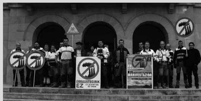
Errausketaren Aurkako Mugimenduak egin duen deialdiarekin bat agertu ziren argazkian ageri diren udal langileak.

■ Atxikimendu bilketa kanpaina parte hartzeke deia. Atxikimendu orria erraustez.org atarian duzue.