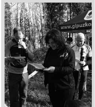
Ia 400 lagun zeuden izena emanda.

■ Ekainak 4: Ulia (Donostia). Proba hauen inguruko informazioa eta Txokoaldeko ekimeneko sailkapena, gotorientazioa.org atarian duzue.