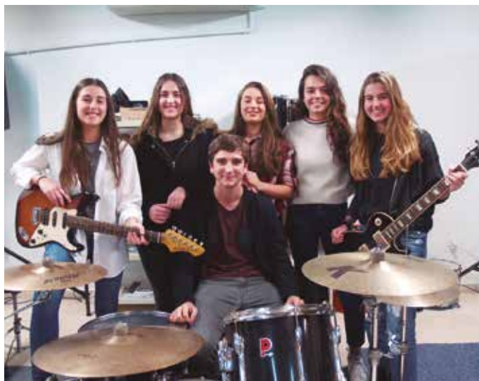
Ixaksonak taldeko kideekin izan gara hizketan. Larunbatean Mikel Laboa plazan arituko dira beste talde batzuekin batera.

Ixaksonak duela 6 urte osaturiko pop-rock taldea dugu. Seikoteak hirukote gisa ekin zion ibilbideari. Talde kideak batu ahala, "gitarra elektrikoarekin jotzera igaro ginen, bateria egokitu eta talde rockero baten antza" hartzera heldu ziren. Estilo definiturik ez diotela