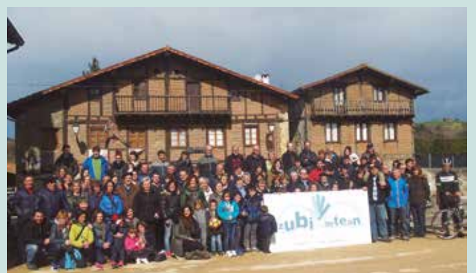
Martxoaren 30ean Kaxkapen egingo den bileran erabakiko da galdera.