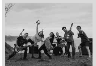
Huntza taldekoak arituko dira, besteak beste, Gazte Akelarrean.

Ernai eta Aitzina gazte erakundeek "Gazte Akelarrea" antolatu dute apirilaren 13tik 16ra, Zornotzatik Igorrera. Oraingoan, martxa eta topagunearen arteko nahasketak bat izango da. Apirilaren 13an mendi martxarekin abiatuko da Zornotzatik eta gauez heldu Igorrera, gero bi egunez bertan izango dira. Kontzertuak, hitzaldiak, tailerrak antolatu dituzte Igorren. Apirilaren 16an berriz Gernikako Aberri Egunera joango dira. Hiru egunotarako bonoak salgai daude 35 eurotan Aitzagan. Prezio horren baitan, hiru eguneko egitaraua, akanpalekua, dutxak eta gainerako eskaintzak gozatzeko aukera. Eguneko sarrera solteak ere salgai jarriko dituzte 15 eurotan beste hainbat txokotan. Informazio gehiago: gazteakelarrea.info