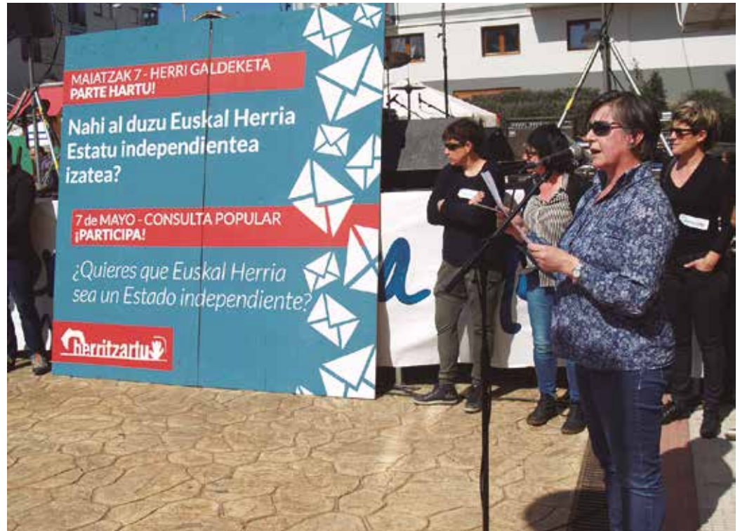
Aurreko igandean aurkeztu zen maiatzaren 7ko galdeketa erantzun beharreko galdera.

Galdera aurkezteko ez zuen edozein egun hautatu, galdeketa antolatzen ari den herritar taldeak; egun seinalatu bat baizik. “Gaurko eguna, martxoaren 19a, data garrantzitsua da herri eta herritar orok duen erabakitze eskubidearen aldarrikapenean. Euskal Herriaren estatus politikoa erabakitze dugun eskubidearen defentsarako eraikitzen ari gara marea handi bat”, zioten, aurreko igandean Herritzartuk ospaturiko ekitaldian.