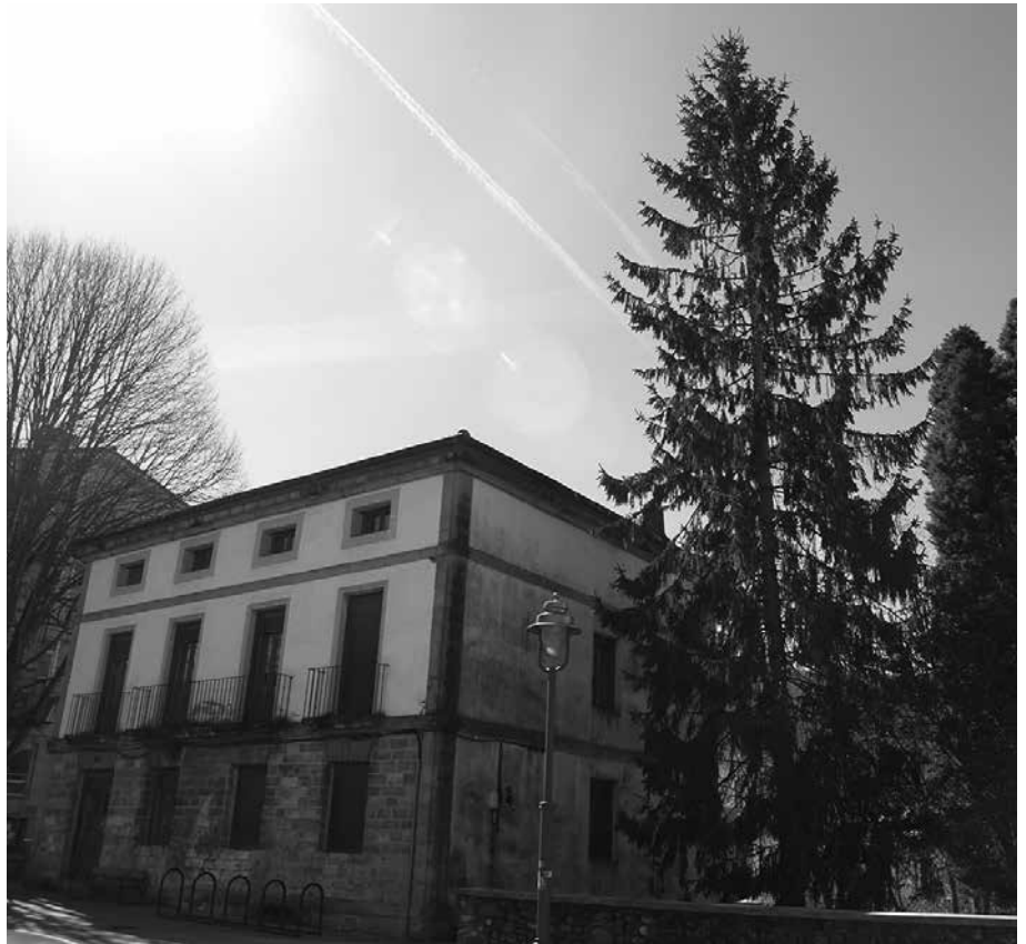
Zumarteko ikasle talde bat alkatearekin batzartu eta zuhaitz hau zutik mantentzeko eskatu diote.