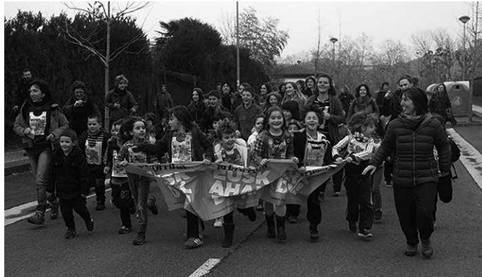
Apirilaren 4an Korrika Txiki egingo da arratsaldean. Gaueko 23:39an iritsiko da Korrika.

Arratsaldean, Korrika Txiki. 23:39 20. Korrika Zubieta, Usurbil eta Aginagan. Antolatzailea: Korrika Batzordea.