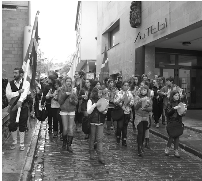
Apirilaren 8an ospatuko da Dantza Egunaren bosgarren edizioa.

■ Apirilak 6-8, aurreko Dantza Egunen argazki erakusketa Su- tegin. Ion Markel Saez de Ura- bainen irudi bilduma ikusgai. ■ Apirilak 7, 19:30 Donostiako musika eta dantza eskolakoen dantza klasikoko erakustaldia Sutegin.