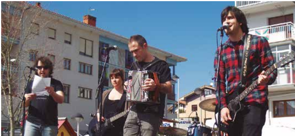
Iñorkiñak taldeak egin du kantua. Aurreko igandean jo zuten lehen aldiz jendaurrean.

G aldera soilik ez, soinu banda ere badu jada maiatzaren 7ko herri kontsultak. Herritarrek jarri diote doinua, usurbildarrek hilabete eta erdi barru hautesontzien bueltan izango duten hitzorduari. Iñorkiñak taldekoek hain zuzen, beste hainbat usurbildarren laguntzaz.