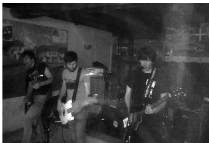
Martxoaren 25ean, Odolaren Mintzoa taldekoak Urđiñarben aritu ziren zuzenean jotzen.

deek “Gazte Akelarrea” antolatu dute apirilaren 13tik 16ra, Zornotzatik Igorrera. Gazte