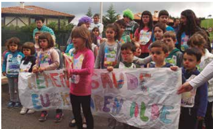
Aginagako Eskola Txikikoak izan ziren goiztiarrenak.