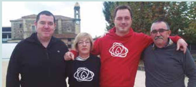
"Haserre handia sentitzen genuen itzultitakoan. Zerbait egin duzun baina aldi berean ezer egin ez duzun sentsazioarekin itzultzen zara".

Baina latzena haurren egoera da. "Laguntzera zoaz baina sufritu egiten duzu. Janaria banatzeko ilaran ginenean, malkoei eutsi behar izaten genien", adierazi digute. Distantziatik hang