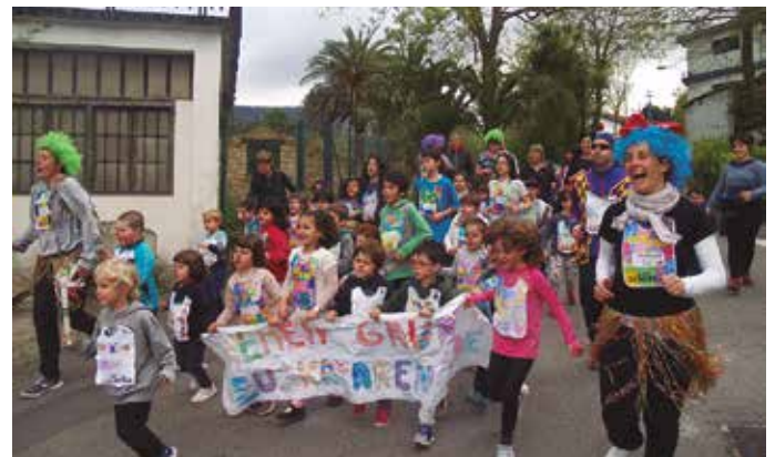
Aginagan mozorrotuta atera ziren hainbat lagun.