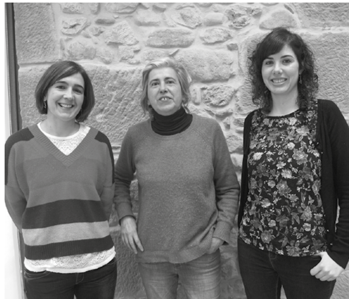
Argazkian, Berme Batzordeko kideak. Usurbil zein Zubietako herri galdeketa ikuskatuko dituen talde berberak.