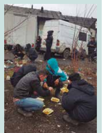
Astebetean zazpi kanpamendu bisitatu zituzten.

Bi herritarrok, martxoaren 17an Sutegin antolatutako "Nacido en Siria" filmaren proiektzioan parte hartu zuten Mundu Berri elkartearen kideekin batera, lekukotzak eskainiz. Ekitaldirako ordaindu behar zen sarreratik bildutako dirua ere Serbiara bidaltzekoak dira.