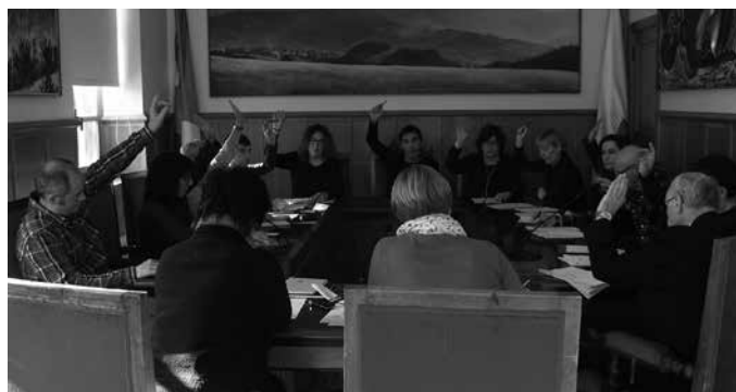
Aurreko udalbatza plenoan aztertu zen mozioa.

Udalbatzak hartutako erabakiaren berri emango die Uda-