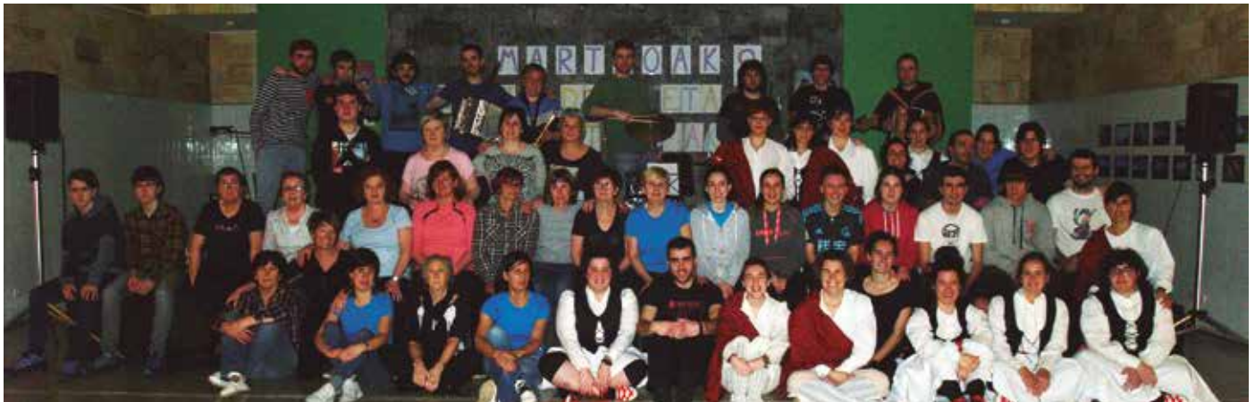
Herriko artisten topagune izango da eguneko azken emanaldia: "Indiana Jones eta Kaliz Sakratua" izenekoa.