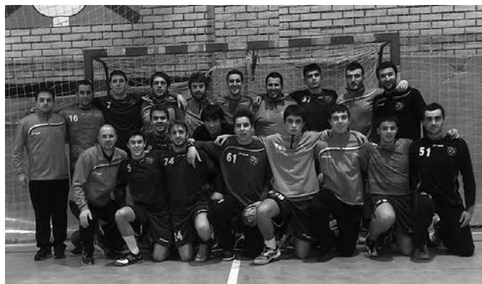
Senior neskek larunbatean 19:30ean Oiardo Kiroldegian jokatu dute ligako azken neurketa, sailkapen buru den Logroñoren aurka. Lau jardunaldiren faltan, mutilek mailari eutsiko diote.

Herriko bi talde maila hauek mantentzeko eginiko ahal-egina nabarmentzen dute, eskubaloiko taldeen bilgutetik. “Estatu mailan jokatzeko, jokalariek eta klubeko beste partaideek, eta baita herriak