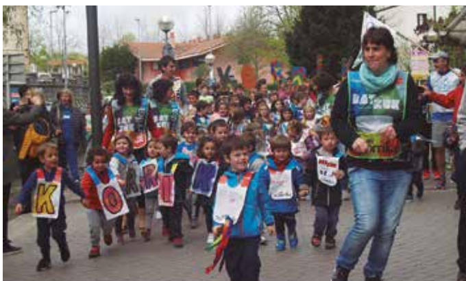
Udarregiko Haur Hezkuntzakoak, Usubilgo Mikel Laboa plazan.