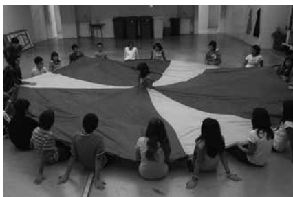
Apirilaren 10ean Zarautz-Getaria ibilbidea osatuko dute Gaztelekukoak.

Ernai eta Aitzina gazte erakundeek "Gazte Akelarrea" antolatu dute apirilaren 13tik 16ra, Zornotzatik Igorrera. Gazte Akelarrerako bonoak salgai dituzue Aitzagan. Informazio gehiagorako: gazteakelarrea.info