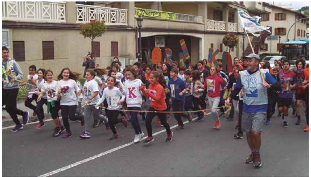
Aginaga, Zubieta eta Usubilgo ikastetxeek bat egin zuten Korrikarekin. Irudi honetan, Udarregiko DBHko ikasleak.

DBH4ko ikasleok “Denborak itzali ezin dezakeen sugarra” lemapean babestu nahi izan dugu korrika. Azken finean horixe baita gure hizkuntza, mendez mende, pausoz pau-