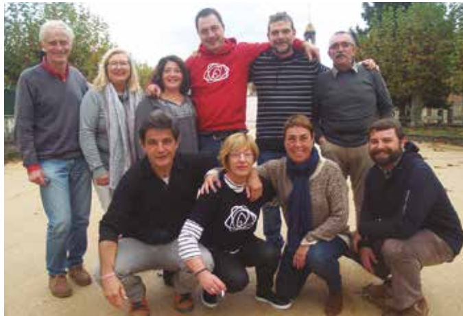
Greziako Kios uharteko errefuxiatuei egunero janariak zerbitzatzen aritu dira "Intxaurrondotik Wukroa" elkarteak. Eta eurekin, hainbat herritar.

Proiektu hau gertutik ezagutu dutenen artean dugu ondoko irudiko zubietar taldea. Udazkenean Kioseko hiriburuko errefuxiatuen kanpamenduan izan ziren. Turkiatik kilometro gutxira,