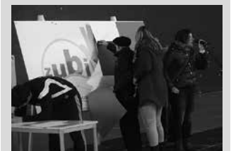
Galderaren berri igande honetako ekitaldian emango dute.

zubiarrean@gmail.com Facebook: Zubiarrean Antolatzailea: Zubiarrean Elkartea.