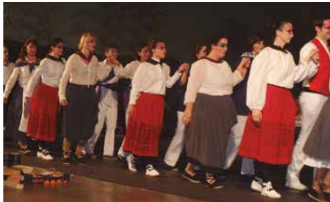
“Usurbilen dantza bizirik dagoela erakusten du egun honek”.

D uela sei urteko Usurbilgo jaietako azken trakan berreskuratu zuten koreografia lantzerakoan eman zen Dantza Eguna antolatzeke lehen urratsa. Herritar talde batek halako dantzak lantzeko nahia agertu zuen. Hortik aurrerako pausoak katean etorri ziren. Taldea osatu eta entseguekin hasi ziren. Aurten bosgarren edizioa bete du Dantza Eguna.