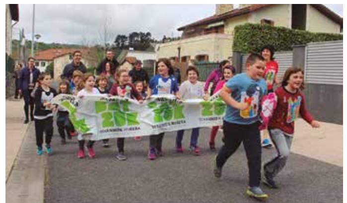
Ikasleak, irakasleak eta gurasoak bat eginik aritu ziren Zubietan.