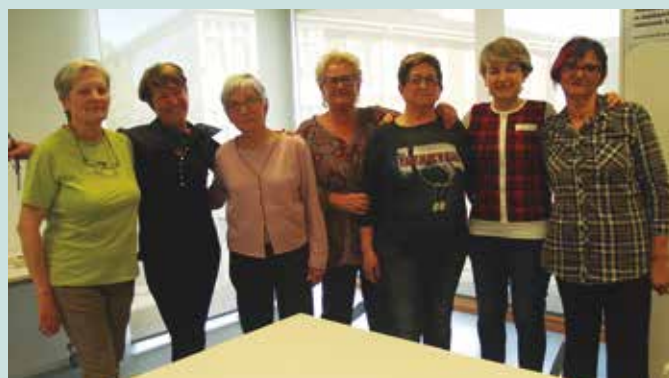
Jostun taldean ere badira dantzan aritzen direnak.

edizioetan dantzariak soinean zeramatzaten jantziak ere jostun taldeak landutakoak dira.