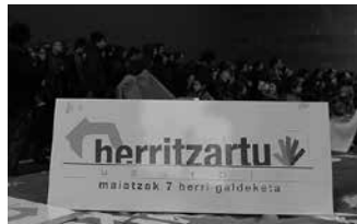
16 urte beteak dituenak ere har dezake parte.

B- Espainiako Estatuak herritartzat jotzen ez dituen pertso-