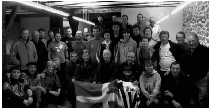
Duela bost urtekoa da argazkia. Usurbil eta Arantzazu oinez osatzeko ohitura apirilaren 13an berrituko dute.

tun-Santa Ageda (hemen bakoitzak eramandako bokata jaten da) -Mandubia (hemen salda eta ardo pixka bat)- Ezkio-Itxaso (40. km, hemen autobusa egongo da eta laranjak eztarria gozatzeko, eta norbait gaizki joanez gero autobusean Legazpira)- Legazpia (hemen bazkaltzeko entsalada, xerra