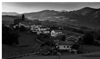
Zigako herrian amaituko da igande honetako mendi irteera.

(egun 1 edo 2). Bi eguneko: Ereñozu-Lesaka, Lesaka-Senpere. Egun batekoa: Lizuniaga-Senpere. Informazio gehiago: andatza.com