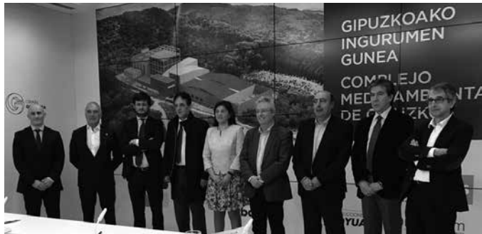
Astelehenean sinatu zen kontratua. Ahalik eta lasterren lanei ekiteko borondatea azaldu du Foru Aldundiak.

2011n bankuekin sinatu ziren SWAPak ordaintzea agintzen duen Gipuzkoako Auzitegiko epaiari helegiterik ez aurkezte erabaki zuen Gipuzkoako Hondakinen Kontsurtzioak (GHK) martxoaren 31n egin zuen ezohiko eta urgentziazko batzarrean. Bezperan, EHBilduk eta Podemos Ahal Duguk epai hau errekurritzeko eskae-