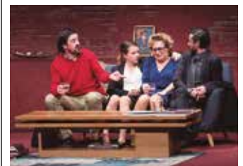
Sarrerak Lizardin eskuratu daitezke aldeztatik, 8 eurotan.

Bi aste barru amaituko dira Jexux Artzeren omenezko kultur ekitaldiak. Txalo taldearen Jainko basatia antzeztanarekin itxiko da zikloa.