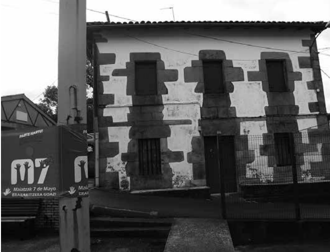
Aginagan, Apaiz Etxean bertan.