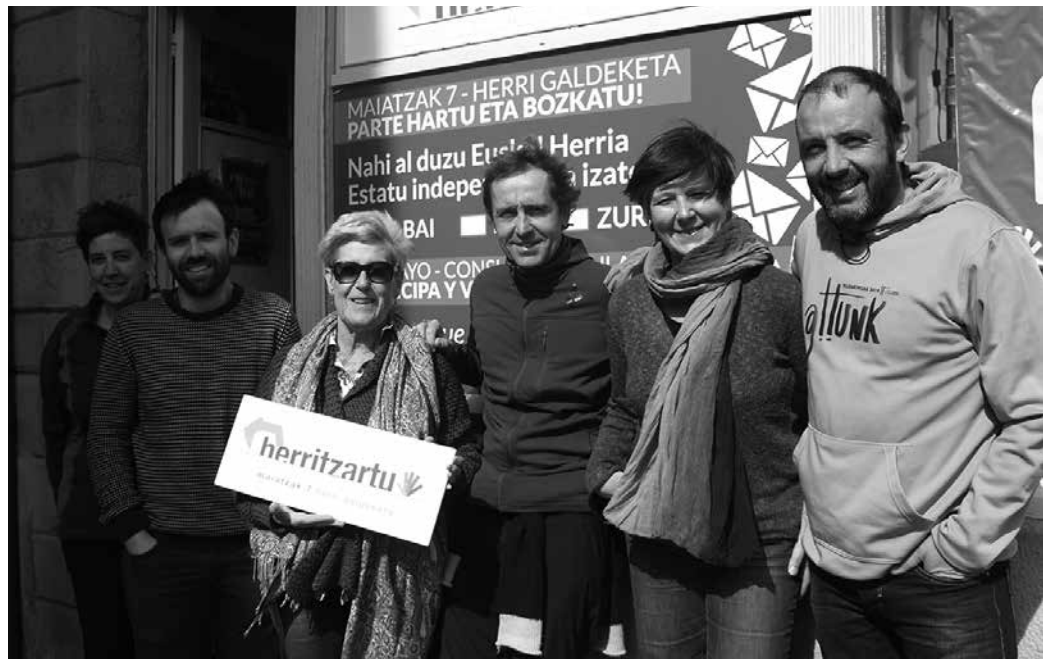
Galdeketa bezperan, Herritzartu elkartearen lanean ari diren kide batzuekin batu gara.

Mugimendua bada jada bozkatzen. Gainera, esan digute jendea hasi dela udaletxera joaten, errolda agiria behar ote