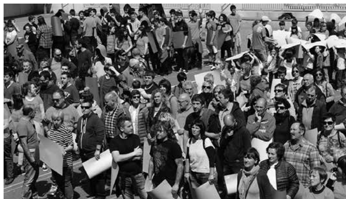
“Politikarien esku bakarrik ezin dira halako gauzak utzi”.

Hamaika arrazoi dago. Duintasunagatik, erreibindikazio bat delako, ariketa demokratiko bat. Politikarien esku bakarrik ezin dira halako gauzak utzi. Erabakitze eskubidearen alde dagoen edonork ikusi behar luke maiatzaren 7ko eguna egun garrantzitsu bat bezala, erakundeen aurrean bere iritzia azaltzeko. Gero galderari bai, ez, zurian erantzun, hiru erantzunak dira garrantzitsuak. Baina parte hartu. Barne pentsamendutik erabakitze eskubidearen alde bazaude, iritzi hori erakusteko maiatzaren 7ko egu-