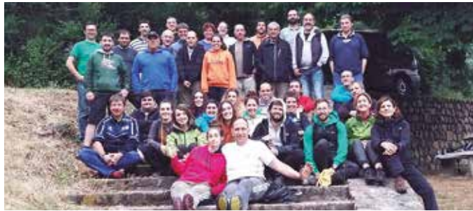
Argazkian, iaz Ziortzako kanpaldia muntatzen aritu zen taldea.

Izen emate orriak liburutegian eta parroko atean topatuko dituzue. Interesa dutenek, maiatzaren 5era arteko epea izango dute. 19:00etan itxiko da izena emateko epea. "Ordu horretan izena eman dutenekin plaza kopuru hori gainditu ezkerro hauekin egingo genuke