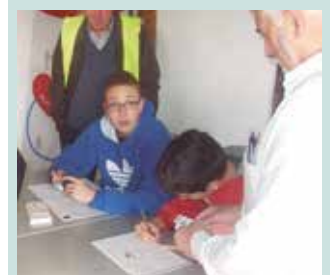
Ikasleak kontrolean egoten dira, parte-hartzaileen izenak apuntatu eta zigiluak jartzen dituzte.

Egun horretan gure ikasleak kontrolean egoten dira, parte-hartzaileen izenak apuntatu eta zigiluak jartzen dituzte. Beste batzuk berriz, ibilbidean zehar, solasaldian, behar duenari laguntza eskaintzen, errepidean paso ematen joaten dira. Bukaeran hamaiketako goxoa hartzen dugu denok.