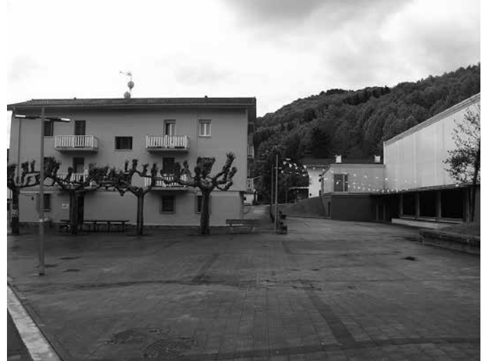
Santuenean, Ibai-Ondo elkartearen aurreko plazatzxoan.