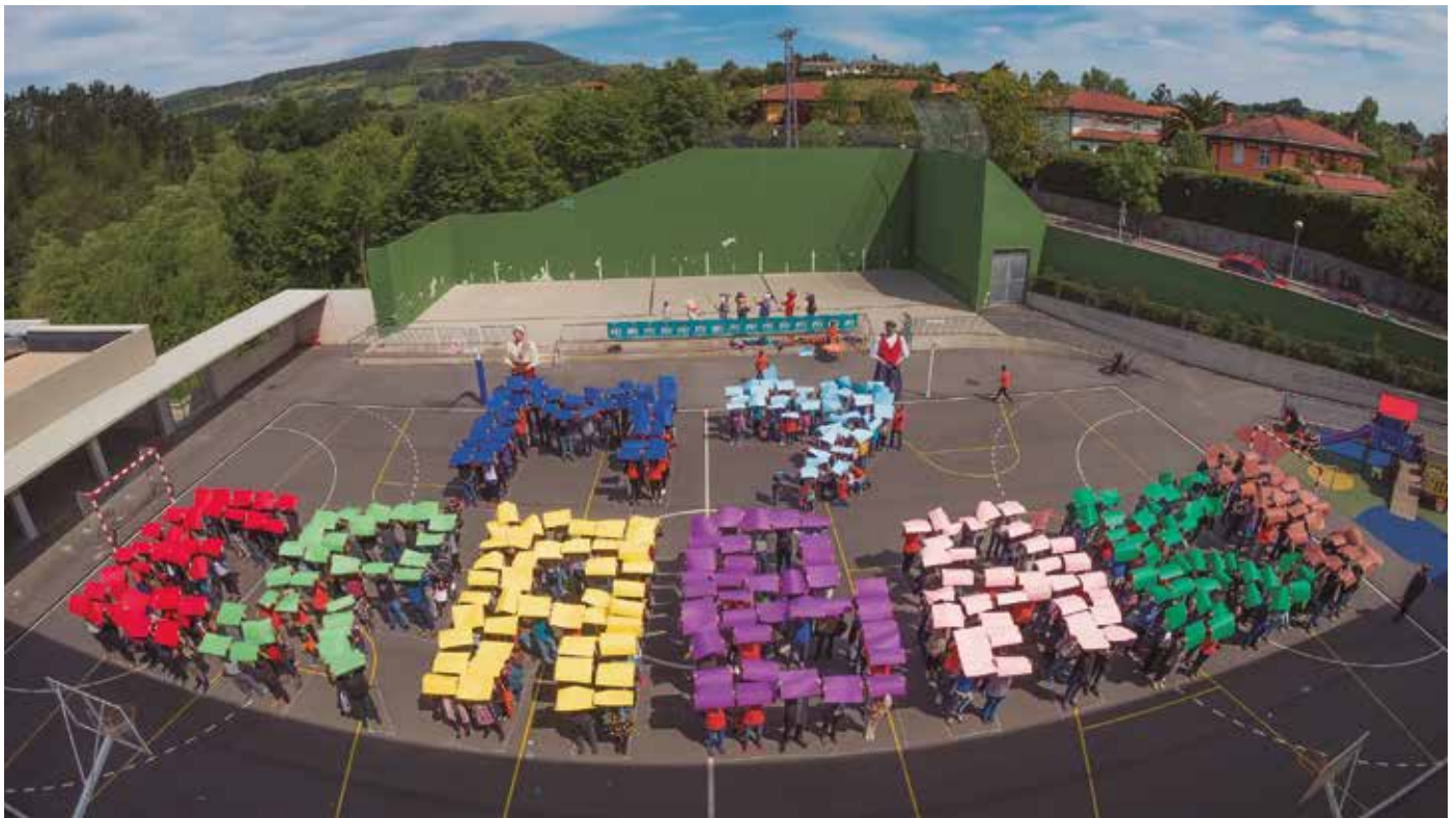
Pasa den larunbatean Erabaki Fest ospatu zen. Eguerdian, herritar ugari batu ziren Agerialdeko patioan. "M7 erabaki" mosaikoa osatu zuten.