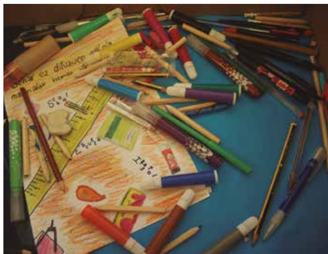
Arkatzak, boligrafoak, koadernoak, borragomak, erregelak, errotilagailuak, plastidekorrak... batu eta Malira bidaliko dituzte.

■ 11:30-12:30 Maliko haurrei helarazteko eskola materialaren bilketa frontoi inguruan. Arkatzak, boligrafoak, koadernoak, borragomak, erregelak, errotilagailuak, plastidekorrak... Es-