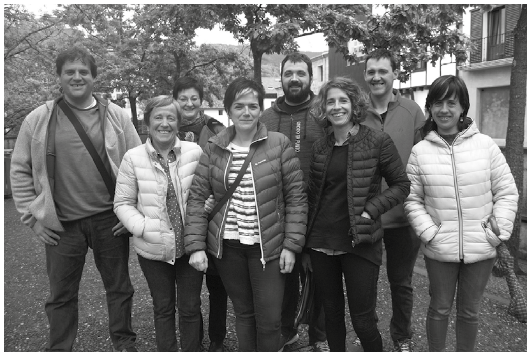
Igande honetan, Bizi Kalea festa Askatasuna plazan.