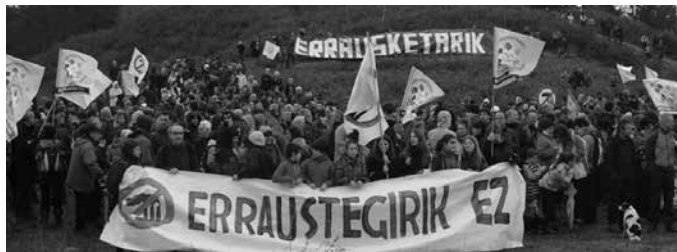
Maiatzaren 27an mobilizazio eguna antolatu dute Zubietan.

haztuko dute ordua), elkarretaratzea Bugatiko gasolindegiko ondoan, erraustegiko lanen lehen harria jartzekoa baita Foru Aldundia.