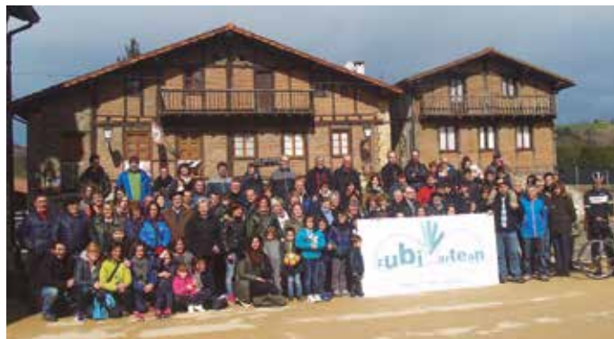
Zubiarlean elkarrekin antolatu du igande honetako herri galdeketa.

Kontua da, gure nortasun agerietako zenbakietan batzuetan ez duela zehazten Zubietakoak garenik, batzuei Usurbil, Donostia edo kalea bakarrik adierazten die. Horretarako guk prestaketa dugu kale eta baserrien zerrenda bana, Zubietakoak direla egiaztatzen arazorik balego. Nortasun ageriak berak ez badu erakusten norbera Zubietakoa dela, errolda