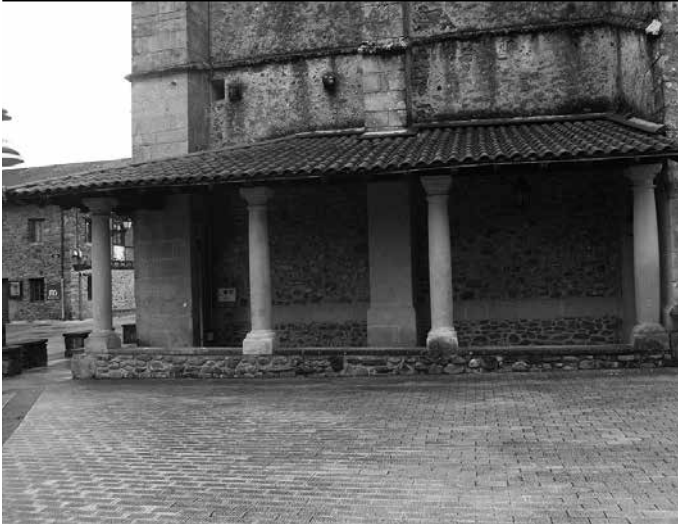
Zubietan, elizako arkupeetan.