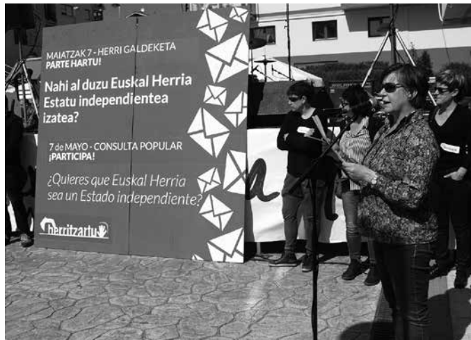
“Esfortzu hau ezin da geratu hor. Erantzun bat behar du”.

Hainbeste lan egiten den prozesu batean, hainbeste jende mugitzen duena, 20.000-30.000 biztanleko herrietan ausartzen dena hau egitera... Esfortzu hori ezin da geratu