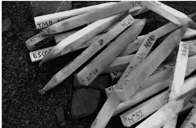
Sare sozialen bidez eman zuten ekintzaren berri: erraustegi-guneko hesola guztiak kendu dituzte. Pankarta handi bat ere zabaldu zuten bertan: “Erraustegirik ez, ez goaz etxera”.

Erraustegia eraiki asmo duten gunean izan dira Gipuzkoa Zutik mugimenduko kideak. Hesola guztiak kendu eta 25 metroko pankarta erraldoia zintzilikatu dute. “Joan den udaberri beroaren ostean, Gipuzkoa Zutik mugimendua bizirik mantendu dugu herritar talde batek, eta bigarren udaberri baten atarian gaudela aldarrikatu nahi dugu”, adierazi