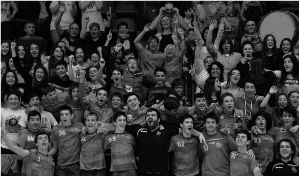
Bigarren postuan amaitu dute Euskadiko Txapelketa eta horri esker Espainiako Txapelketarako sailkatu dira.

Euskadiko Txapelketan bigarren postuan sailkatu da asteburuan, Usurbil Kirol Elkarteko kadete mutilen taldea. Zarauzko Aritzatalde Kiroldegian jokaturako fasea txapelkunorde