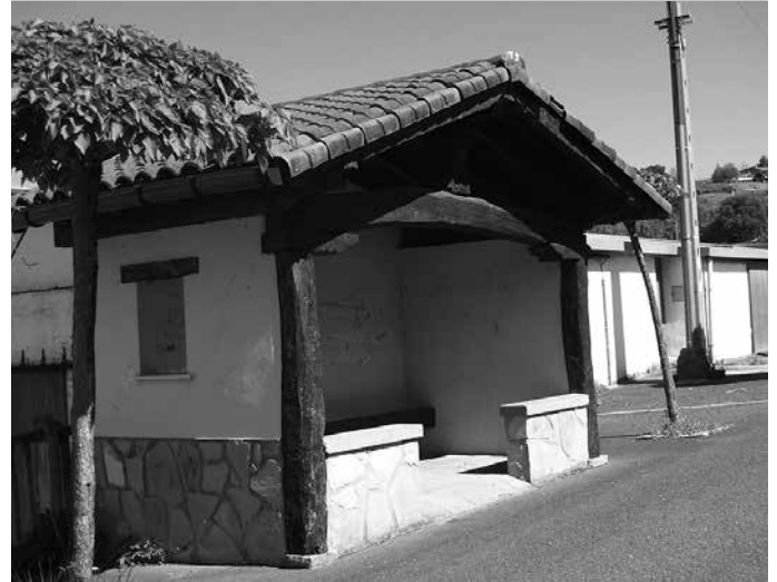
Kalezarren, Ugarte baserriaren eta Haur Eskolaren arteko markesinan.