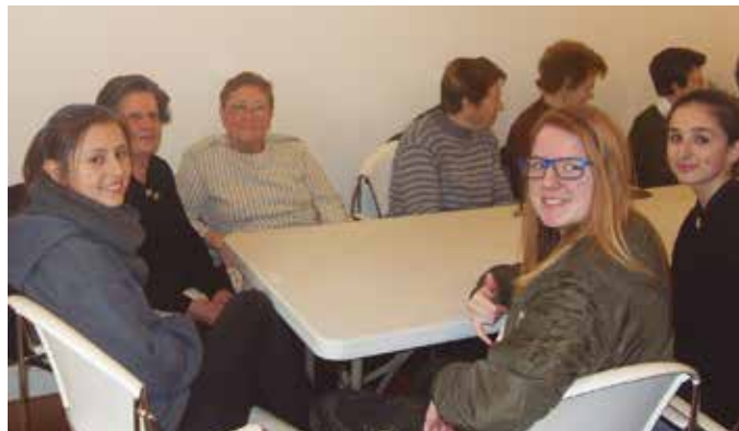
“Goazen kalera” ekimenean hartzen dute parte DBH 3. mailako ikasleek.