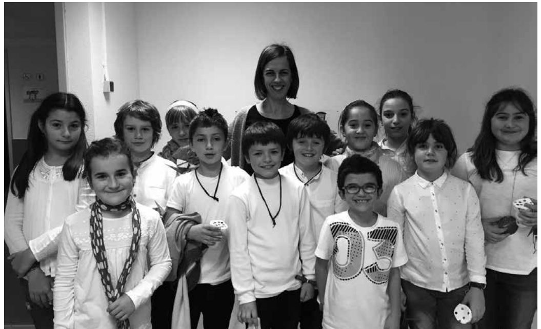
Hilaren 22an hasi eta 26an amaituko da Zumarte Musika Eskolan matrikulatzeko epea.

■ Musika Txokoa (4-5-6-7 urte): 125 euro. ■ Musika Txokoa + instrumen-