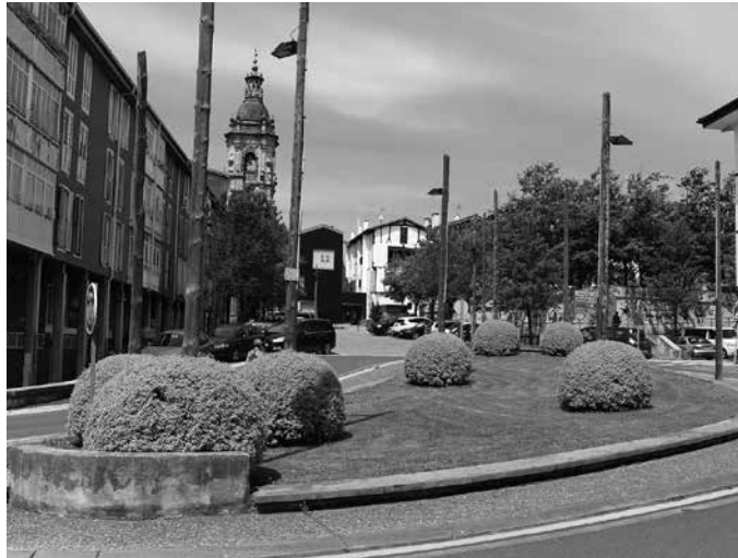
“Udaleko berdegune eta lorategien diseinua eta mantentzearen plangintza eta programazioaz arduratzea”, zeregin hori izango du.

zian argitaratu eta bihar-munetik zenbatzen hasita, 20 egun naturaleko epean. Eskabide eredu ofiziala udal errejistroan edo usurbil.eus atarian