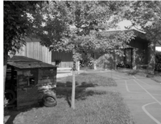
Zubietan eta Aginagan ez zen eskolarik izan maiatzaren 16an.

I siltasuna erabatekoa zen eta ikasgelak hutsik ziren maiatzaren 16an, Zubietako eta Aginagako Eskoletan. LAB, ELA, STEILAS eta CCOO sindikatuek hezkuntza publikoan deitutako greba orokorrak erabateko jarraipena izan zuten ikastetxeotan.