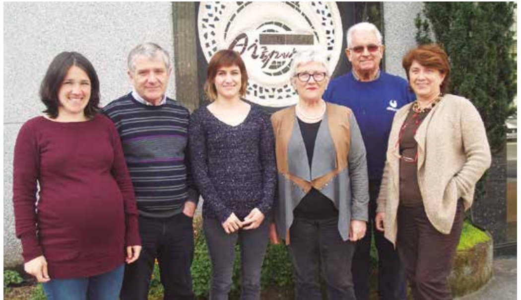
“Urtero lan aukera desberdin asko sortzen zaizkigu eta horiek asko zaindu behar ditugu. Eskaintzen dugun zerbitzua, dedikazio handiz eginiko lana da”.

E. A.: Erraza da bateragarri egitea, egun osoa hemen igarotzen dugu familia artean. Lehen ere hala izaten zen gurasoekin. Hemen bizi eta lan egiten genuen.