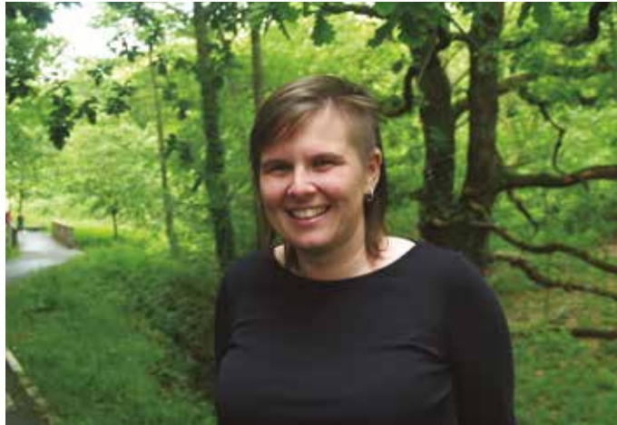
“Botatzaileok, herrikoak izanik, ondokoekin hitz egiten eta elkar laguntzen oso ondo pasatzen dugu”.