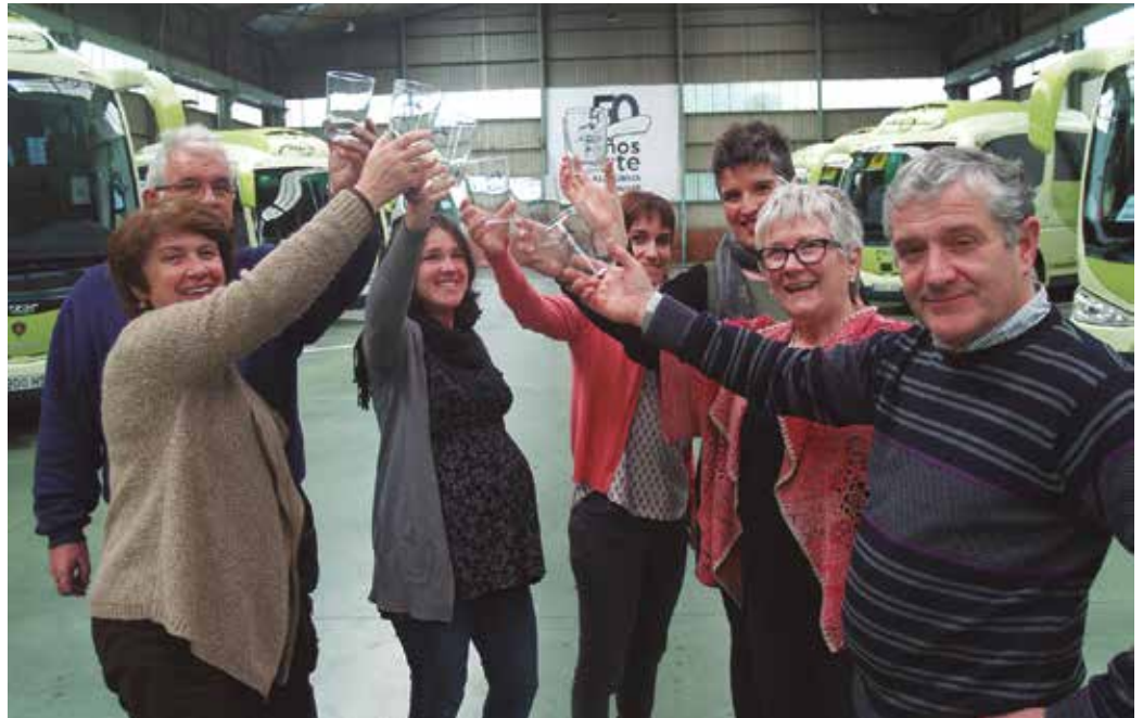
Edalontziak jada prest dituzte. Igandean, Aizpurua sendiak emango dio Sagardo Egunari hasiera.

Zenbat eta zenbat usur-bildar garraiatu ote dituzte 50 urteotan. Aizpuruarren autobusetara igo ez den herritar gutxi izango da honez gero. Ezaguna dugu lantegia Usurbilen eta hementik kanpo. Hurbilekoak langileak ere, usurbildarrak. Mende erdia igaro dute, haien nortasun zigiluari eusten; bezeroak mimatu eta Usurbilen bizi eta lan eginez, gertuko zerbitzua eskaintzen. Horregatik, 50. urtemuga honetan, poztasun eta ohore handiz jaso dute herri-rik bertatik, Sagardo Egunearen Lagunen eskutik jaso duten gonbita; igande honetako 36. Sagardo Egunari hasiera ematekoa.