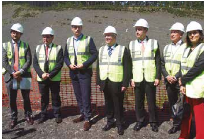
Gipuzkoako Foru Aldundiko ordezkariak Zubietan izan ziren maiatzaren 10ean.

Hondakinen kudeaketarekin dugun arazo larriari buruz zioenez, “gaurtik aurrera konponbidearen irtenbidea