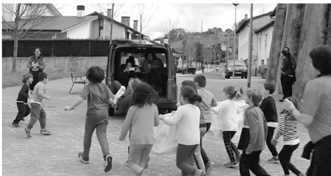
Zubietako Eskolako guraso elkarteak antolatu du kultur aste modukoa.

Z ubietako Eskolako guraso elkarteak antolatuta, datorrena ospakizun aste izango dute Zubietan: