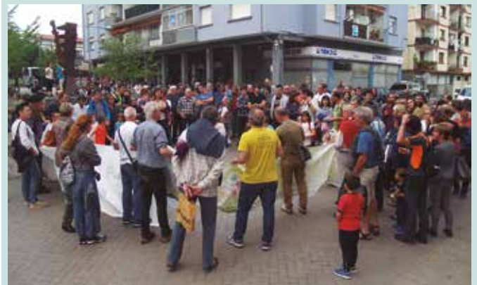
Azken asteotan, Errausketaren Aurkako Usubilgo Taldeak elkarretaratzeak antolatu ditu Mikel Laboa plazan. Ostiral honetarako, elkarretaratze zaratatsua iragarri dute. 19:00etan hasiko da.