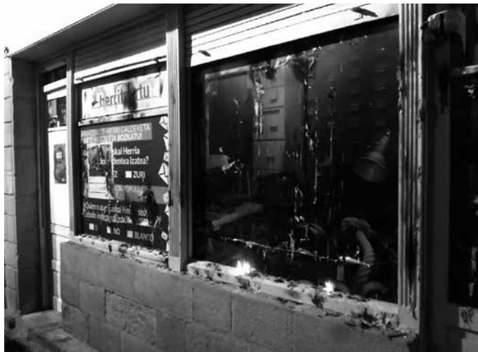
Pankarta honek maiatzaren 7ko herri galdeketa emaitzak islatzen zituen.

Bidean aurrerantz egingo dute Gertaturikoa publikoki ere sa-