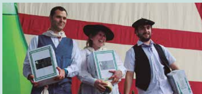
Olatzek botatzaile lehiaketa irabazi zuen iaz. “Botatzailearen figura garrantzitsua da, baita sagardoa ondo zerbitzatzea ere”.

Egia esan ez, berez barrutik sortzen zaidan moduan botatzen dut.