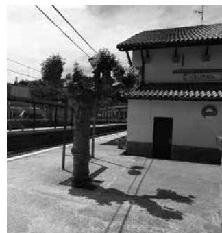
Ekintzailea anbulantzian eraman zuten Donostia Ospitalera, larri.

Makinistak antza ez zuen ikusi ekintzailea, trena martxan jarri eta harrapatu zuen. Zaurituriko ekintzailea anbulantzian eraman zuten Donostia Ospitalera, larri. Haustura dezente ditu. Igandean, gazteari elkarretasuna adierazteko elkarretaratzea egin zuten Donostiako Bulebarrean.