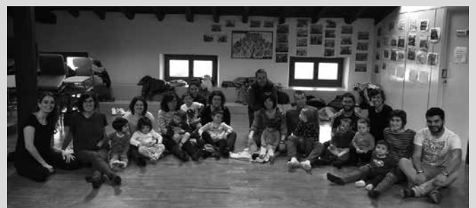
Martxoan antzeko musika tailerra egin zuten Zumarten.

■ 0-3 urteko haurrentzat eta beren familientzat. ■ Non: Zumarte Musika Eskolan. ■ Noiz: Ekainak 3, larunbata. ■ Prezioa: 15 euro, familiako. ■ Izen ematea: Zumarte Musika Eskolan, (maiatzak 22-26 bitarte).