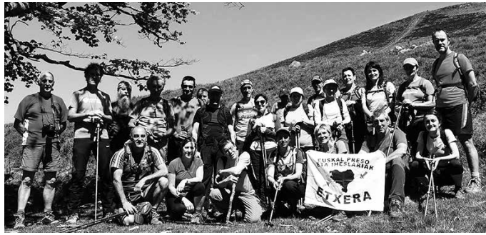
Argazkiko lagunek Zigatik Erratzurainoko ibilbidea osatu zuten maiatzaren 7an.