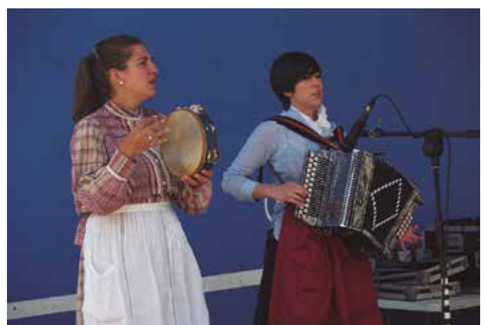
San Ixidro eguna ospatu zen astelehenean. Trikitilariak eta bertsolariak girotu zuten eguna.