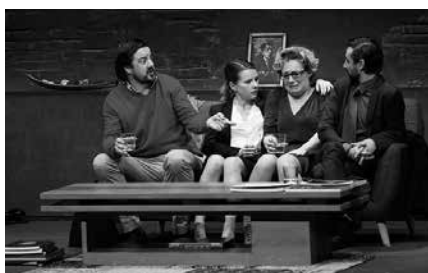
Gaueko 22:00etan hasiko da. Sarrera merkeago eskura daiteke aldeztatik Lizardin erositik.

"Bi bikote elkartzen dira euren seme-alaben arteko liskarrak konpontzeko asmotan. Giza-legez eta edukazio handiz abiatu den bilerak beste bide bat hartuko du, elkarri kristorenak eta bi esaten has-