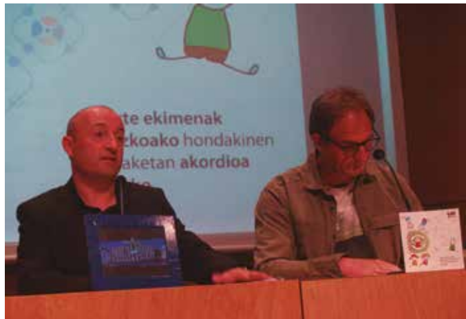
Maiatzaren 7an urtebeteko ibilbidea osatu zuen GuraSOS taldeak. Eraikitze lanak hasi arren, argi utzi nahi dute: “ez goaz etxera. Lanean segiko dugu”.

Erraustegia finantzatzeko dutenen artean dago Meridiam izeneko taldea. Talde honetan dirua inbertitua dute hainbat familia eskandinaviarrek. Haiekin, “komunikazio bide bat zabalduko dugu” iragarri du GuraSOSek. Meridiam taldeak, “UTE-aren bazkideztaren gehiengoa du, %50a”. Parisen (Frantzia) egoitzan duen finantza talde honekin hartuemanetan da jada guraso taldea. “Bere elkarrearen gutun etikoa ezagutzen dugu, baita inbertsio arduratsuen printzipioen gaineko konpromisoa. Horrela, geure inizatiba sozial zein juridikoen gaineko informazioa helarazi diegu, eta,