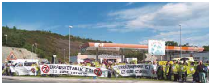
Maiatzaren 10ean, Errausketaren Aurkako Mugimenduak deitua, jendea batu zen Bugatin.

■ 19:00 Elkarretaratze zaratsua Mikel Laboa plazan. “Ekarri zarata sortuko duten gailuak; danborrak, txistuak,