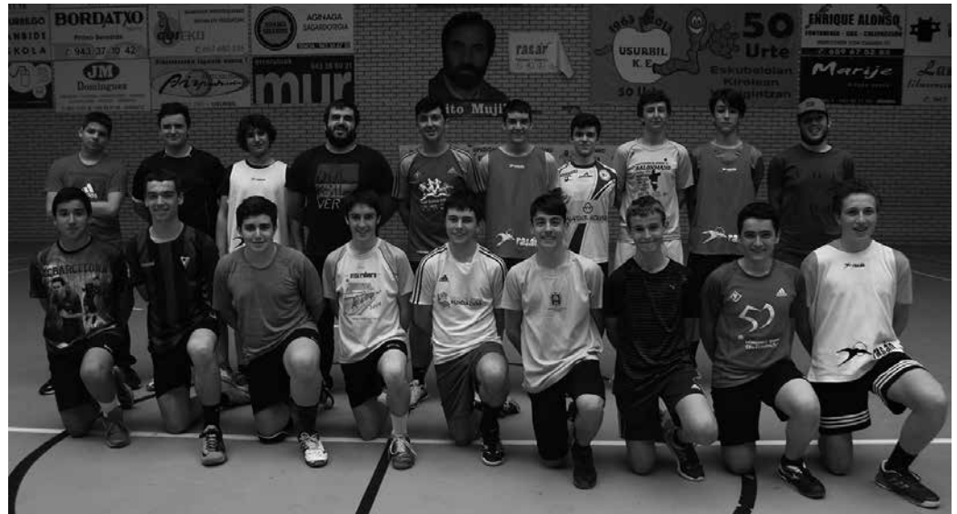
Asteburu honetan Elxera doaz. BM Ciudad de Algeciras (Andaluzia), BM La Roca (Katalunia) eta C.B. Elche izango dira aurkariak.

Belaunaldi hau indarrez dator Usurbilen. 17 jokalaririk ditugu. Eta hori Usurbilen ez dakit inoiz gertatu den. Hala bada, oso gutxitan gertatu da kadete mailan 17 jokalaririk izatea. Iaz