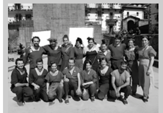
Leitzan egin zuten grabazioa.