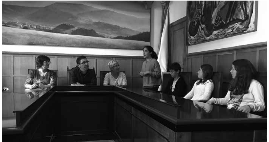
Maiatzaren 10ean, Udarregi Ikastolako ikasleak pleno aretoan izan ziren.

Herri lasai eta iraunkor bat lortzeko eta bizi kalitatea hobetzeko, “guztion parte hartzea beharrezkoa da; horregatik, betetzen saiatuko garen hainbat konpromiso hartu ditugu, eskola barnean eta kanpoan betetzeko”. Neurri hauek jaso dituzte “Eskola Agenda 21” txostenean: ■ Ikastolatik gertu bizi garenok oinez