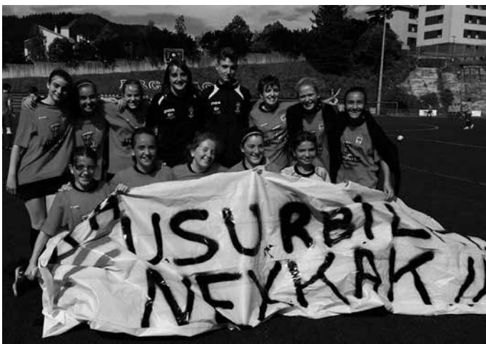
2-1 galdu zuten baina Usurbil F.T.-tik aditzera eman dutenez, “partida eder bat jolastu ondoren”.

Infantil neskek Kopako finalerdia jokatu zuten asteburuan Urolaren aurka. Finalerako sailkatzeaz izan ziren, baina