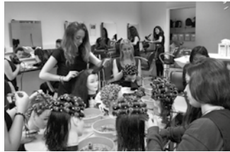
Ile-apainketa eta estetika arloaren ingurukoa da zikloetako bat.

Usurbilgo Oinarrizko Lanbide Heziketan laster izango da aurre-matrikula osatzeko garaia. Ekainaren 5etik 16ra luzatuko da epea. Ohi bezala, bi izango dira eskainiko diren zikloak: Ile-apainketa eta Estetika arlokoa batetik; Sukaldaritza eta Jatetxe arlokoa bestetik.