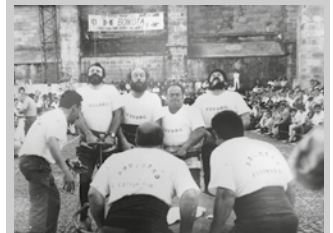
Bere argazkiekin osaturiko erakusketa bat egin nahi da.

Bere argazkirik baldin baduzu gustura hartuko lukete antolatzailerak aipatu erakusketarako. Irudiak izan eta utzi nahi badituzue, xmerre@gmail.com helbidera helarazi ditzakezue.