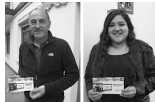
Jexux Artzeren omenezko saioetara joateko sarrerak eskuratu zituzten.