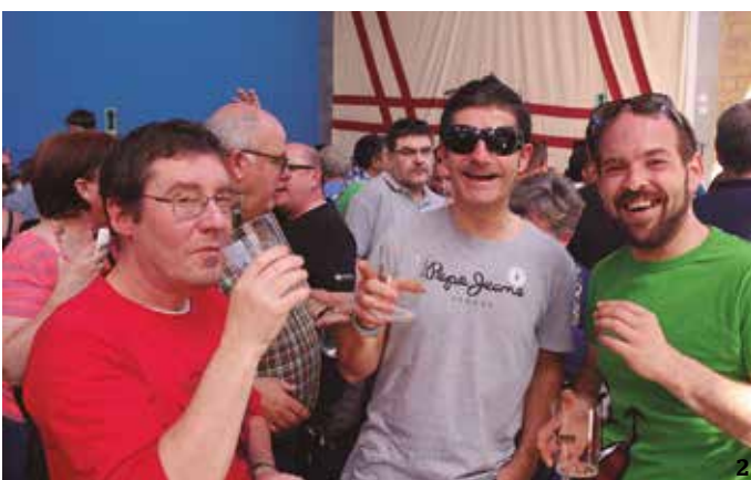
Argazki eta bideo gehiago www.noaua.eus web orrian aurkituko dituzue. 1, 2 eta 3 argazkiak: Iñaki Agirresarobe.