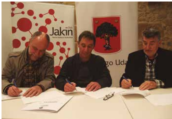
Udako Euskal Unibertsitateak (UEU), Jakin Fundazioak eta Usurbilgo Udalak martxoaren 27an sinatu zuten hiru urterako elkarlanerako hitzarmena.