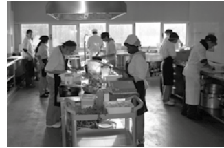
Sukaldaritza eta jatetxe arloari lotuta dago beste zikloa.