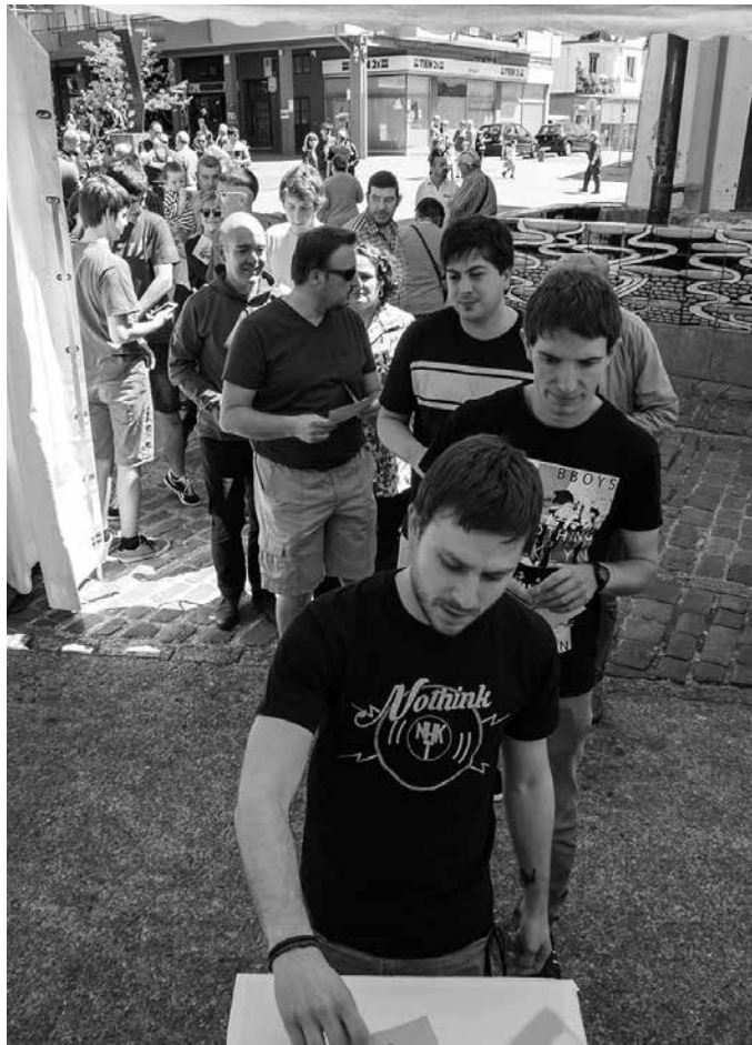
Ekainaren 10ean, arratsaldeko 17:30ean, Gure Esku Dago mugimenduak Herritarren Ituna aurkeztuko du.

Bilboko hitzorduan parte hartzeko konpromiso txartela eskuratu beharko da alde aurretik. Txartelarekin batera, mobilizazioan erabili beharko den puxika bat ere bai. Guztia, 2 eurotan, Gure Esku Dagoren Usurbilgo lan taldeak, asteotan Sutegi inguruan jarriko duen izen emate mahaian jaso