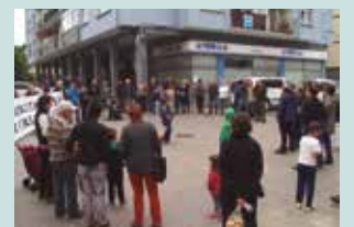
Ostiralean elkarretaratzea egin zen Mikel Laboa plazan.

Erraustegia eraikitzen hasi zirenetik bigarren ostiralez jarraian mobilizatu ziren usurbildarrak maiatzaren 19an Mikel Laboa plazan. Txistu hots eta burrunba handia sortaraziz, Zubietan gainean eraikitzen hasi diren plantaren aurka protesta egin zuten, Errausketaren Aurkako Usurbilgo Taldeak deituta. Amaieran, egunotarako deituak dauden ekimenak gogora ekarri eta hitzorduotan parte hartzeko gonbita luzatu zuten mobilizazio antolatzaileek.