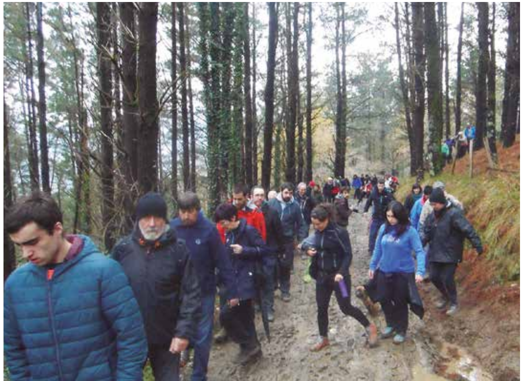
Iazko otsailean antzeko martxa antolatu zen. Larunbat honetan antzeko ibilbidea osatuko dute.