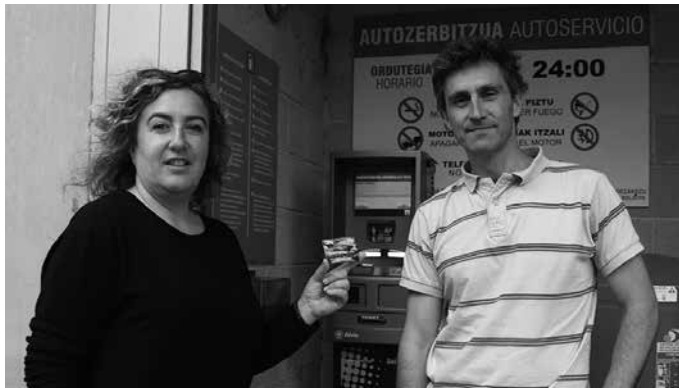
Alkartasuna kooperatiban erabiltzeko prestatuta dago Gertu txartela.