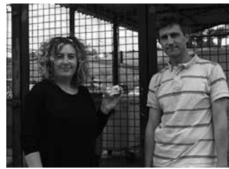
Hondakinen bilketarako Atalluko larrialdi gunerako ere balekoa da.