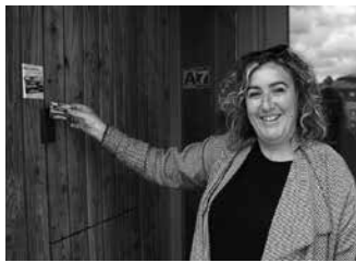
Potxoenean (irudian) eta Sutegi Udal liburutegian erabili daiteke.

Gertu Usurbilgo Herri txartela zenbait udal zerbitzuen erabilera errazteko asmoarekin sortu zen. “Hala ere, Usurbilgo Udalaz kanpoko arazo teknikoek eraginda, zerbitzu horiek ez zeuden eskuragarri orain arte. Behin arazo horiek konponduta, Gertu txartelak hasiera batean aurreikusita zeuden zerbitzu guztiak martxan jarri ditu”, udal iturriek