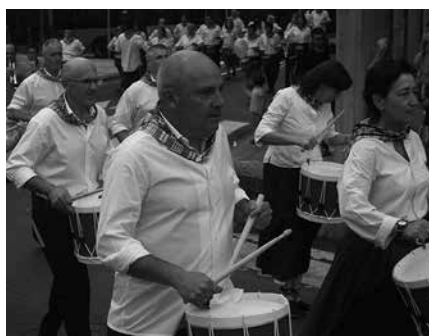
Ekainaren 14an hasiko dira danborradako entseguak.

Usurbilgo Kantu Taldekoak Gasteizera doaz autobusez larunbat honetan, maiatzak 27, Arabako hiriburuan ospatuko den Euskal Herrian Kantuz ekimenean parte hartzera. Honenbestez, Usurbilen ez da ospatuko hileroko ohiko kantu-jira.