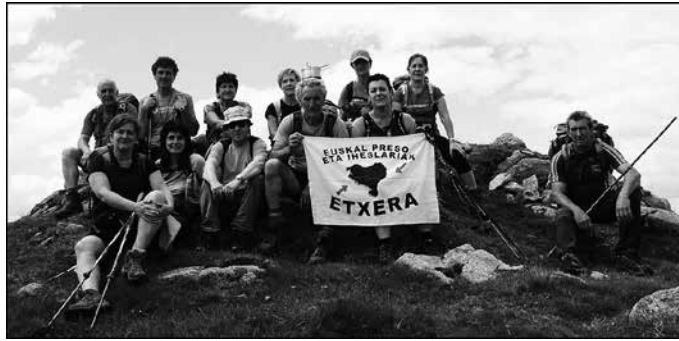
Maiatzaren 13ko astebukaeran, Ereñozu-Lesaka-Senpere mendi irteera osatu zuten.

-Andatza M.K.T.-k antolaturiko irteeretan parte hartzeko derri gorrezkoa da, mendiko federatua izatea eta aseguru txartela indarrean izatea. "Federatu gabe dagoenari tramitea egingo diogu, hala nahi badu. Horretarako gure web orrian aurkitzen da egin beharrekoa, edo gurekin