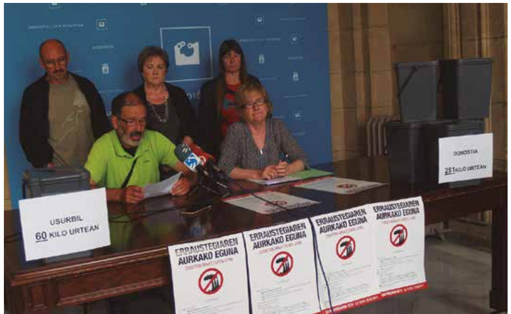
Usurbildar batek eta donostiar batek urtean sortutako erreus kopurua dagoen aldea irudikatu zuten.

Bigarren mezua hedabideei zuzendu nahi izan zieten. “Kontatu egia errausketaz eta hondakinen kudeaketari buruz. Zabaldutako informazio eta eztabaidarako gune zabal eta libreak. Ez onartu hedabide handien eta agintarien agindu bidegabeak”.