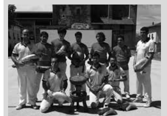
Hurrengo neurketa, igande honetan Hazpamen.

Euskal Herriko errebote txapelketako neurketa jokatuz Zubietak joan den igandean. 13-6 irabazi zioten Donapaleuko Amiluze taldeari. Hurrengo neurketa, igande honetan, maiatzaren 28an jokatuko dute Hazpamen.