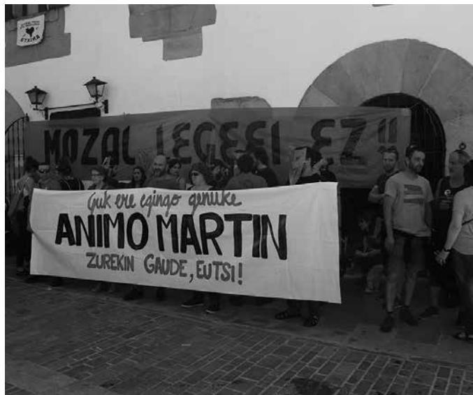
Maiatzaren 13an Mozal Legearen aurkako pintaketak egiten ari zirela, trenak Usurbilgo geltoki parean harrapatutako ekintzaileari babesa adierazi zitzaion 36. Sagardo Egunean Aitzaga atarian egin zen elkarretaratzearen bidez. Mobilizazioa, Mozal Legearen aurka protestatzeko ere baliatu zen.

Ekintza erreibindikatioaren helburua, “Donostiatik Bilbora joaten den trena, Mozal Legearen aurkako mural ibiltarian bihurtzea zen”. Mezua ikusgarri egitea, bide guztian, geltokietan eta bidaiarien aurrean. Halako salaketa ekintzak beharrezkoak direla nabarmentzen dute ekintzaileek, guztiz zilegiak direla,