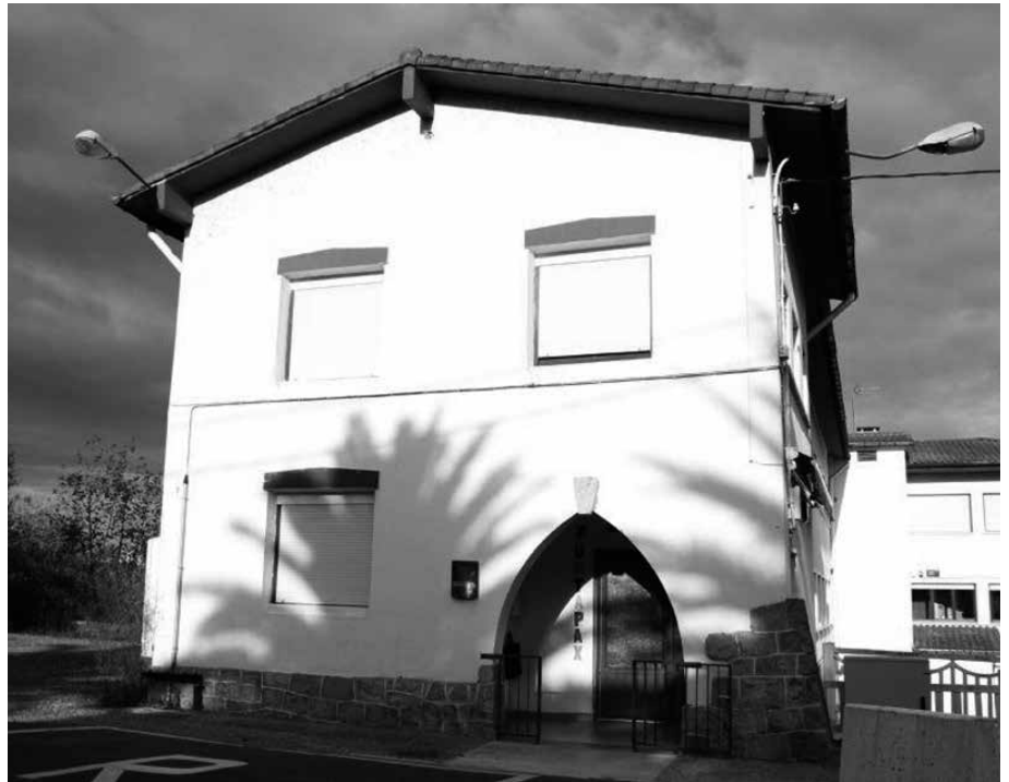
Udaletik berri eman dutenez, hilabete honetan jada sei lagun gehiago biltzen dira Kalezarreko gunean.

Une honetan, 18 lagun biltzen ditu Eguneko Zentroak astelehenetik ostiralera, eta sei asteburuetan. Larunbat, igande eta jai egunetako plaza kopurua igotzea