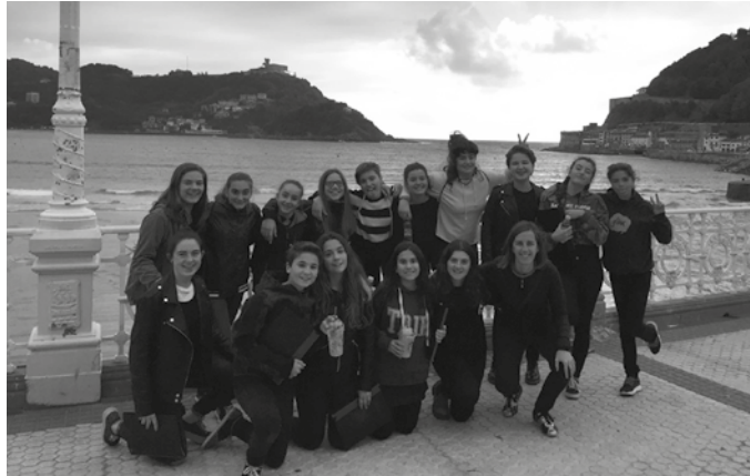
Zumartekoak, Olatu Talkan. Abesbatzako kideak Donostiako Alderdi Ederreko ikuskizunean aritu ziren. Akordeoilariak, aldiz, Donostiako portuan.

B i izen emate iragarri ditu Zumarte Musika Eskolak. Batetik, ekainaren 3rako musika eskolan bertan antolatu duten Lalala soinu gelan apuntatzeko epea maiatzaren 26ra artekoa izango da. Prezioa, 15 euro familiako. Ekimen hau, 0-3 urte arteko haurrei eta haien familiei zuzenduriko musika tailerra da. Egun berean itxiko dute baita, 2017-18 ikasturterako matrikulatzeko epea ere.