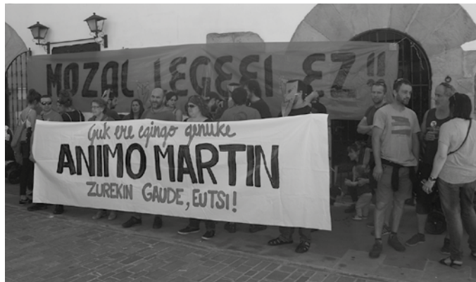
Tren-geltokian Mozal Legearen aurkako protesta baketsu batean larriki zauritu zen ekintzailearen aldeko elkarretaratzeari egin zen Sagardo Egunean.

EAJ-k emendakin partziala aurkeztu zion EHBilduren