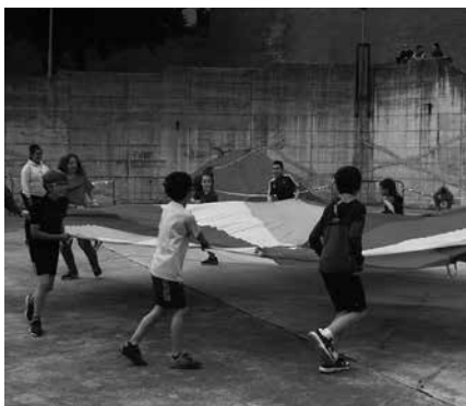
Goizeko 9:00etatik 12:00etara LH eta DBHko ikasleen jokoak Udarregi ikastolan.