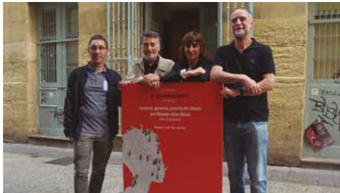
Usurbilgoa, UEUren udako ikastaroen baitan ospatuko den Jakin Jardunaldia izango dugu. Uztailaren 13an eta 14an, hamabi aditu eta aritu bertaratuko dira.

Lankidetzaren balioa gorai-patu zuen. “Gutxitan bezalako lankidetzaz lortu dugu”. Hiru urterako gutxienik bai. Jakin Fundazioarekin hiru urte daramatzate elkarlanean, lankidetzaz horretara batu da orain Usurbilgo Udala. “Azpimarratzekoa eta pozgarria da Usurbilgo Udalak kulturaren eta ezagutzaren alde egin duen