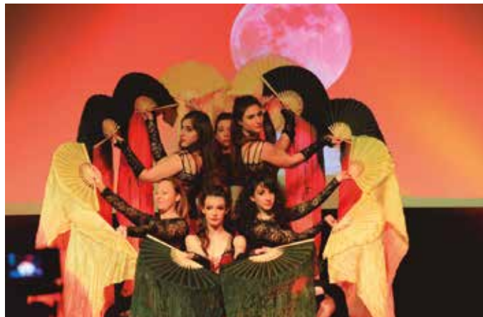
Larunbat honetan Sutegin, puntako ikuskizuna 18:00etatik aurrera.

Emanaldiokien dantza mugimendu soil bat baino gehiago, kultura, herrialde bakoitzak bere emozioak adierazteko, kultura agertzeko eta gerturatzeko duten modua dela ere badela islatu nahi dute.