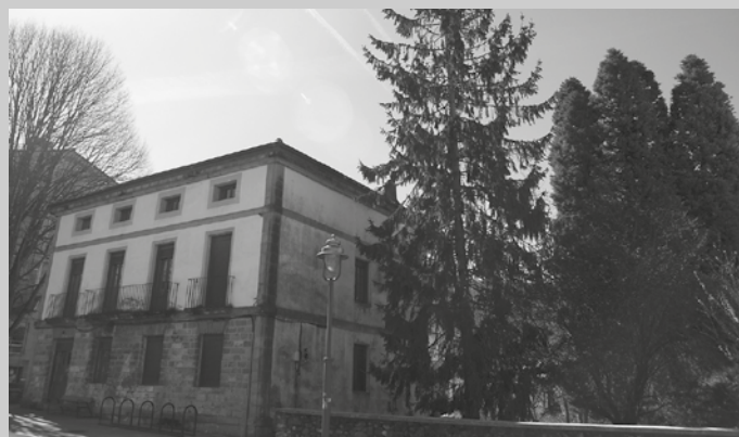
16:00etatik 20:00etara kontzertuak iragarri dituzte: abesbatzak, txistulariak, pop-rock taldeak...