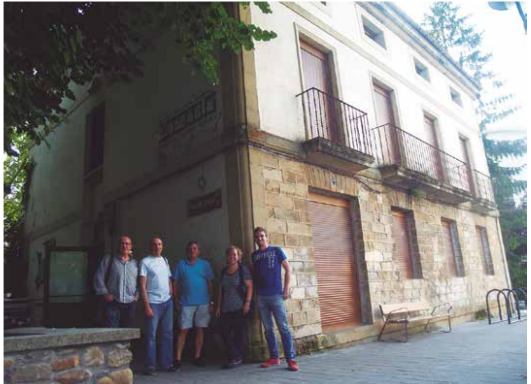
Musikarienez gain, Orbeldi Dantza Taldekoen egoitza ere izango da etorkizuneko.

Errelebo betean den musika eskolako zuzendaritza batzordeko kideekin bildu gara. Haiek ondo oroitarazi dutenez, “halako eraberrikuntza egiteko garaia zen. Etxe hau erosi zenean ere bere urteak bazituen. Orain beste 32 urte gehiago”. Ordutik, gainera biztanleria kopurua nabarmen hazi da, herriko zerbitzuak ugaritu eta indartu dira. Honenbestez, orain, “Zumarteri handitzea tokatzen zitzaion”. Argi dute, musika eskolan ikasi nahi duen orori lekua eman nahi diote, ez dute instalakuntzak ezta usurbildarek ordaindu beharreko kuotak, herritarrentzako lagun giroan musikaz ikasi, gozatu eta bizi ahal izatea mugatzerik nahi.