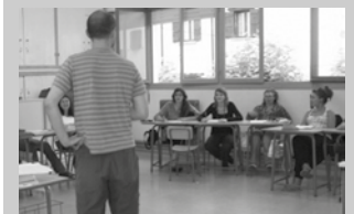
Eskaintza zabala da.