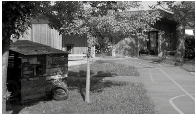
“Aukera ezin hobea da egindako inbertsioari etekina ateratzeko”, dio Zubietako Eskolako mozioak.

2010. urtean Eusko Legebiltzarrak, Zubietako Eskolari lotutako Legez besteko proposamen bat onartu zuen; Zubietako eskolako instalakuntzak hobetu, ikastetxea handitu eta Lehen Hezkuntza osoa modu progresiboan ezartzea. Zazpi urte igaro dira ordutik, eta Gasteizko Parlamentuak hartutako erabakia erdizka bete dela esan daiteke.