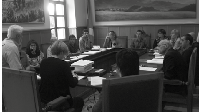
Une honetan dagoen gabezia agerian utzi nahi izan dute Usurbilgo Gure Pakea, Santueneko Gure Elkartea eta Aginagako Arrate jubilatutako elkarteek.

Datuokin udalerrri honek duen begi bistako gabezia agerian utzi nahi izan dute Usurbilgo Gure Pakea, Santueneko Gure Elkartea eta Aginagako Arrate jubilatutako elkarteek. Hiru elkarteek zenbakiok eta xehetasun gehiago biltzen zituen mozio bateratua aurkeztu zuten maiatzaren 30eko udal osoko ohiko bilkuran. Aipatu datuen berri ematearekin batera, udalerrri honek adinekoen egoitza falta duela eta horixe eskatu zioten mozio bidez Usurbilgo Udalari; "beharrezko gestioak egin ditzala, bai Aldundiarekin eta baita Matia