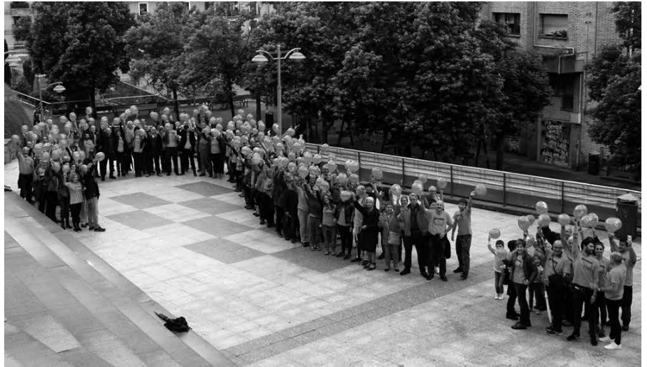
“Inoiz ikusi gabeko galdera ikur erraldoia osatuko dugu denon artean”. Usurbilgo Gure Esku Dago taldearen autobusa 15:30ean abiatuko da. Aurretik eman behar da izena.

2017a amaitzerako, galdeketak eta erabakitze eskubidearen inguruko eztabaida milioi bat herritar bizi diren eremuetara iritsiko dira. “Lorpen itzela da hori. Gure esku dagoen guztia egingo dugu herri honetan erabakia gauzatu dadin”. Larunbat honetan, hori izango da Bilbon defendatuko duten mezua: “erabakitze prest gaude eta libreki eta demokratikoki galdetuak izan nahi dugu Euskal Herriaren etorkizun politikoa erabakitze”. Horregatik, herritarrei dei egiten diete parte hartu dezaten irudikatuko den mosaiko erraldoian. “Galdeketetan parte hartu duzuen herritarrak, galdeketa antolatzen ari zaretenak eta erabakitze prest zaudeten guztiak zita garrantzitsua duzue Bilbon. Ekainaren 10ean, denok Bilbora. Erabakitze prest gaude”.