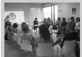
Bigarren plan hau ere lau urtez izango da indarrean; 2020. urtera arte.

Plan malgua izango da, aldaerak onartuko dituena. Etengabe berrikusi, ebaluatu, berri eta moldatuko da. Eragile ezberdinen arteko elkarlan, hausnarketa, eta adostasunez bideratuko dira egitasmoak. Plan honetan aurreikusitako jarduerak burutzeko urtero, 2017-2020 urte artean, 54.000 euro bideratzea aurreikusten du Udalak. Guztira, 216.000 euro.