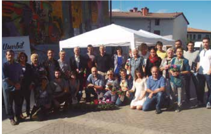
Dokumentu bat aurkeztera doaz herritarrei, ekainaren 13 eta 20rako deitu dituzten lan saioetan.

Jasotako ekarpenak dokumentu tekniko batean bildu ditu Usurbilgo Udalak. “Mugikortasun jasagarriaren irizpideetan oinarrituta, kale, plaza eta auzoetako herri-lan edo eta birmoldaketa proposamenak jaso dira” eta orain dokumentu hau aurkeztera