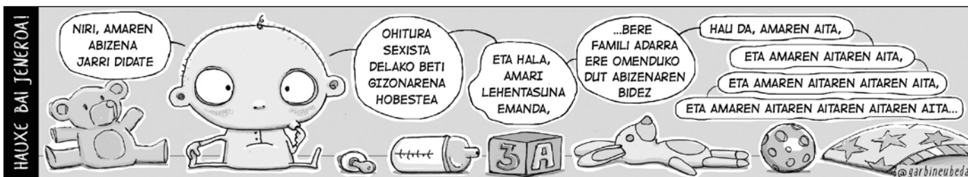
TOKIKOMeko hainbat hedabidek sustaturiko tira komikoa.