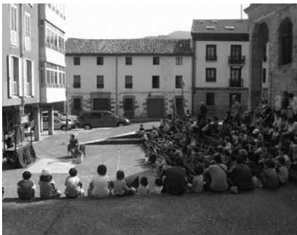
Irazu kaleko "anfiteatroan" egingo dute ikuskizuna. Irudian den plazatzxan.

Euria egiten badu, saioa Askatasuna plazan egingo da. Udarregi Ikastolak antolatu du saio hau eta 17:00etan hasiko da.