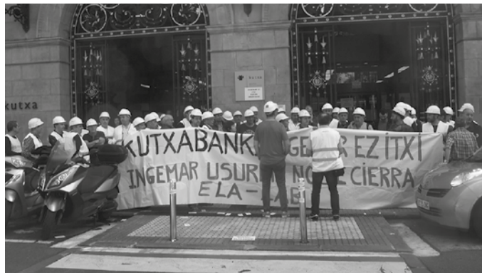
Kutxabankek Donostiako Garibai kalean duen egoitzan mobilizatzen ari dira astelehen, asteazken eta ostiral goizero, 11:00ak eta 12:00ak artean.

Mobilizaziook iragartze-ko maiatzaren 26an egin zuten agerraldian argitu zuten elkarretaratzeon zergatia. “Hainbat informazioen arabera, Kutxabank erakundea, konkurtsoko hartzekoduna denez, estutzen ari da Usurbilgo plantila osoarentzako