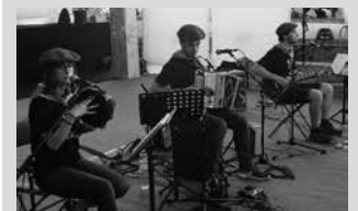
Trikitixa Elkarateak disko batean plazaratuko ditu bi abestiok.

Euskal Herriko Trikitixa Elkarateak antolatu duen Maketa Lehiaketan 10 abesti saritu dituzte, tartean, Usurbilgo Ttipika Dantza Gidatuen taldekoen bi kanta; "Ezinaren eginez" eta "Iraltz arina". Bi abestiok laster entzungai izango ditugu. Trikitixa elkarateak ekainaren erdialdetik aurrera grabatuko duen Maketa Lehiaketako gainerako zazpi trikitilari bakarlari, bikote zein taldeek aurkeztu dituzten 8 abesti sarituekin batera. Zorionak!