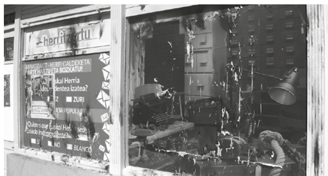
Gure Esku Dagoren salaketara batu da Usurbilgo Udala.

Salaketa horretara batu da orain Usurbilgo Udala. Gai honi buruzko mozioa aurkeztu zuen EHBilduk azken osoko ohiko bilkuran. Gehien- go osoz onartu zuten. “Kartel