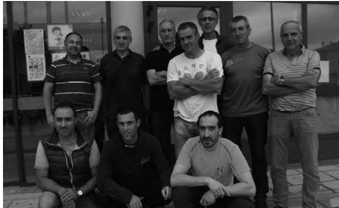
Kirol jarduera ezberdinetan hezi eta trebatutako herritar taldea da, ekainaren 24ko ekitaldia prestatzen ari dena.