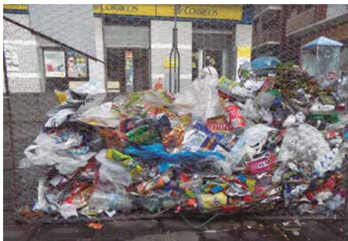
Udazken eta negu partean txoko ezberdinetan ikusgai izan genuen, eta orain, Mikel Laboa plazan kokatu dute berriz.

Kanpaina honekin, hondakinak lurrera ez botatzeko jarreran eragin nahi du Udalak. Zer jokabide dugun bis-