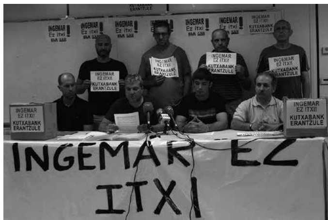
Donostiako Garibai kaleko Kutxabank atarian elkarretaratzeak egiten segiko dutela ohartarazi dute langileen ordezkariak.

Baita diskriminatzailea ere, "egoera berdinean dauden taldeko beste lantegi batzuen aldean. Negozioaren bideragarritasunari, taldea osatzen duten pertsona juridikoei eta konkurtsoaren menpeko hartzekodunei on egin beharrean, kalte egiten die". Negozio-bolumena murrizten du, eta honenbestez, enpresaren bideragarritasuna berma dezaketen emaitza onak kaltetu ere bai. "Gainera, gauzatzen ari diren aktiboen salmenten ondorioz ondarea ere urritzen da etorkizuneko negozioa aurrera eramateko aukerak gutxituz", salatzen dute.