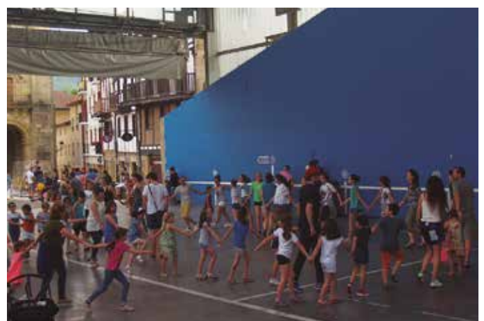
Ekainaren 10ean ospatu zen Ikastolaren Eguna. Irudi gehiago www.noaua.eus web orriko Argazkitegian aurkituko dituzue.