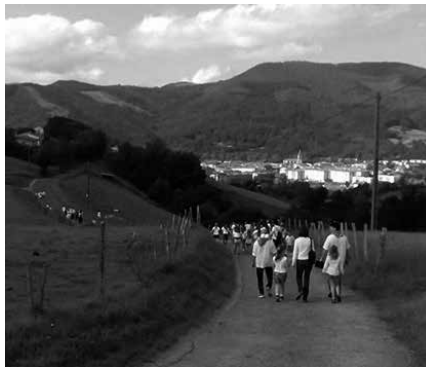
Ekainaren 24ko bazkaritarako txartelak salgai izango dira ekainaren 20ra arte Kaffan.

E kainaren 24an ospatuko den oilasko biltzaile txikien irteerari lotutako zenbait ohar helarazi dizkigute. Batetik, iragarria zegoen moduan 09:00etan ez, 10:00etan irtengo direla auzoko plazatik. Bigarrenik, hitzorduan "parte hartzen duten haurrek, guraso baten ardurapean parte hartuko dute soilik". Eta azkenik, une honetan, presazkoena den deialdia. Kalejiraren amaieran, Kalezarren bertan ospatuko duten bazkaritarako txartelak salgai izango dira ekainaren 20ra arte Kaffa kafetegian.