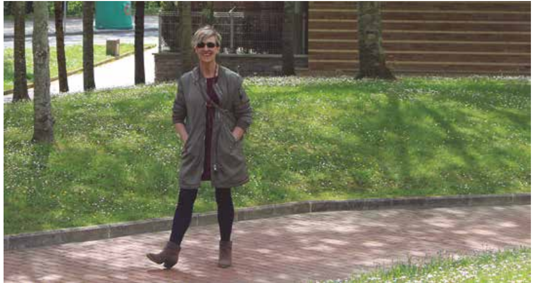
Aho bete amets (Denonartean) saiakera liburuan oinarritzen den ikastaroa eskainiko du uztailean Donostian.

Urte hauetan ikusi dut ahozkoa jaisten joan dela apurka-apur-