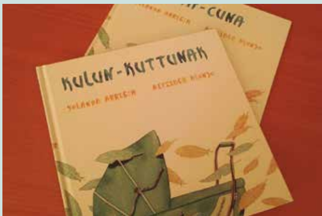
“ Aho bete amets (Denonartean, 2016) saiakera buruarekin egin dut eta Kulun kuttunak (Denonartean, 2016) album ilustratua bihotzarekin”.