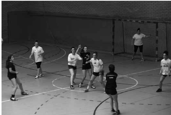
Ekainaren 24an ospatuko da. Ondoren, afari baten bueltan elkartuko dira frontoian. Argazkia duela urte batzuetako eguneko da.

Usurbil K.E.-ren batzarra ostiral honetan, ekainaren 16an