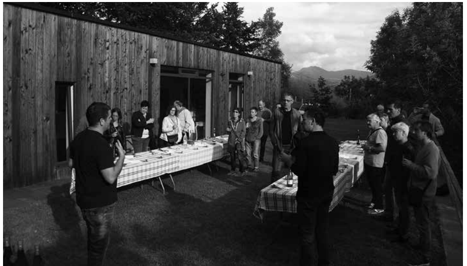
Dagoeneko 36 sagardotegi dira ‘Euskal Sagardoa’ jatorri izendapenarekin bat egin dutenak, tartean Usurbilgo Saizar eta Aialde-Berri. Etorkizunean gehiago izango dira.

Bezperan jendaurrean aurkezturiko aipatu izendapenari buruzko hainbat argibide eskaini zituen baita Unai Agirre teknikariak. Urrats historiko eta garrantzitsutzat jo dute izendapen hau sortzea. Dagoeneko EAE-ko 36 sagardotegi dira egitasmoarekin bat egin dutenak, tartean Usurbilgo Saizar eta Aialde-Berri, etorkizunean gehiago izango dira. 1,32 milioi litro sagardo ekoizten dira jatorri izendapen honekin, ekoizpen osoaren