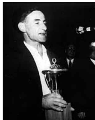
1967ko txapelketan bigarren izan zen. Saria eskuetan dela ageri da Zeruko Argiaren argazki honetan.

Pilotalekuan bildutako entzuleak berriro eten du Xalbadorren kantua, baina oraingoan txalo zaparrada bihurtzeko lehengo txistu eta fuerak. Xalbadorrek, begiak bildu eta airean utzi dituen hitzak ehizatzen ditu atzera ere: