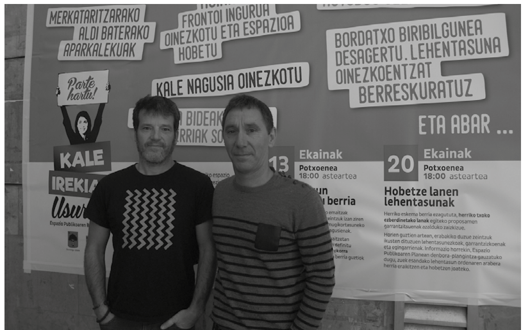
Kale Irekiak egitasmoaren baitan, bilera irekia deitu dute ekainaren 20rako. Potxoenean egingo da, 18:00etan.

Oinezko eta autoentzako eremuak zeintzuk izango diren, nola mugitu behar dugun herrian, garraio publikoaren