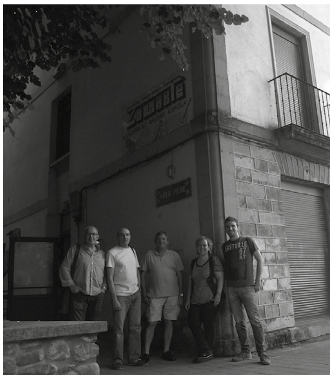
Musika Eskola birgaituko dute, “dagoenetik abiatuz, eta irisgarritasun, jasangarritasun eta segurtasun irizpideak kontuan hartuta”.

Musika eskola birgaituko dute, “dagoenetik abiatuz, eta irisgarritasun, jasangarritasun eta segurtasun irizpideak kontuan hartuta”. Handitu egingo dute eskola, Txaramunto aldera. Azpiegiturak hobetuko dituzte,