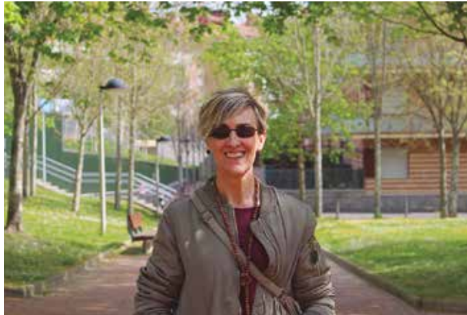
“Amets egitea ere bada zure burua oraindik ez dagoen leku horretan kokatzea. Imaginatzea. Eta horri garrantzia handia ematen diot nik”.

Ametsa, zentzu osoenean. Zeren amets egitea ere bada zure burua oraindik ez dagoen leku horretan kokatzea. Imagina-