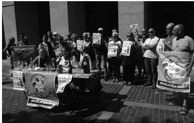
Donostiako Easo plazan egingo da gose greba, ekainaren 14tik 21era.

Protesta eredu aldazteza erabaki dute oraingoan. “Milaka