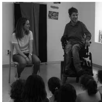
Interesatuta daudenak ostiral honetan agertu daitezela 17.30ean Sutegin.

Ostiral honetan, ekainak 16, Atea Teatrok 20:30ean Sutegin antolatu duen Lehen Antzerki Bakarriketa Laburren Gaubelan parte hartuko du Telmok. Sarrera 6 eurotan eskuratu ahalko da. Ordubete eta hogei minutuko saioan, 5-20 minutu 6 antzerki pieza laburrez goza-