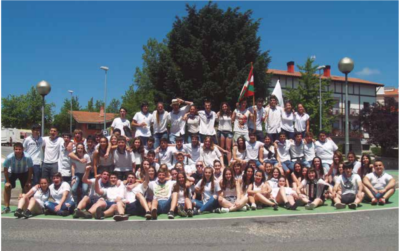
Ekainaren 29an osteguna, goizeko 6:00etan abiatuko dira oilasko biltzaileak.

E skaintza zabala eta antzeta prestatu du aurten ere Mikel Laboa plazan kokatuko den txosna guneko antolakuntzak. Laguntzarako deia egin dute. “Txosnetako txandak osatzeko lanekin ez gara hasi, baina eskertuko dugu usurbildarron laguntza txosnan txandak betetzeko”, adierazi diote txosna batzordeko kideek NOAA!ri.