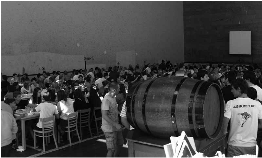
Bazkarirako txartelak aurrez dituzue salgai Aitzagan, Bentan, Bordatxon eta Txiribogan. Argazkia artxibokoa da eta 50. urteurreneko festari dagokio.

Jokalari, entrenatzaile, guraso eta Usurbil Kirol Elkarte kide guztiak bilduko dituen eguna ospatuko dute larunbatean, ekainaren 24an. Denboraldia borobiltzeko antolatu