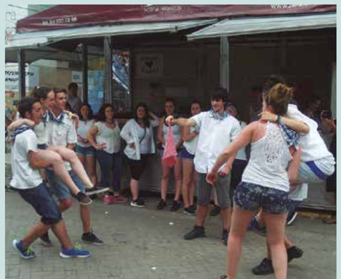
Herrian zehar joko edo erronka ezberdinei aurre egin beharko diete auzoetako parte hartzaileek.

Aurreko urteetako Elegante Eguna ordezkatzeko duen ekimen berria dugu. “Auzo desberdinen arteko partaidetza sustatzeko Gazteartekotik ateratako iniziatiba da”, azaldu digute Txosna Batzordetik. Herrian zehar joko edo erronka ezberdinei aurre egin beharko diete auzoetako parte hartzaileek. Ez da hemen amaitzen ekimena. “Pentsatu dugu Usurbilgo auzoetan ere, auzo guztiak elkartu eta ekintzaren bat egitea”, hortxe aurrera begira duten erronka. Auzoen arteko elkarlana eta parte hartzea sustatu nahi dute hartara.