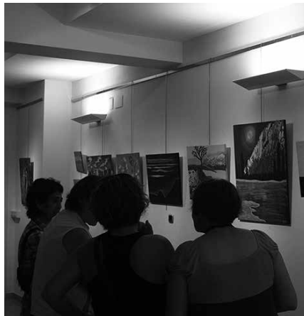
Artzabalgo pintura ikastarokoan lanak eta Eguneko Zentrokoan eskulanak ipiniko dituzte ikusgai asteburu honetan Sutegin.

■ Ekainak 25, igandea: Ordutegia: 10:00-13:00.