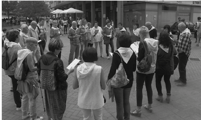
Uztailaren 1ean aterako dira kantuan. Zikiro-jana girotuko dute eguerdian.

Saio harekin hileroko kantu-jirei eta astearteroko entsegu saioei amaiera eman diete uda osterarte. Baina oraindik kantu zaleentzako azken hitzordu bat bada; Usurbilgo jaietan hain zuzen, uztailaren 1ean, 12:00-14:00 artean. “Kuxkuxtu taldearekin egingo dugu kantu jira. Goizeko 11:00ak aldean Patri tabernan elkartzen gara ezdarriak eta tripa pixka bat betetzeko. Han hamaiketako egiten dugu. Aurten Kale Nagusitik kalejira egitea pentsatu dugu, Iturralde Botika aurreko iturri horretan kanta pare bat