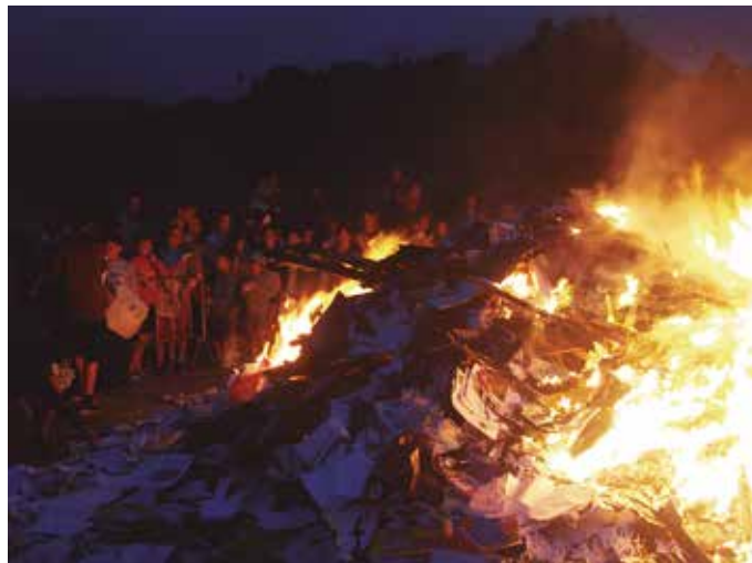
San Joan eskea arratsaldeko 15:00etan hasiko da. San Joan sua, ohi bezala, gaueko 22:00etan piztuko dute.