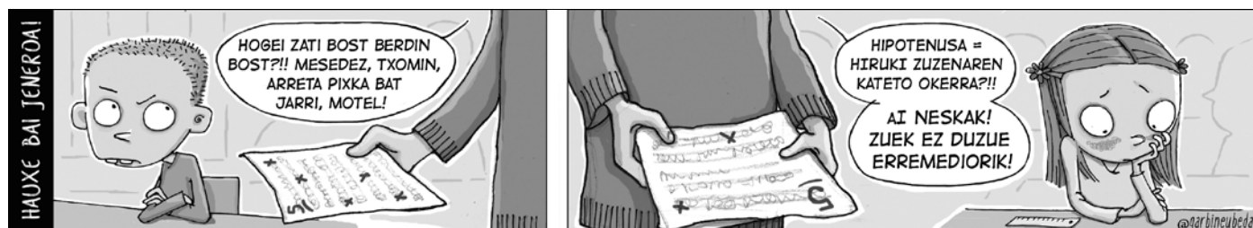
TOKIKOMeko hainbat hedabidek sustaturiko tira komikoa.