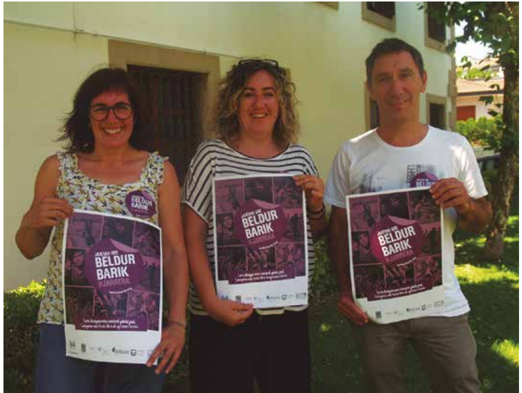
Indarkeria sexista prebenitzeko 15-26 urte arteko gazteei zuzenduriko egitasmoa da “Beldur barik”.

Jai parekideen aldeko konpromiso argia berresten du Udalak ekimen honekin. Festetan denok ondo pasa, beldurrik gabe jai giroaz lasai asko gozatu eta