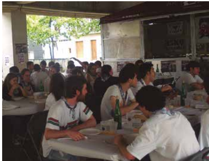
Gazte bazkaria uztailaren 1ean egingo da. Txartelak Aitzagan eskuratu daitezke.

Herriko musikariak abesti ezagunak jotzen ikusi izan ditugu urte luzez. “Usurbilgo musikarietari ere oholza gainera igotzeko aukera eman nahi genien”, adierazi dute Txosna Batzordetik. Hitzordu hau berreskuratzea erabaki du Txosna Batzordeak aurtengoan, hori bai, itxura berrituta. Musikari talde bakoitzak talde ezagun bat hautatu eta haren abestiak joko dituzte oraingoan.