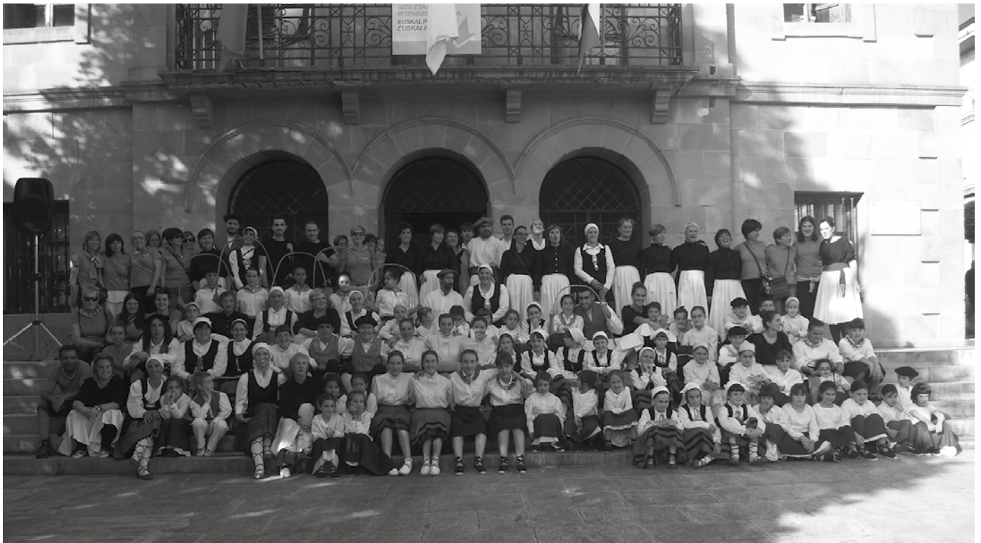
Dantzarien egun handia ekainaren 29a izango da. Baina ekitaldi gehiagotan ere arituko dira.

Azken urteon ildotik, Usurbilgo jaien hasiera Orbeldi Dantza Taldekoen ikasturte amaierarekin egokituko da. Festetan hiru hitzorduetan ikusiko ditugu dantza giroan. Baina haien egun handia, txupinazoa jaurtiko den ekainaren 29a izango da.