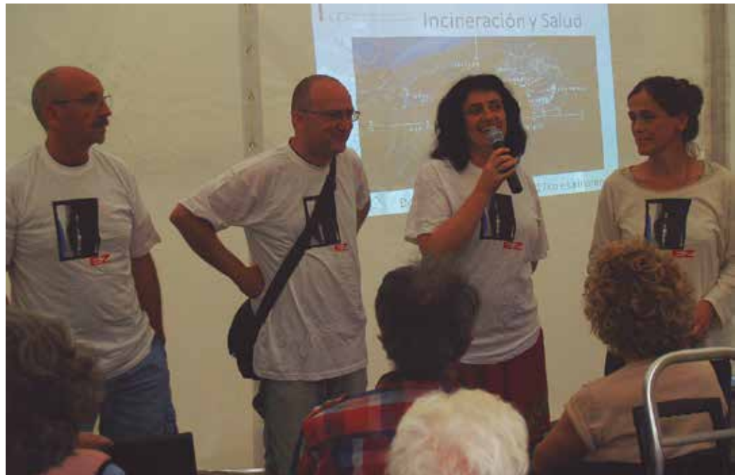
Baraualdian egin duten astebete honetan zehar, eragile desberdinen babesa jaso dute gose grebalariek.

Gose grebalariek, eguntan bertaratu direnen nahiz auzokideen aldetik jasotako babesa eskertu dute. Argi zioten gose grebalariek giza-kate egunean, “guk gure eta on-