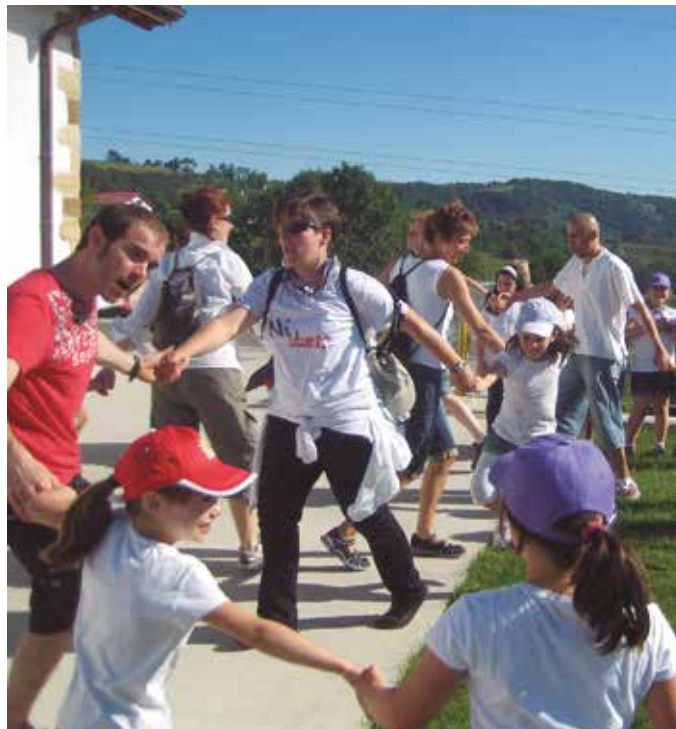
Ekainaren 24an, goizeko 10:00etan hasiko da oilasko biltzaileen kalejira.

Auzoan barrena, baserriz baseri kalejiran ibili ondoren, herri bazkaria egingo dute. Hori bai, txartelak aldeztatik eskuratu behar ziren Kaffa kafetegian (ekainaren 20ra arteko epea zegoen).