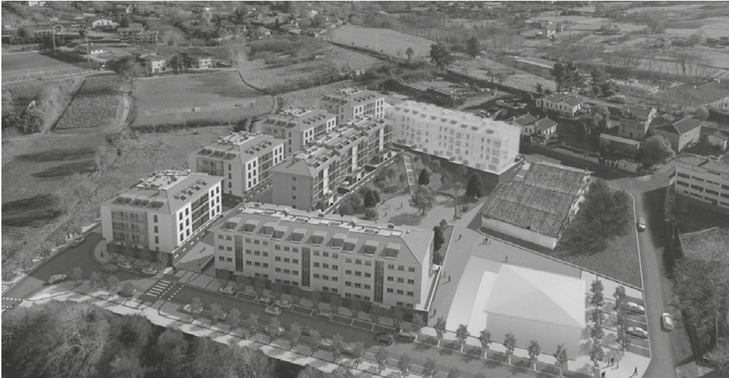
Aspaldiko egitasmoa da hau. Laster hasiko dira eraikitze-lanak.

E kainaren 27ko osoko ohiko bilkuran zozketarako esleipen oinarriak onartuko dituzte eta uztailean irekiko dira izen emate zerrendak. “Eskatzaileak aipatutako kupo batean soilik eman ahalko du izena, eta kupo horiei dagokien etxebizitzarik esleituko ez balitzaioke, zerrenda orokorrera igaroko litzateke”, ohartarazi dute Udaletik.