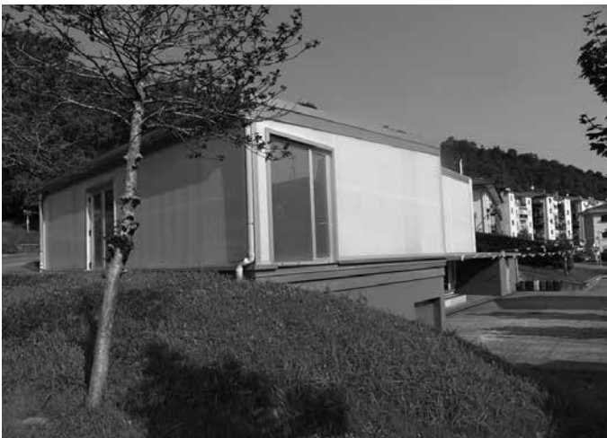
Santueneko frontoi atzean dagoen egoitza.