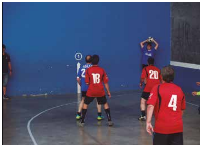
Beteranoen arteko eskubaloia eta futbol partidak, pilota egokitua, txirridularientzako ginkana, pisu jaurtiketa, giza proba... Eskaintza oparoa izan zen.