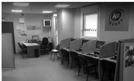
Uztailean, goizez zabalduko dute KzGunea. Abuztuaren itxita egongo da.