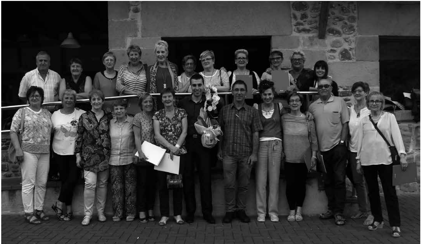
Usurbilgo Udalak Esperientzia Eskolako ikasleei banaturiko diplomekin amaitu zen 2016-2017 ikasturtea.

K laseak amaitu, ikaskide edo lankideak agurtu eta oporretan murgiltzeko garaia heldu zaie askori. Baita Esperientzia Eskolakoei ere. Usurbilgo Udalak ikasleei banaturiko diplomekin amaitu zuten ekainaren 13an Artzabal-en, irailaz geroztik abian zuten 2016-17 ikasturtea.