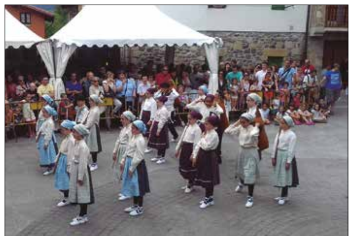
San Joan jaietako argazki eta bideo gehiago noaua.eus web orriko Argazkitegian aurkituko dituzue.