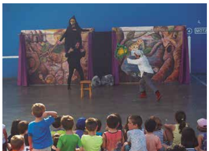
Ekainaren 20an, Patata Tropikala taldeak “Azken Eguzkilorea” izeneko ikuskizuna eskaini zuen frontoian.