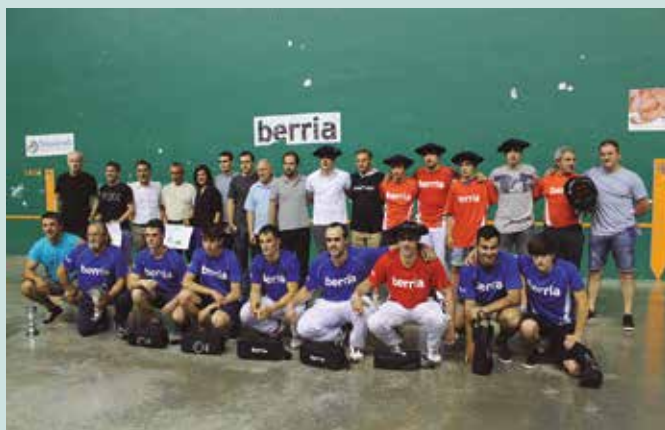
Hamalau edizio bete ditu Berria Txapelketak eta bitan Pagazpe izan da garaile. Argazkian, finaleko protagonistak. Tolosa zein Usurbilgo jokalariek.

Final zortzirenetan, Intxurre Alegiako taldea izan zen usurbildarren aurkaria.