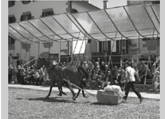
San Ixidro egunean bezala, jaietan ere zaldi dema egingo da.

Jaietan, uztailaren 1ean, idi eta zaldi demak eta giza proba antolatu dituzte arratsaldeko 18:30ean hasita.