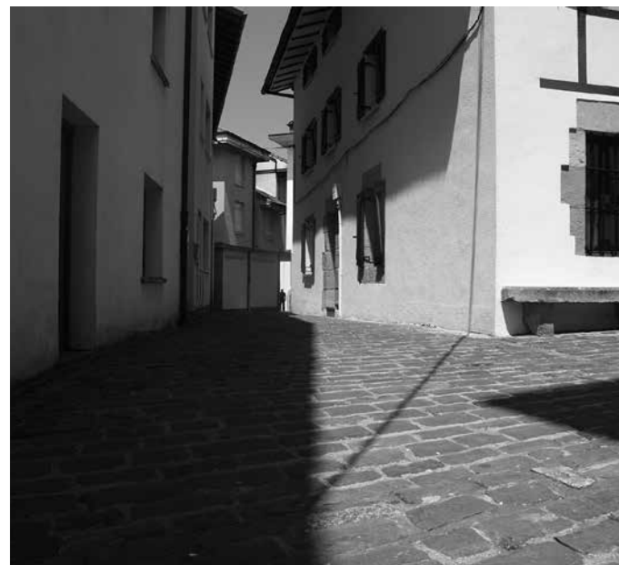
Herriko jaien ondoren hasiko dira lanak eta hiru hilabetez luzatuko direla diote udal iturriek.

da kontratista. Obrek eragin ditzaketen eragozpenak direla eta, udaleko ordezkariak alde