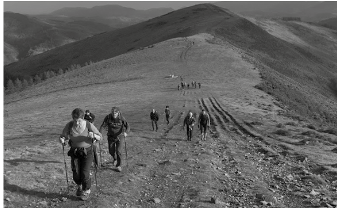
Uztailaren 12ra arte egongo da izen-ematea zabalik.

euro FEDME gehigarria dutenak; 45 euro ez dutenak.