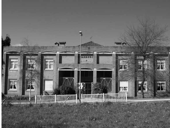
Zumarte berritzen duten bitartean, hiru egoitzatan banatuko da Musika Eskolaren jarduera. Udarregi ikastolan, Santuenean eta Artzabalen. Datozen bi ikasturteetan egon beharko dute sakabanaturik.

Leku aldaketa uztailearen 5 eta 6an egin asmo dute Zumartekoek. Garraio lanetarako laguntza eskatu dute. "Zumarte