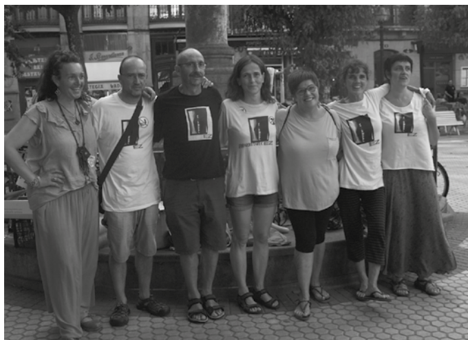
Hunkituta, pozik eta esker oneko agertu ziren gose grebalarriak.

Esker ona adierazi zieten, lagundu duten guztiei, antolatuta diren ekimenetan parte hartu dutenei, edota modu batean edo bestean babesa eta elkartasuna adierazi dieten denetarikoa eragile eta norbanakoei. Norbanakoen artean, modu berezian eskertu zituz-