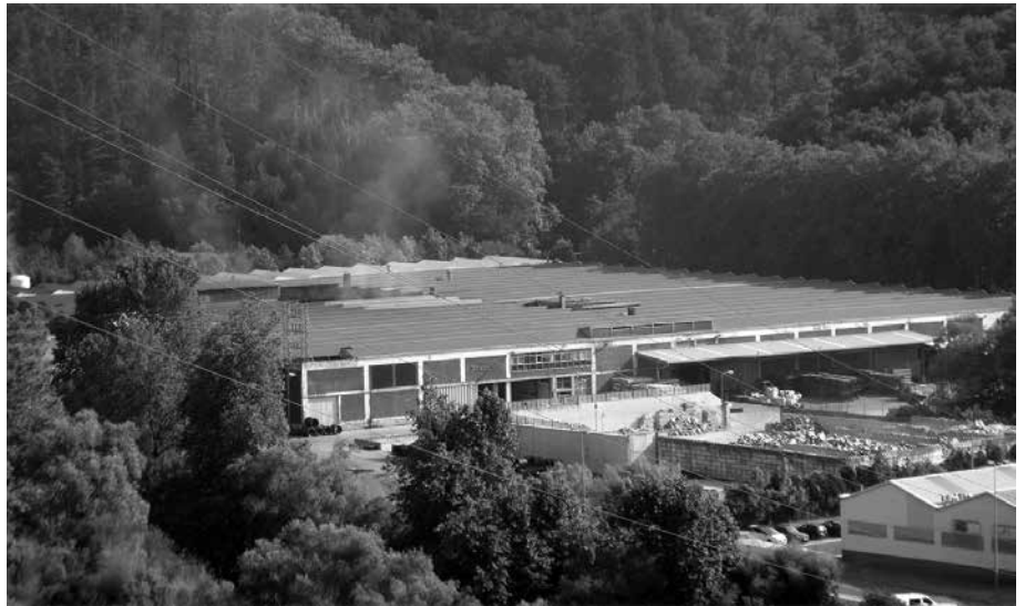
"Egoera konpontzeko saiakera jarraituek ez dute fruiturik eman", udal gobernuak dioenez.

"Jakitun gara enpresa honen ke isurketek herrian sortzen duten kezkaz, eta legealdi honetan ere beraiekin harremanetan izan gara problematika horri irtenbidea bilatu nahian. Duela bi urte labe berria jarri behar izan zuten Udalaren eskaera jarraituen ostean, eta tarte honetan gure asmoa izan da labe zaharra