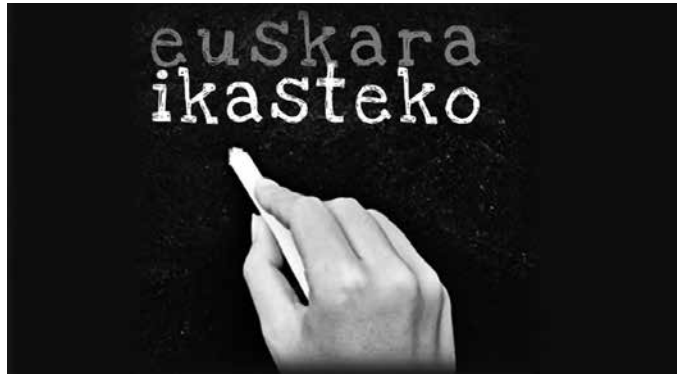
Diru-laguntzak ekainaren 26tik uztailearen 7ra arte eska daitezke.

Herritar guztiek matrikula kostuaren % 100 jasoko dute (500 euroko mugarekin), baldintza hauek betetzen badituzte: ■ %80ko asistentzia izateagatik. ■ Gutxieneko aprobetxamendua. (Aipatutako portzentajeak gutxitu egin daitezke aurkeztutako eskaeraren arabera. Hau da, diru-laguntzetarako dagoen dirua baino eskaera handiagoa bada, proportzionaltasunaren irizpidea aplikatuko da).