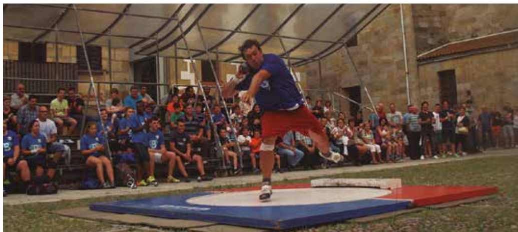
Erakustaldiez gain, argazki erakusketa bat antolatu zuten. Argazki horiek Oiardo Kiroldegian aurkituko dituzue.