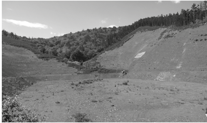
Udalari aldeztatik jakinaraziko zaio zein egunetan eta zer ordutan izango diren leherketa horiek.

Aipatu moduan, hilabete honetan egin asmo dituzte leherketok, “egunez beti, eta Udalari aldeztatik jakinaraziko zaio zer egunetan eta zer ordutan izango diren, interesdunek informazioa eskura izan dezaten, eskatuz gero. Helbide elektronikoa bat edo telefono-zenbaki bat ematen digutenei ere zuzen-