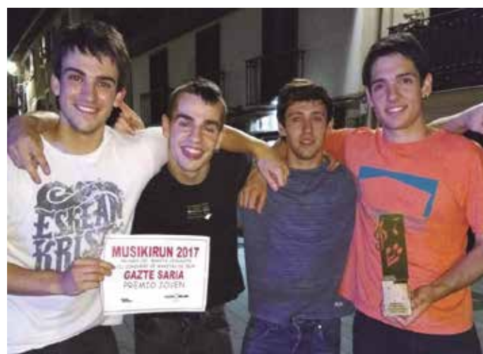
Ekainaren 17an Iruen jendaurrean ospaturiko finalean Gaztea Saria jaso zuen Usurbilgo musika taldeak. Zorionak!