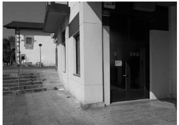
Atez ateko bilketaren informazio bulegoa izandako egoitza.