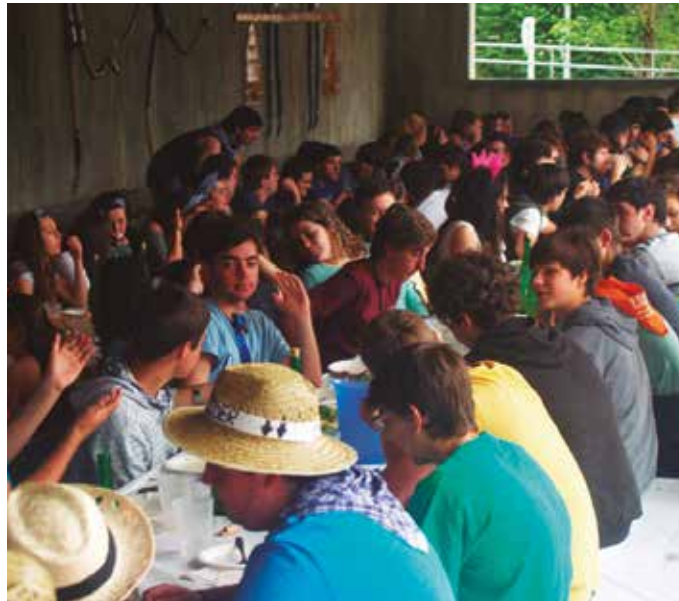
Ekainaren 30ean ostirala, txosna gunean egingo da gazte bazkaria.