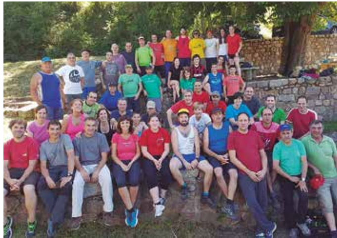
Ekainaren 18ko asteburuan Peñaloscintosen izan ziren, kanpamendua prestatzen.