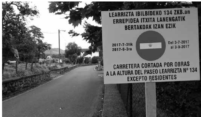
Bi hilabetez gutxienik, Santuenea Zubietarekin lotzen duen herri bide zatiari eragingo diote.

Donostiako Udalari, “obrek bi udalerrioi eragiten dienez, bidezkoa eta zuzena iruditzen