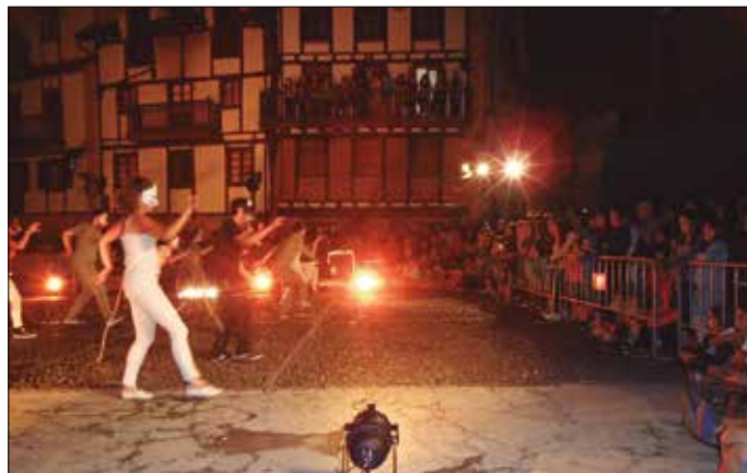
Argazki gehiago, noaia.eus web orriko Argazkitezian.