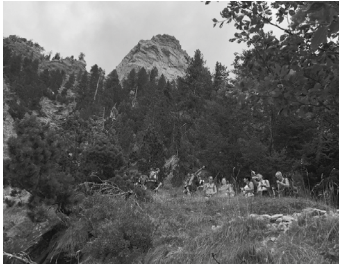
Iaz, Ordesan izan ziren. “Aurten, Benasqueko bailarara joango gara, Posets (3.375 m) egiteko asmoz. Angel Orus aterpean ostatua hartuko dugu”.

Ordainketak, kontu zenbakio-tako batean: