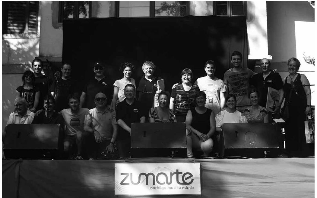
Datozen bi ikasturteotan bideratuko dira Zumarte berritu eta handitzeko lanak.

Maiatzaren 8an gai honi lotutako Kontuen Batzorde Berezira 2016ko Kontu Orokorra eraman ostean, 15 egunez zabaldu zen epearen baitan alegaziorik ez zen aurkeztu. Ekainaren 27ko osoko ohiko bilkuran gehiengo osoz onartu zen behin betiko EHBildu eta PSE-ren aldeko bozkekin. EAJ-ko ordezkariak abstenitu ziren.