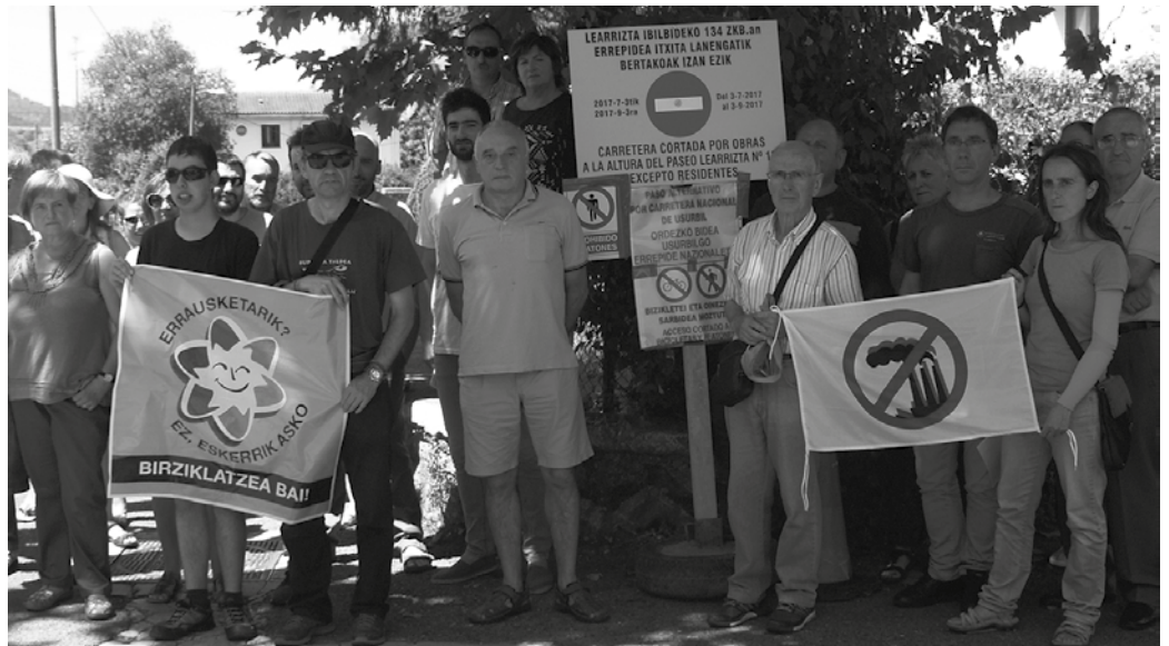
Santuenea eta Zubieta lotzen dituen herri bidea itxi ondoren, haserre agertu ziren Zubietako zein Usurbilgo alkateak.

Bidea ixteak dakartzan arrisku eta kalteez ere ohartarazten dute Zubietako Herri Batzarrek