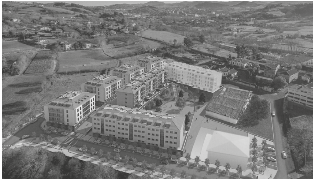
Ugartondo eremuan eraikiko diren etxebizitzetan oinarriak behin betiko onartu zituen udalbatzak.

Ugartondo eremuko C eta D partzeletan eraikiko diren babes ofizialeko 46 etxebizitza eta A eta B partzeletan eraikiko diren beste 46 etxebizitza tasatuak, guztiak beren garaje eta trastelekuekin esleitzeko oinarriak behin betiko onartu zituen udalbatzak, ekainaren 27ko osoko ohiko bilkuran. Erabaki honen berri eman eta eskabideak egiteko epea irekiko dela jakinarazteko iragarkia argitaratu du Udalak. Iragarki hau argitara eman eta biharamunik zenbatzen hasita, eskabideak aurkezteko 20 eguneko epea izango dute interesdunek.