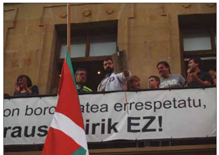
Hurbilagok piztu zuen txupinazoa.

Txupinazoa jaurtitzeko ohera izan zuen Hurbilago Elkartea egiten ari den lana ere goraiatu eta zoriondu zuen Udalak.