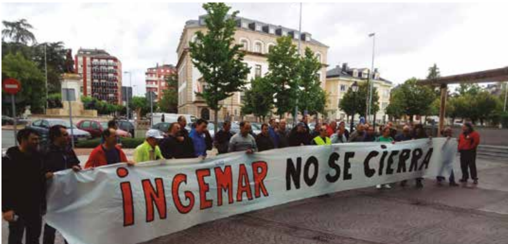
Ekainaren 29an Lugoko epaitegi aurrean elkarretaratu ziren "Ingemar ez itxi" aldarripean.

Ingemarreko Usurbilgo plantako langileak Lugon (Galizia) izan dira egunotan. Ekainaren 29an bertako epaitegi aurrean elkarretaratu ziren "Ingemar ez itxi" aldarripean, langileek bertatik NOAUA!ri berri eman eta Lugotik helarazitako irudian ikus daitekeen moduan. Gero Ingemar taldeko hango