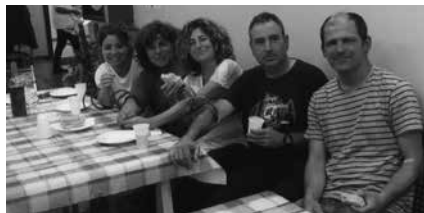
Astlehenean, 18:00etatik 20:30era arte.

Bi hileroko hitzorduari hutsik egin gabe antolatu du Usurbilgo Odol Emaileen Elkarteak. Astlehenean izango da, uztailearen 10ean, 18:00-20:30 artean ambulatorioan.