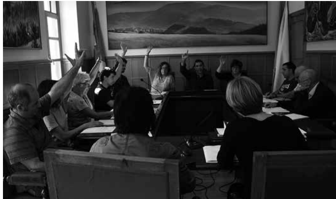
Ekainaren 27ko osoko ohiko bilkuran, gehiengo osoz onartu zuen udalbatzak.

Ekainaren 27ko osoko ohiko bilkuran gehiengo osoz onartu zuen udalbatzak “Usurbil 0.0”, azken urtebetean landu den hondakinen prebentzio eta kudeaketa programa. “Ibilbide luze baten emaitza da”, udalerrri honek eremu honetan urte luzez egin duen ibilbide luze batean beste urrats bat, Udalak azpimarratzen duenez.