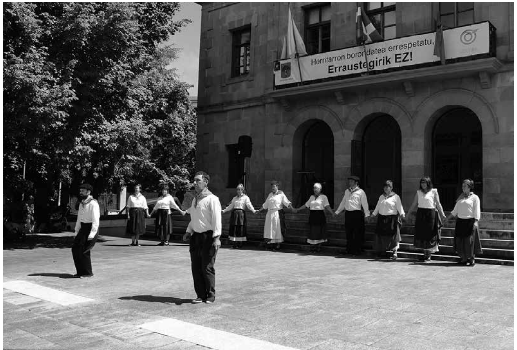
Jaietan udaletxeko balkoian zintzilik izan zen pankartak zera zioen: “Herritarren borondatea errespetatu. Erraustegirik ez!”.