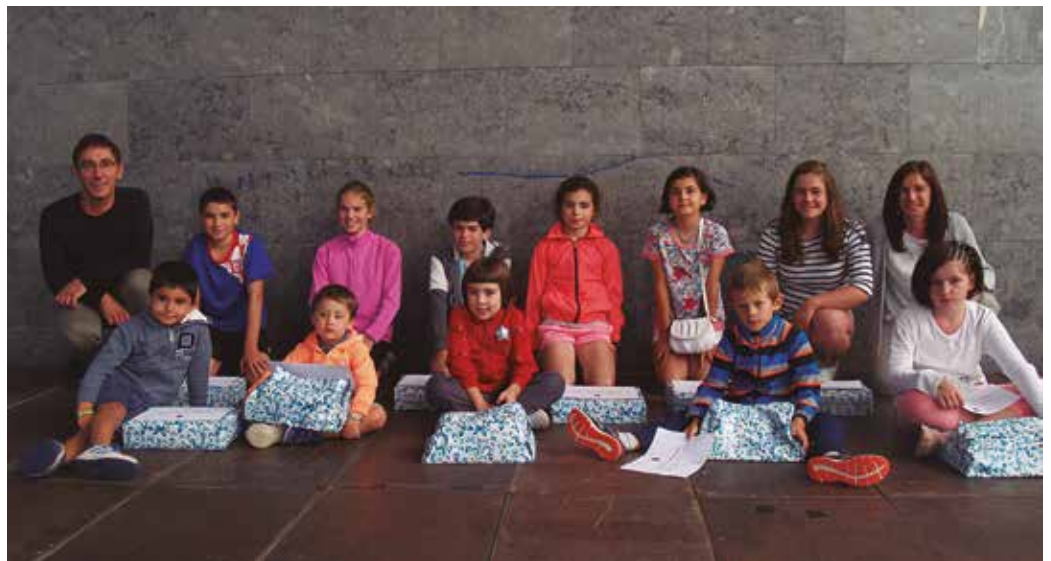
Partehartzea handia izan zen. Argazkian, gazte sarituak.