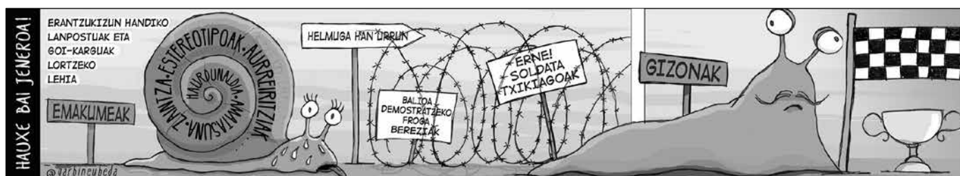
TOKIKOMeko hainbat hedabideek sustaturiko tira komikoa.