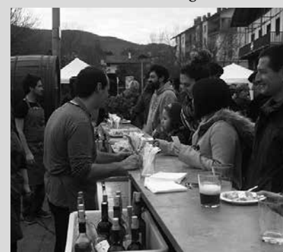
Dema plazan eta frontoi inguruan egingo da uztailearen 28ko pintxo-potea.