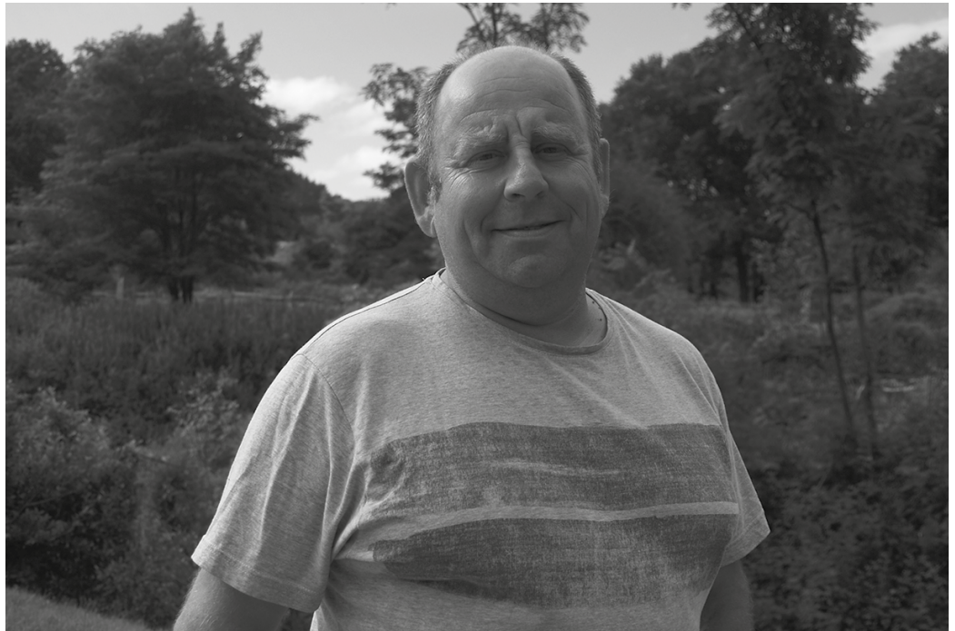
“Baikorra naiz, ez dut uste erraustegia bukatuta ikusiko dugunik. Geroz eta jende gehiago dago kontzientziatua eta erraustegia zentzugabeko gauza bat dela ikusten duena”.

Hara bizitzera joan nintzen duela 14 urte. Orain denentzako enbarazuan nago. Alde batetik kartzela eta industriagunea, eta beste alderditik erraustegiarentzako egiten ari direna. Kartzela eraikitzen doazen eremuan, 30 bat behor ibiltzen ziren mendi horretan. Kendu behar izan nituen obrak hasi zirenean. Erraustegiko obrak hasi zirenean Andatzara joateko bidea moztu zuten. Eta gaur egun oraindik, Andatzara joateko bide bat egiteko eskatu eta eskatu ari gara. Bidea moztuta dago. Bide moduko bat egin dugu, baina ia bi urte pasa ditut neure azienda Andatzan egonik, Puelatik barrena berriz Zubietaraino jaitsi eta Puelatik barrena igotzen, azienda