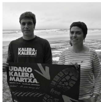
Uztailearen 25ean 16:25ean iritsiko da martxa Usurbila.

Uztailearen 25ean, 16:00etan frontoian elkartzeko deialdia Hilaren 25ean zehazkiago esanda, Getaria Hernanirekin lotuko duen 13 kilometroko etaparen baitan. Zarautzen trena hartuta helduko dira Kalera Martxako