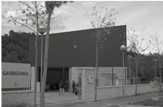
Udako ordutegiak irailaren 15era arte iraungo du Garbigunean: astelehenetik ostiralera, 10:15-14:00. Larunbatetan, 09:00-13:30.

Uztailean goizez zabalik, 09:00-13:00 artean. Abuztuaren 1etik irailaren 15era aurrera, 16:00-20:00 artean zabalik.