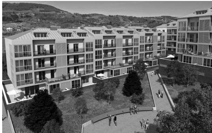
Uztailaren 27ra arteko epea dago izen emateko.