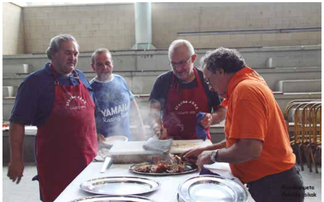
Uztailaren 31n, jaietako azken egunean egingo da zikiro jana. Argazkia iazkoa da.