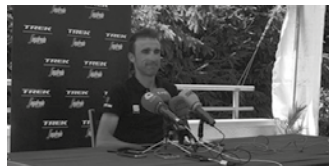
San Estebango txirrindulariak Donostiako Klasikoan hartuko du erretiroa.

“20 urterekin ilusioz gainezka Pantani, Zulle, Olano eta Jalaberten pelotoira iritsi nintzen Euskadi Taldearekin. 20 urte hauetan une magikoak bizi izan ditut Beloki, Lance, Basso eta Ulrich bezalako txirrindularien ondoan. 20 urte