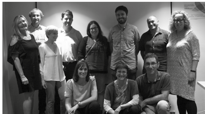
Eskualde mailan garatu da hotelgintzari lotutako programa.

Lan munduratzeko helburu duen programa honetan jorrazten den bidea nabarmentzen dute. Prestakuntzaz gain, jarrera eta laguntza programa ere bai baita langatuentzat. Akonpainamendua jasotzen duten prozesu integral honetan ere, lan munduratzeko zailtasun gehien duten kolektiboen ahaldundze bat ere ematen da. Kasu honetan, egoera eta errea-