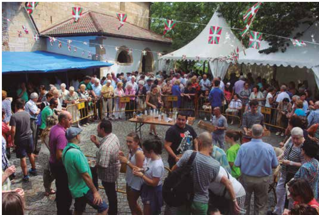
Iaz jende ugari bertaratu zen. Ea aurten ere eguraldiak laguntzen duen.