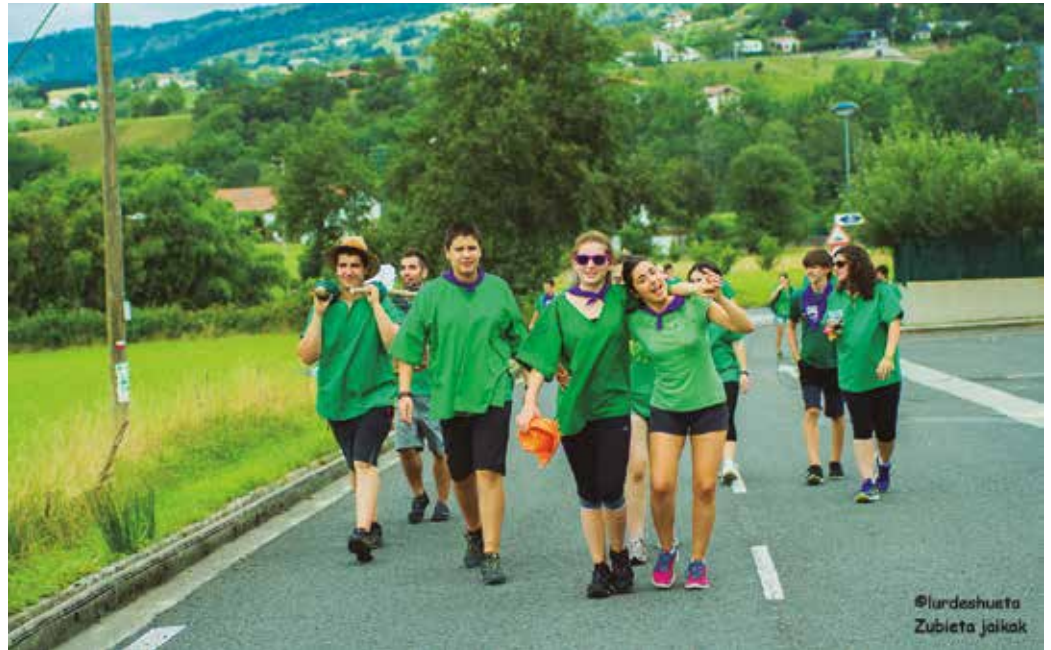
Uztailaren 26an ospatuko dute oilasko biltzaileen eguna. Argazkia 2016koa da.