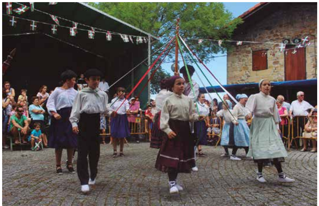
Abuztuaren 3an, meza eta gero hasiko da Orbeli Dantza Taldearen erakustaldia.