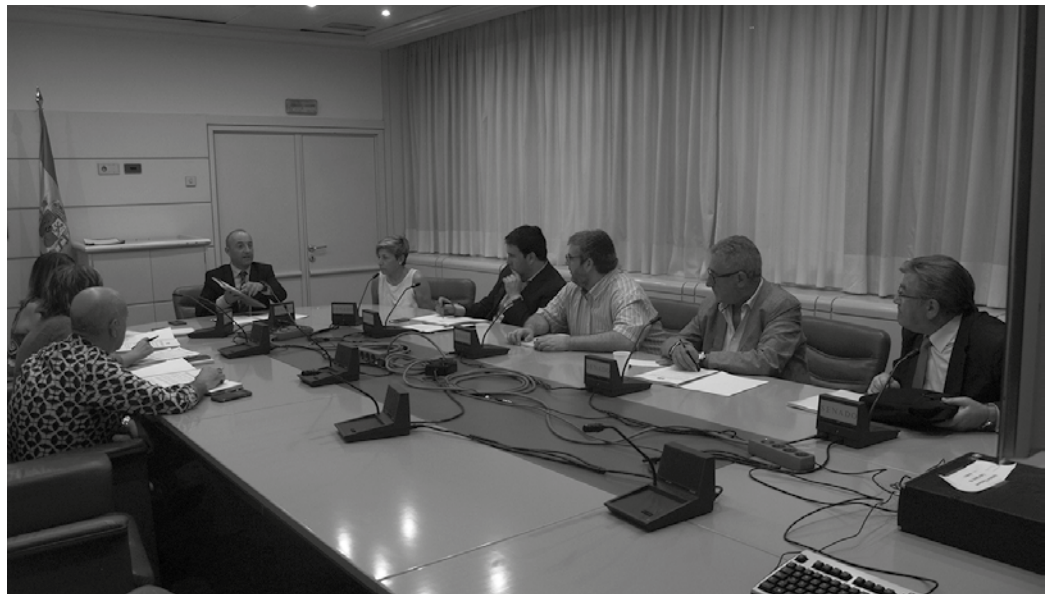
GuraSOSek hedabideen aurrean iragarri zuenez, hurrengo hitzordua Bruselan izango dute, iraila amaieran.

Hondakinen kudeaketaren arazoa konpontzeko bide-orraren baitan, erraustegiko lanak