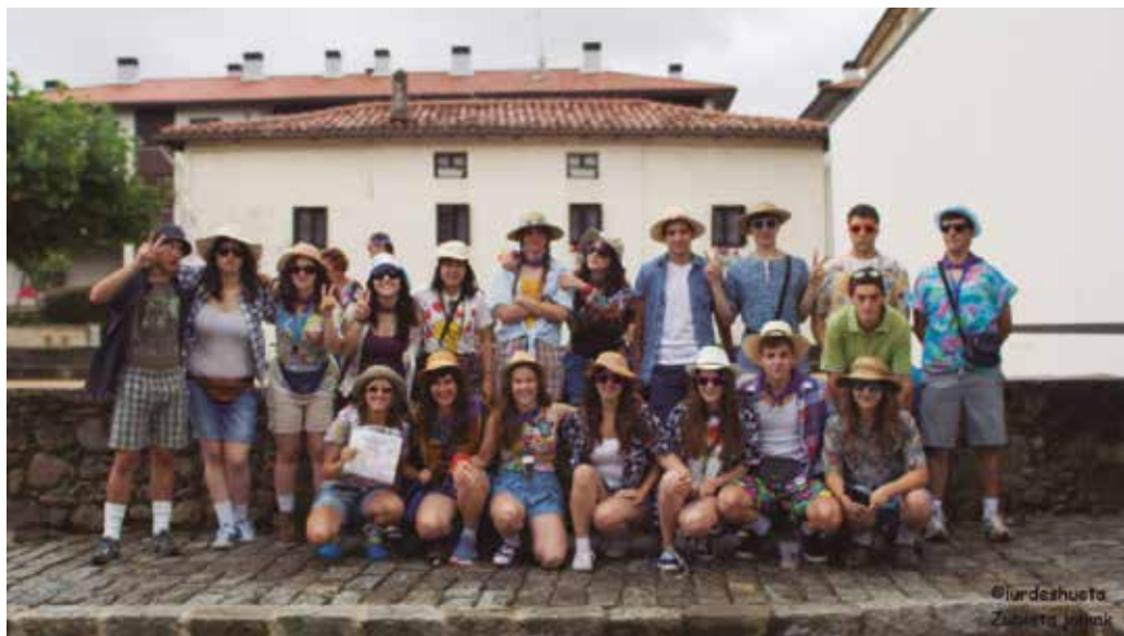
Uztaileen 24an arratsaldeko 18:00etan jaurtiko dute txupinazoa. Mozorrotuta agertzeko deia egin dute.

Jaien antolakuntzan “esku bat botatzeko prest egongo bazinate, zinez eskertuko genuke zuen prestutasuna”, adierazi dute Jai Batzordetik. Antolatzaileekin hartuenametan jarri besterik ez duzue zuen laguntza eskaintzeko. Bada ordea, festak babesteko beste bide bat ere, antolakuntza gastuei aurre egitea esaterako. Ostegun honetan, uztaileen 20an iluntze aldera etxez etxe ibiliko da Jai Batzordea laguntza biltzen. Une horretan bere ekarpena egin ezin duenak, “eskertuko genizueke jaietan zehar txosnan egongo den kaxara botako bazenute”.