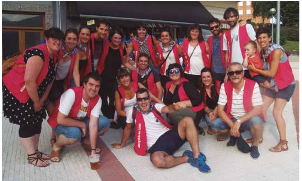
Abuztuaren 25ean, iluntzeko 20:00etan botako dute txupinazoa.