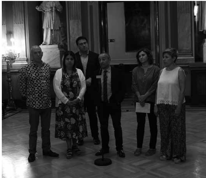
GuraSOS Senatura iritsi bezain laster, PSOE, ERC, EHBildu eta Unidos Podemos taldeetako ordezkariekin bildu zen.

Dosierra bera, PP eta Ciudadanoseko ordezkariak ere helarazi zien guraso taldeak. Unidos Podemoseko senatarietako batek gainera, GuraSOsek aurkezturiko dokumentazioa, goiz berean Senatuan bertan gastu