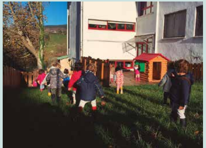
Ostiral honetan ospatuko duten jaialdiarekin agurtuko dute ikasturtea.

Haurreskolako bidea Amaitu zaigu tamalez Ta bizitako guztia Nola adierazi hitzez Lehen irri eta pausoak Irribarrez eta negarrez Kalejarren irteerak ardiei ogia emanez Zenbat esperientzi berri, Gela bete da hondarrez! Hainbeste ikasi dugu Zuek alboan egonez Eskeinitako altxorra Gure barrenean gordez Besterik ezin da esan Eskerrik asko bihotzez!