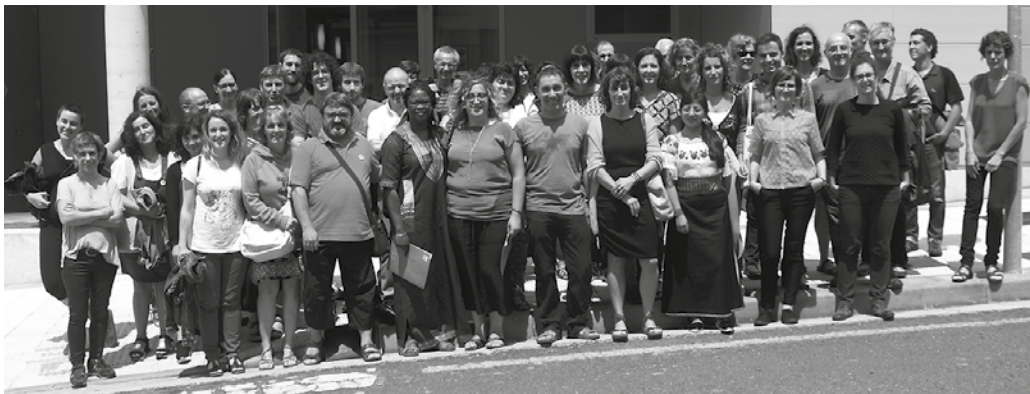
Erretratua UEU, Jakin eta Usurbilgo Udalak antolatutako udako ikastaroaren amaieran eginikoa da.