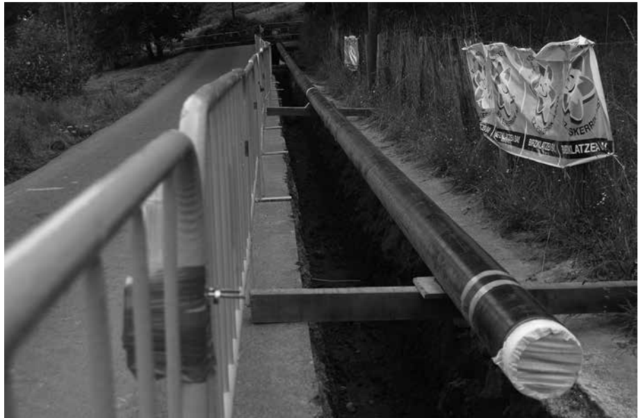
Zubietako Herri Batzarrak eta Usurbilgo Udalak, hainbat herritarrek bezala, eskatua dute lanok geraraztea; irtenbide adostu bat bilatu artean behintzat.

Zubietako Herri Batzarrak eta Usurbilgo Udalak, hainbat herritarrek bezala, eskatua dute lanok geraraztea, irtenbide adostu bat bilatu artean behintzat. Lanok Zubietan, Donostiako lurretan egiten ari dira hiriburuko Udalak baimenduta.