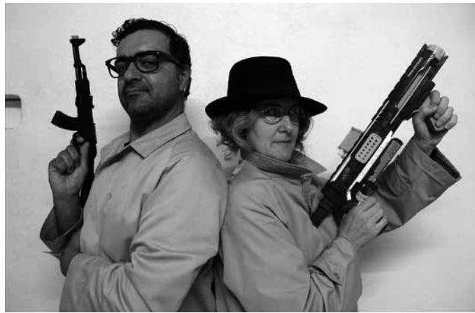
Muxurbil, EHAZE eta Udalak antolatu dituzte Jauzi! Antzerki Egunak.

Transgresioa izango dute hizpide beraz, irailaren 14tik 16ra ospatuko diren kalejira, mahai inguru, ikastaro eta antzezlanek. Sarrera behar duten hitzorduetarako txartelak ekitaldi egunetan bertan jarriko dituzte salgai Sutegin. Antzerki egunetara jauzi egiten lagunduko