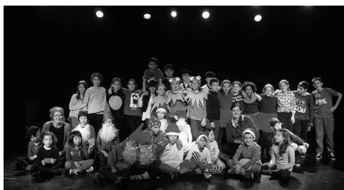
Abiapuntu gisa, taldeko dinamika eta asmoen berri jasotzeko bilera irekia deitu dute larunbat honetarako, eguerdiko 12:00etan Bake Epaitegi ondoko lokalean.

Sorpesarik ere izango omen da. Berrikuntzarik badakar ikasturte honek. “Azken urteetan Muxurbilekoek gabone-