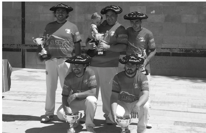
Behar Zana (Villabona), Txost (Oiartzun), Zubieta (Zubietako) eta Luzean (Donibane Lohizune) taldeak arituko dira aurrez aurre.

Bigarren eta hirugarren postuan sailkatzen diren taldeek finalerdia jokatu dute, partida batera, urriaren 1ean. Beti ere, eguraldiak ez badu txapelketaren martxa baldintzatzen. Eta finalerdiko irabazleak finala jokatu du, lehenengo