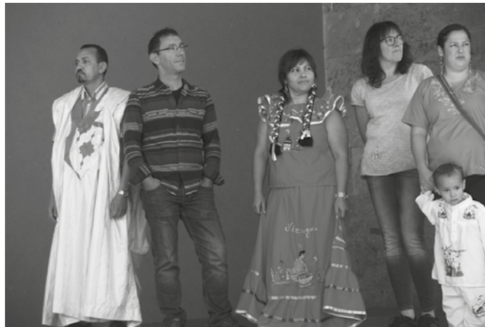
Irailaren 24rako iragarri bazen ere, urriaren 22an egingo da Mundualdia jaialdia. Iaz egin zen "Herri Anitza" festaren oinordeko ospakizuna.