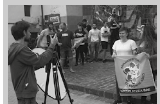
Erraustegiaren aurka grabaturiko abestiaren izen bera du birak.