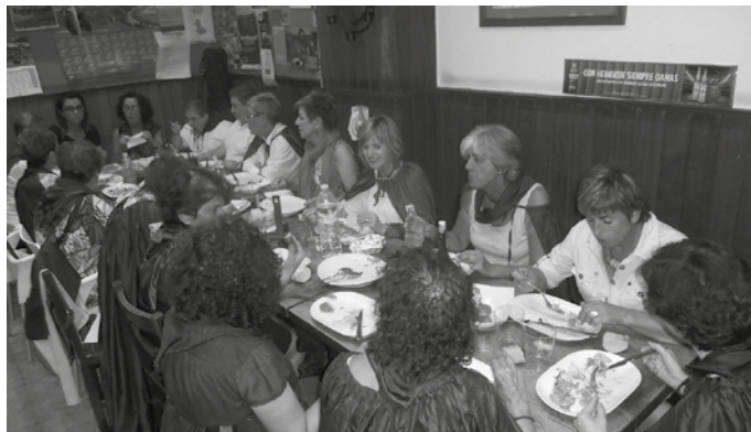
Masustaren Kofradia eratu zenetik 10 urte pasa dira. Ospakizun borobila izango da aurtengoa.

Baba txiki beltzaren kofradiako bazkariaren antzera, masustari eta bere propietateei gorazarre egiten dion otordu hau ere irekia da. “Masusta oso fruitu kaskartzat hartu izan da, edo merezimendu gabekoa. Baina ikasi dugunez, alderantziz da. Masustak egundoko propietateak ditu; indar garbitzailea du, barruak garbitzeko oso ona, bitamina aldetik C eta A ditu, kaltzioa du, burdina ere bai, indar antioxidatzailea eta ematen zaion erabilpena ere zabala da; mermeladak egiteko, likorea ere egiten da”, oroitarazten ziguten