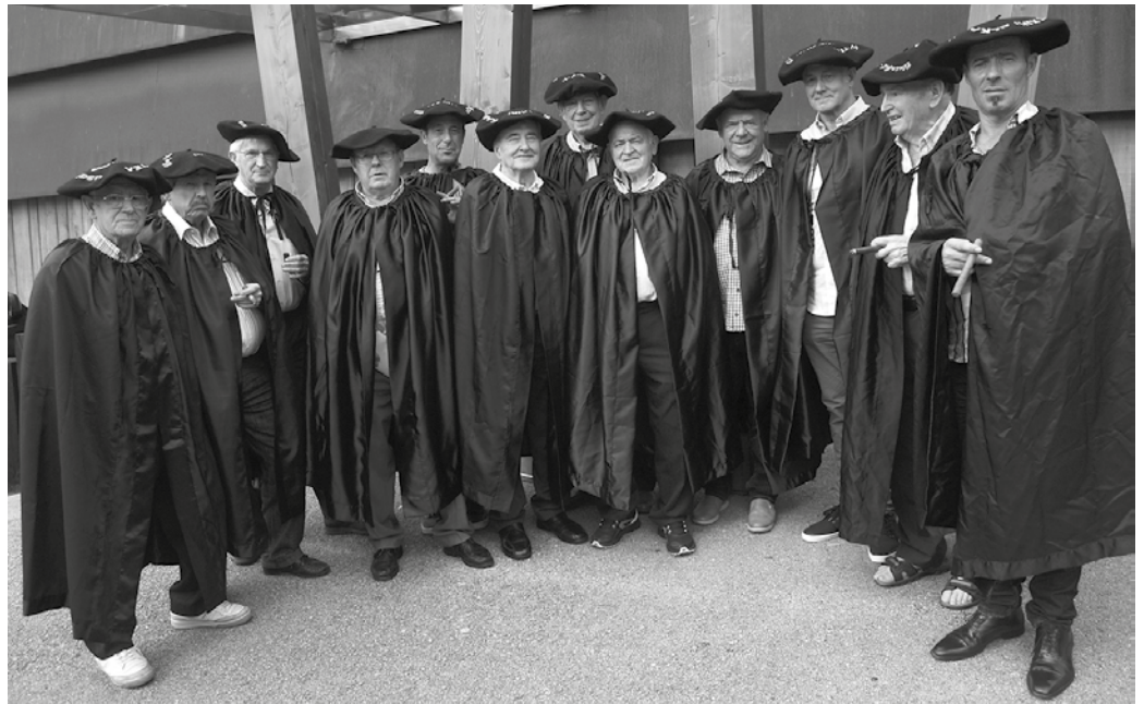
Abuztuaren 31n batu ziren. Saizar sagardotegiaren atarian atera zuten talde-argazkia.