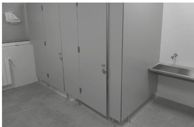
Agerialdeko lehen solairuko komunak berritu dituzte.

Entzarrain bidean, Kale Nagusian eta Osinalde industriagunean. Horrez gain, Artzabal parean eta Kalezarreko Oxtape inguruan bi zebra-bide altxatu eta egokitu dira.