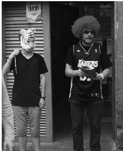
Argazkian, iazko ekitaldietako bat.

■ 19:30 Lasarte-Oriako Dantzarin antzerki eta dantza taldearen kalejira Kaxkoan barrena, "Djinji, djinji!" ikuskizunarekin. Ate joka ditugun antzerki egunen pregoilari lanak egingo dituzte. Jauzi! Antzerki Egunen baitan, irailaren 14an antolatutako antzerki pieza musikatuek osaturiko kale ekintza musikatuen antzeko ibilbidea osatuko dute tabernen bueltan. Antolatzaileak: Muxurbil eta EHAZE