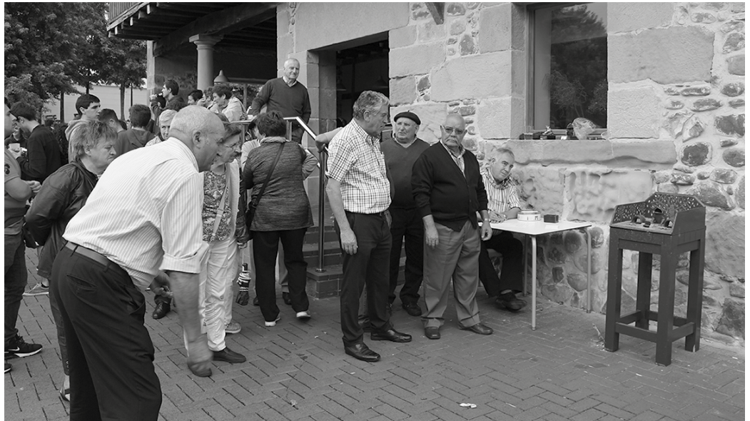
%57,8k ez du muga fisikorik eguneroko zereginetan, %34,1ak bai aktibitate batzuetan.