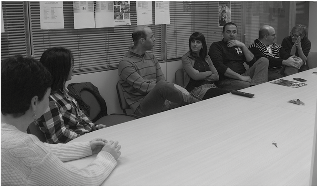
Etumeta AEK euskaltegian izen emateko ordutegia hauxe da: astelehenetik ostiralera, 11:00-13:00 eta 18:00-20:00 artean.

H ainbat ikastaroetan izen emateko garaia zabaldu dute. Eskaintza zabala duzue aukeran urtero moduan.