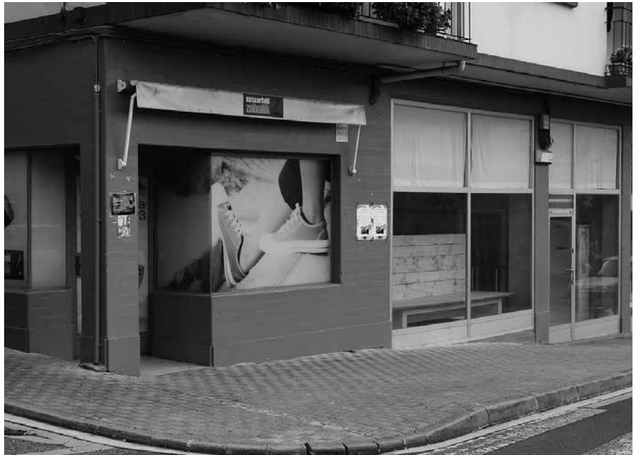
Usurbilen hutsik dagoen merkataritza lokal batean jarduera ekonomiko berri bat jarri nahi duenak, udal diru-laguntza deialdira aurkeztu daiteke urriaren 31ra arte.