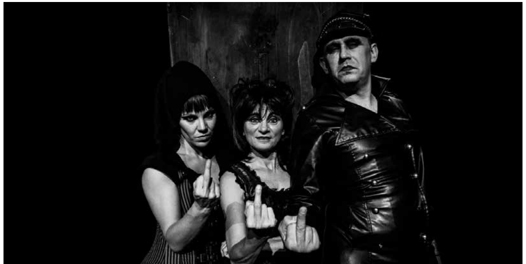
Irailaren 16an larunbata, “Fakiu” antzezlan. 22:00etan Sutegiko auditorioan.