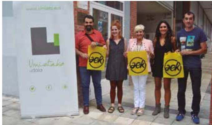
Urnieta zen euskara ikasteko gunerik ez zuen udalerririk bakarrik Buruntzaldean. Orain arte. Jada azken ukituak ematen ari dira AEK-k Errekalde kalean zabalik duen egoitzari.

AEK-k berriz bost egoitza zituena orain arte; euskaltegi bana Andoain, Astigarraga, Hernani, Lasarte-Oria eta Usurbilen. Aipatzekoa, Andoainek egoitza berria estreinatu duela. Aurretik, Plazaola 2 helbidean aurkituko duzue AEK. 15 urterako lagapena egin dio Andoaingo Udalak AEK-ri.