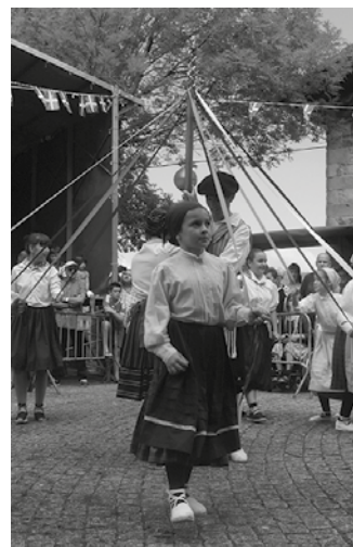
Urriaren 2ko astean hasiko dira Dantza Taldeko klaseak.

Ordutegia finkatzeko bilera irailaren 22an, 18:00etan Udaregi Ikastolako erdiko aretoan.