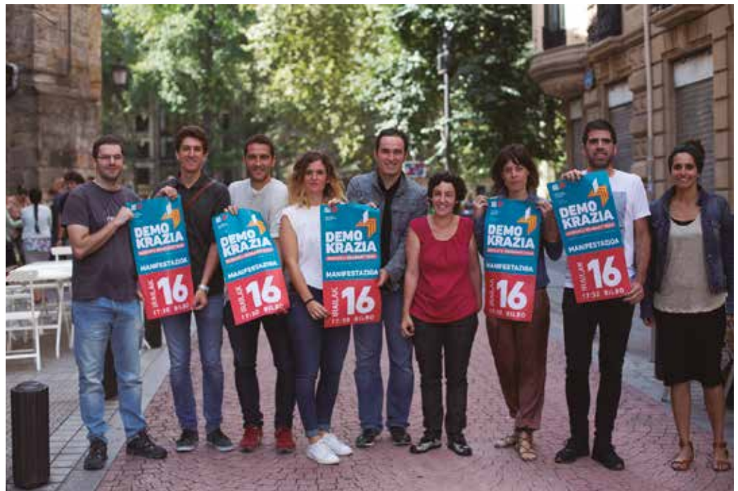
Kataluniako erreferenduma babesteko manifestazioa deitu du Gure Esku Dago mugimenduak, irailaren 16an Bilbon. Usurbilen autobus zerbitzua antolatu dute. Izena emateko epea irailaren 14an itxiko da.