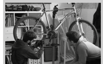
Beterri-Buruntzako udalerriko gazteek lehentasuna izango dute.