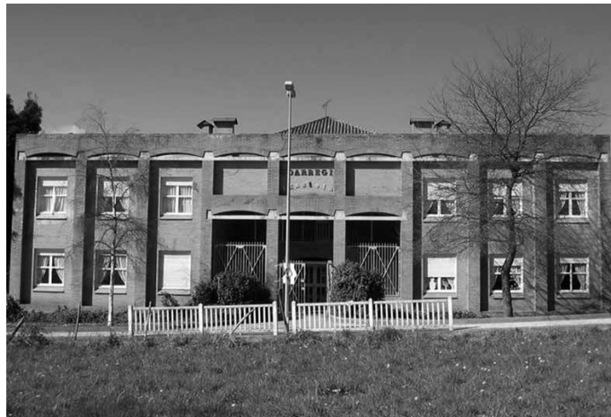
DBHko ikasleek irailaren 6an hasi zuten ikasturtea.

Zumarteren handitze eta berritze lanei lotutako erabakia hartu zuen udalbatzak uztailaren 26an eginiko osoko bilku-