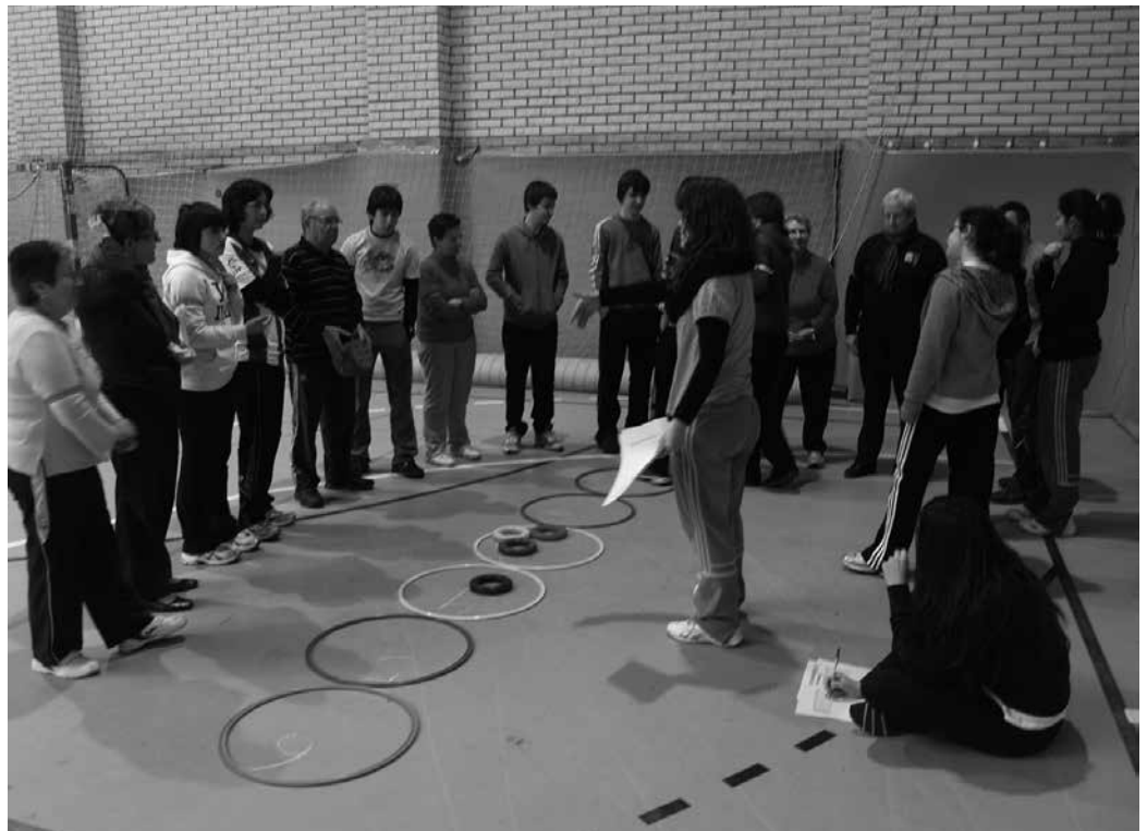
Herritarrek duten inguru sozio-afektiboak funtzio garrantzitsua betetzen du. Ia denak bizi dira jende gehiagorekin etxean.

Are gehiago, jakinik, gehienek nahiago dutela etxean bizitzen segi. “Beraz, pertsona horien autonomia maila ahalik