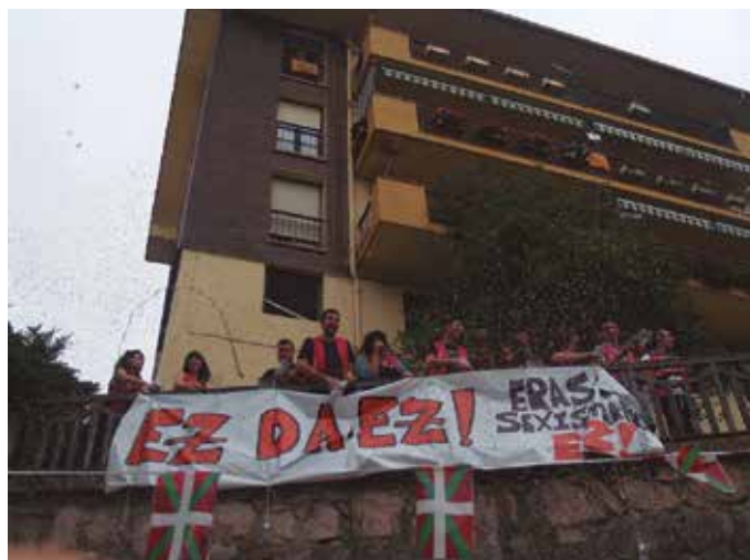
Pozik eta esker onez agertu dira Atxegaldeko Jai Batzordeko ordezkariak: “Hurrengo urtekoak prestatzen hasi aurretik, jai hauek posible egin dituzten guztiei eskerrak eman nahi genizkieke”.

Hurrengo urtekoak prestatzen hasi aurretik, jai hauek posible egin dituzten guztiei eskerrak eman nahi genizkieke: udaletxeko brigadako langileei, ostiral eta larunbat