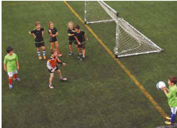
Irailaren 1ean hasi zen Usurbil Cup txapelketa.

Parte hartze aldetik haur eta gaztetxo gehien mugiarazten dituen ekimena izango da Usurbil Cup. Irailaren 1ean abiatu zen. Azken egunotan lehen bi jardunaldiak jokatu dituzte. Asteburuan ospatuko da hirugarrena. Segidan dituzue Usurbil F.T.-k aurreikusitako dituen neurketen ordutegiak. Urriaren 7an festa giroan, final eta sari banaketa arrakastatsuekin borobilduko dute edizio hau.