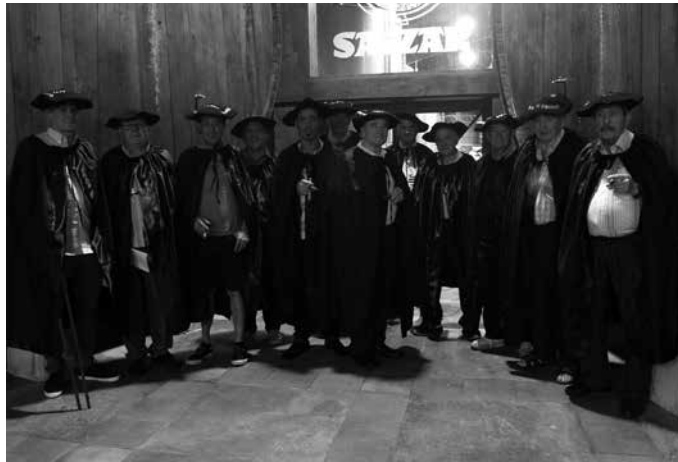
Lau hamarkadatan gorazarre egin diote baba beltz txikiari.

Baina zergatik gorazarre egin baba txikiari? Ohitura nondik datorren galdetu genien abuztuaren 31n Saizarren ospaki-