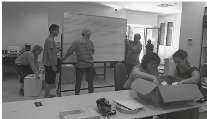
Udan zehar egin zuten lekualdatzea.

■ Udarregi Ikastola (eraikin gorria): Musika Txokoa, Musika Mintzaira, abesbatza, kla-