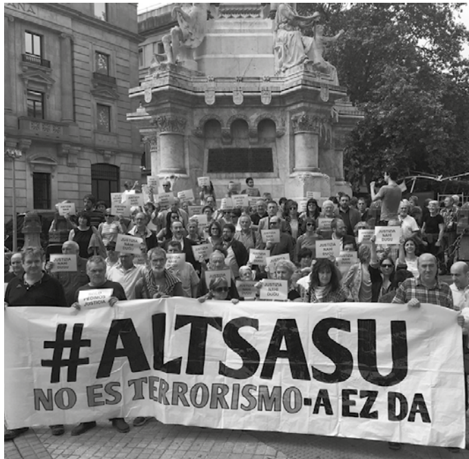
Usurbilgo Udaletzeko EH Bilduk eta EAJ-PNVk bat egin zuten adierazpena babesteko garaian.

“Usurbilgo Udalak erabateko desadostasuna adierazten du Fiskalaren zigor eskaeren aurrean eta kezka handia adierazten du gertaeren bilakaerarengatik, kasua neurrigabekeria eta bidegabekeria onartezin batera heldu dela ikusita”, dio aipatu adierazpenak. Normaltasun eta elkarbizitza demokratikoaren aurkakotzat jotzen du, “kasu hau inguratzeko duen neurrigabekeria”. Altsasuko gertaerak epaitzeko eskumena Iruñeako epaitegiarena behar lukeela defendatzen du adierazpenak, Nafarroako Probintzia Auzitegiak adierazi duen moduan.