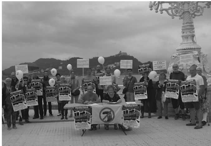
Giza-kateko deitzaileek azpimarratu dutenez, “ezin dugu ahaztu Zubietako erraustegia hainbat gezur handietan oinarrituta dagoela”.

Errausketaren Aurkako Mugimenduak, Errausketaren