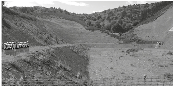
Irailaren 5erako deitua zegoen GHK-ren batzarra eta bertan tramitatzen hastekoak ziren bigarren faseko lanak,

37 milioi euro bideratu asmo dituzte azpiegiturora. Lanen bigarren fase hau, 2018ko maiatzean abiatu eta 2019. urteko erdialderako martxan egotea aurreikusten dute. Le-