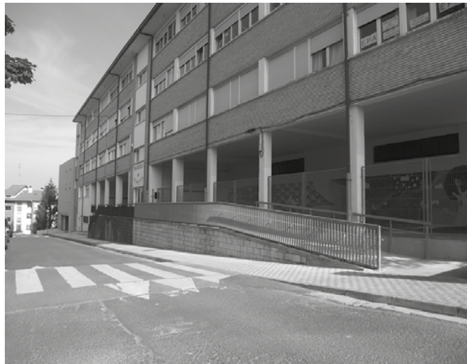
EPA Usurbil HHIn astelehenean hasiko dira eskolak. Agerialden du egoitza.