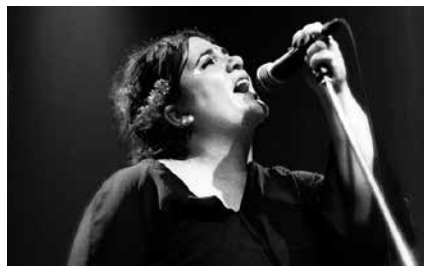
Ostiralean Zea Mays taldea arituko da. Eskaintza oparoa izango da bi egunetan.

Informazio gehiago eta sarrerak salgai dituzue donostiakutxakulturfestibala.com atarian. Baita bi egunetarako bonoak ere.