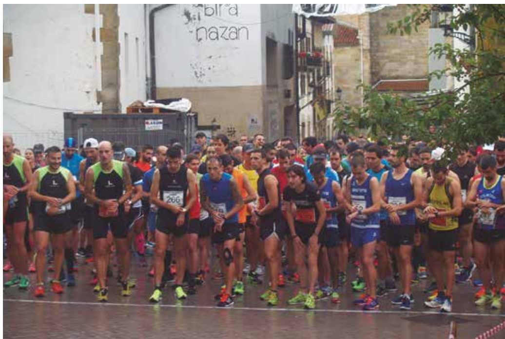
Irailaren 17ko Baxurde Krossa lasterketan, 10,75 kilometro eta 5,2 kilometroko ibilbide bana izango da aukeran.

Nagusiki usurbildarrak, eskualdeko lasterkariak edota lasterkari gipuzkoarrak erakarri dituen arren, Baxurde Krossak Euskal Herriko nahiz atzerriko hainbat kirolariren bisita jaso du urteotan. Triatleta famatuekin batera, lehen edizioetako batean, antolakuntzatik NOAUA!ri adierazi dioten moduan, “infiltratuak” izan zituzten lasterketan. Gerora Runners atletismo munduko aldizkari ezaguneko kirol ekimen honi buruzko artikulua argitaratu eman zuten kazetariak. “Lasterketa asko gustatu zitzaizela esanez deitu ziguten eta haien