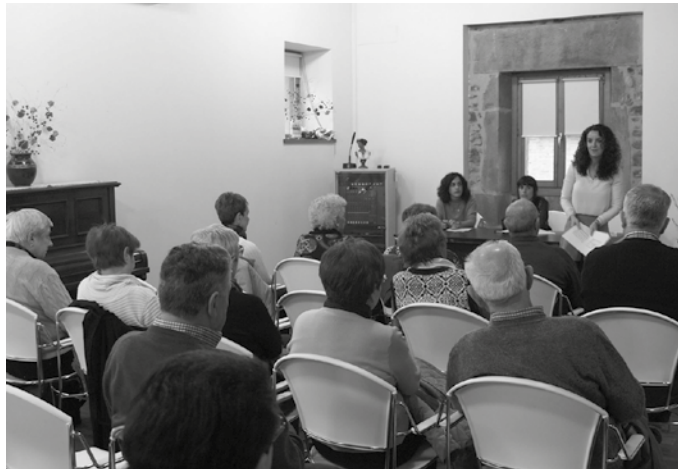
Zerbitzua Artzabalen eskainiko da, eta erabiltzaileek beren gaitasunen araberako ariketak egin ahal izango dituzte.

Azken asteetan, 65 urtetik gorako usurbildarren artean inkestak egin du udalak Aztiker