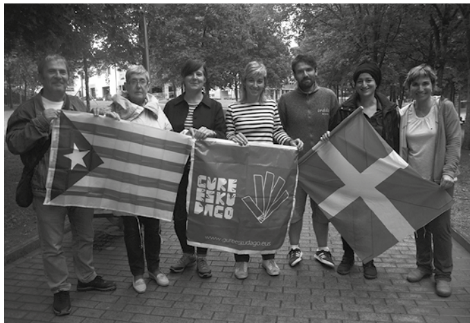
Gure Esku Dago Usurbilgo kideen esanetan, “azpimarratzekoa da Kataluniako herriak bide horrekin bat egitera behartu dituela politikariak”.

J.A.: Duela bost urte oso zaila zen orain arte egin den bidea irudikatzea, orduan pazientzia hori behar da. Mario Zubiagak