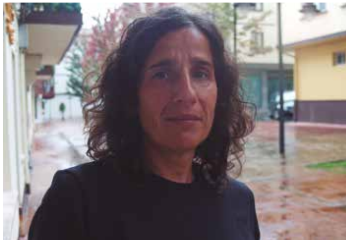
“Hemen denek zure izenez animatzen zaituzte eta desberdina da. Ibilbide guztian herriko jendea dago. Berezia da”.

R. U.: Batzuetan ondo noa baina biharamunean... Azkarregi banao eta mina sentituz gero,