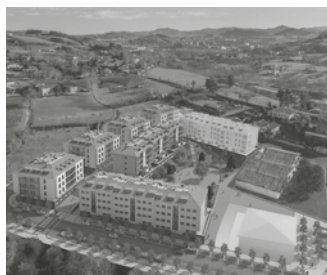
Zerrendak Udaletzeko iragarki-taulan ipiniko dituzte irailaren 15etik 28ra (biak barne).

Zerrendak erakusketa publikoan jarriko dira Udaletzeko iragarki-taulan irailaren 15etik 28ra (biak barne), “interesatuek aztertu eta, beharrezkoa ikusten badute, ondoen deri-