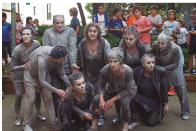
Argazkian, “Djinji, djinji!” emanaldia. Gorputzen mugimendua baliatuta irailaren 8ko poteo ordua girotu zuten Lasarteko Dantzariak.