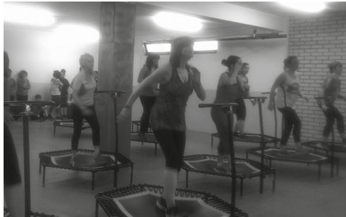
Ikastaro berriekin batera, zumba, 3. adina, jumpfit, Body Balance, pilates, spinning, mantentze gimnasia edota yoga egin daitezke.

Informazio gehiago eta izen emateko: Oiardo Kiroldegian edo 943 372 498 telefono zenbakian.