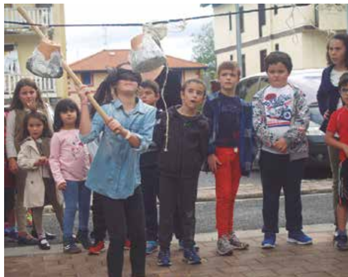
Aurtengo festetan ere, haurrentzako ekitaldi asko izango dira.

17:30 Txokolatada Zaharren Egoitzaren eskutik.