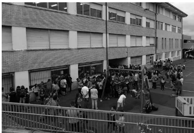
Irailaren 7an hasi zuten ikasturtea Udarregi Ikastolan, Aginaga eta Zubietako eskoletan eta Lanbide Eskolan.

Murritzeten aplikazioa eten, LOMCE eta Heziberri bertan behera utzi, hezkuntzara inbertsio handiagora bideratu eta langileen lan baldintzak hobetzea eskatzeko hainbat lanuzte egin zituzten unibertsitez kanpoko hezkuntza publikoan udaberri partean. Eusko Jaurlaritzak “egoera larri honi buelta emateko inolako neurri