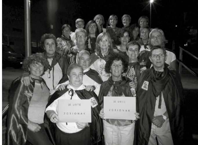
Masusta osagai nagusi duen afari goxoa dastatu eta ereserkia abesteaz gain, kofradekide berri bat izendatu zuten.

M asusta Kofradia sortu zuteneko 10. urtemuga festa ospatu zuen irudiko herritar taldeak irailaren 8an Artzabalen. Horixe dituzue kofradiako kapa jantzita. Zorionak! Masusta osagai nagusi duen afari goxoa dastatu eta ereserkia abesteaz gain, kofradekide berri bat izendatu eta urtebete barrukoa nor izango zen iragarri zuten. Guztia kantu eta lagun giro ederrean. Urtez urte hazten doa masusta zaletuen kofradia. Hala segi dezala!