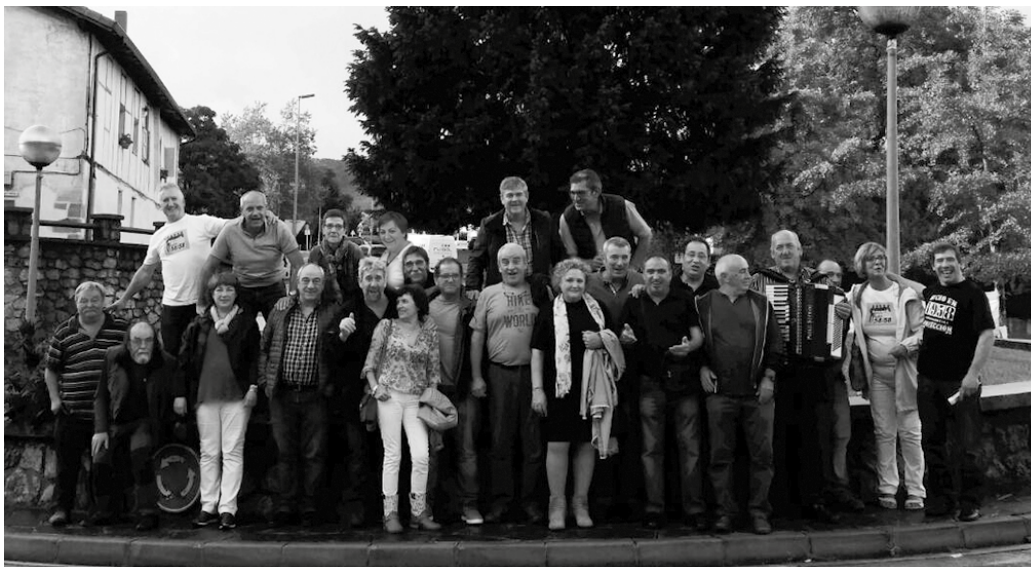
Jai eta lagun arte giro ederrean ospatu zuten 1958an jaiotako herritarrek, irailaren 9rako Antxeta jatetxean antolatuta zuten bazkari eguna. Ondoko irudian dituzue, Bordatxo aurreko errotondan atera zuten talde argazkian.