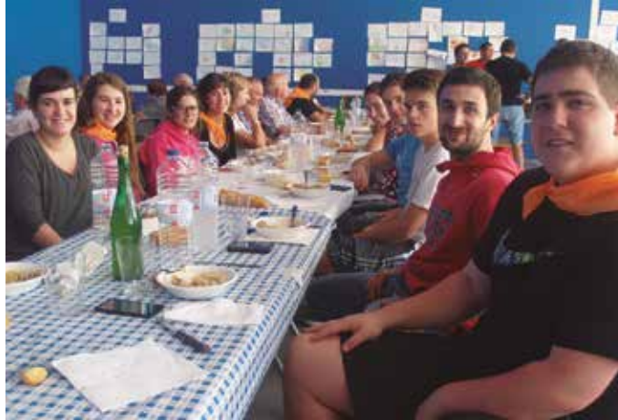
Igandean egingo da herri bazkaria.

Larunbatean, 16:00etan hasita Santueneko jaien baitan. Izen