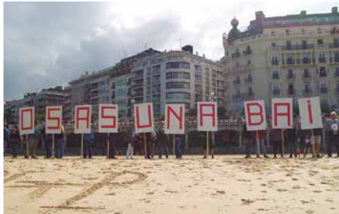
Herritar ugari batu zen igandean Kontxako hondartzan, Errausketaren Aurkako Koordinadorak, Mugimenduak eta Donostia Bizirik-ek deituta.

zela iragarria zuten antolatzaileek, jada erraustegia eraikitzen hasiak baitira. Halere argi adierazi dute; “ez dugu etsitzeko asmorik, hiri hondakinen errausketaren aurka jarraituko dugu”. Irudi gehiago, noaia.eus atarian.