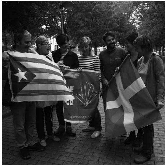
Urriaren 1ean Katalunian egin nahi den erreferenduma babesteko manifestazioa deitu dute. Larunbat honetan, Bilbon. Hara joateko autobus zerbitzua antolatu dute. 15:30ean abiatuko dira, Kiroldegitik.