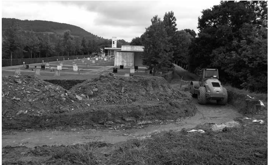
'Errautsen Parkea' izeneko gunea hilerrri berrian kokatuko da. Lanak bi hilabetez luzatuko dira.

"Hilerrri berriaren handitzeak zer ikusi zuzena du hilerrri zaharraren itxiera prozesuarekin. Batez ere, familiartekoei eskatzen ez dituzten usurbildarren azken hilobia izango delako. Gorputz horiek Udalaren gain geldituko dira eta erraustu ondoren parke berrian utziko dira". Hilerrri zaharreko gorpuzkinak beraz, Errautsen Parkera eramango dira.