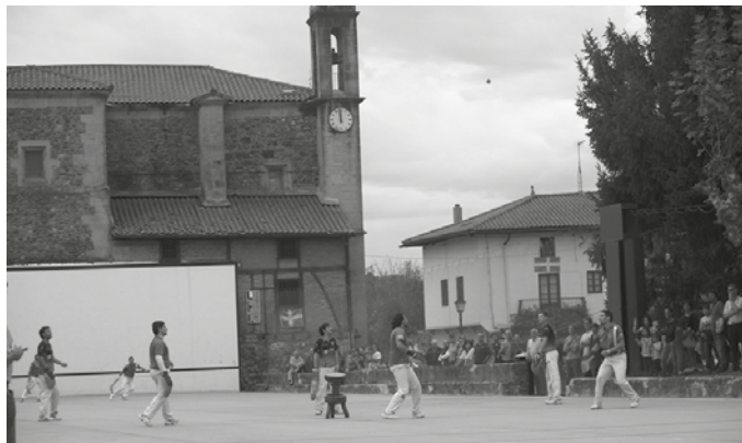
Eguraldiak laguntzen badu, igande honetan jokatuko da finala Oiarztunen. Luzean taldea (Donibane Lohitzune) izango da aurkaria.

Luzean 13-2 Behar Zana. Txost 5-13 Zubieta. Zubieta 3-13 Luzean.