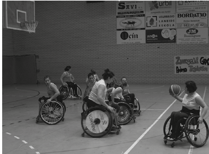
Diru-laguntza lerro berriarekin, emakumeen eta gizonen berdintasun kirol jarduerak eta Kirol Egokitutako egitasmoak sustatu nahi dira.

“Usurbilgo Udalaren diru-laguntzen oinarri erregulatzaileak ezartzea, norgehiagoka erregimenean, 2017 urtean Emakumeen eta Gizonen Berdintasun kirol jardueretako eta Kirol Egokitutako egitasmoak burutuko dituzten erakundeentzat, publikoak nahiz pribatuak, eta pertsonentzat... Diruz lagunduko dena da kirol arloan ekimenak garatzea, baldin eta Usurbilgo Udalak egiten dituen ekimenen osagarri badira