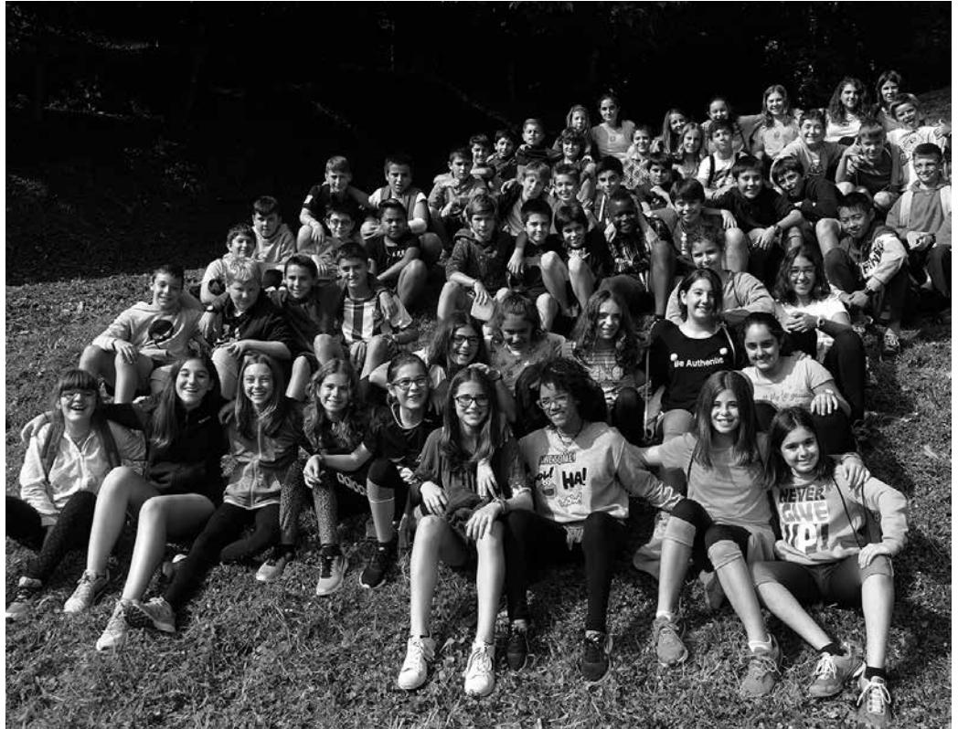
Ikastolan hasi ziren lehen astean, irteera egin zuten. "Txango polita izan zen eta oso ondo pasa genuen". DBH1eko ikasleek argazki hau eta kronikatxoia igorri digute.

Ondoren, San Estebandik igaro eta Txokoaldera jaitsi ginen. Bertan egin genuen hamaiketako eta parkean jolasten aritu ginen. Han ginela, txakur txiki gaztetxo bat ere hurbildu zitzaigun gurekin jolasteko gogoz. Oroigarri gisa, Txokoaldeko frontoiaren aurreko maldan argazkiak atera genituen, bai gelaka eta baita maila osokoak ere. Hemen ikusten ari zareten hau da horietako bat. Azkenik, erribera aldetik, Santuenetik barrena, herrira itzuli ginen. Frontoian elkartu ginen denok eta handik etxera joan ginen.