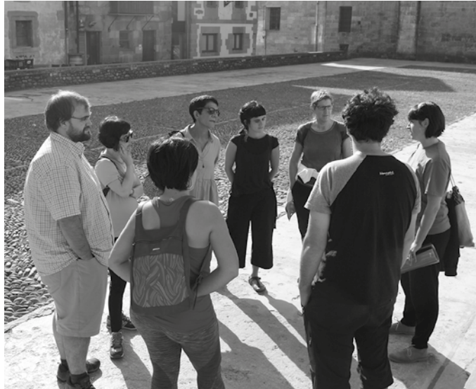
Aurreko larunbateko bisita gidatua Dema Plazatik abiatu zuten.