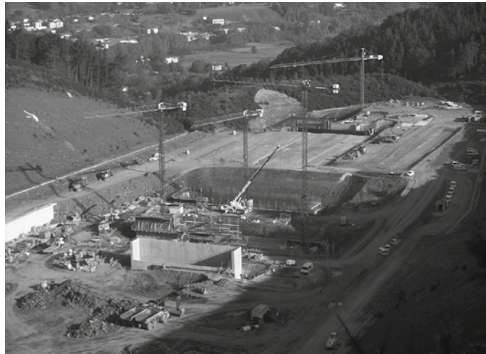
Etenik gabe dabilta lanean, baita egutegian gorritz ageri zaizkigun jai egun ofizialetan ere.