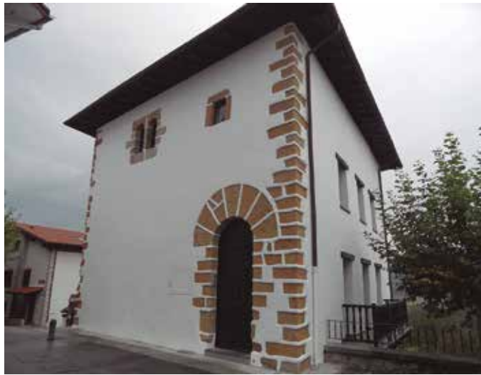
XVII. mendean erabaki zen herriko erdigunea Kalezartik Elizaldera aldatzea.

Denborak ordea, erdigunea Elizaldera, egun Kaxkoa ezagutzen dugun Usurbilgo erdigunera aldatuko zuen XVII. mende amaieran. "Baña leengo oituraz nunbait, Erriko Batzarrak Elizalde'n, Paris etxeko ariztian egiten ziran. Usurbildarren San