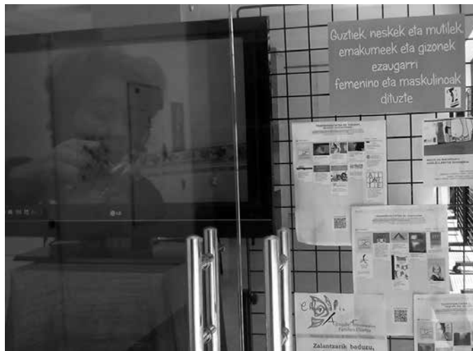
“Guk beti diogu halako zerbitzuak ez direla kopuruetan neurtzekoak, kualitatiboki neurtzekoak baizik”. Urriaren 27rako antzerkia eta solasaldia antolatu dute Sutegin.

Neurri handi batean abiapuntura itzuliko gara, garrantzitsua da iritsi ez garen eragile eta norbanakoengana gerturatzea. Halako zerbitzu batek benetan gaudituko ditu zailtasun edo tabu horiek. Hori da gure erronka nagusia, berriz kontaktatzea aisialdiko taldeekin, gazteekin, gunee eta talde ezberdinengana hurbiltzea. Beraien behar edo gogoak ezagutzeko, horiek entzun eta