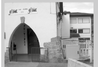
Laster, asteburu eta jai egunetan 6 plaza gehiago izango ditu.