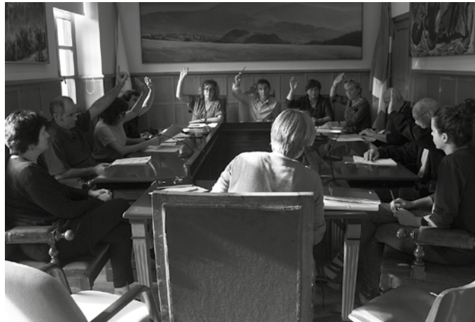
Urriaren 4an ez-ohiko plenoa egin zuten eta aho batez hartu zuten erabakia.

Eguneko Zentroa ireki zenetik orain arte, GSR enpresak kudeatu du Puntapax Eguneko Zentroa. 18 plaza ditu egun astetartean, 6 asteburuetan. Baina laster adineko herritar gehiagorentzako lekua egongo da. Usurbilgo Udalak Eguneko Zentroko plaza kopurua gehitzea eskatua zion Gipuzkoako Foru Aldundiari, dagoen eskariak egungo