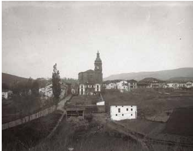
Usurbil, 1940. urtean.

Herri izaera izan bai noski, baina Usurbil betidanik ez da udalerriz edo “herribildu” izan. 1371n Enrike II.a Erregeak