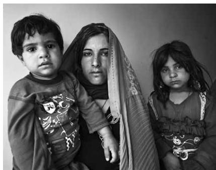
Mundualdia jaialdiaren baitan, "Emakumeak. Afganistan" erakusketa ipini dute Sutegin.

Talibanak agintean izan ziren garaian, etxetik kanpo lan egitea, ikastea eta laguntza medikoa jasotzea debekatu zieten emakumei. "Murrizketa horiek eskandalizatu egin zuten Mendebaldea, nahiz eta Afganistaneko emakumeek egunero bizi duten benetako dramaren icebergaren tontorra besterik ez izan. Erakusketa honetan ikusten da emakumeen aurkako indarkeria Afganistanen familian bertan hasten dela eta endemikoa dela, eta ez du zerikusirik talibanak agintean egotea-