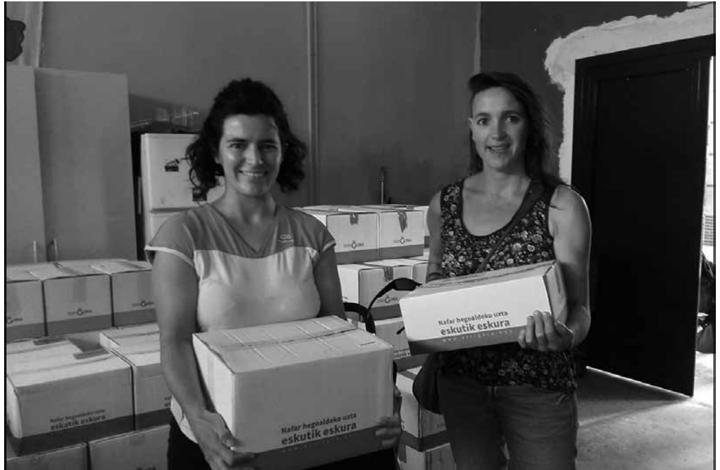
Eskaerak NOAUA!ko egoitza egin behar dira, urriaren 26tik azaroaren 14ra.

“Ikasturte osoan zehar hartuko dugu patxada eta astia Errigoragile eta Errigorazaleon artean hausnartu eta erabakiak hartzeko. Errigorago joateko amets berri haiek errealitate bihurtzeko ze zubi behar ditugun hausnartu eta marrazteko. Hortik etorriko dira Errigora bera, elkarlan eta erantzukizun konpartituak, erronken neurri eta denborak... berrasmatu eta egokitzeak”, berri eman dute.