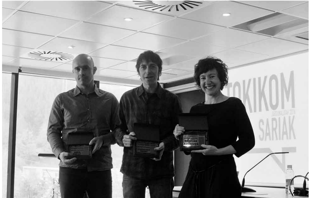
Iaz NOAUA! aldizkariak jaso zuen Eduki Onenaren Tokikom Saria, "Udarregiren omenez" izeneko gehigarri bereziarengatik. Arrasaten egin zen sari banaketa. Aurten, Usurbilen egingo da ekitaldia eta, lehen aldiz, publizitate lanak ere sarituko dira.

NOAUA!, iazko sarituetako bat Dagoeneko 2. Tokikom Sarietarako hautatuak nortzuk izango diren erabakitze lan betean da epaimahaia. Tokikomek irailaren 22ra arte finkatu zuen epearen baitan aurkezturiko eduki onenak sarituko dituzte. Gogoan izan, iaz ospatu zen lehen edizioan, sarituetako bat NOAUA! izan zela. Eduki