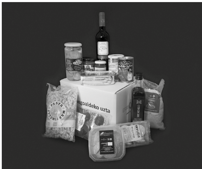
Kutxa beltza: Orburuak, zainzuriak, pikillo piperrak, ardoa, ozpina, melokotoia almibarrean, potxak, aran marmelada, mahats zukua, almendrak, oliba olio, pikillo saltsa, kardo. Prezioa: 50 euro.