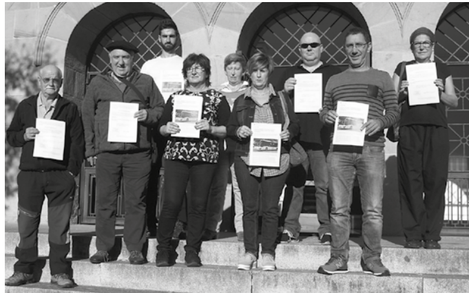
Ospitalera doan zerbitzua kendu asmo dute eta Hernanira doan zerbitzuak egiten duen ibilbidetik kanpo geratuko dira Santuenea eta Zubietako geltokiak.

Gazte askok erabiltzen dute bus linea hau, Lasarte-Oriako Institutura joateko. “Hemenetik aurrera Usurbilgo herrigunera hurbildu edo Lasartera beraien kabuz joan beharko dira, halabeharrez. Murrizketa hauek adinekoen eta gazteen artean izango dute eraginik handiena, hau da, babes gutxien daukaten gizarte sektoreen artean”, udal ordezkariaren esanetan.