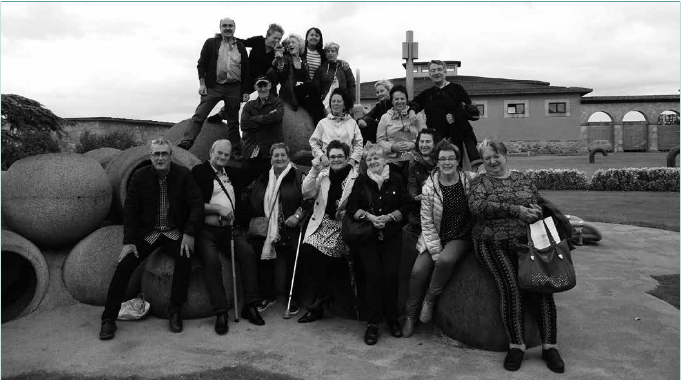
1955ean jaiotako usurbildarrek Errioxa aldean ospatu dute haien egun handia. Vivancon izan ziren larunbatean. Txangoan ateratako argazkia helarazi dute NOAUAlra.