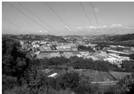
"Herriko lurra, aire eta uraren kalitatearen alde lan egitea" izango da elkartearen helburua.

Taldearen helburuak ezagutarazi eta martxan jarri asmoz, bilera ireki bat antolatu dute. "Gure helburuarekin bat bazatoz eta lantzeko prest bazaude, edo soilik informazioa jaso nahi baduzu, da-