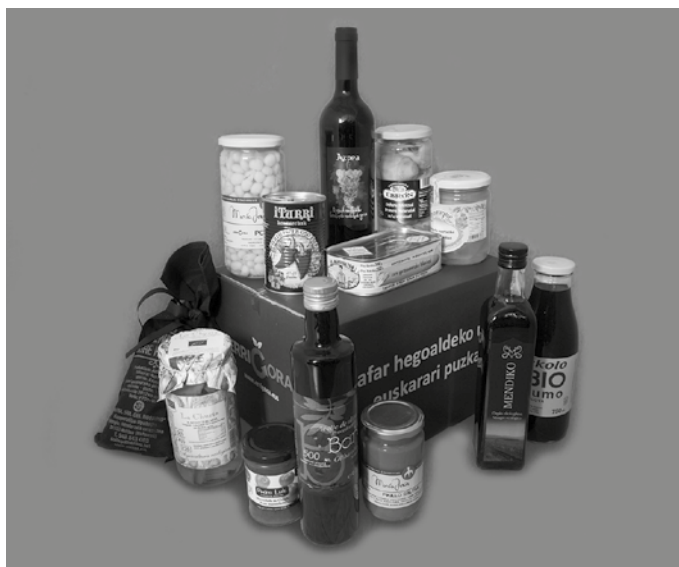
Kutxa zuria: Orburuak, zainzuriak, pikillo piperrak, ardoa, ozpina, melokotoia almibarrean, pasta, arroza, pikillo piper mamia, patxaran pastak, molineritoak, tomatea olioarekin eta teilak. Prezioa, 50 euro.

NOAUA!ren egoitzan, urriaren 26tik azaroaren 14ra. Informazio gehiago: errigora.eus