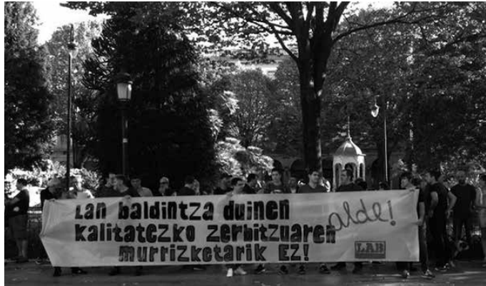
Aurreko astean, LABeko ordezkariak elkarretaratzea egin zuten Donostiako Gipuzkoa Plazan.

“Buruntzalderako emakida berriaren aurreproiektua aurkeztu zuen irailaren 8an Foru Aldundiak”, LABek prentsa-ohar bidez jakinarazi duenez. “Gure iritziz onartezinak di-