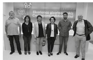
Proiektua Urola Garaia eta Beterri-Buruntza eskualdeetan jarri da martxan, Foru Aldundiarekin batera.