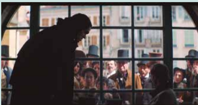
Azaroaren 5ean igandea, 19:30etik aurrera Sutegin.

Urriaren 20an estreinatu zuten Euskal Herriko zine- metan Altzoko "Handia"ri buruzko filma. Azaroaren 5ean 19:30ean izango dugu