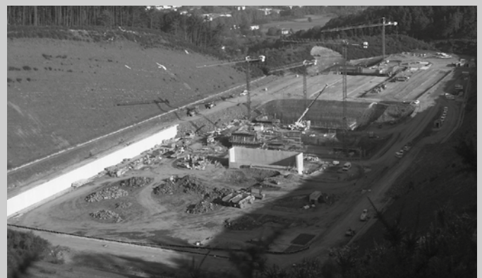
Lehiaketa honetarako, 2.150.042,85 euroko aurrekontua (BEZ-a kontuan izan gabe) iragarri du GHK-k.

Duela urtebete Lasarte-Oriako Aire Garbia herri plataformak iragarri zuen, goi-tentsioko linea eraiki nahi zuela Gipuzkoako Hondakinen Kontsortzioko (GHK) erraustegia sare elektrikora lotzeko. Urtebete beranduago lizitazioa martxan jarri du GHK-k. Urriaren 20az geroztik, 30 eguneko tartea dute interesdunek, L132 Hernani-Azpeitia 1 eta 2 Lineen Zubietako Azpiestaziora deribazioa egiteko zirkuitu bikoitzeko 132 kv-ko linearen proiektua, ingeniari-tza xehatua, fabrikazioa, muntaia, martxan jarri eta legez-tatze-