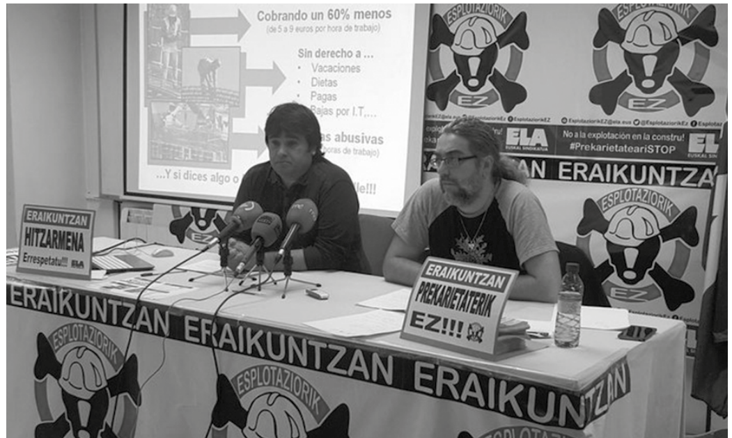
Txomin Enea, Deskarga, Anoeta, AHT eta erraustegiko obretan ematen den egoera larria dela dio ELAk.

Larritzat jo duten egoera hau Gipuzkoan abian diren bost proiektu nagusietan modu argian islatzen dela diote: Txomin Enea, Deskarga, Anoeta, AHT-ren eta erraustegiko obretan. “Obra bakoitzak bere ezaugarriak ditu, baina alderdi asko berdinak dira. Prekarietatea erabatekoa da. Langileek 5 eta 9 euro bitartean kobratzen dute lanorduko, askotan probintzia-hitzarmenean ezarritakoa baino %50 gutxiago. Lanaldiak gehiegizkoak dira