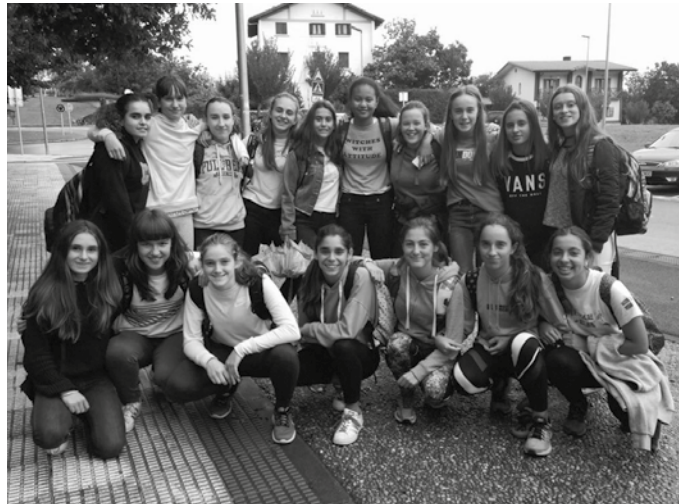
Udarregi Ikastolaren esanetan, “kiroltasuna erakutsiz, ederki aritu ziren lanean”.

Txapeldunak izatetik oso gertu ibili ziren. Podiumean, hirugarren postuan amaitu zuen Udarregi Ikastolak 40 punturekin, irabazle amaitu zuen Orioko Herri Ikastolaren-gandik oso gertu, oriotarrek 43 puntu eskuratu baitzituzten. Gipuzkoako 21 ikastolek parte hartu zuten Erronkan.