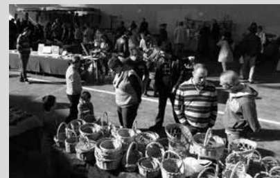
Frontoian ipiniko dute azoka.

Aitzaga Elkarte azaroaren lehenean ospatuko den XXII. Artisautza Azoka antolatzeko prestaketa lan betean da. 11:00etan hasita, frontoian.