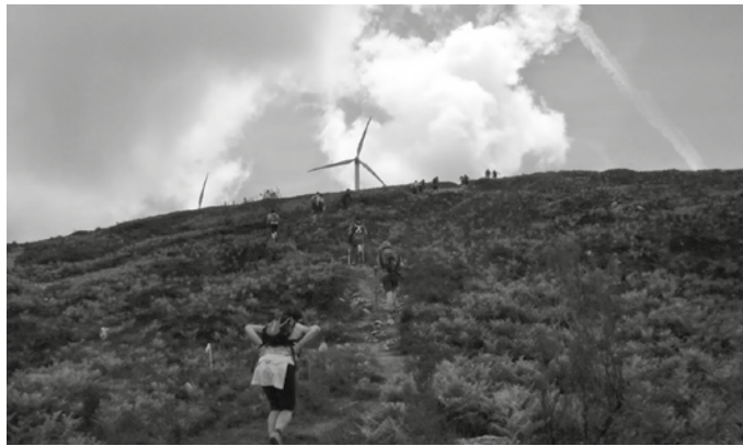
Azaroaren 12an Elgeako parajeetan ibiliko dira. Irteera honetan parte hartzeko izena eman behar da alde zurretik.

A ndatza M.K.T.-k finkatuak ditu urte amaierari begirako hitzorduak. Mendizaleek azaroa dute urteko erreferentziazko hilabetea. Gogoan izan Mendi Astea antolatzen dutela azaroa amaieran. Aurten ere hala egingo dute. Baina aurrez, hileroko txangoei dagokienez, Elgeako zerra bisitatzeko gonbita luzatu digute. Azaroaren 12rako iragarri duten irteerarako izen ematea zabaldu dute jada: