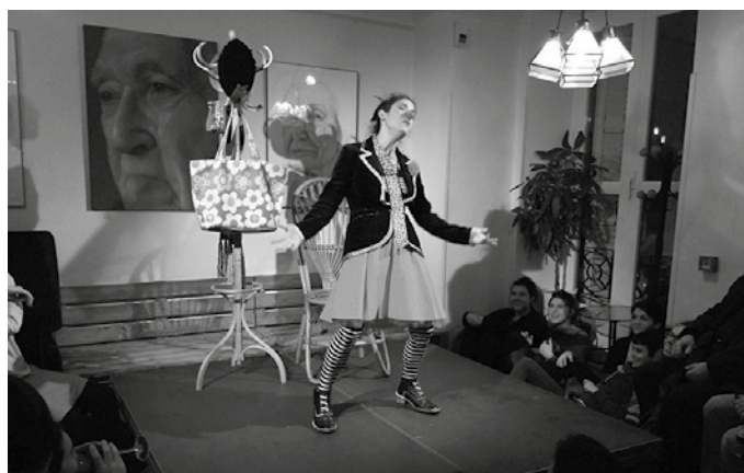
Arratsaldeko 18:30ean hasiko da antzezlanana.

Ekitaldirako sarrera doakoa izango da baina aurrez gonbidapenak eskura ditzakezue Oiaro Kiroldegian, Sutegi udal liburutegian, Artzabalen, Txirristran eta Aitzagan.