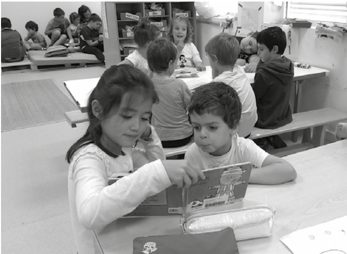
“Aurtengo ikasturtean HH-4 urtekoen lagun handiak izango gara”.