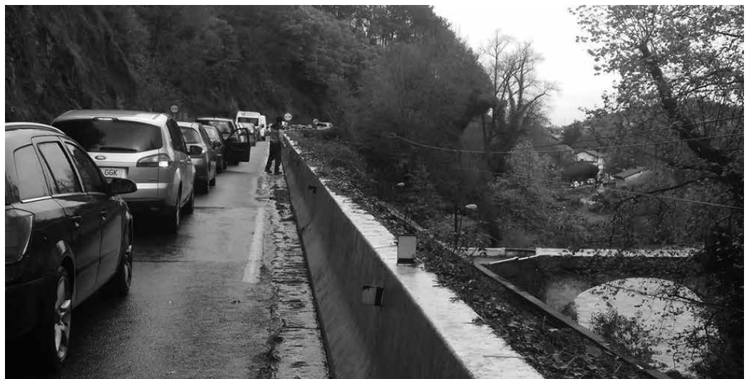
Azaroaren 11ko istripuaren ondorioz, lagun bat zaurituta eraman behar izan zuten ospitalera.

A zken urteotan ezbehar bat baino gehiago izan diren inguru berean, beste auto-istripu bat izan zen azaroaren 11n, eguerdi partean. Usurbildik Txikierrdirantz doan N-634 errepide zatian hain zuzen. Ibilgailu bat bidetik irten zen. Lagun bat zaurituta eraman zuten ospitalera, larrialdi zerbitzuek berri emandakoaren arabera. Suhiltzaileak eta Ertzaintza Txikierrdira, Zubietako Aliri zubirantz doan bidetik kudeatu behar izan zuten istripua.