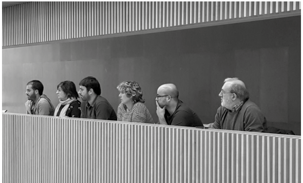
Buruntzaldeko EHBilduko ordezkariak adi-adi jarraitu zuten Batzar Nagusietako saioa.

Garraio zerbitzu publikoetan Aldundiak proposaturiko murrizketen aurrean, kontraesankorra iruditzen zaio Geteri, aurreproiektuan 2016ko datuetan garraio publikoen joan etorriak hazi direla nabarmendu, eta gero “lineak murrizteko erabakiak proposatzea”. Bere esanetan, “Aldundiak ez du ulertzen, garraio publikoen helburu nagusia ezin duela irabazi ekonomikoak edukitzea izan behar, behar sozialei erantzutea baizik. Zentzugabekeria da murrizketak aplikatzea, eskaera handitzen badoa”.