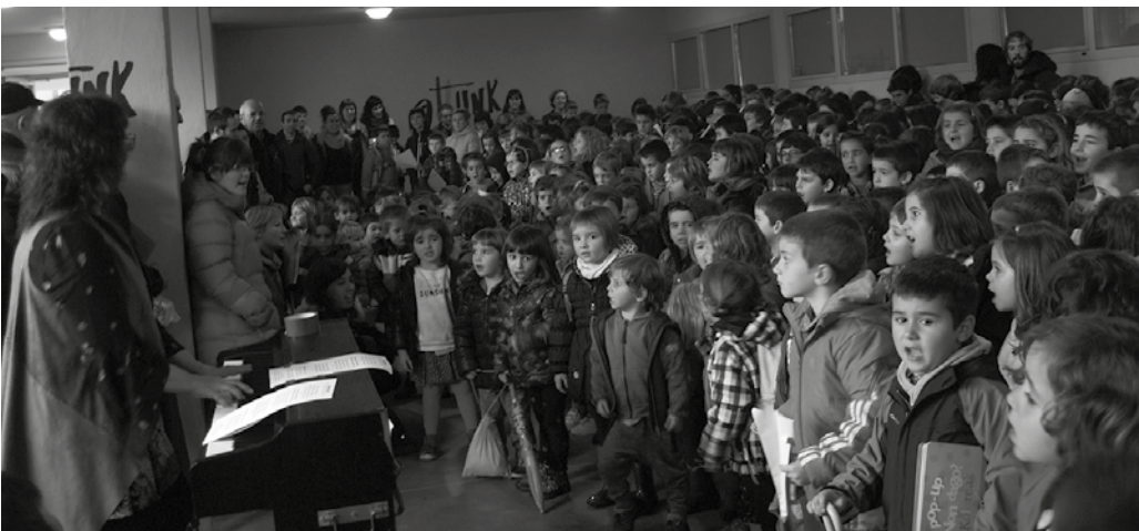
Kantuan aritu ziren, giro euritsua tarteko, Agerialde eraikineko aterpean.

U sadio zaharrei erreparatzen badiegu, hainbat baserrietan txerria hiltzeko eguna izan ohi dugu azaroaren 11, San Martin Eguna. Oraingoan larunbatez egokitu zen hilaren 11ri aurre hartu zieten Udarregi Ikastolakoek.