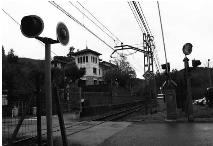
Ikusmen artifizialeko teknologiaren bitartez, trenbide pasaguneetako segurtasuna hobetzen hasi da Eusko Jaurlaritza.

“Begicrossing izeneko sistema, Dominion taldeko Begirale Controlling Risk startup-ak diseinatu du, eta ikusmen eta adimen artifizial teknologien erabilera oinarritzen da. Trenbide pasaguneetan egon daitezkeen arazoak goiz antzematea errazten du, igarobideko oztopoak identifikatuz edo trenbide pasaguneko azpiegiturako segurtasun elementuren baten akatsaz jabetuz, besteak beste”. Jaurlaritzatik diotenez, teknologia