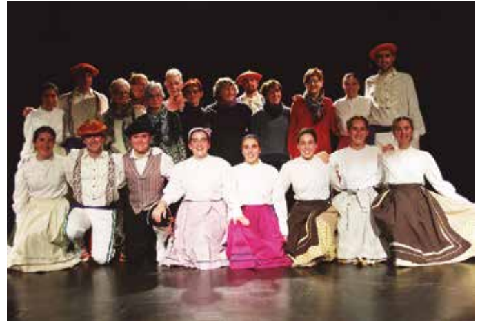
Txalo zaparrada jaso zuten jantzien jostunek.

Berezia izan zen Orbeldi D.T.-koek Kulturaldiaren baitan azaroaren 10ean eskaini zuten emanaldia. Batetik, askotan ez bezala, kalean egin ohi dituzten erakustaldia areto bateko oholta gainera ekartzeko aukera izan baitzuten. Euskal dantza tradizionalaz gozaz