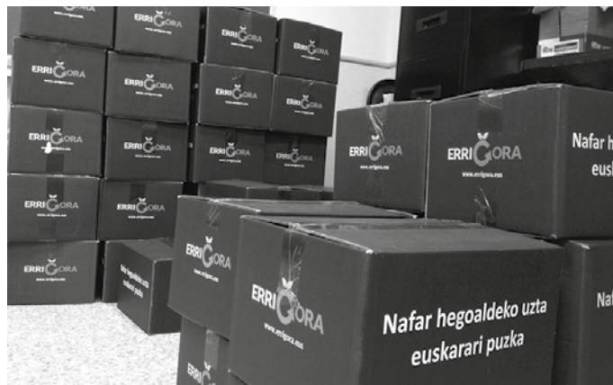
Abenduan, Errigorako otarren bila zatoztenean egin beharko dira ordainketak.

Produktu sorta: ardi gazna (450 g), ahate gibela (125 g), bixkotx poltsa bat artisanala (150 g), ezti (500 g), euskal xerriki lukainak (400 g), axoa