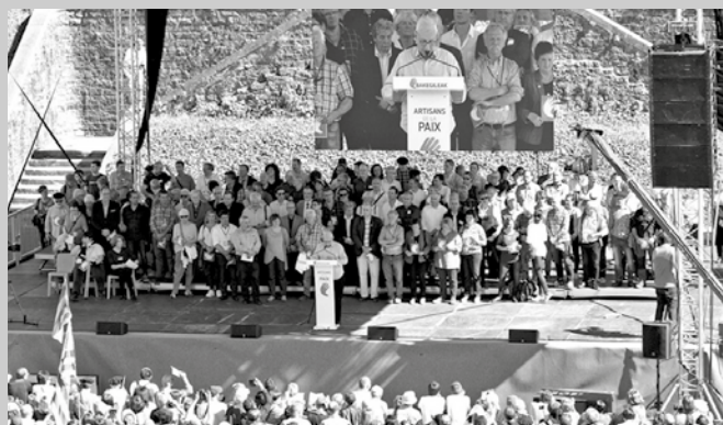
Euskal preso politikoei aplikatzen zaizkien salbuespen neurriekin amaitzea eskatuko dute abenduaren 9ko mobilizazioan.

Autobus zerbitzua antolatuko da Usurbildik, ohiko lekutan eman ahalko da izena.