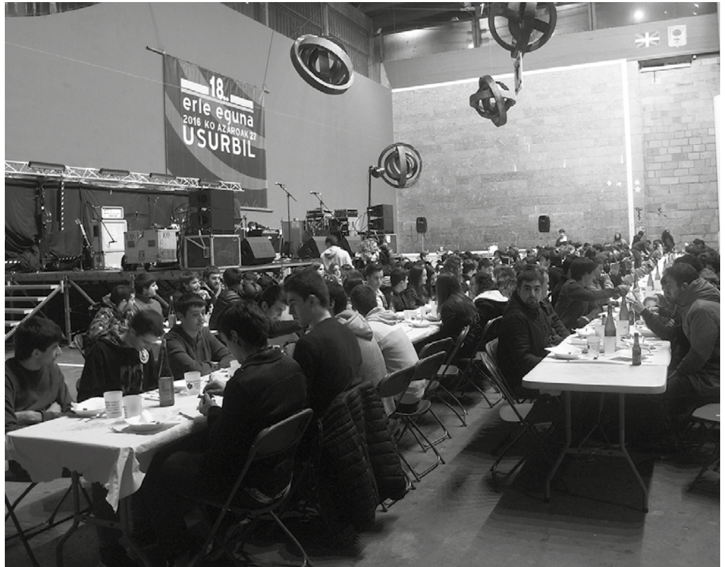
Iaz Erle Eguneako ospakizunen asteburu berean egin zen Gazte Eguna. Aurtun, astebetez aurreratu dituzte ekitaldiak.

■ Oharra: “ez da jarrera sexista, arrazista edota homofoborik onartuko”.