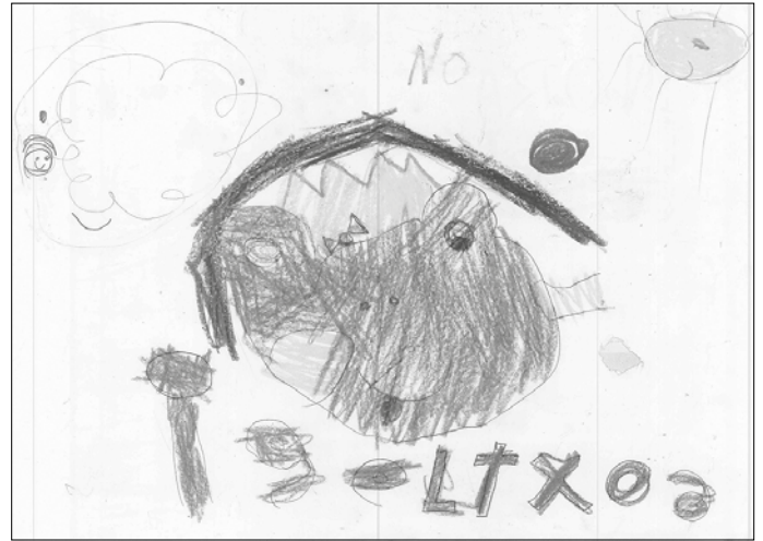
“Marrazki bat egin genuen elkarrekin eta gero patiora joan ginen jolastera”.

A din nahasketa haur txikiak handiagoekin elkartzeko da, elkarrekin zenbait ekintza egiteko asmoz.