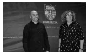
Azaroaren 18an Hernaniko Orona-Ideo Fundazioaren gunean egingo dute batzarra.

Herritar eta eragileekin egin duten urtebeteko gogoeta prozesuan dinamika ezberdinak bideratu dituzte eta ia 600