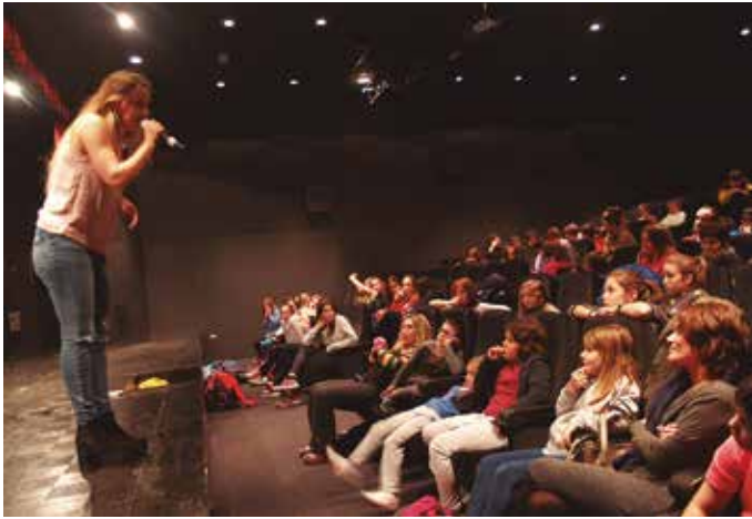
Gazte ugari batu ziren Zuriñe Hidalgoren solasaldian.

Maila pertsonal eta ibilbide profesionaleko galderak bata bestearen atzetik egin zizkionten azaroaren 9ra Sutegira hurbildutako haur eta gaztetxoek Zuriñe Hidalgo musikari, aktore eta telebista aurkezleari. Jakinmina bazuten telebista edo kontzertuetatik ezaguna