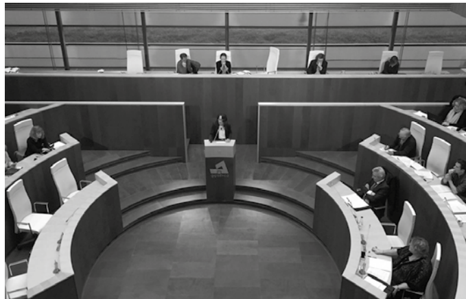
Mugikortasun eta Lurralde Antolaketako foru departamenduaren proposamenak kezka eragin du herritar sektore askotan.

Batzar Nagusietan ziren 44 batzarkideetatik 27 agertu ziren aurka, gainerako 17ak alde. Ebazpen-proposamen honen aurrean gainera, EAJK eta PSEK osoko zuzenketa aurkeztu zuten. Bertan, lizitazio honekin aurrerantz jarraitzea proposatzen dute eta gipuzkoarrek aurkezturiko milaka alegazioak aztertu eta baliagarriak zaizkienak aintzakotzat hartzeko asmoa erakusten dute, aurrerago aurkeztu nahi duten proiektua hobetze aldera. Aipatu moduan osoko zuzenketa hau gehiengoz onartu zuten aldeko 27 bozkekin eta 17 batzarkideren aurkako botoekin. Bozketa aurretik ordea luze jo