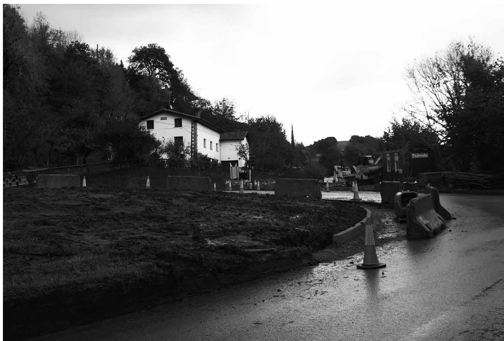
Udalak bi aukera luzatu dizkio obra zuzendaritzari: “zirkulazio handia egoten den orduetan lanak eteteko, batez ere 8:00etatik 9:00ak artean, edota lanak gauez egitea. Bigarren aukera hori ez du ontzat jo obra zuzendaritzak, eta lehen aukera aztertze konpromisoa hartu dute”.

Aurreko astean gertaturikoa ez errepikatzea ere eskatu dute udal langileek, “izan ere, astelehenean (azaroak 6) gertatu ziren erretentzioek eta ezustekoek ezin dutelako berriz gertatu. Zirkulazioan ahalik eta eragin txikiena izan dezan, aurrez abisatzeko eta udaltzainak jakinaren gainean jartzeko es-