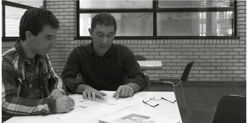
Igerilekuko obrak burutzeko, Foru Aldunditik 247.880 euroko laguntza jasoko du Usurbilgo herriak.

Lanak, ahalik eta eramangarrien Obra hauek 2018. urteko bigarren zatian bideratu asmo dituzte. Aurrerago zehaztuko