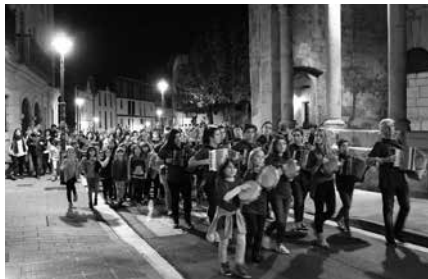
Arratsaldeko 18:00etan abiatuko da kalejira. Ondoren, Sutegin jarraituko du festak.