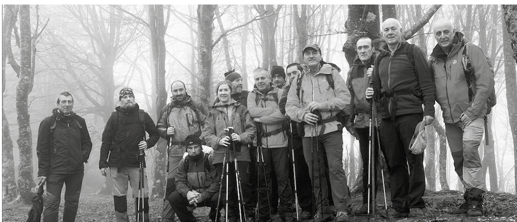
Aurreko igandean, Larreatik abiatu eta Elgeako zerraren gainetik Araiarraino joan ziren Andatzakoak, haize errota eta lainoen azpitik.