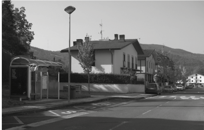
Zubietako geltokia mantendu egingo da. Orain arte bezala igaroko da ingurune horretatik, Hernanirako nahiz Usurbil alderako autobusa.

Gipuzkoako Batzar Nagusietan aurreko astean egindako osoko bilkuran ere gauza bera errepikatu zuen. EHBilduk eta Ahal Dugu-Podemosek garraio zerbitzu publikoetan aurreikusten diren murrizketen ha-