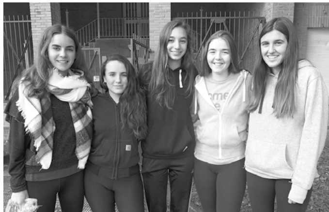
"Filmazpitatekoekin hartuemanetan jarri eta proiektu berri bat abiatzea erabaki genuen. Hilero azarotik martxora filmak eskaintzea, hirugarren ostiraletan", DBH4ko ikasleek aditzera eman digutenez.

Filma hona datorren kanpotar bati buruzkoa da. Jendea identifikatua sentituko da. Pelikularen edukiak ere zer hausnartua ematen du, helduentzat proposa. Proiektatuko ditugun filmak gaurkotasan gaiekin lo-