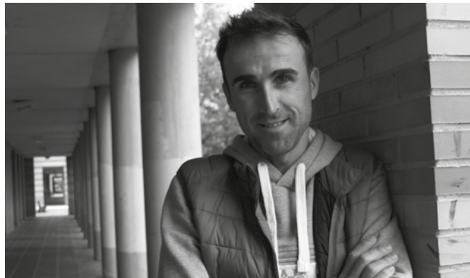
“Neure zaletasuna ogibide bihurtu zen eta asko gozatu ahal izan dut”.

20 urteok gozotik edo gazitik gehiago izan dute?