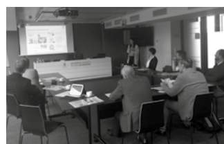
Bertako metodologia berritzaileak ezagutzera hurbildu ziren.

Arduradun hauek Usurbilgo Lanbide Eskolan azaldutakoa eta jasotakoa aberasgarria izan dela eta