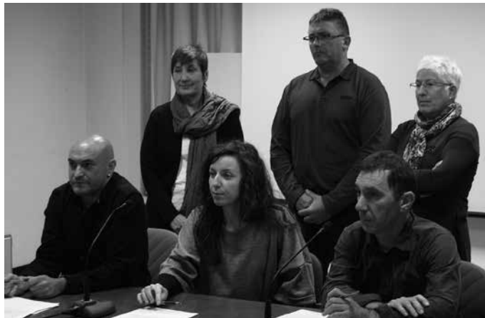
Atez ateko bilketa abian zuten udalerriek, bilketa honen gastuez gain, edukiontzien sistema baliatzen zuten Mankomunitateko gainerako herrien gastuei ere aurre egin beharrean aurkitu izan dira.