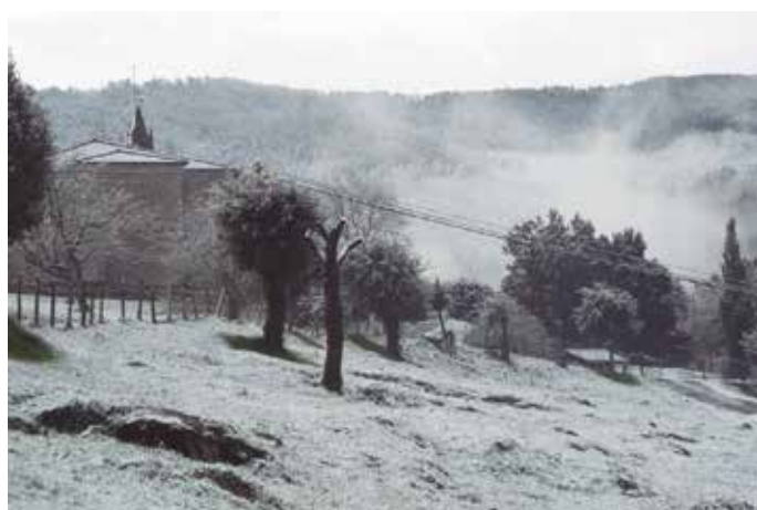
Abenduko lehen egunetan, bazter guztiak edertu zituen elurrak.