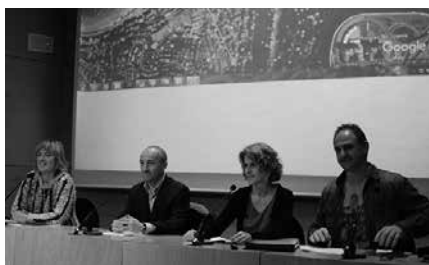
Donostiako Eureka Zientzia Museoa egingo da ekitaldia, goizeko 11:00etan hasita.

"Hitzartu Gipuzkoako jendarte zibilak antolatutako parte hartze prozesua izango da. Gipuzkoarrok aukera berri baten aurrean gaude: behingoz, foro irekia eta anitza bat osatu nahi dugu, hondakinen inguruan ditugun kezken, jakin minen eta iritzi guztien gainean hitz egiteko", hedabideetan zabaldu duten oharrean aditza eman dutenez. "Aniztasuna, elkarrizketa, informazioa, eztabaida eta