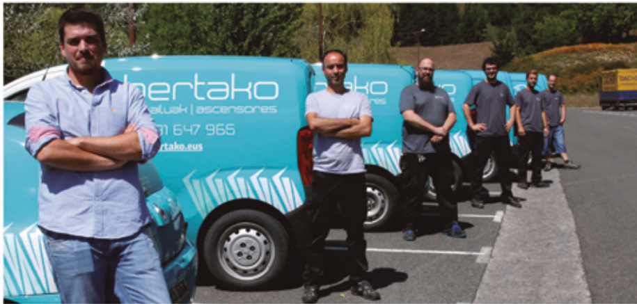
Bertako enpresako teknikoak, mantentze lanetarako erabiltzen dituzten autoekin.