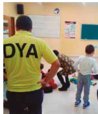
DYAk clown saio bat eskainiko du larunbatean Aginagako ludotekan.

ta izango da, arratsaldeko 17:30ean hasita. Antolatzailea: Antxomolantxa Elkarteak.