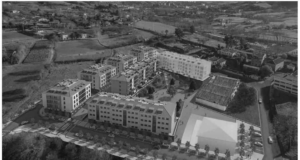
Zozketa Oiaro kiroldegian egingo da. Urtarrilaren 25ean osteguna, arratsaldeko 18:00etan.

46 babes ofizialekoak izango dira, eta beste 46ak, tasatuak. Babes ofizialeko etxebizitzetan bi logelako 20 etxebizitza (horietako bi ezinduentzat egokituak) eraikiko dira, eta hiru logelako 26 etxebizitza. Tasatutakoetan ere, beste horrenbeste.