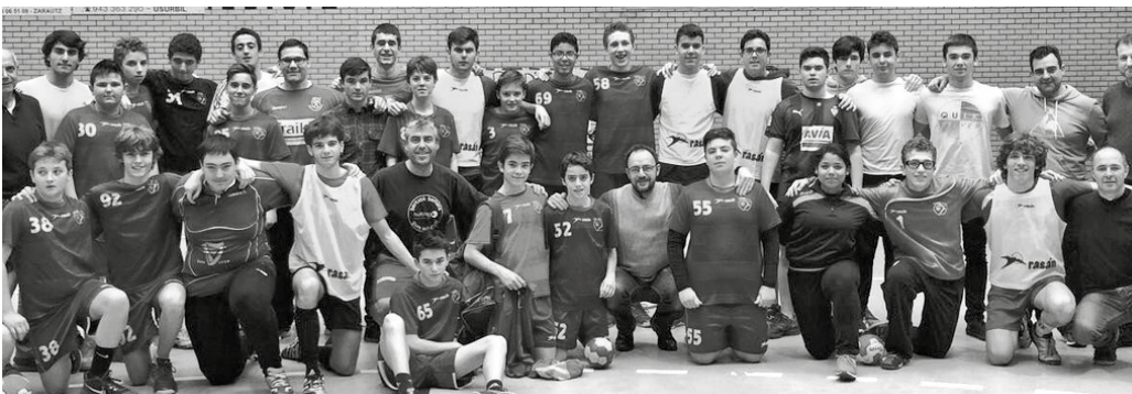
Arbitraje hastapenerako ikastaroa. Aurreko zubi astean egin zuten Oiarde Kiroldetgia, Gipuzkoa Eskubaloi Federazioaren argazki honetan ikus daitekeenez.

erosketak egitea saritu nahi du Hurbilago Elkar-teak opari ederrekin. Datozen asteotan, elkarteko kide diren establezimenduetan erosketak egitearen truke, txartelak eskuratu ahalko dituzue. Saltokietako kaxetan sartu eta abenduaren 31ra arte itxaron. 8. Hurbilago San Silvestre Herri Lasterketaren amaieran, frontoian, 50 euroko 25 bale eta Saizar Sagardotegian dastatzeko 2 laguntzako 4 afari zozketatuko dituzte.