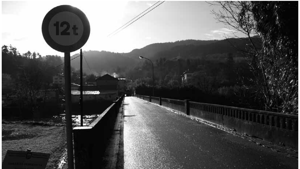
Seinale berriak ipini dituzte. Bestalde, zubia konpontzeko proiektu-zirriborro bat du mahai gainean Udalak.

Debekuak Berriolari ez dio eragingo, “aitzitik, hondaki-