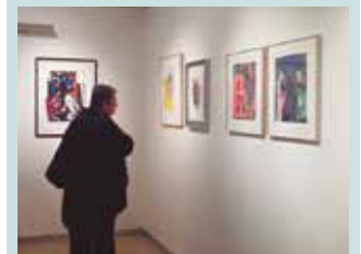
Arratsaldean, 17:00etatik 20:00etara dago zabalik. Asteburuan, baita goizez ere: 11:30etik 14:00etara.