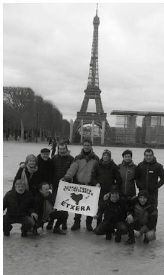
Pariseko kaleak zeharkatu zituen mobilizazioan hainbat usurbildarrek parte hartu zuten. Tartean, ondoko irudiak helarazi dizkiguten herritarrok.

■ 18:00-19:00 Abenduaren 24an Olentzero eta Mari Domingirirekin egingo den herri