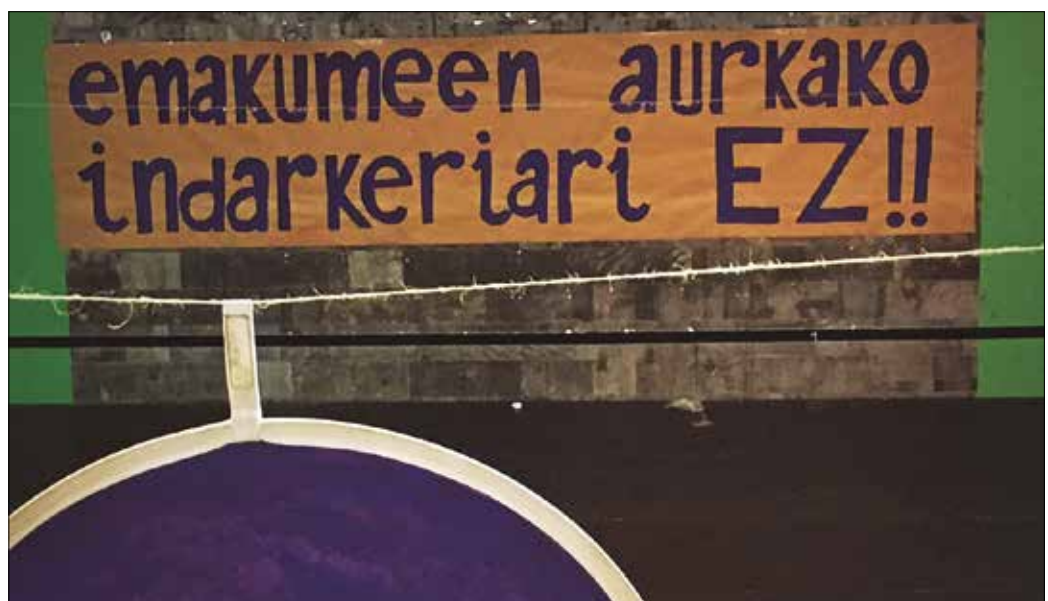
“Emakumeen aurkako indarkeria desagerrarazten saiatuko gara eta desagertu arte ez dugu etsiko”.

Mundua eta gizartea aldatu egin omen dira, eta oraindik emakumeen aurkako indarkeriak hor jarraitzen du. Emakume asko gizonen menpe daude, eta horren ondorioz emakume horiek asko sufritzen dute. Azaroaren 25a izan zen emakumeen aurkako indarkeria salatzen den eguna. Ondo dago egun hori ospatzea, baina ez da nahikoa egun horretan morez janztea, ez eta WhatsAppeko perfilean kamisetaren baten argazkia jar-