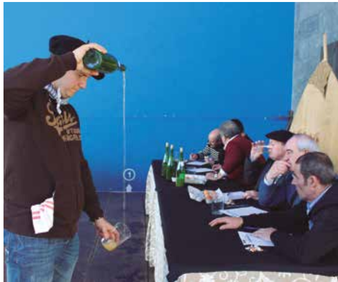
Lehiaketara aurkeztutako babarrun eta sagardo onenak aukeratu dituzte igandean.