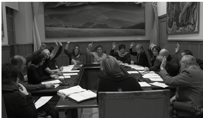
Azarako plenoan galdera sorta luzatu zion EAJ alderdiak udal gobernuari.

Ziurtasunik gabe, baina Erroizpeko urak eragindako brotea izan zitekeela ikusita, iturriko ura ez edatea aholkatzzen zuten bandoa kaleratu zuten Udalak. Erabaki hau Osasun Sailak “agindu gabe” hartu zuela gaineratu zuten