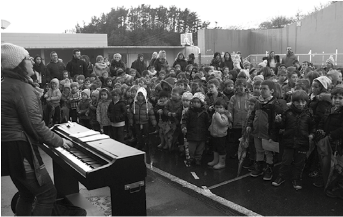
Abenduaren 3ko Euskararen Egunari aurre hartu zioten bi egun lehenago ikastetxeek. Udarregi Ikastolako Lehen Hezkuntzako ikasle eta hezitzaileen kantaldia ospatu zuten, elurra tarteko, frontoian eskaini zuten kantaldian.