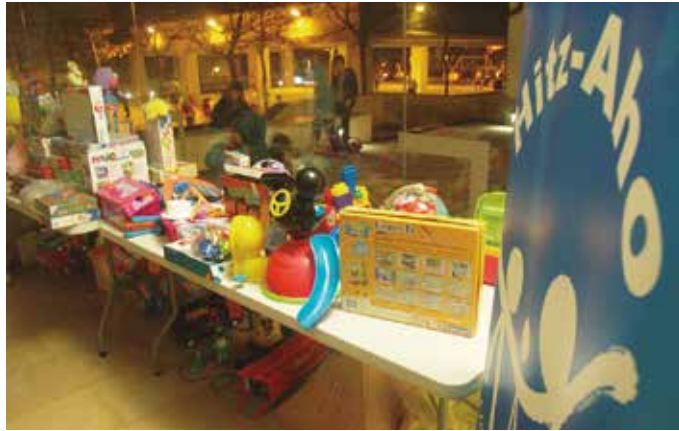
Aurretik, jostailu erabiliak batzeko deia egin dute: abenduaren 14an eta 15ean Potxoenera eraman behar dira, 17:00etatik 19:00etarako tartean.