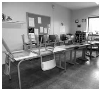
Grebaren jarraipena erabatekoa izan zen Aginaga eta Zubietako eskoletan.

Mobilizazio urte hau, ELA, LAB eta STEILAS sindikatuek deituta EAeko unibertsitatez