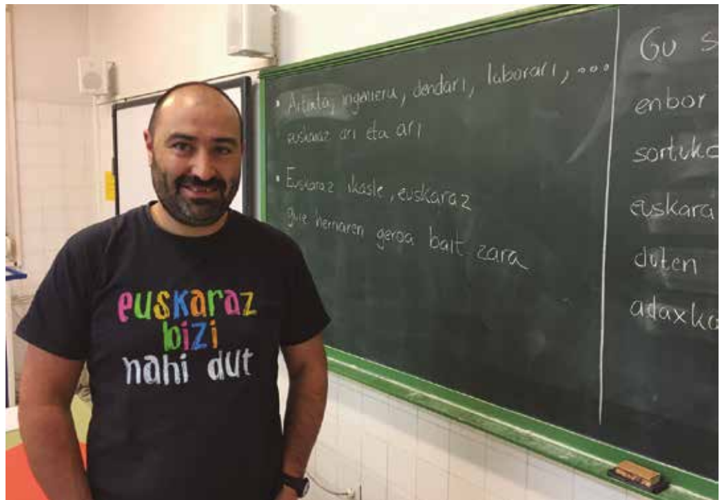
“Egun batean ospatzea ondo dagoen arren, egunero erabili beharko litzateke euskara”.

Euskal Herriko eskola eta herrietan mila ekimen burutzen dira: bertso saioak, jokoak, kontzertuak, programa bereziak telebistan... Jende askok sare sozialetan “euskaraz bizi nahi dut” leloa edo argazkia jartzen du. Gero ordea, ogia erostera joaterakoan adibidez gazteleraz eskatzen dute. Honek erakusten digu, egun batean ospatzea ondo