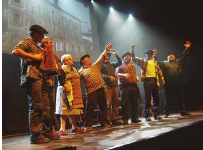
“Ordubetez barre egin nahi duenak aukera paregabea du”, antzezlanean kideek aditzera eman dutenez.

2015ean Usurbilen Uda- rregi Ikastolaren aldeko KILOMETROAK gauzatu zela eta, herri antzerki bat egin zuten hainbat herritarrek. Ber- tan duela 60 urteko sagardote- gi bateko giroa antzeztu zuten. Orain berriz, bigarren zatia antzeztuko da: Beñardoren sagardotegian hainbat egoera berri gertatuko da 20 urte on- doren: urtebete Ameriketara artzain ibilitako Patxiren ibile- rak, Beñardo sagardotegiko na- gusiaren etorkizuna eta beste hainbat gertakizun gertatuko dira afera baten inguruan.