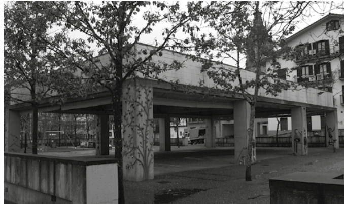
Izotz pistaarako sarrerak aurrez merkeago eskuratu ahalko dituzue Hurbilagoko saltokietan.

San Silvestrerako izen ematea Izena ohi bezala, aurrez eman ahalko duzue hurbilago.com atarian edo elkarte bereko establezimenduetan. Hitzordua betikoa; jai giroan ospatuko