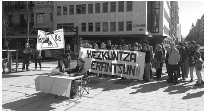
Landaberri ikastolatik 500 metrora kokatzen da erraustegiaren gunea. Bertako langileek euren kezka eta ezinegona azaldu dute behin baino gehiagotan.

“Nork ziurtatzen du gure haur ikasleen osasuna ez dela kalteturik izango hemendik ez oso epe luzera, urtero aurreikusten dituzten 155 mila tona errausketaren ondorioz haizatuko diren dioxina eta mikropartikula iragaitzez? Baita errausketaren ondorioz sortuko lirakeen aipatutako