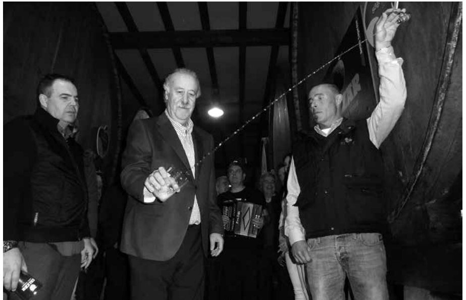
"Hau da Usurbilgo Saizar sagardo berria!" esanez, 2018ko denboraldia abiatzeko ohorea izan zuen.