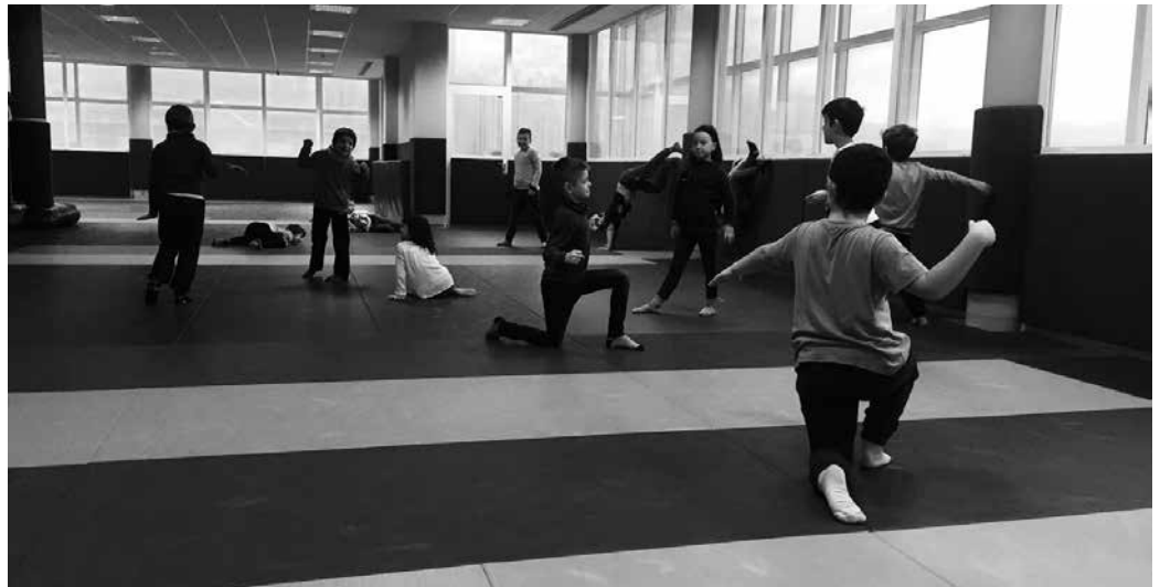
Gurasoak ere animatu nahi dituzte. Horretarako, "Gorputzaldiak" saioa antolatu dute otsailaren 3rako.

Arropa erosoekin jantzita eta gorputz adierazpen libreari bi-