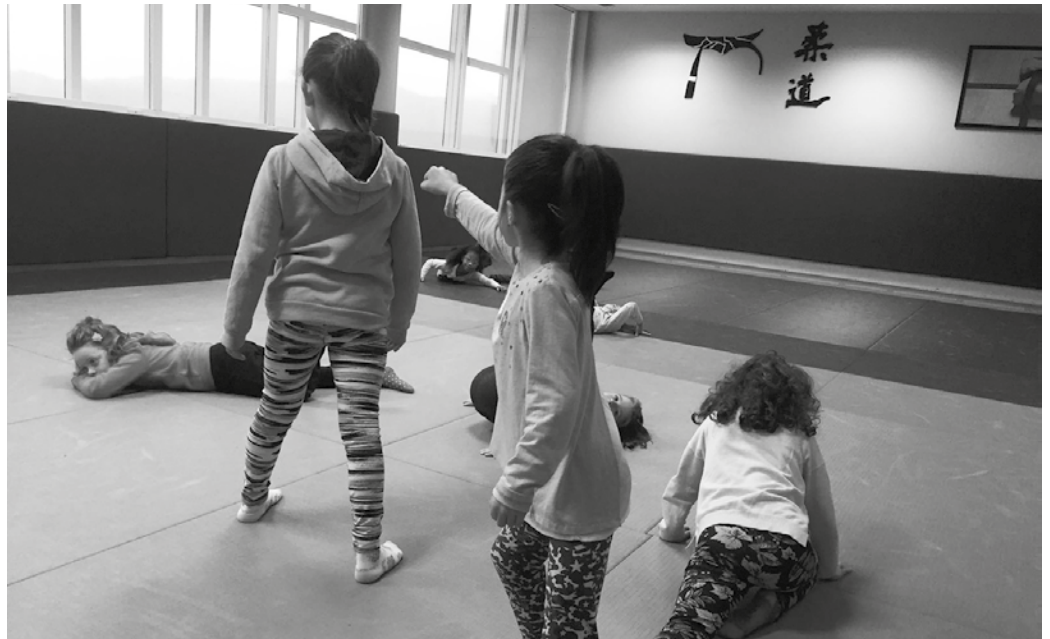
Gorputza dantzan jartzen dute ikasleek jolas eta ariketa ezberdinen bidez.