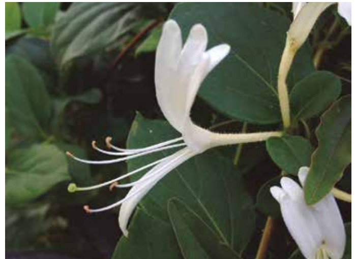
“Gure paisaietako xuritasunaren egarri zen. Loreen izenetan. Hitzetan. Izan ere hitzetan biltzen dugu bihia ematen duen bizitza. Bihitza”.

B ihia, labore alea edo fruitu txikia da. Landare batek hurrengo belaunaldia bideratzeko sortzen duen fruitua eta hazia. Bizitza bideratzekoa. Datorrenetik berria. Zetorrenetik, bizi denak hurrengo ahalbidetzea. Aurrerabidea gauzatu ahal izatea. Landareak hazia, bere hurrengo landarearen muina. Eta bide ederrenetik, loretik. Landareak hazia emateko lorea azaldu behar du.