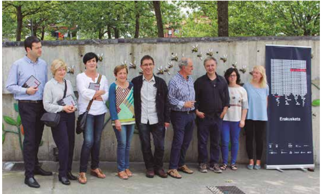
2016ko ekainean, Usurbilgo Udalak “Ikimilikiliklik, JA Artzeren unibertsoa” erakusketa ekarri zuen Potxoeneara. Argazkia aurkezpen ekitaldikoa da.

Udaletik gaineratzen dutenez, hainbat iturritatik osatutako bere unibertso aberats eta zabalaren oinarrian bere sorterrira Usurbil zegoen eta bere unibertsoa ezagutzeak, gure eguneroko unibertsoa emozionalki, kulturalki eta herri gisa ere zabaltzen duela azpimarratzen du. “Joxanek hemen egin ditu bere eguneroko osteratxoak eta mendi-bueltak. Joxanek bere lan poetikoan, iturriak, zuhaitzak, elurra, txoriak.. horiek erabiltzen dituenean, guk usurbildarrok hemengo bazterrak irudikatzen ditugu, egilearekin halako konplizitate puntu batez”.