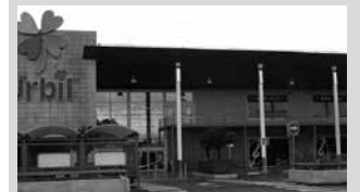
Batzarra urtarrilaren 18an egingo da, 19:00etan Potxoenean.

Urbilen handitze eskaerari buruz jarduteko herri batzarra antolatu du Usurbilgo EHBilduk ostegun honetarako, urtarrilak 18, iluntzeko 19:00etan Potxoenean. “Parte hartu, garrantzitsua baita! Usurbil bizia nahi dugulako!”. Gai honi buruz Usurbilgo Udalak duen ikuspegia herritarrekin partekatu eta herritarren iritzia bildu nahi dira hitzorduan, Urbili erantzun bat eman aurretik.