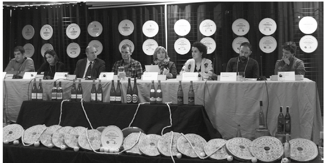
Alberto Iñurrategi eskalatazile eta mendizaleak izan du aurtengo txotx denboraldia zabaltzeko ohorea.

Urtero gonbidatzen dute aurpegi ezagunen bat txotx boladaren hasierara; aurtengoan Alberto Iñurrategi eskalatazile