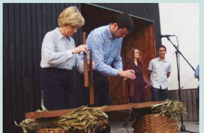
Zuaznabartarrak, ‘Ikimilikiliklik’ erakusketa zabaldu zen egunean.

taldian, besteak beste, Joxan Artzeren senideak, lagunak eta herrikideak elkartu ziren, eta baita erakusketaren sustatzaileak ere; Usurbilgo Udalak eta Jexux Artze Kultur Elkarteak, besteak beste. “Jende askoren ahaleginari esker” heldu zen erakusketa Artzeren sorterrira, nabarmendu zutenaz.