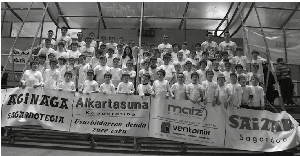
Aurreko astean, frontoian elkartu ziren kategoría guztietako pilotariak. Jokalari bezainbeste guraso zegoen argazkia ateratzeko.