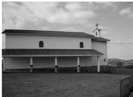
Urtarrilaren 27an, eguerdi partean, proiektuari buruzko informazioa emango dute Azkorteko ermitan.