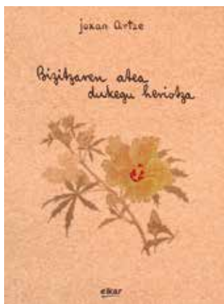
2013an plazaratu zituen azken bi liburuak. Poema asko geratu dira argitaratzeke.

parta oinarritzat hartuta disko bat kaleratu zuten Milango Ricordi etxearen eskutik.