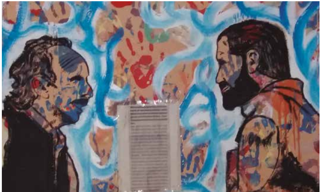
“Usurbilgo gaztetzeko hormetan hainbat irudi margotu genituen noizbait. Horien artean, Artze anaien irudia”, Ugaitz Agirrerren twitter kontutik jaso ditugu argazkia eta argazki-oina.