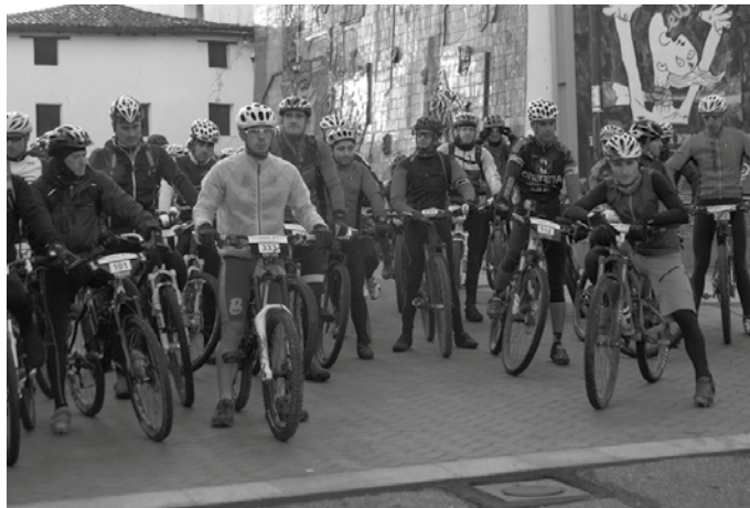
Urtarrilaren 28an egingo da Irisasi BTT Hotzak Akabatzen bizikleta proba.

Urtarrilaren 28an ospatuko den mendi bizikleta gaineko probarako izena, kirolprobak.com atarian sartuta eman dezakezue hilaren 26ra arte. Federatuek 18 eurotan, federatugabeek 20 eurotan. Proba egunean bertan, 8:45 arte ere izen emateko aukera izango duzue 25 eurotan. Apuntatzen diren lehen 500 lagunek mallota ja-