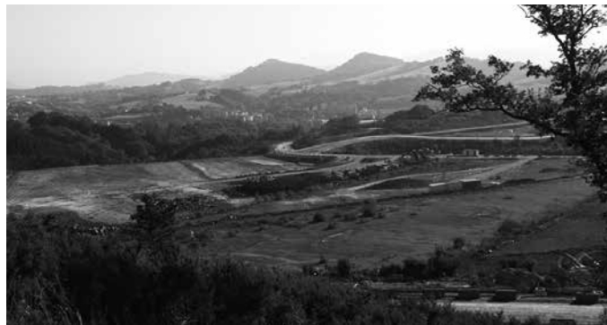
Lur mugimenduak eginak daude, baina eraikitze lanak ez dituzte hasi oraindik.