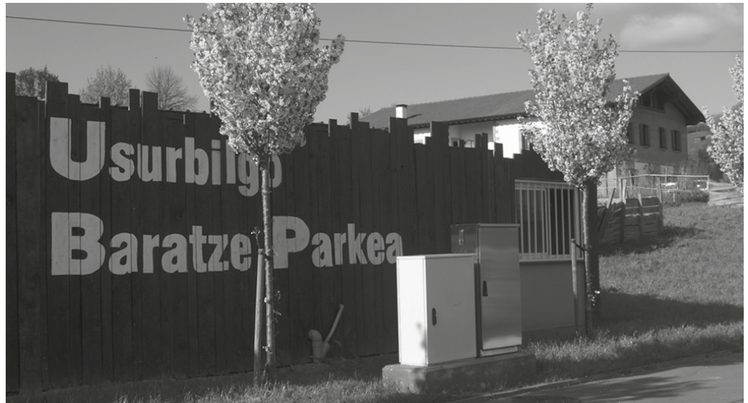
“Kontzesiodunei, soilik beraiei, baimena emango zaie partzela horiek erabili eta ustiatzeko”.

Aprobetxamendu epea 5 urterako izango da gehienez.