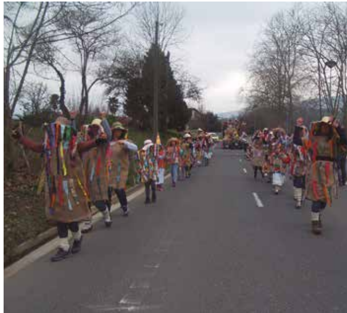
Larunbat honetan, arratsaldeko 16:45ean, Zubietatik Lasarte-Oriara abiatuko dira kalejira.