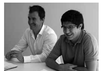
PSE-EEKo ordezkariak 2014an, tren pasabide denak kentzea eskatu zutenean.

Arestian esan bezala, Usurbilgo PSE-EEK mozio hau aurkeztu zuen 2014ko martxoan. Udal ordezkari denek aho batez onartu zuten. Honela zioen mozioak: “1. Usurbilgo Udalak, Eusko Jaurlaritzaren Ingurumen eta Lurralde Politika Sailari dei egi-