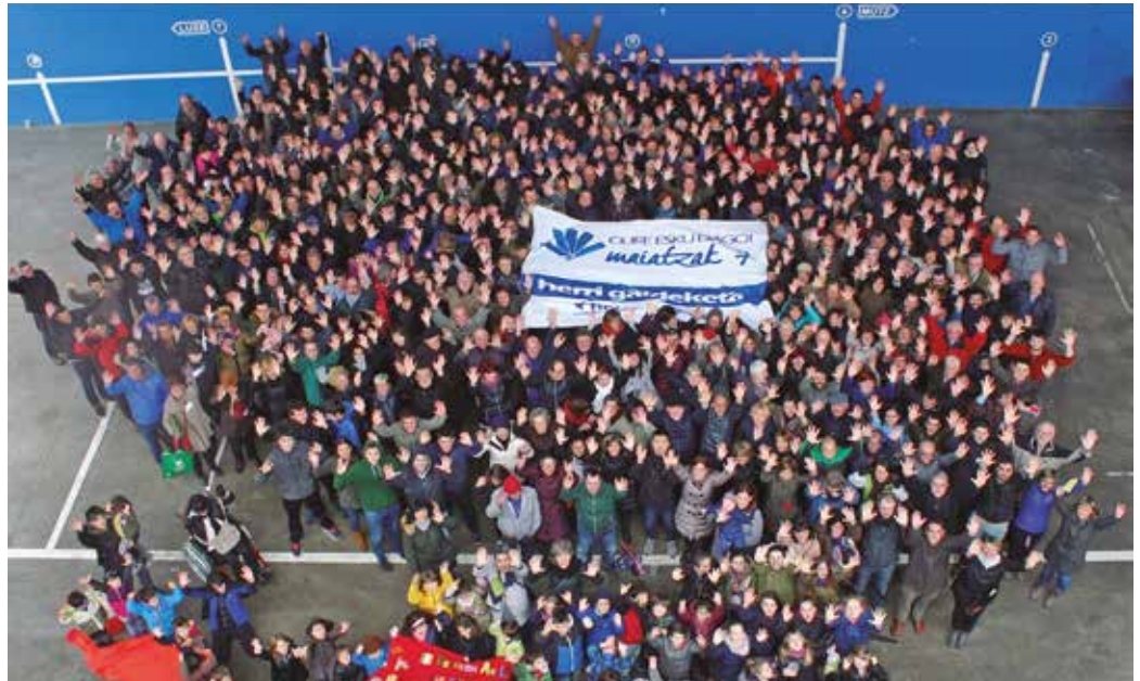
Ekainaren 10ean, Donostian abiatu, Bilbo zeharkatu eta Gasteizko Legebiltzarrean amaituko da giza-katea.

Euskal Herrian inoiz egin den mobilizazio handiena izango dena aurkeztu zuten larunbatean Donostiako Eureka zientzia museoan. Ekainaren 10ean, Donostian abiatu, Bilbo zeharkatu eta Gasteizko Legebiltzarrean amaituko den erabakitze eskubidearen aldeko giza-katea. 201,9 kilometro luze izango ditu. Eta oraingo hau bai, besteak beste, Usurbildik ere igaroko da. “Ekainaren 10ean berriz ere eskua emango diogu elkarki, erabakiari. Herri burujabea izateko orain inoiz baino gehiago,