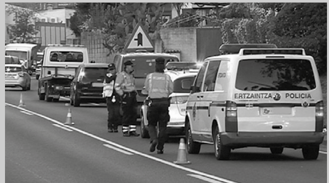
Auto batek Usurbilgo gizon bat harrapatu zuen Troia pareko pasabidean.

Troia parean, N-634 errepidea zeharkatzen hasi zenean auto batek harrapatu zuen.