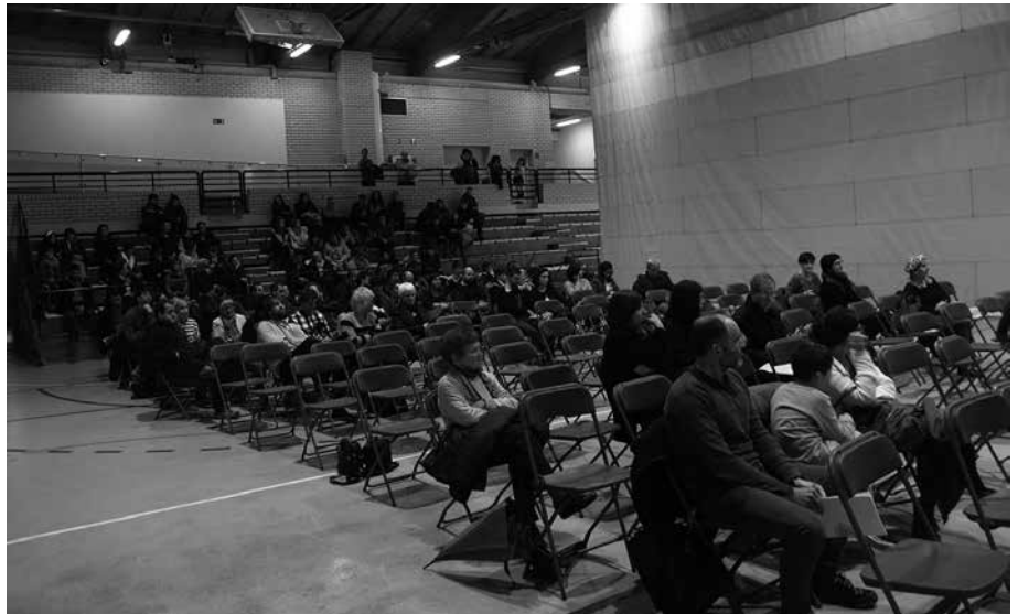
Kiroldegian egin ziren etxebizitza tasatu eta babestuen zozketak.

Orain, iazko ekainaren 27an Usurbilgo Udaleko udalbatzak onartutako etxebizitzon esleipen oinarri jarraiki, behin behingo esleipendunen zerrenda udal txeko iragarki-taulan jarriko dute ikusgai. Bestalde, "gerta daitezkeen ukoen edo oinarri hauetan ezarritako baldintzak ez betetzearen ondoriozko hutsuneak betetzeko, Kupo bakoitzerako itzarote-zerrenda bat osatuko da, eragin guztietarako".