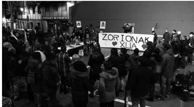
Picassent espetxean da Xua eta bere lehen urtebetetzea ospatu zuten frontoian.

Gogoan izan zuten, salbuespen neurrien ondorioz sorterritik urrun dagoela Xua, gurasoak