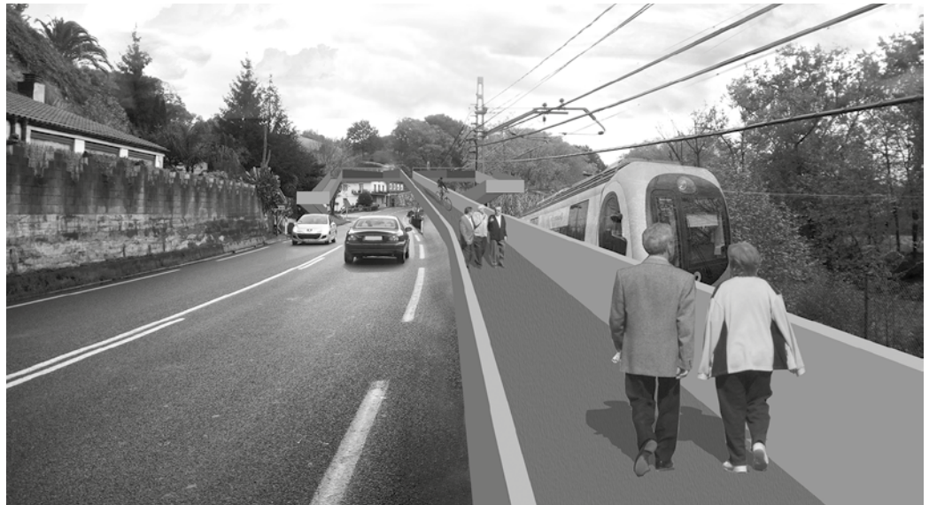
Troiako pasabide-egitasmoaren foto-muntaia. Udalak sustatu duen proiektuak Ugaldea industriagunerainoko bide-gorria ere aurreikusten du.

Udalak proiektu hau gauzatzeko lanean segiko du. Bilera eskatu du dagoeneko Aintzane Oiarbide Bide Azpiegituretako diputatuarekin, “proiektuari heldu eta kaxoi batean ez sartzeko eskatzeko”. Alkatearen esanetan, baina, “herriaren laguntza