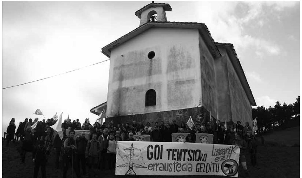
Pasa den larunbatean egin zuten mendi martxa. Parte hartzaileak, Azkorte ermitaren ondoan.

Urtarrilaren 27an Azkorte egindako mendi martxan gogor salatu zuten, erraustegiak eragin ditzakeen kalteak gutxi izan ez eta orain gainera goi tentsioko linea proiektuak ekarriko dituenak. 5 kilometro luze izango ditu. Urnieta, Andoain eta Lasarte zeharkatuko ditu, erraustegiraino, “baso, larre eta nekazaritza lur artean joango da”. Salatu zuten, “40 metroko zabaleran eraikiko diren 132 Kw potentziako zutabeetatik atera nahi dute argindar sarrera, zaborrako errausteagatik sortuko den energia”.