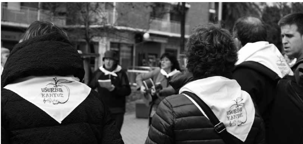
Usurbilgo Kantu Taldeak urteko lehen jira osatu zuen aurreko larunbatean. Duela hiru aste zendu zen Joxan Artze eta haren omenez ‘Gure bazterrak’ kantarekin hasi zuten saioa.

Aurreko ostiraleko mobilizazioa gainera, Etxerat-ek kanpaina berria aurkeztu zuen egun berean egokitu zen. Espetxe politikaren ondorioak ezagutzera emateko egitasmo orokorragoaren baitan, eta “Motxiladun umeen” errealitatea plazaratu ostean, aurrerantzean adin nagusiko eta gaixorik dauden senideak eta dispertsioa ezagutarazteko lanketari ekingo diote. “Urrunketak pertsona ahulenengan duen eragina jakinaraztea dugu helburu eta datozen hilabeteetan euren errealitatea ezagutarazteko hainbat ekimen egingo ditugu”, iragarri dute.