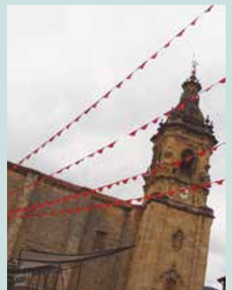
Otsailaren 6an asteartea, lehen bilera. 18:00etan Potxoenean.

Deitzaileek, bilerok izan ohi duten harrera nabarmentzen dute. "Azken urteetako jai batzordeak oso jendetsuak izan dira, eta emaitza ere, halakoxea izan da, horrenbestez: jai parte-hartzaileak, herrikoiak eta egitarau oparoa", gogorarazten dute.