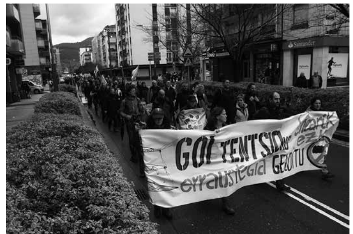
Errausketa plantaren obrak ikus daitezke Azkorte edota Buruntza menditik. Martxa Lasarte-Oriako Okendo plazan amaitu zuten.