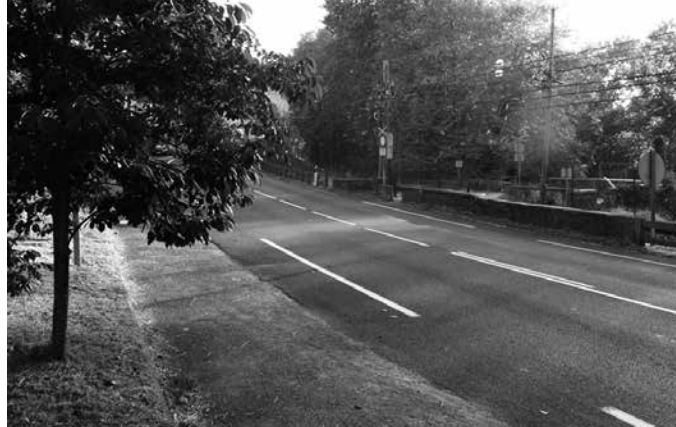
Herritar askok erabiltzen dute pasabide hau. Arriskua bikoitza da. Errepidea zeharkatzeaz gain, tren-karrila ere igaro behar delako.

T roiako pasabidea aspaldiko aldarrikapen bat da. Behingoz eraikitzen hastekoak zirela zirudienean, ezusteko galanta jaso du Usurbilgo Udalak. Proiektua finantzateko diru faltan dela argudiatuz, Gipuzkoako Foru Aldundiak bertan behera utzi du egitasmoa. Zubietara edota Lasarte-Oriara oinez edo bizikletaz joateko ohitura duten herritarrek arrisku egoeran jarraituko dute.