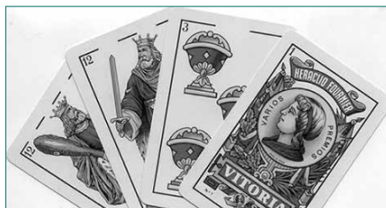
Ostiral honetan, 22:00etatik aurrera Aitzagan.

Aginagaren ondoren, Usurbilen txanda. Euskal Herriko X. Mus Txapelketako sailkatze proba ostiral honetan ospatuko da, 22:00etan Aitzaga Elkartean. Saizar Sagar dotegiak lagundutako ekimenean, bikote parte hartzaileentzako izen ematea ordu erdi lehenago zabalduko da, 21:30etan. Informazio gehiago: ehmus.eus