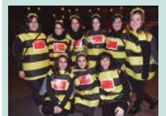
Otsailaren 10eko festari begira, “Pertsona ezagunak” hautatu da mozorroretzeko motibo gisa.

■ 16:30 Inauterietako tailetarak Bihurri ludotekan.