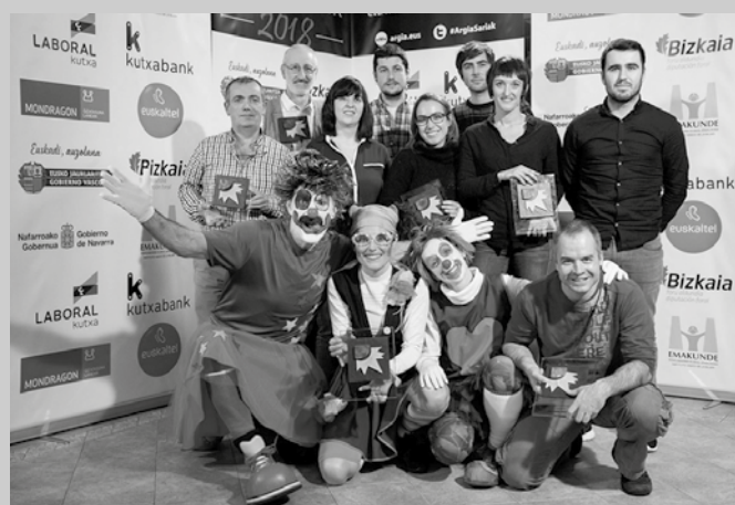
Saritu gehienak ageri dira argazkian.