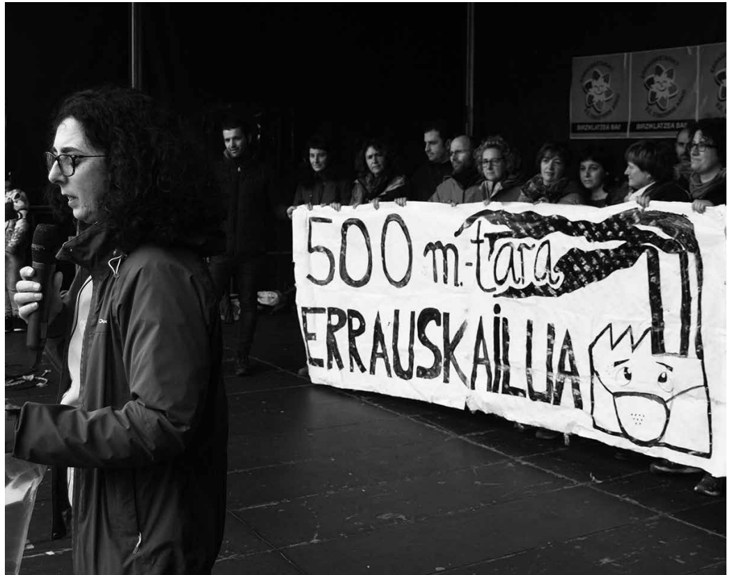
Landaberri Ikastolako kide batzuk oholtzara igo eta euren kezka berri eman zuten mendi martxaren amaieran.

Ikasleok atzean zituzten hezitzaileak, hain zuzen Hezkun-