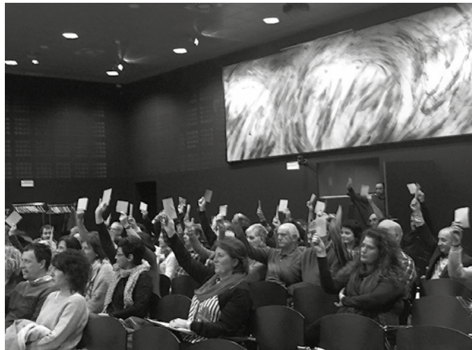
Hitzarturen sustatzaileek ekarpen ekonomikoak egin dituzten guztiak eskertu dituzte.

Hurrengo bi asteotarako erronka berri bat finkatu dute: 35.000 euro eskuratzea.