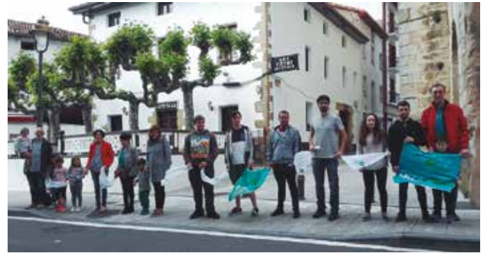
Ekainaren 10ean Usurbil eta Aginagatik igaroko den giza katean parte hartzera animatzen gaitu Usurbilgo Gure Esku Dagok.

Z u ezinbestekoa zara, ez pentsatu besteak egongo direlako zu ez egoteak axola ez duenik. Beharrezkoa zara. Mezu argi honekin ekainaren 10ean Usurbil eta Aginagatik igaroko den giza katean parte hartzera animatzen gaitu Usurbilgo Gure Esku Dagok. Dagoeneko 500 herritarrek eman dute izena, baina gutxienez 1.000 lagun beharko dira.