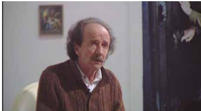
Herritarren batzorde bat sortu zen martxoan, Artze Taldea, eta ordutik ekainaren 16ko ekitaldiarako prestaketak bideratzen ari dira.

Txalapartak giroturiko poema errezitaldi herrikoia antolatu dute Dema plazan, elizako hormaren aurrealdean. Bertan, Joxean Artzeren lanaren aitortza egingo da, poesia eta txalaparta uztartuz. Artze anaien txalaparta jarriko dute bertan. Artzeretikiko sentimenduren bat adierazi nahi duen herritar orok, horretarako aukera izan-