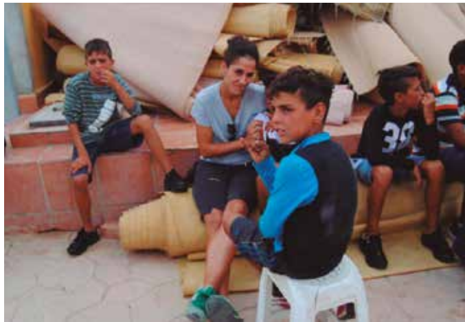
Iazko ramadanen amaieran, Onintze Kamino Landak Ceutan egindako egonaldian ateratako argazkia.

Frantziako mugaren gertutasuna aintzat hartuta, gazte askorentzat egun batzuetako atseden gunea da Uba zen-