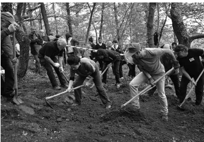
Maiatzaren 18an amaituko da izen-ematea.

Aranzadi Zientzia Elkarteak egin du deialdia. Parte hartu nahi duenak, aranzadi.eus atarian doan izen emateko maiatzaren 18ra arteko epea