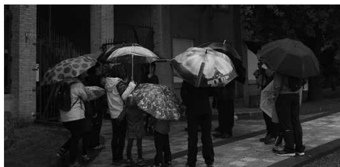
Argazkian, Udarregi baserrira eginiko irteeran parte hartu zuten lagunak.

rri dute hurrengo hitzordua. 19:00etan aurkeztuko dute frontoian, martxoan zehar grabatu zuten 50. urtemugako diskoa. “Bertan, diskoko 10 bat kanta abestuko ditugu”, berri eman dute Ikastolatik. Gogoan izan, Lizardi eta Laurok liburu dendetan, Bordatxo tabernan eta Udarregi Ikastolan eskura dezakezue 6 euroren truke.