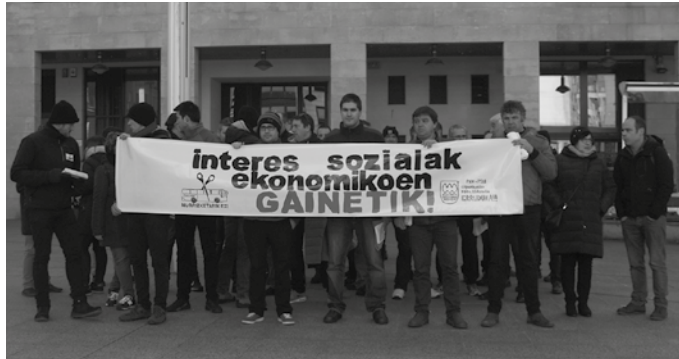
Murrizketarik Ez! Plataformak kalean mobilizatzerara deitu ditu herritarrak.

Honenbestez, autobus zerbitzuen murrizketen aurka Usurbilgo Udalak eta 2.000 usurbildarrek eginiko alegazioei bizkar eman die Aldundiak, ez dituzte erantzun, ezta aintzakotzat hartu ere, halako erabakiak hartu aurretik, herritar, eragile nahiz erakundeekin hitz egin eta adostasunera heltzeko eskaria. Diputazioak hartutako erabakiarekiko desadostasuna agertu du Udalak eta hitza hartzeko aukera ukatu izana salatu dute. “Iruditzen zaigu ezin dela linea hori kendu, batetik, herritarrei eta Udalari aukera eman gabe parte hartze aktiboaren bidez ze beste aukera dauden aztertze. Eta bestetik, iruditzen zaigulako oinarrizko zerbitzuetan irizpide ekonomizista soilak erabiltzea ez dela egokia”, adierazi du Xabier Arregi alkateak.