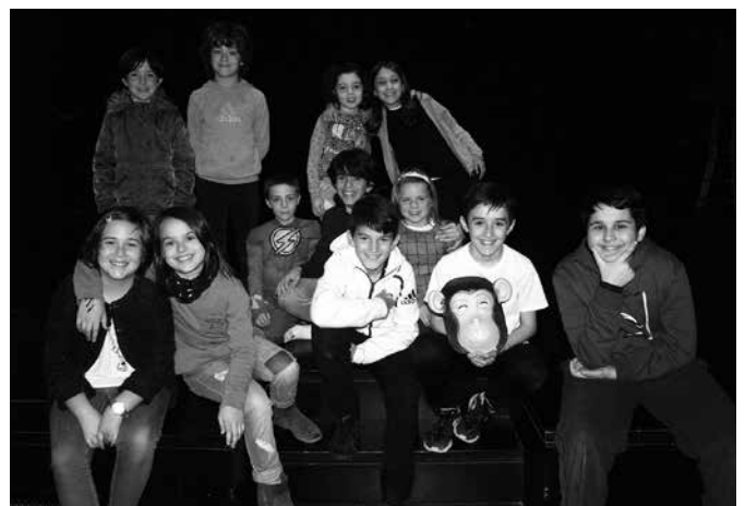
Maiatzaren 26an Sutegin arituko dira.

Ikasturte amaierako emanaldia eskainiko dute antzerki taldeko kideek, maiatzaren 26an larunbatarekin, 12:00etan Sutegin auditio-