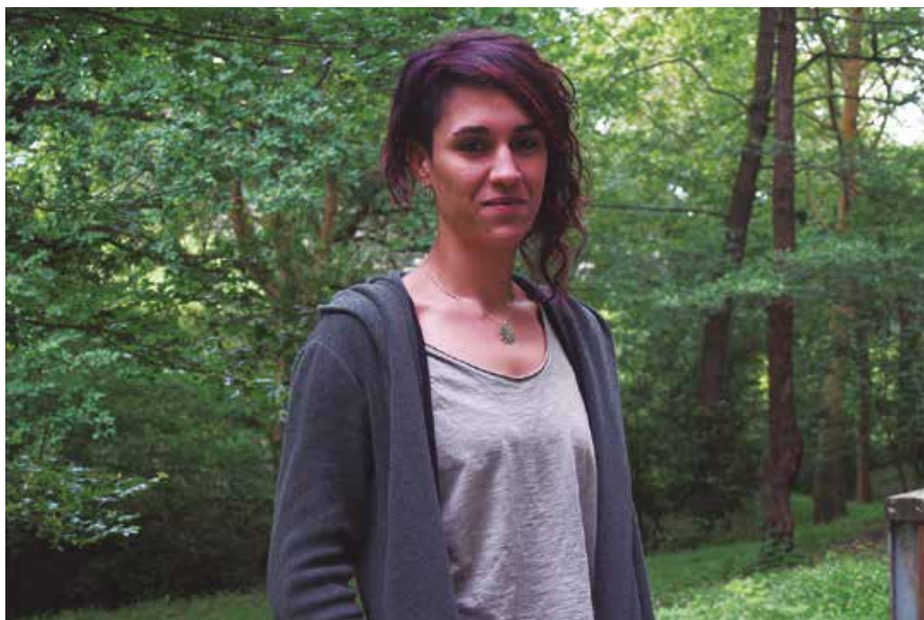
Tabakalerako Hezkuntza sailarekin batera, “hiru eguneko topaketak antolatu ditugu, mimo eta ilusio handiz”.

Migrazio prozesuak erdigunean jarri, gure espazio publiko zein pribatuetan norbere identitatea nola garatzen den aztertu, eta duen garrantzia eman nahi genion problematika honi, gure hiriburuko egoera erreala agerian utziz, eta hau salatuz, bizitza gehiegi baitaude kale egoera oso irregularrean. Besteak beste, iaz Melillara egindako bidaiak ere bultzatu gintuen honetara. Orain arteko bidean, mundu honetan inplikaturik dauden pertsona asko ezagutzeko aukera eman digu bizitzak, eta konturatu gara, han eta hemen, badela giza eskubideen