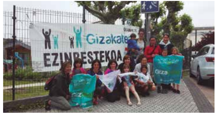
Ekainaren 10ean “energia erakustaldi hori egitera, etorkizunari eskua ematera” gonbidatzen gaitu Gure Esku Dagok.