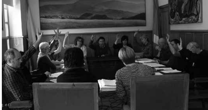
Udalbatzak ahobatez onartu zuen Moyua SL enpresaren eskaintza.

Zumarte Musika Eskolaren birgaitze lanak hasitetik hurbilago gaude maiatzaren 10ean udalbatzak egin zuen ezohiko osoko bilkuraren ostean. Obren kontratazio esleipen deialdira aurkezturiko eskaintza bakarra, Construcciones Moyua SL-k eginikoa izendatu dute eskaintza onena gisa.