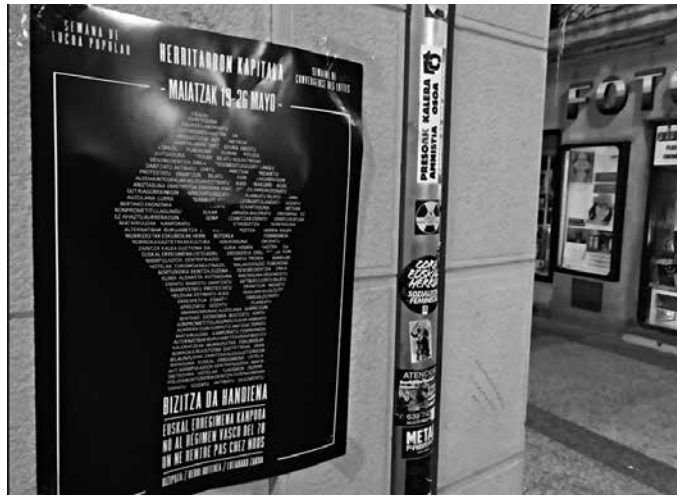
Herri borroka astea iragarri dute maiatzaren 19tik 26ra Donostian.

Mundu mailan nahiz Donostian aurrez izan diren esperientziak erreferentzia gisa baliatu dituzte, ekimen hau antolatzerakoan; desobediencia