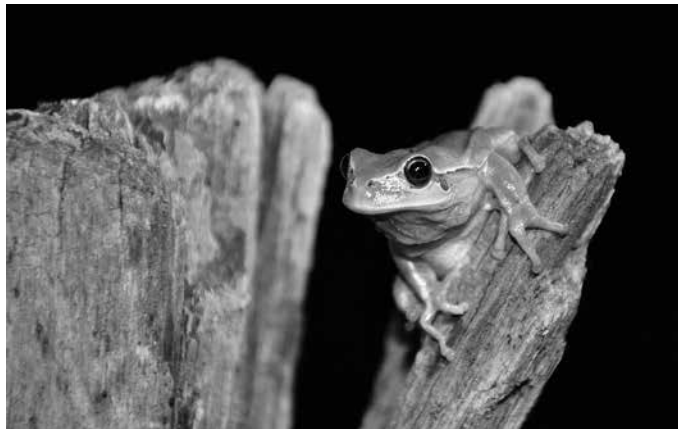
Goizeko 10:00etan abiatuko dira Aginagako frontoitik.

Euskadiko anfibio urriena aurkitzen da bertan, baita Mendizorrotz eta Igara inguruetako zenbait putzuetan ere. Ezagutu eta zaindu beharreko ondare bizia beraz.