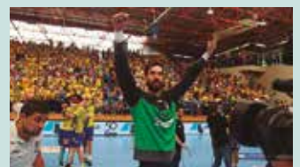
Kirol ibilbidea amaituzat emango du denboraldi hau bukatzean.

Oraingoz lasai nabil baina larunbatean azken partida jokatu du Artalekun. Egun berezia izango da. Eta hurrengo egunean, Sagardo Eguneke irekiera ekitaldian egon behar dut. Baina igandekoa festa giroan joango da eta errazagoa izango da niretzat.