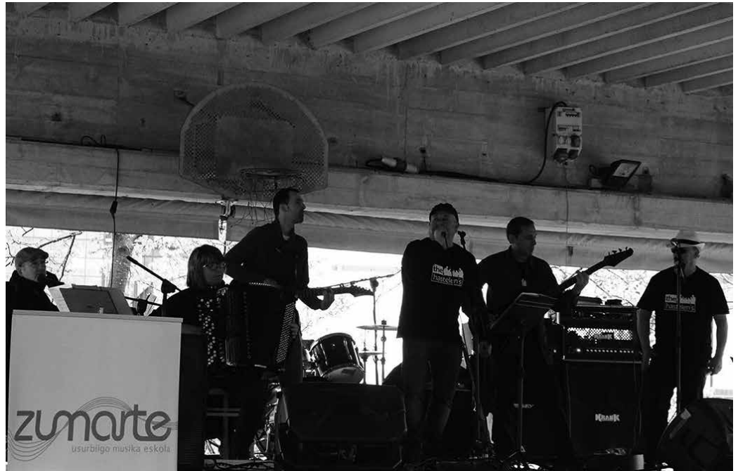
Maiatzaren 21etik 25era osatu beharko da matrikulazioa.

■ Musika txokoa, musika mintzaira, helduentzako musika mintzaira, tronpeta, tronboia, saxofoia, bonbardinoa, biolina, biola, perkusioa, klarineta, eskusoinua, trikitixa, panderoa, pianoa, txistua, gitarra,