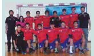
Barcelona, Eivissa eta Elda taldeak izango dira Usurbilen aurkariak.

Iaz aurten jubenil mailan lehiatzen ari diren kadeteak ere sailkatu ziren. Horrek esan nahi du azpitik lan egiten ari dela kluba. Lehen garai batean ez ginen ezta Euskal Ligan, eta orain hortxe gaude. Eginiko lanaren emaitzak pixkanaka badatoz.