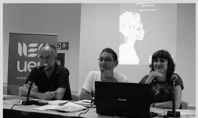
Jakin Jardunaldiaren lehen edizioa iaz egin zen Usurbilen. Aurtengoa ere bertan ospatuko da. Udalak diruz laguntzen du udako ikastaro hau.

Bigarrenez antolatuko da hitzordu hau Usurbilen. Iaz “Euskara, generoa, jatorria eta klasea gurutzatzen ari diren lekua” izan zuten hizpide.