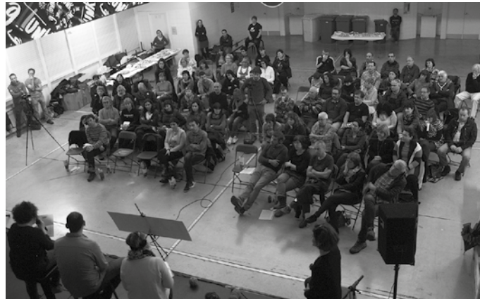
“Hezkuntza komunitatean eztabaida eta hausnarketa” eragin nahi du LABek.

Argi diote LAB Irakaskuntzatik, 30 urteotan hainbat lorpen izan dira, langileen eskubideen alde eta hezkuntza sistema burujabea eraikitze bidean. “Baina ezin esan, guztia egin dagoenik, ezta urrik eman ere, hezkuntzako langileon lan baldintza duinak izan daitezkeen asko dugu egiteko eta zer esanik ez hezkuntza sistema burujabea eraikitze”. Horre-