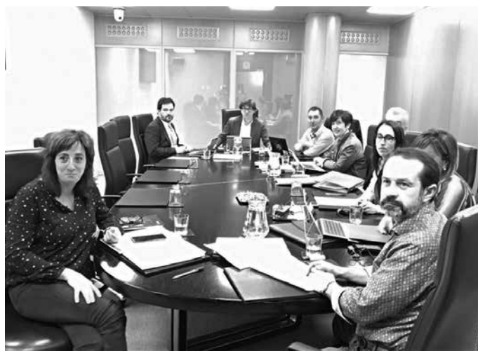
EAE-k Hondakinen Lege propioa lantzea ezinbestekotzat jo zuen alkateak.

Alkatea, “Usurbil 0.0” eredu aurkezten izan zen Gas-teizko parlamentuan. Hainbat eskaera zuzendu zizkien aipatu batzordeko kideei. EAE-k Hondakinen Lege propioa lantzea ezinbestekotzat jotzen du, lurralde arteko hondakinen po-