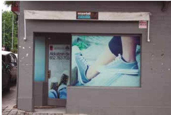
Usurbilen hutsik dauden merkataritza lokalak biziberritzea sustatu nahi du Udalak.