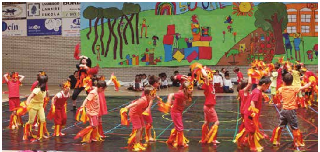
HH zein LH mailetako ikasleek eta Orbeldi Dantza Taldeko kideek girotu zuten aurreko larunbateko jaialdia.