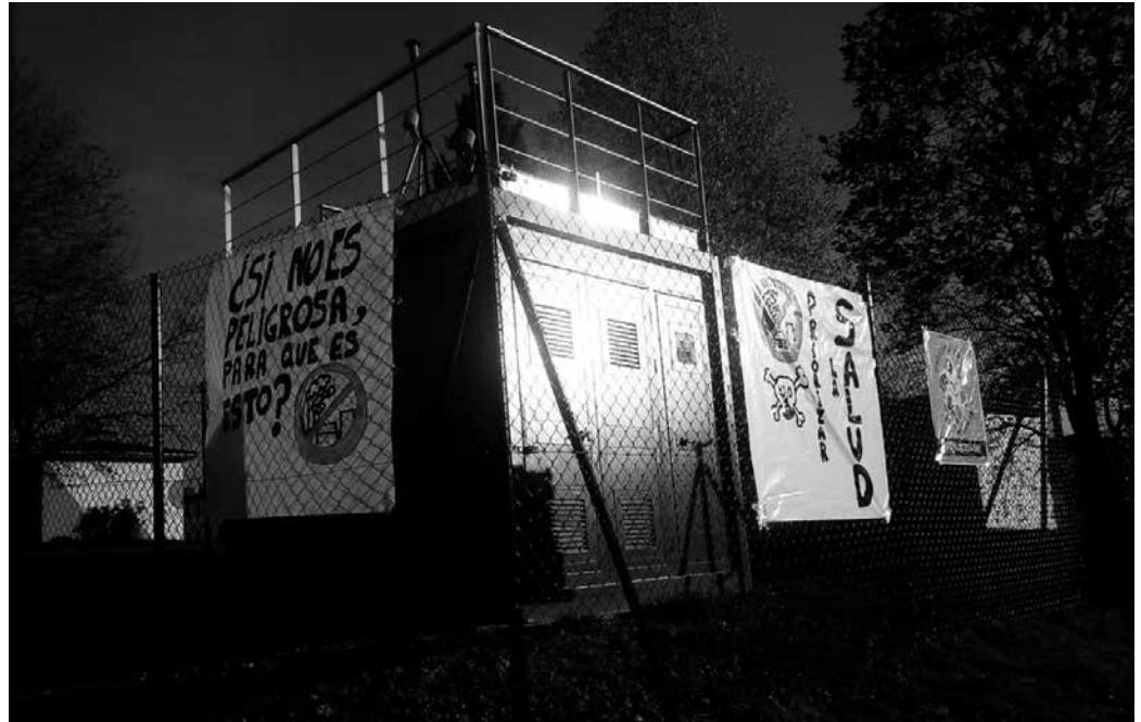
Prensa-ohar bidez aditzera eman dutenez, “Udalak arrazoizko baldintzak eskatu ditu, airearen neurketa taxuzkoa egin dadin gutxien-gutxieneoak. Arduraz eta erantzukizunez jokatu du Udalak”.