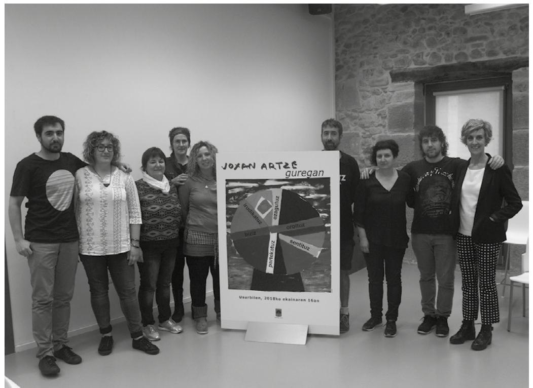
Herri omenaldian, Joxan Artzeren “unibertso aberats eta zabala” arakatuko dute.