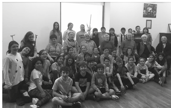
Ziortzakoak Artzabalen, Gure Pakea jubilatuko elkarterekin batera.

Mila esker Gure Pakea elkarteari hain harrera ona egitea-