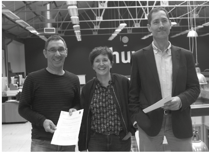
Elhuyarren egoitzan sinatu zuten lankidetzaren hitzarmena.

Elhuyarren normalizazioaren alde eta zientzia zein teknologia gizaratzen segitzeko lankidetzaren hitzarmena sinatu eta luzatu dute bi urterako, Elhuyar Fundazioak eta Usurbilgo Udalak. Elhuyarrek urteko plan bat osatu eta Udalarekin zenbait lankidetzaren bideratuko ditu, “izan itzulpengintzan, aholkularitzan edo bestelako zerbitzuen bidez. Usurbilgo Udalak 10.000 euroko diru-laguntza eskainiko dio”, Udaletik berri eman dutenez.