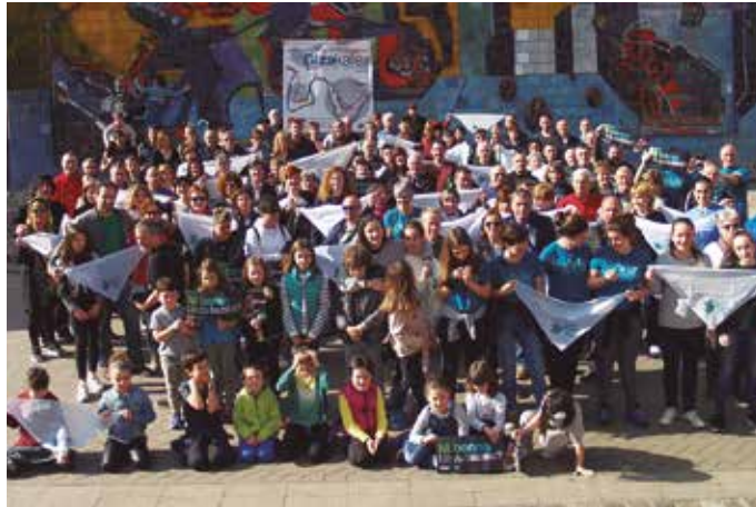
Usurbilen bakarrik, 1.000 lagunek eman dute giza katerako izena.

H ortxe hortxe ziren, herritar batzuen faltan, urte hasieran finkatutako erronka betetzear. 1.000 lagun behar ziren gutxienik, igande honetarako Gure Esku Dago-ren giza katerako. “Asteburuko izen emate masiboaren ondoren, 989 herritar batu gara jada. Gertu ditugu helburutzat jarritako 1.000 izen emateak”, berri eman du sare sozialen bidez, Usurbilgo Gure Esku Dago lan taldeak.