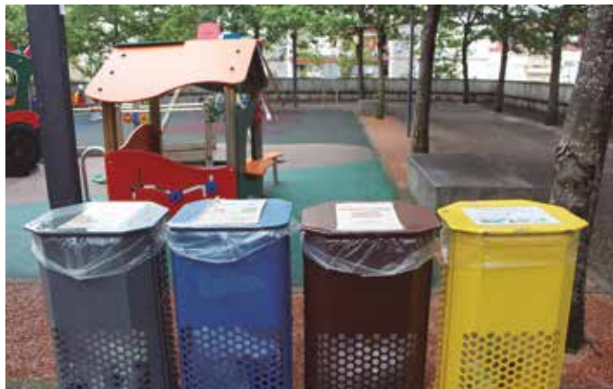
Hobeki toki-erakundeekin elkartearekin bat egin du Usurbilgo Udalak.

Mozioak printzipio batzuk aldarrikatzen dituela, baina errealitateak bestelakorik uzten duela agerian zioten EAJ-tik. Esaterako, elkarte irekia izan nahi duela, baina momentuz elkarte kide gehienak EHBildu agintean duten udaletxeak di-