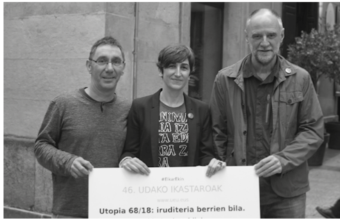
UEU, Jakín eta Usurbilgo Udala- ren elkarlanaren emaitza dira jardunaldiak. 'Utopia 68/18. Iruditeria berrien bila' izenburupean egingo dira uztailean.