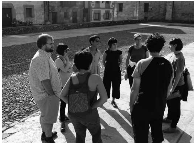
Ekainaren 16an larunbata, Harria hitz bisita gidatua osatzeko aukera izango da. 10:30ean abiatuko dira, frontoitik.

-Joxan Artze irudikatuz, Sute-giko erakustaretoan. “Txoria txori” poema irakurrita, haurrek akuarelaz sortu dituzten marrazkiak ikusgai jarriko dira erakustaretoan.