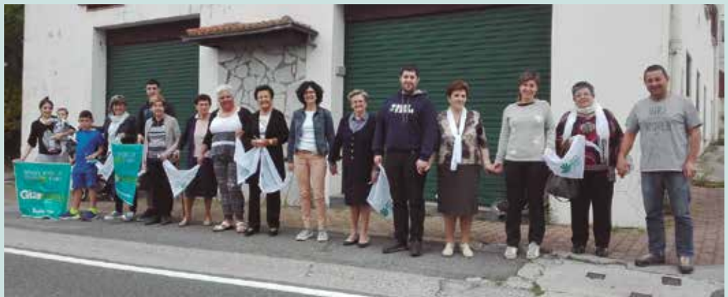
Aginagakoek 15. kilometroa osatu beharko dute.