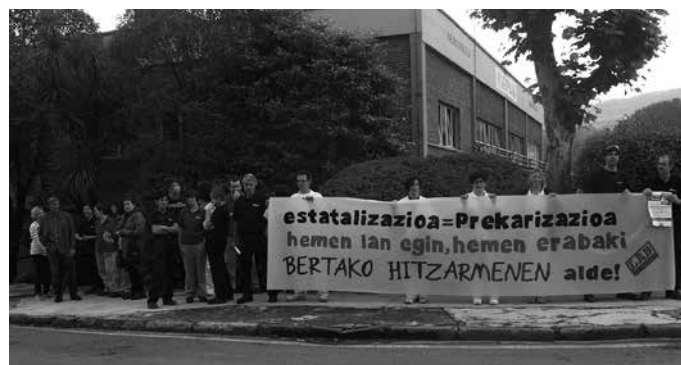
Osinalde industrialdean elkarretaratzea egin zuten maiatzaren 30ean.

zioa. Hemen lan egin, hemen erabaki. Bertako hitzarmenen alde!” aldarriarekin bat eginez, hainbat langileek lan uztea egin zuten. “Hitzarmenen estatalizazioak dakarren lan baldintzen prekarizazioa salatu eta hemen lan egiten badugu, gure lan-baldintzak hemen erabaki behar direla aldarrikatzea izan da mobilizazioen helburua”, adierazi dute LAB sindikatutik.