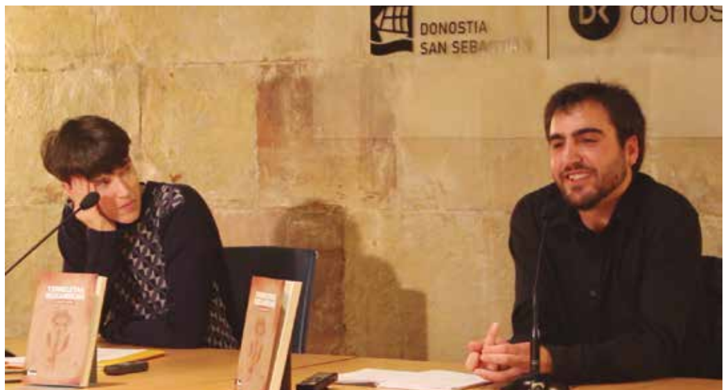
Astearte goizean, Donostiako Udal Liburutegiko sotoan aurkeztu zuen Tximeletak bizkarrean (Susa) izeneko liburua.

Florentziako Unibertsitatean Historia irakaslea da Sara, nobelako protagonista. Istripu txiki baten ondorioz, iraganeko mamu bat ekarriko du gogora. Aitari bisita egitera jaioterrian dela, gaztaroko mamu gehiago azalduko zaizkio. Nobelan zehar iraganaren zama honek protagonistarengan eta haren harremanetan duen eragina ezagutuko dugu.