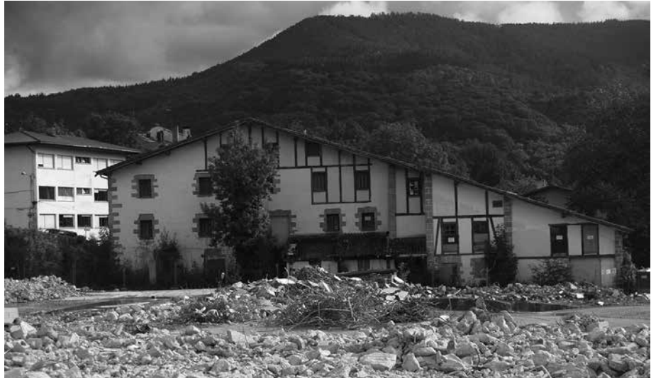
Ugarte baserriaren bueltan, babes ofizialeko 46 etxebizitza eta 46 etxebizitza tasatu eraikitzen hasiko dira laster.

H utsune handi bat sumatuko dute Ugarte baserri ingurura hurbiltzen direnek. Urte luzez, zutik ziren eraikinak eraitsi dituzte. Zutik mantentzen den bakarra, aipatu Ugarte baserria bera da. Eta baita, lehenik, Alkartasuna Kooperatibaren egoitza izan, eta gerora, Usurbilgo Gaztetxearen aterpea izan zen eraikineko hormaren bat. Gainerakoan eremua libre da, laster etxebizitza berriak eraikitzen hasteko. Gogoan izan, Ugarte baserriaren bueltan eraikiko dituztela, urte hasieran Usurbilgo Udalak zozketatu zituen babes ofizialeko 46 etxebizitza eta 46 etxebizitza tasatu. Otsailean hesitu zuten ingurua eta apirilaren erdialdera hasi zituzten eraiste lanak.