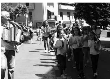
Urte osoan ikasitakoa erakutsiko dute kontzertu eta kalejiren bitartez.

■ 19:00 Zumarte Gazte Abesbatza eta saxo-pianoko taldeen emanaldia Kalezarreko elizan.