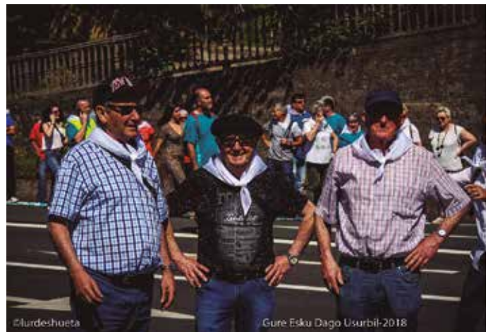
Gure Esku Dago Usurbil-2018