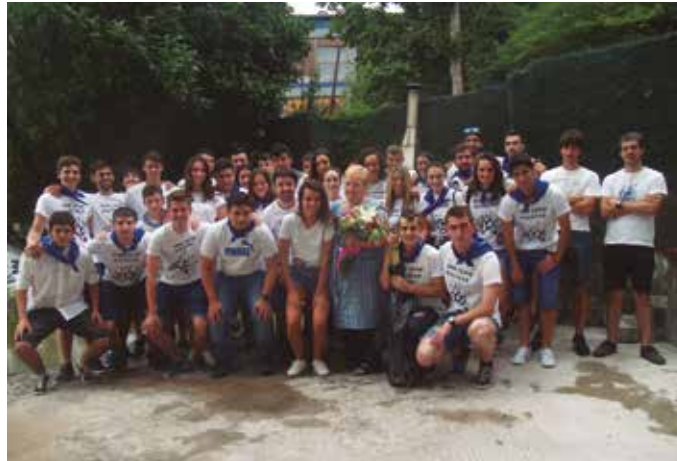
Iaz, auzokideak omenduz abiatu zuten San Juan eskea.