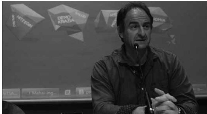
Ekimen juridikoak iragartzeaz gain, herritarren parte-hartzea bermatuko duten neurriak eskatzen jarraituko du GuraSOSek.

Ekimenon gaineko xehetasunak plazaratu zituzten. Segidan aipatzen diren keak Europar Parlamentuko Eskaeretako Batzordera igorri dituzte. Batek, Eurostat-i “defizita eta zortze publikoa kontrolatzeko eta zuzentzeko mekanismoak aktibatzea” eskatu dio GuraSOSek, “salatutako arau-hauste eta iruzurrak direla eta”. Horrekin batera, erakunde berari Espainiako kontu nazionalen komisio teknikoaren 2017ko apirilaren 18ko txostena aztertzea galdegin diote. “Txosten honek, kontratutik eratorritako operazio ekonomikoari kontabilitate nazionalean emandako trataera du aztergai”. Zenbait zuzenketa jasoko dituen txosten berri bat igortzea eskatzen dio GuraSOS-ek. Gogorarazten