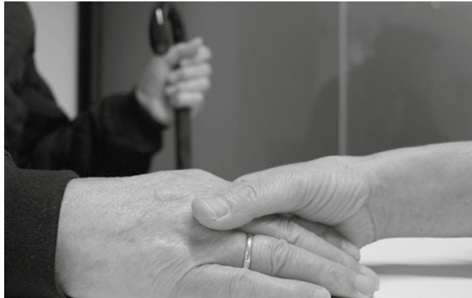
Etxeko etxeko laguntza zerbitzua arautzen duen udal arautegiaren aldaketa aho batez onartu zuen udalbatzak.

Ekainaren 7ko Gipuzkoako Aldizkari Ofizialean argitaratu zituen Udalak 2018ko zerga ordenantza aldatuari eta etxeko laguntzari buruzko iragarriak. Orduetik erabakion aurrean, alegazioak aurkezteko 30 eguneko tartea zabalik dago.