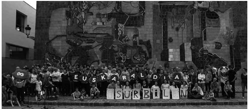
Ostiral arratsaldean agerraldia egin zuten Mikel Laboa plazan.

Hainbat eragileetako ordezkari eta herritar bildu zituen hitzorduak bozgorailu lana egin nahi zuen, lehen urratsa eman, azken asteotan talde edo elkarte ezberdinekin egin duten errondaren ostean. Euskaraldiaren bat egin dutenen artean dira Etumeta AEK euskaltegia, Udarregi Ikastola, Usurbilgo Udala, NOAUA! K.E. edota hainbat herritar. “Zerk batzen gaitu? Euskararen erabilera indartu nahi izateak. Lagun gehiago jarri nahi dugu euskaraz hizketan eta badaki-