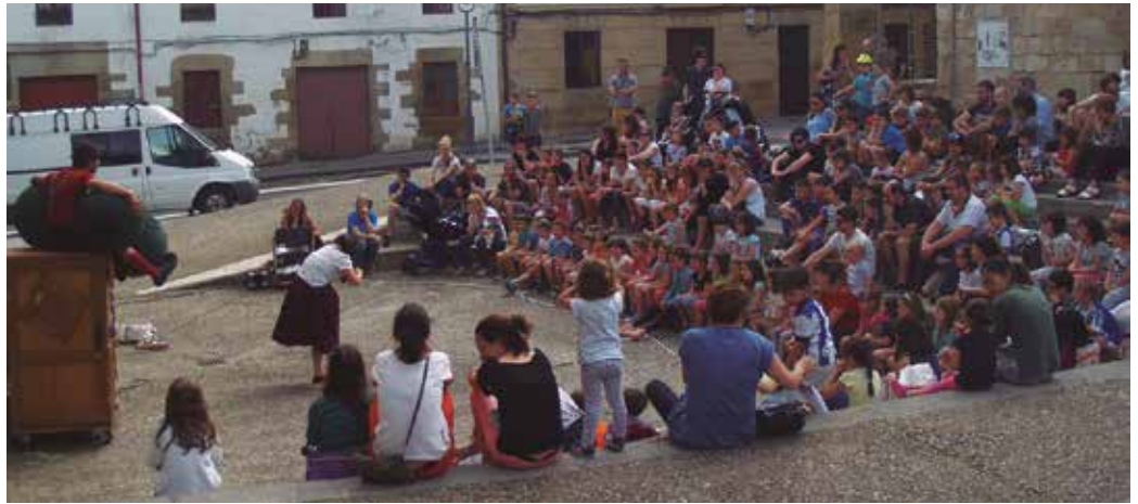
Bapatean Zirko Taldeak "Tenderetea" ikuskizuna eskaini zuen ostiralean Olanonea plazako anfiteatroan.

O hiko kirol jarduera eza-gunak alboratu, eta haien ordez, dantza, antzerkia, edota bestelako trebetasunak jokoan jarri zituzten Udarregi ikastolaren urteurren ospakizunetan. Herrian zehar antolatu zituzten jolas guneetan barrena zirkuitu modukoa osatu zuten hiru talde handitan banatuta. 50. urtemugako festaren azken asteburua izanik, mende erdi horri keinu bat baino gehiago egin zitzaion aurreko larunbateko ekitaldietan.