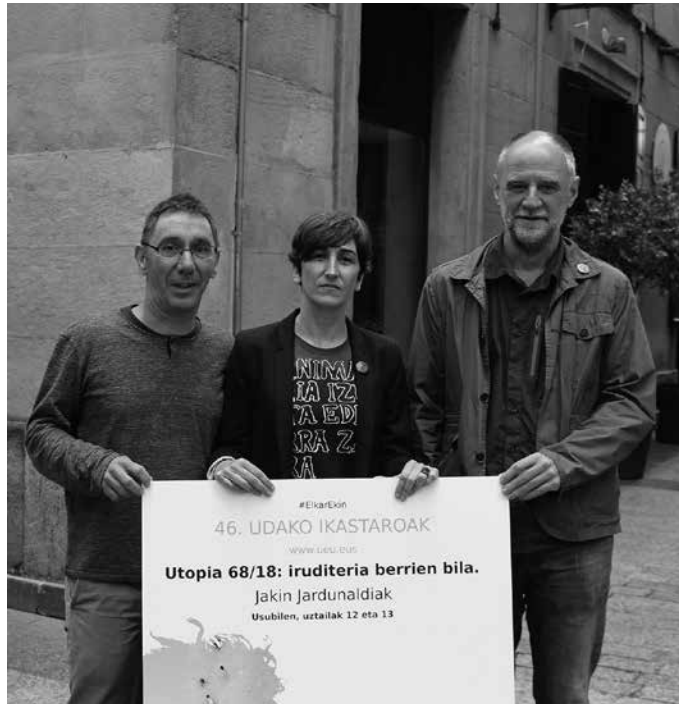
Jakin Jardunaldiak aurkeztu zituzten aurreko astean. Usurbilen egingo da Udako Ikastaroa, uztailaren 12an eta 13an. Izen ematea zabalik da.

UEUren, Usurbilgo Udalaren eta Jakinen elkarlanaren emaitza dira Jakin Jardunaldiak. “Iaz