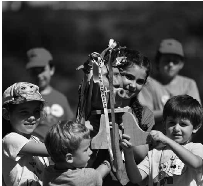
Aurreko asteburuan, Oikian egin zen ospakizunean jaso zuten lekukoa.

Ekainaren 10ean iragarri zuten urtebete barruko hitzordua. Eskolatik bertatik helarazi dituguten irudian ikus dezakezuen moduan, lekuko hartzearekin irudikatu zuten Aginaga izan-go dela 2019an, Eskola Txikien festaren topagunea.