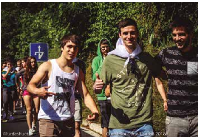
Gure Esku Dago Usurbil-2018