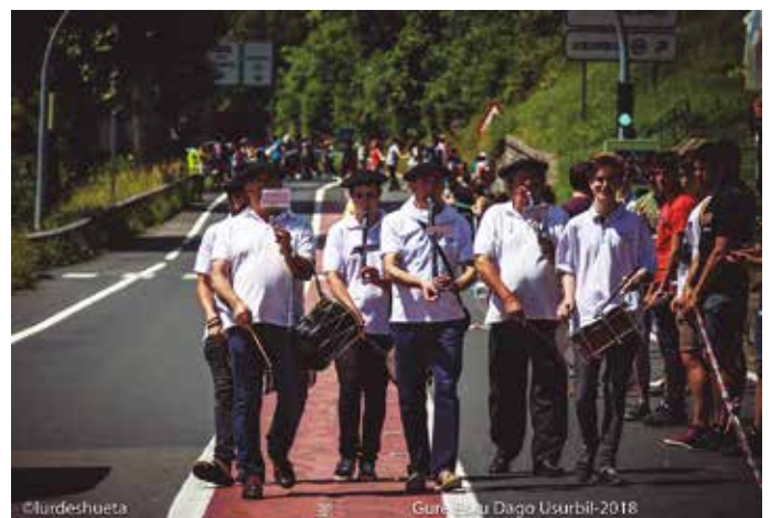
Gure Esku Dago Usurbil-2018