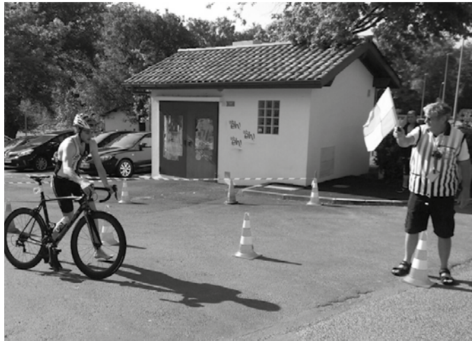
Senpereko triatloi lasterketa irabazi zuen maiatza hasieran.