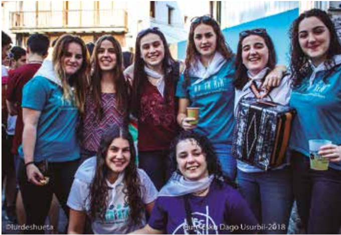
Gure Esku Dago Usurbil-2018