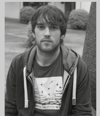
"Ekainaren 24an Onditx Donostiako Triatloi Olinpikoan arituko naiz".

U. S. Mundu honetan dabilenak distantzia horietan aritzeko joera izaten du. Noizbait akaso iritsiko gara horrelako bat egitera baina orainxe bertan erokeria iruditzen zait. Ez dakit osasunarentzat ona ote den. Bestetik, ikasketak eta lan kontuak tarteko, denbora mugatua dugu eta hori prestatzeko denbora behar da.