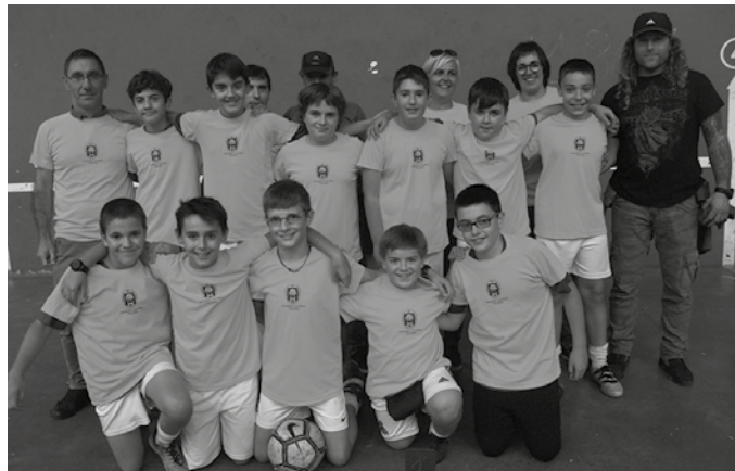
Oiardo Kiroldegian eman behar da izena. Epea: ekainak 18. Txapelketa irailetik urrira ospatuko da.

2017-18 kirol urtea ospakizun egun baten bueltan borobilduko dute urtero legez, herriko kirol taldeek. Ekainaren 23an izango da. Usurbil