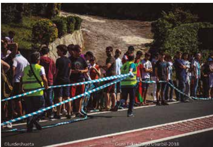
Gure Esku Dago Usurbil-2018