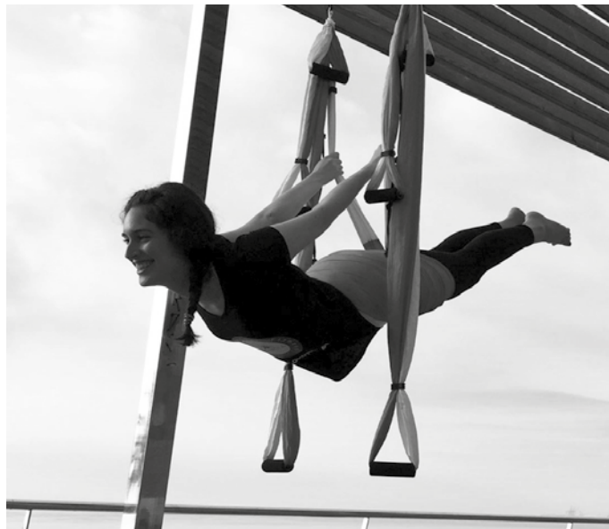
Ikasturtea eskaintza berri batekin abiatuko da. Irailetik aurrera, aeroyoga ikasteko aukera egongo da.

Yoga tradizionalan oinarritutako metodoa da, baina hone-tan kulunka baliatzen da. Urte