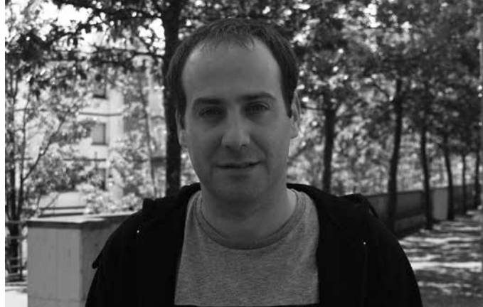
“Beka abian den artean Beterri-Buruntza Ekinean zerbitzuen tutoretza eta aholkularitza zerbitzura joaten naiz”.