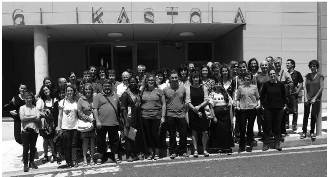
Iazko ikastaroko familia argazkia, Udarregi ikastolaren atarian egina.