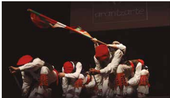
Igorreko folklore jaialdian parte hartuko duten taldeak Usurbilen arituko dira igandean.

Atzerriko dantzariak bisitan igande honetan (uztailak 15) Usurbilen. Orbeldi D.T.-k antolatuta, Kolonbiako Creadanza Taldea, Poloniako Kostrazane taldea, eta Igorreko (Bizkaia) Arantzarte Dantza Taldea bilduko ditu hitzordua. Europako aipatu bi dantza taldeek Igorrekoak urtero antolaturiko folklore jaialdian parte hartuko dute. Aukera baliatu dute, igande honetan, guztiek Usurbilen erakustaldia eskaintzeko. Kalez kale ibiliko dira lehenik, eta saioa eskainiko dute gero: