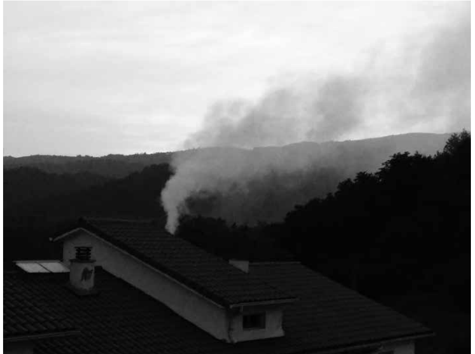
Argazkia pasa den igandekoa da eta Atxegaldetik egina dago.

Herritar honena ez da kexu isolatu bat. Iazko urrian, Anerreka Ingurumen Elkar-tea osatu zen Usurbilen: "herriko lurra, aire eta uraren kalitatearen alde lan egiteko, eta ondorioz, guztion osasunaren alde". Hein handi batean, Ucin eta Ucin-en moduko kasuak izan dira Anerrekaren kezka iturri nagusiak. Maiatzean, herri batzar bat deitu zuten eta besteak beste bi gai hauek landu zituzten: uraren kalitatea (Harane erreka) eta aire eta lurraren kalitatea (Luzuriaga eta Ucin).