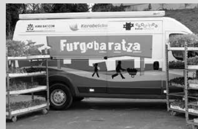
Arratsalde egongo da Agerreazpiko parkean.

ekogunea.eus baratzeeparkea.ekogunea.eus