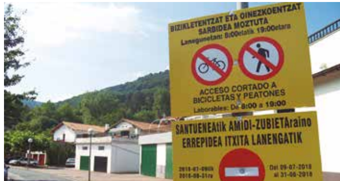
Amiri-Santuenea arteko bidea itxita egongo da abuztuaren 31ra arte.

Udaletik ohar bidez gogorazi duten moduan, urtebeteko atzerapenarekin hasi dituzte Usurbilgo lurretan, errauste-