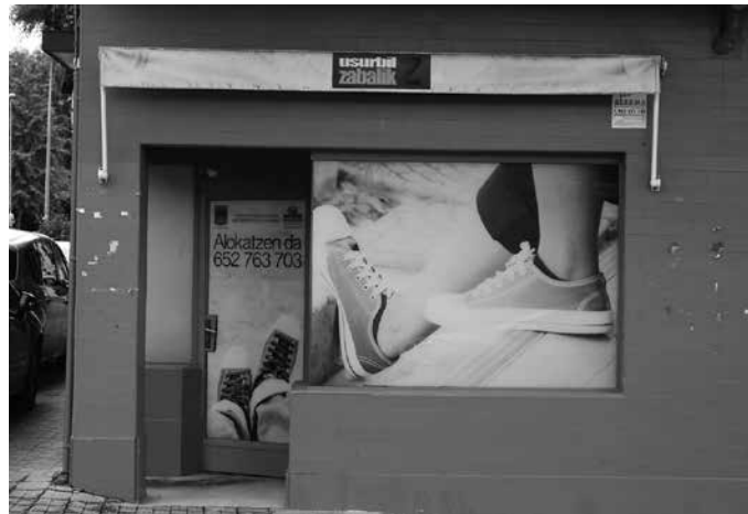
Lokal hutsak erabiltzeko hautua egiten duten ekintzaileentzat, alokairu gastuei aurre egiteko diru-laguntza deialdia egin du Udalak.

■ Lehenetsuna izango dute: herritarrei eskaintzen ez zaizkien zerbitzuekin lotutako proiektuek, baita ixtera doazen edo itxi berriak diren jardueren jarraipenekoak diren proiektuek ere. ■ Ekintzaile eta enpresa proiektuaren betebeharrak: lokalik jabetzan ez izatea, hutsik dagoen Usurbilgo merkataritza lokal bat alokairuan hartzea,