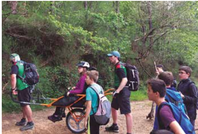
Ikasturtea amaitu baino lehen, Andatzara mendi irteera egin zuten Udarregi Ikastolako LH 6. mailako ikasleek, Kemen elkarteak kideekin batera.