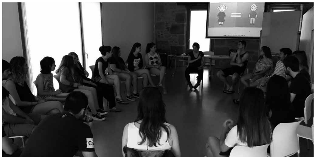
Udalak antolatutako ikastaroan begiraleen rol, lan eta ardurez hausnartu eta lanketa egin zuten.

Haien jardunaz, feminismoan pil-pilean diren gaieez, begiraleen rol, lan eta ardurez hausnartu eta lanketa egin zuten.