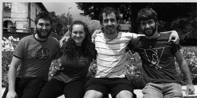
Usurbil, Lasarte, Zubietako eta Aginagako txokoek bat egingo dute ostegunean.

Astetartean, goizez herria, kalean gora eta behera jolasean dabiltzan haur eta gaztetxoek betetzen bazaigu, adi ostegun honi. Are gehiago izango dira, Usurbilgo Udajolasek, Lasarteko, Zubietako eta Aginagako txokoek antolatu duten topaketari esker. Estreinakoz antolatu dute ekimena, bereziki harremanen esparruan eragiteko. “Iaz Oriara irteera egin genuen. Hango udalekuetakoak ondoan izan genituen, baina ez ginen gai izan halako harreman bat egiteko”. Hortxe hasi ziren, uztailearen 19rako iragarri duten ekimenean pentsatzen. Aurten auzoen gaia lantzeko asmoa zutela baliatuta, aisialdi