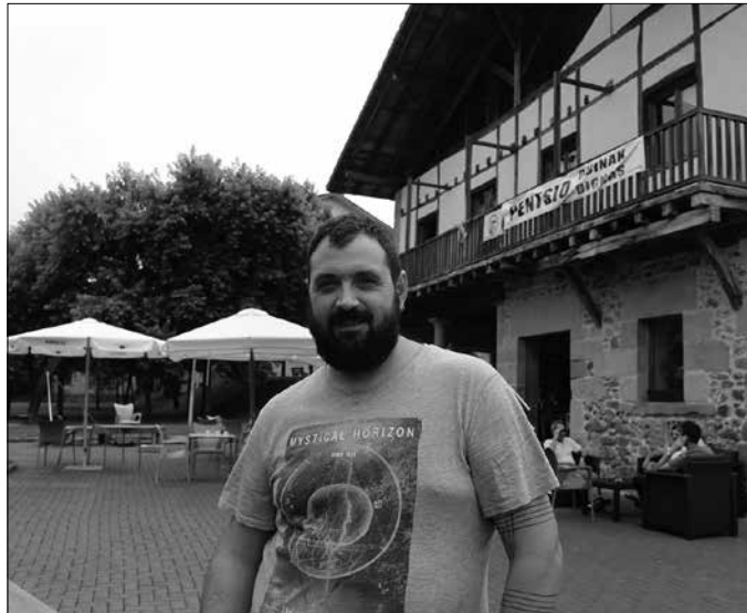
“Imaginazioa landuz, jendea mugitzeko ahalegina egiten ari gara”.

K risia igaro den ideia sustaitzen hasi da. Saltokietan eta ostalaritzan kontsumoak gora egin duela esaten da. Bestelako seinaleak ere badira. Saltoki handiek euren azalera handitzeko eskaerari erantzun nahian edo, Lasarte-Oriako denda batzuetan txartel beltzak ipini dituzte erakuslehoetan. Merkataritza txikia arriskuan dela ohartaraziz. Merkataritza-sektorearen inguruko argibide gehiago batu asmoz, hiru solaskiderengana jo dugu. Nork bere talaia-tik gauzak nola ikusten dituen azaldu diezagun.