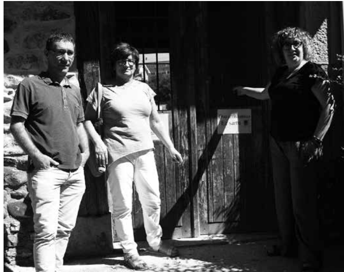
Egin beharreko txukuntze lanen ondoren, tokiari arnasa eman nahi dio Udalak, etorkizunean espazio horrek zer izan behar duen erabaki aurretik.

A kabo, herri erdigunean izan dugun hilerrri zaharrak berea egin du. Osasun Sailak ofizialki itxi du. Oraindik hormak zutik diren arren, barruko eremua hutsik dago jada, Udaletik gogorazati duten moduan, "hilerrri izatera" galdu du. Orain, lur eremu honek "onespen guztiak ditu beste zerbait izateko" zioten udal gobernu taldetik azken osoko bilkuran. Egin beharreko txukuntze lanen ostean, tokiari arnasa eman nahi dio Udalak, etorkizunean espazio horrek zer izan behar duen erabaki aurretik.