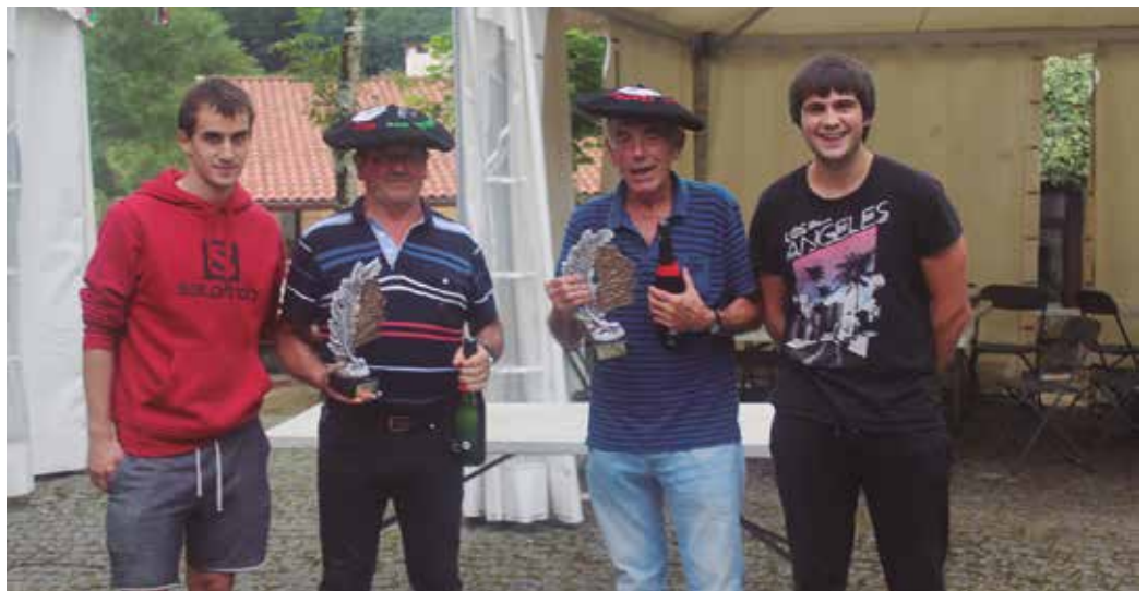
Mus txapelketa abuztuaren 4an jokatuko da. Izen-ematea 15:30ean irekiko da eta partidak 16:00etan hasiko dira. Irudian, iazko irabazleak.