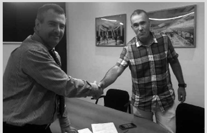
Senior mailako nesken taldeak Urbilen babesa izango du denboraldi berrian.

Kolaborazio hau ez da berria, baina aurrean nesken eskubaloia sustatzeko aurrepauso bat eman nahi izan du Urbilek, “senior mailako egitasmo berriari gure laguntza eskainiz. Klub barruan hainbesteko ilusioa piztu duen egitasmoa. Kirol jarduerari argia emateaz gain, Urbilek eta klubak dituzten balio komunei ikusgarritasuna eman nahi diegu: ahaleginari, talde-lanari eta influentzia-eremuarekiko konpromisoari”.