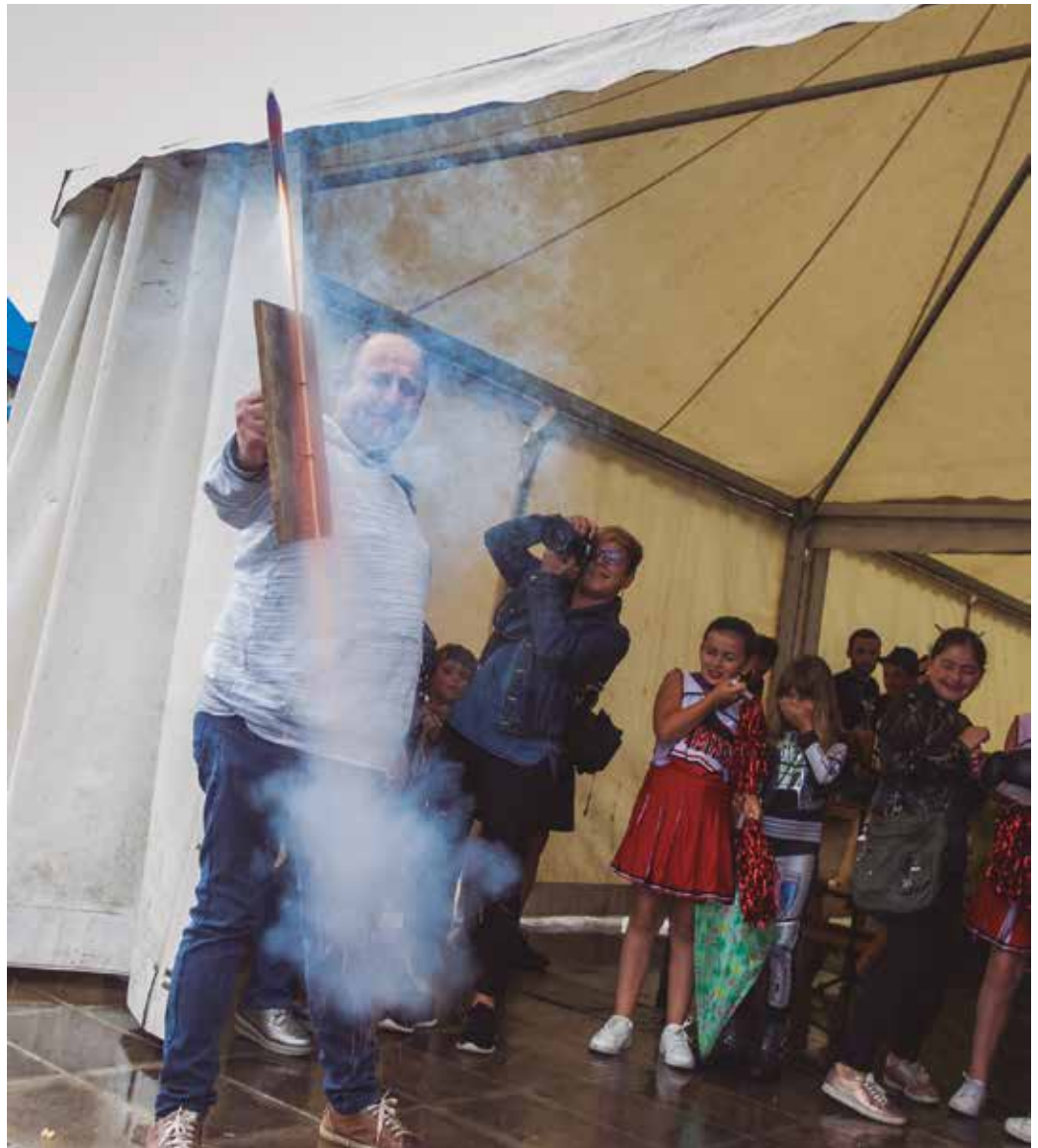
Jaien hasierako suziria uztailearen 25ean piztuko dute, goizeko 11:30ean.