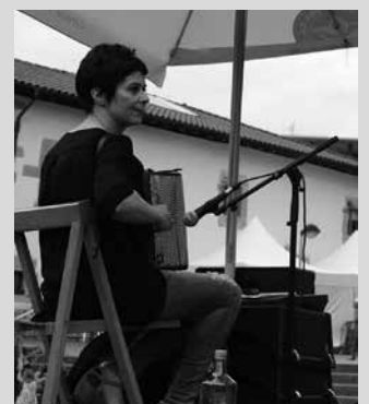
Elustondo anai arrebak Artzabalgo plazan aritu ziren festetan.

batera hori antolatzeko aukera izan genuen. Beste hiru erromeria egingo dira festetatik aparte. Datak lotzen gabiltza orain. Ulertzen dut herri mailako ekitaldiak kaxkoan egitea baina Artzabal bi minutura dago eta gauza batzuk egiten dira. Auzoa indartzeko ere egokia da. Gainera baliabide onak ditugu hemen, frontoia, belazea... Plaza ona dago hemen.