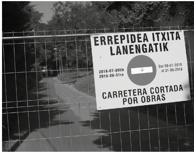
Amiri-Santuenea bidea itxita egongo da gutxienez abuztuaren 31ra arte.

Lanen ondorioz, Amiri-Santuenea arteko bidea itxita egongo da gutxienez abuztuaren 31ra arte. Bidea itxita egongo da guztiz, lan orduetan, astelehenetik ostirale-ra 8:00-19:00 artean, eta agian abuztuko zenbait larunbatetan, 8:00-14:00 artean. Lan orduetatik kanpo, oinezko eta bizikleta erabiltzaileentzat zabalik izango da, baita ezinbestean pasabide hau ibilgailu motorduneari igaro behar duten inguruko bizilagunentzat. Gogoan izan bestalde, lanon ondorioz, Usurbil eta Hernani arteko T6 bus zerbitzua Zubietatik desbideratu dutela. Handik joan etorriak egiteko, behin behineko bus zerbitzua ezarri dute Amiritik Lasarteko Euskotrenen geltoki pareko errotonda ondoraino.