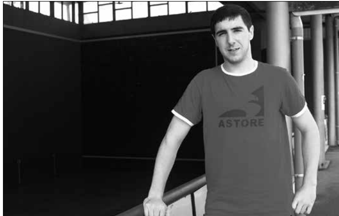
“Nik urtebete edo bi nituenean amaitu zituzten frontoi honetako lanak. Nik hala ezagutu dut Aginaga”.