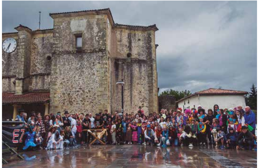
Otordu ezberdinak antolatu dituzte eta txartelak aldeaz aurretik erosi behar dira.

■ Barazar jatetxean ospatuko den bazkarirako izena uztailaren 21a baino lehen eman, 634 879 207 (Arantzazu) telefono zenbakira deituta.