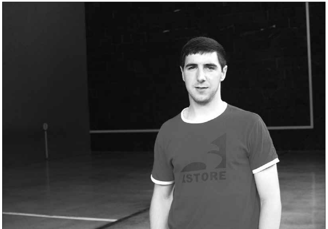
Debutean, "aginagar asko joan ziren animatzera, Usurbilgoak ere bai, koadrilako eta lagunak. Denei eskerrak eman nahi dizkiet".