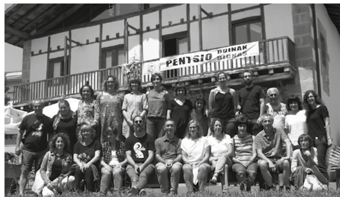
Usurbilgo sagardoarekin topa eginez amaitu ziren Jakin Jardunaldiak.

U surbilgo sagardoarekin topa eginez amaitu zizuten uztailaren 13an, bi eguneko ‘Utopia 68/18 iruditeria berrien bila’, UEU-k, Jakin-ek eta Usurbilgo Udalak antolaturiko jardunaldiak. Bederatzi aritu eta aditu aritu ziren utopia klasiko eta berriez, zaintzaren utopiaz edota utopia sozio-ekologikoz hausnartzen Artzabalén, bi eguneko ospatutako saioetan.