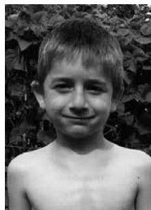
Zorionak Ekhi! Ilgandean 8 urte beteko dituzu. Merendola eder batekin ospatuko dugu! Muxu handi bat!