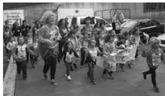
Korrikako iragarkiaren grabaziorako protagonista eta “estra” bila dabilta.

Nagusia, 43 607 609 379 usurbil@aek.eus aek.eus muntteri.blogspot.com.es