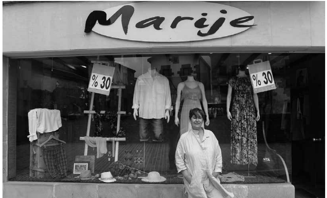
Marije dendan, bezeroak etxera eraman dezake arropa, probatzera. “Aukera gehiago nork eskaintzen dizkizu?”.

Moda denda zaretan aldetik, konpetentzia handiago al da