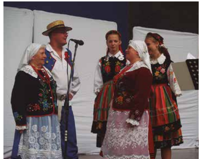
Ezkerretara, Kolonbiako Creadanza taldea. Eskubitara, Poloniako Kostrzanie dantza taldeko kide batzuk.