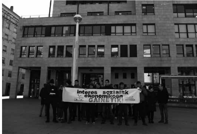
Aurreikusiak dauden murrizketen aurka agertu izan da Udala, baita herritarrak edota autobusetako langileak ere.

Guztira, 18 linea erregular, iraunkor eta orokorrez (14 egunez, 4 gauetarako) osaturiko kontzesioa izango omen da. Erabiltzaileen eskaera handiagoa antzeman duten ibilbide eta ordutegietan zerbitzua indartzeko apustua egin du Foru