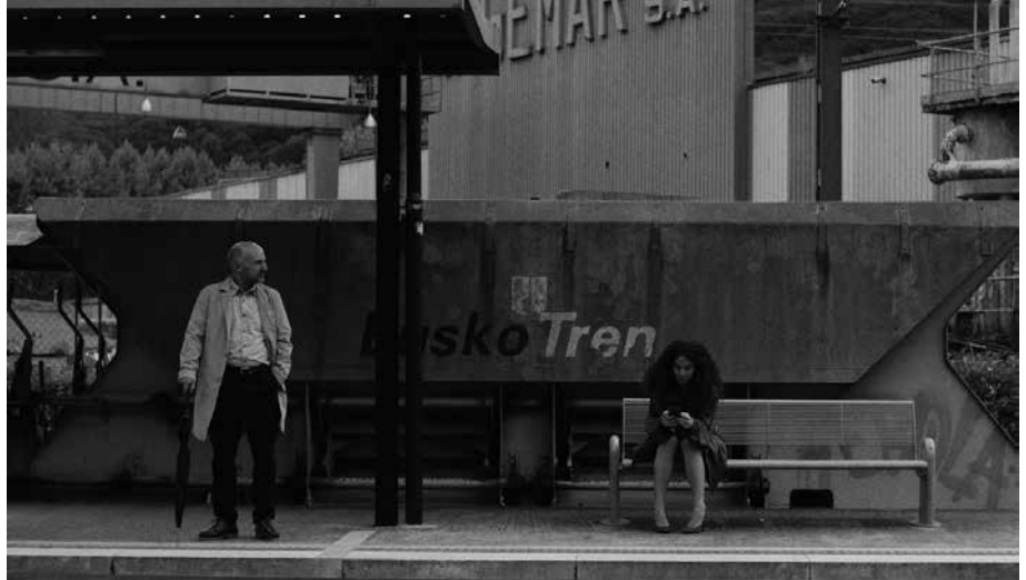
Zinemaldian eskaintzeaz gain, “Oreina” irailaren 28an iritsiko da zinema aretoetara.

Txintxua Films-ek ekoizti du “Oreina”. Baita aurten estreinatzeko duden “Dantza” ere. Euskal dantza tradizionalak