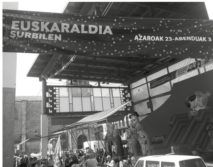
Jaietan ipini zuten kartelak zioen bezala, azaroaren 23tik abenduaren 3ra ospatuko da Euskaraldia. Izen-ematea irailaren 20an zabalduko da.

Herritarrentzako izen ematea irailaren 20an zabalduko da. “Ahobizi” edo “Belarriprest”