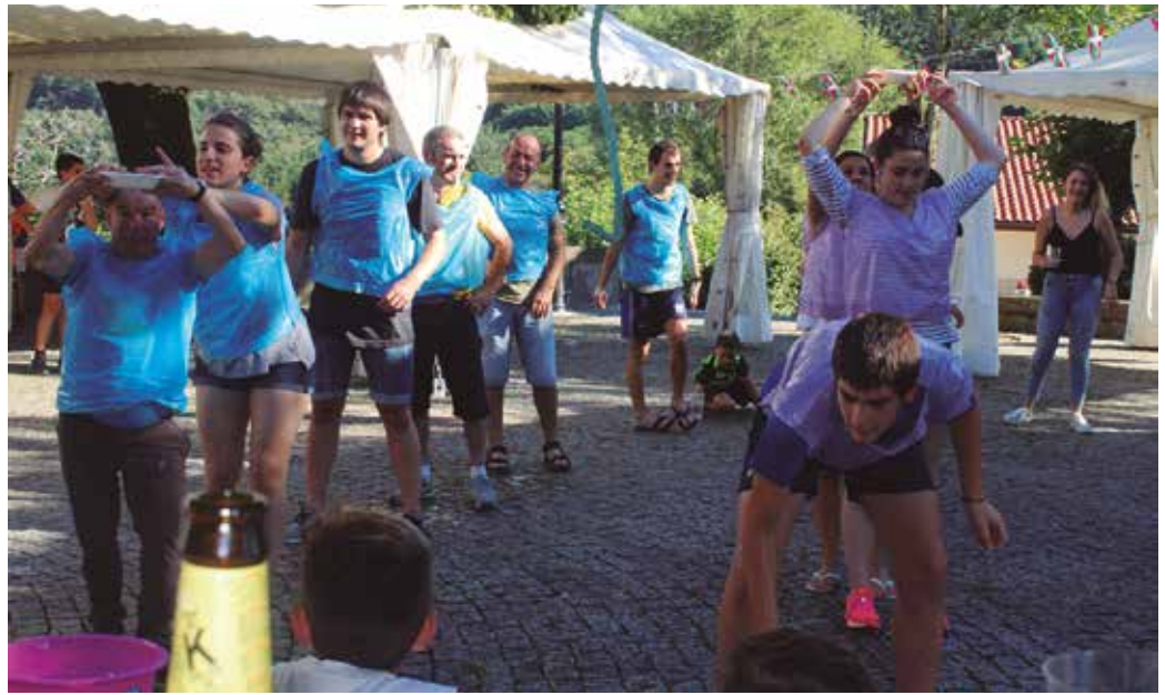
Helduen arteko jolasak abuztuaren 3an egingo dira, arratsaldeko 17:00etan hasita.