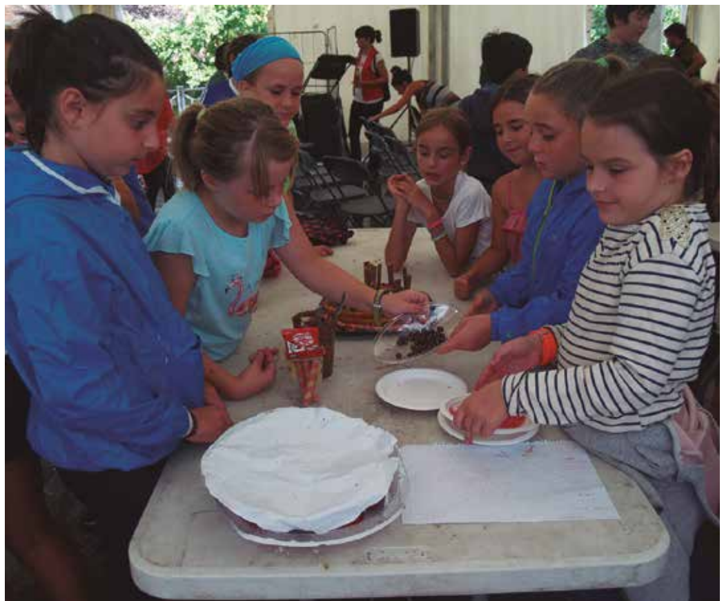
Martertxeff Txiki sukaldari lehiaketa jaien azken egunean egingo da, abuztuaren 26an igandea.