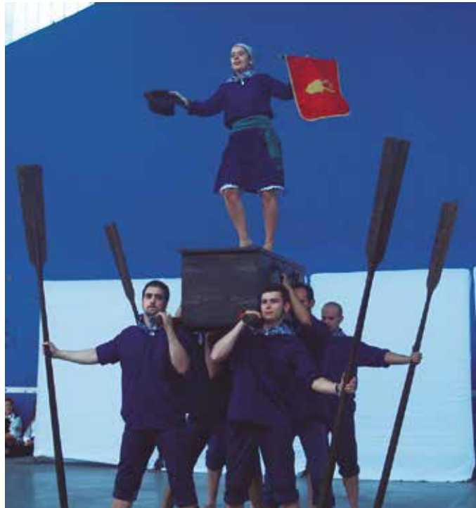
Argazkian, Igorreko (Bizkaia) Arantzarte Dantza Taldekoak.

Munduko dantzen erakusleioan bilakatu zen Usurbil joan den uztailearen 15ean. Kalejira eta erakustaldi koloretsu eta txalotua ospatu zen eguerdian frontoian. Kolonbiako Creadanza, Poloniako Kostrzanie eta Igorreko (Bizkaia) Arantzarte Dantza Taldeak bildu zituen hitzorduak. Norberak, bere sorterriko dantzak plazaratu zituen. Munduko dantza, kultura eta herri ezberdinak hobekia- go ezagutzeko aukera aparta izan zen. Euskal Herriko txoko ezberdinak zeharkatzen aritu diren topaketen baitan antolatu zuten Usurbilgo hitzordua, bisitan izan ditugun Igorreko Arantzarte Taldeak eta Usurbilgo Orbeldi D.T.-k, Usurbilgo Udalaren laguntzaz.