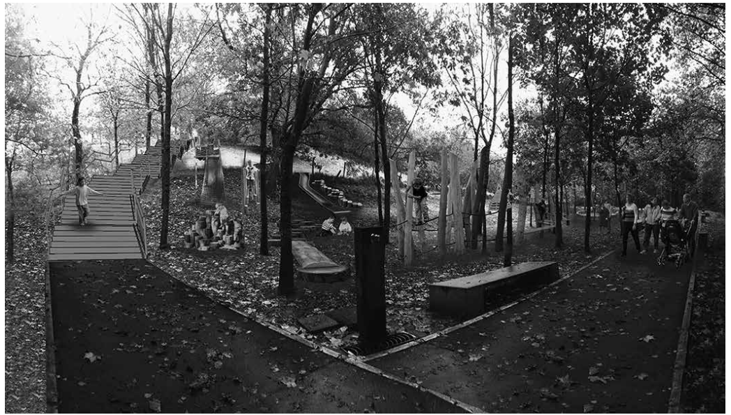
“Ingurua kontuan hartuta eta integrazioa zainduz egokituko da parkea”.

Lanekin batera, Aranerreka-uren uraren kalitatea aztertu