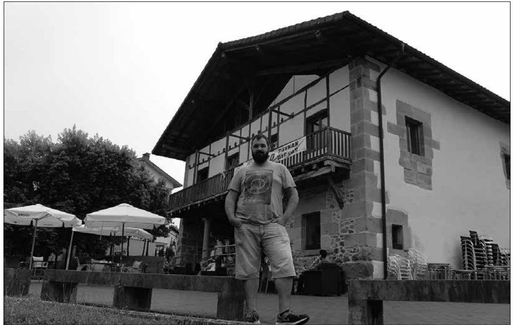
Egoeraren aurrean, “herrian bada zerbait egiteko asmoa. Saltokiak plastiko beltzekin estaltzeko ideia planteatu da”.

Konpetentziak baino gehiago arduratzen nau herri mailan gertatuko denak. Eragina izango duela, zalantzarik ez dut. Urbil ireki zenetik herrian denda gutxiago daude. Niretzat Oiartzun da adibide garbia. Oiartzunek merkataritza-gune asko ditu inguruan eta herria hilda dago, denda gutxi dago. Inguruan ditu Alcampo, Carrefour, orain Lidl bat ireki behar dute... Askotan Orio edo antzeko herriekin alderatu da gure herria. Baina Usurbil ezin da herri askorekin konparatu, Usurbilgo biztanleen erdia auzoetan bizi baita. Eta auzoetako horiek kotxea hartzen dute, bai ala bai. Eta erosketak Usurbilen egingo dituzte edo beste merkataritza-gune batean. Beraz, Usurbil