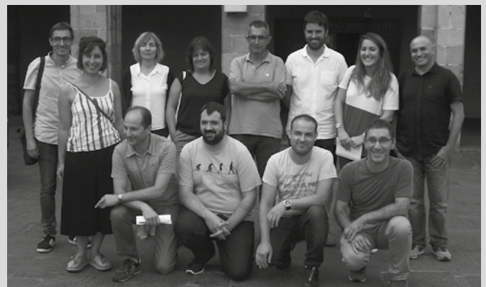
Eskualdeko merkatariek elkarteek eta udal ordezkariak agerraldia eskaini zuten Andoainean.

“Guztiok interpelatzen gaituen kanpaina da”, egitasmoa aurkezteko eskualdeko merkatariek elkarte eta udal ordezkariak Andoainean egin zuten agerraldian ziotenez. Zer hausnartua eman nahi duena. Batetik komertzioei beraiei, nabarmentzekoa baita kanpaina honen sustatzaileen esanetan, herri baten garapen sozioekonomiko eta kulturean duten ardura. Herritarrok ere kontzientzatu nahi gaituzte, jabetu gaituzten zer gertatuko litzatekeen baldin eta tokiko merkataritza desagertuko balitz. Zer eta zenbat dugun jokoan. Eta honenbestez, gure kontsumo ohiturek duten garrantziaz kontzientziaz nahi gaituzte “herri gune biziek eta ez hilek zer nolako garrantzia duten pentsaraz-