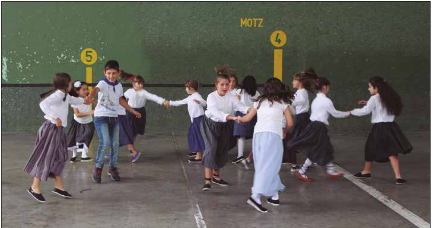
Urriaren 7an igandearekin, herriko dantzari txikien erakustaldia.