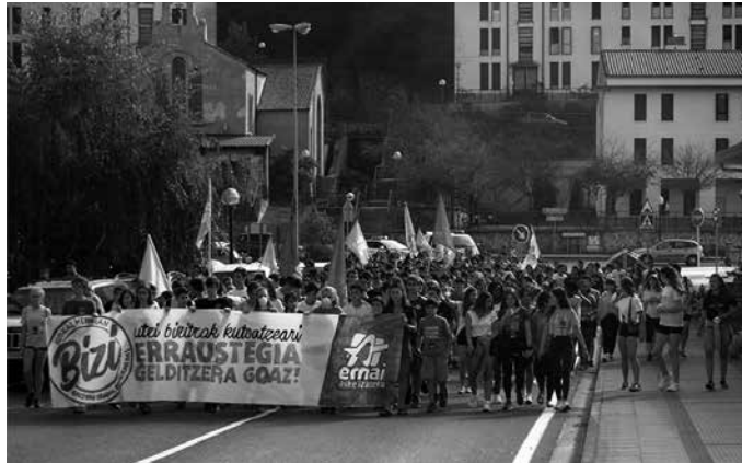
Irailaren 20ean, manifestazioa egin zuten Lasarte-Orian barrena.

E rraustegiak sustatzen dituzten enpresa eta eragileek irailaren 20an eta 21ean Bilbon egin zuten kongresuaren aurka mobilizatzerara irten ziren herritarrek. Guggenheim museo atariraino eramán zuten errausketaren aurkako aldarria. Eta gertuago, Ernaik Usurbil nahiz eskualdeko ehunka gazte bildu zituen irailaren 20an, goizez, Lasarte-Orian barrena egin zuten manifestazioan.