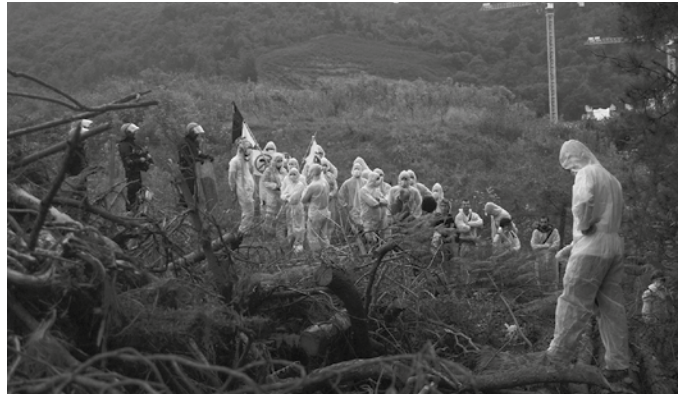
Obrak egiten ari diren eremu parera gerturatu zirenerako, Ertzaintzaren hesiarekin egin zuten topo martxako kideek. Irudi gehiago: noaua.eus

Eta hau nahikoa ez eta indarra ere baliatu zuten gerora, martxa baketsuan parte hartzen ari zirenen aurka. Ertzaintzak, erdaraz kasu gehienetan, denonak diren herri bideetatik, hondatzen hasiak diren Zubietako