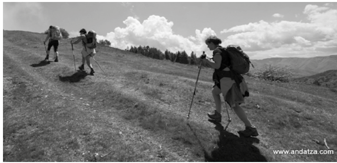
Izen emateko urriaren 3ra arteko epea dago.

Urriaren 12tik 14ra Hecho, Estanes, Aspe bilarak ezagutzeko aukera izango da Andatza M.K.T.-koen eskutik. 25 laguntzako lekua egongo da, Pico de la Cuta, Bisaurin eta Aspe mendiak igotzeko aukera eskainiko duen txangoan. Izen emateko urriaren 3ra arteko epea dago.