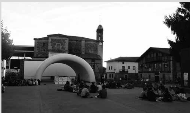
Zubietako iraultza txikien kanpaldia.

Konplizitateak eraiki, elkarrekin hausnartu, konspiratu, egin daitekeen irudikatu eta alternatibak praktikan jartzen, bizipozez eta giro ederrean eman dute asteburua, Zubietako Iraultza Txikien Akanpaldian parte hartu dutenek.