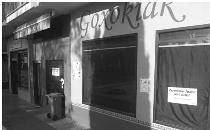
Irailaren 20an oihal beltzez estaliak agertu ziren tabernak, dendak eta udal zerbitzuetako erakusleihoak.

Kanpaina honekin bat egin dute Usurbilek, Andoainek eta Astigarragak. Iaz egin zuten