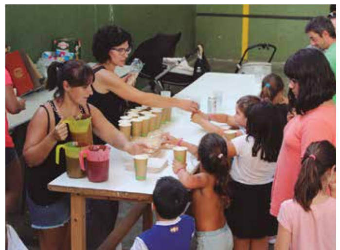
Denetarik objektu berrerabiliekin osaturiko jolas parkeak eman zion hasiera guraso elkarteak antolaturiko egunari.