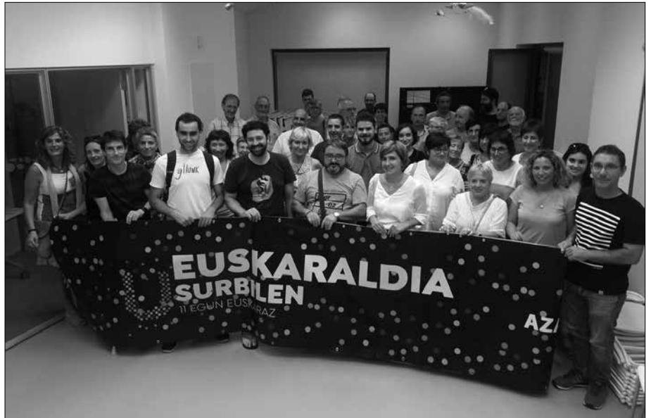
Buskaraldiaren lagun taldea handitzen doa Usurbilen.