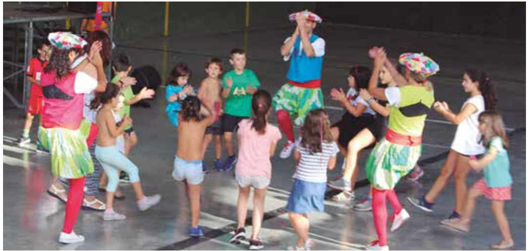
Larunbatean, arratsalde partean, dantzan aritu ziren frontoian.

Giroitze horren testuinguruan ospatu zen hain zuzen joan den larunbatean, Aginagako Eskola Txikiaren festa eguna. Denetarik objektu berrerabi-