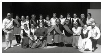
Izen-ematea zabalik da.