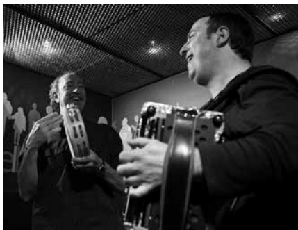
Imuntzo eta Belokiren erromeria arratsaldeko 19:00etan hasiko da.

Urteotan disko ugari kaleratu dituzte eta ehunka plaza eta erromerietan aritu, be-