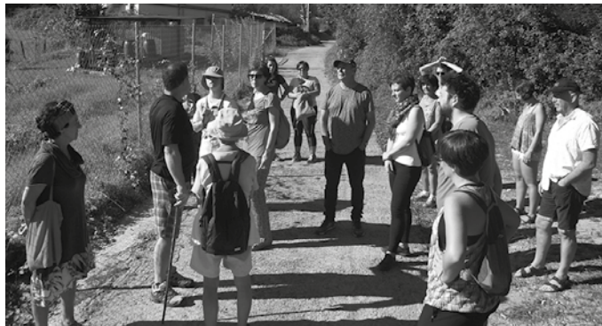
Iruin sagardotegian, mokadutxoa eginez borobildu zuten irailaren 23ko bertso ibilaldia.

finalurrekoetatik sailkatu diren 12 sagardo dastatu ahalko dituzte final handi honen baitan ospatuko den afarira joaten direnek. Eta haiek, herritarrek izango dute beraz azken hitza. Beraiek erabakiko dute nor izango den txapelduna. Erraza da; afaritarako eseri, otorduaz gozatu eta edaten diren sagardoei 5-10 tarteko puntuazioa ematea izango da helburua. Afaritarra joan eta