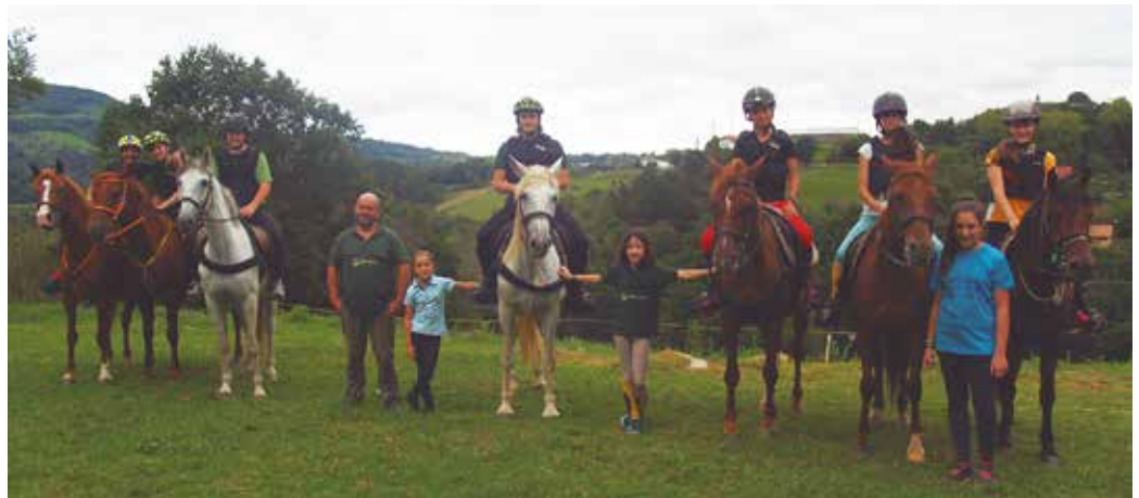
Lar Zaldiak klub hipikoa formakuntza ere sustatzen ari da azken urteotan.

Zaldi gainean ibili, gozatu eta pixka bat ikastea. Orain ikasleak animatuago daude, bakoitzak etxean bere diploma izateak ilusioa egiten die. Bere formakuntza akreditatu nahi duten 15 neska ditugu. Horregatik galopa azterketak egiten hasiko gara. Badira ziur aski hirugarren galopa azterketa gaintutako luketenak, badira batzuk ia ni baino hobeto moldatzen direnak zaldi gainean.