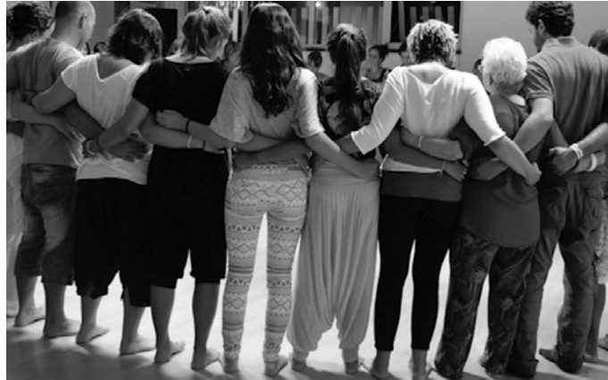
Urriaren 5etik abenduaren 14ra biodantza ikastaroa Oiarde Kiroldegian.

Oharra: ikastarootan usurbildarrek izango dute lehentasuna.