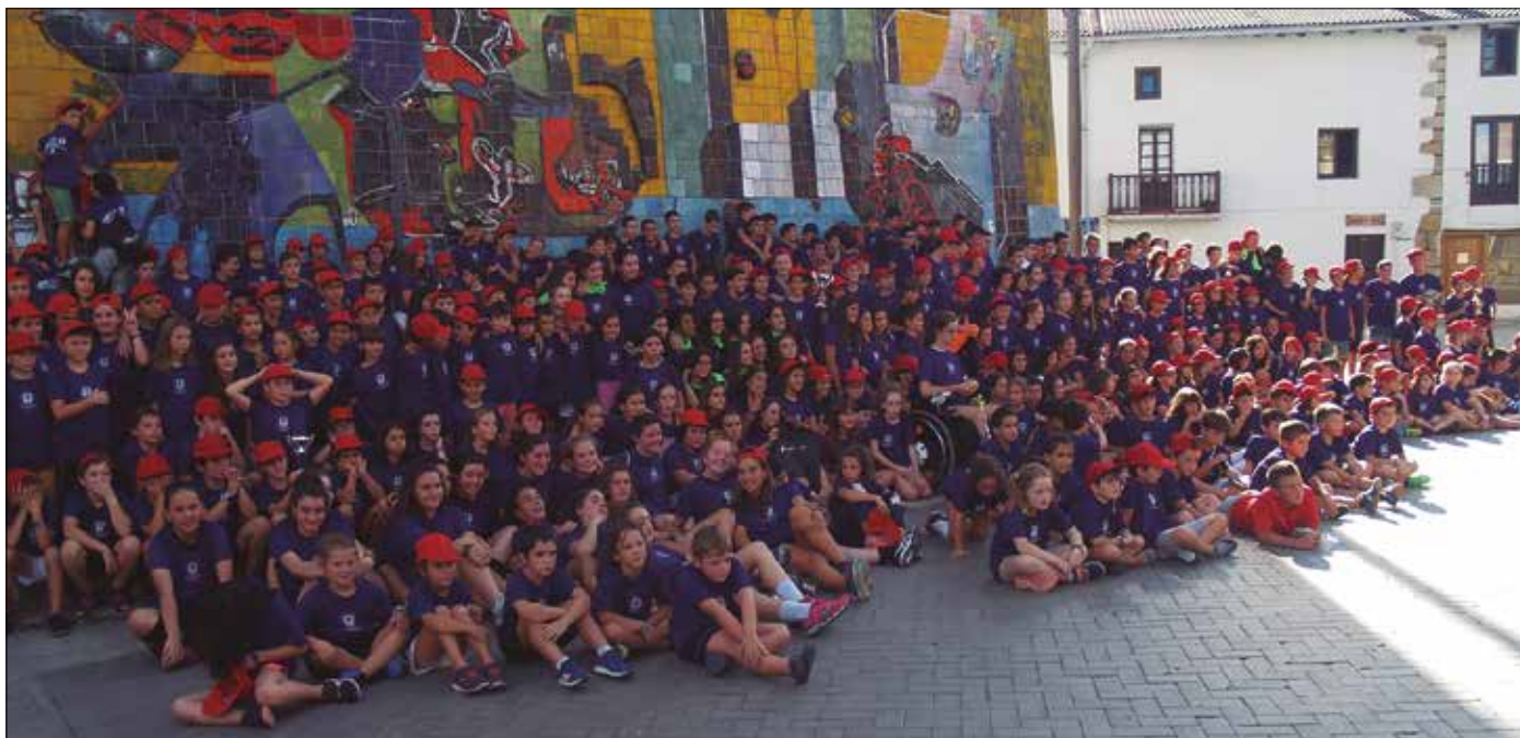
Irailaren 22an borobildu zuten aurtengo edizioa, azken neurketekin, bazkariarekin eta sari banaketarekin.

Talde argazkian kabituz ezinik ziren. Ez da gutxiagorako. Herri mailan parte hartze gehien sustatzen duen ekimenen ar-