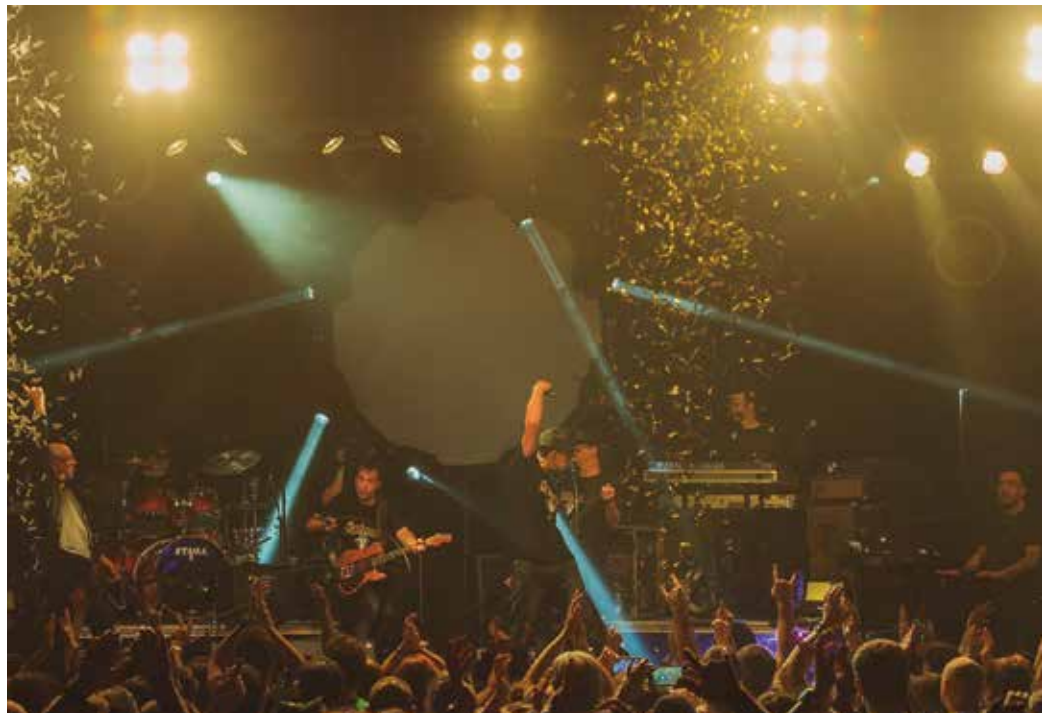
Urriaren 6an esango dute agur, Aginagako festetan.

Lehen pare bat tragorekin gozatu zuten bere modura. Orain denek mugikorrek. Badirudi desagertu behar gabela bizi osorako eta aprobetxatzen ari direla azken segunduak edo minutuak mugikorrek iruditan biltzeko. Gazteak abesten ikusteak harridura sortzen digu. Entzun dute hor ibili gabela burrunba