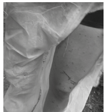
Zauriturik izan zen igandeko martxan.

Erraustegiko lanak oso aurreratuak direla ikusi ahal izan zuten buzo zurien martxako partaideek. Nabarmentzen zuten moduan, “urte baten buruan korrika eta presaka ustelkeriaren bitartez eraikitako erraustegia” bisitatu ahal izan dute. Eraikinak hormak kolore berdekoak ditu. Baina Gipuzkoa Zutik mugimenduaren esanetan, “kolore berdeak ez du ustelkeria hori ezabatzen.