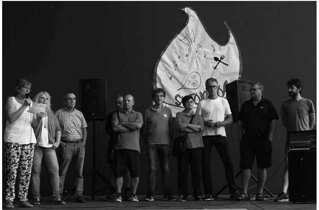
Hainbat agintari ohi omendu zituzten Zubietako frontoian egin zen ekitaldian.

2011-15 legealdian hondakinen kudeaketaren ardura hartu, eta aitortza ekitaldian zioten moduan, Gipuzkoako gizarteak eskatutakoa bururaino eraman