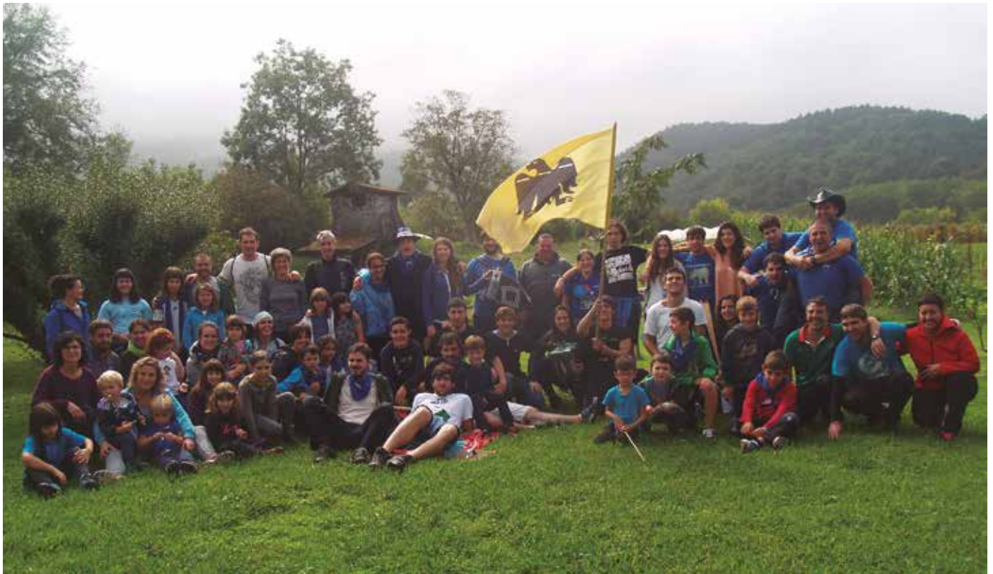
Urriaren 12an, goizeko seietan abiatuko dira. Soziedadean elkartuko dira. Oilasko biltzaile gaztetxoak ordea eguerdiko 12:00etan irtengo dira Mapildik.