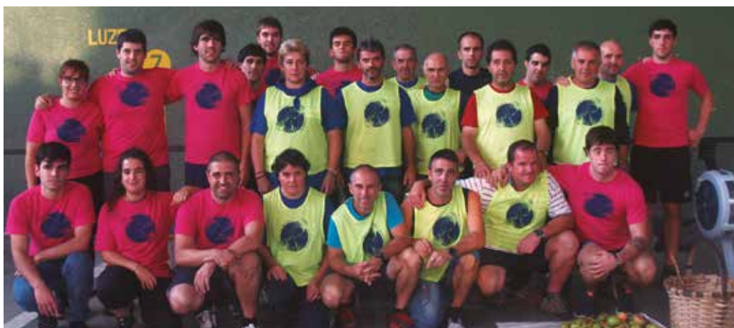
Auzolanean bideratzen dituzte San Praixkuak.

A gur eta estreinaldiekin datozkigu 2018ko Aginagako jaiak. Hurrengo bi asteburuetarako hitzordu eskaintza zabala prestatu dute, inoiz baino gehiago guztiengan pentsatuta, eta aginagar nahiz bisitari ororentzat. Auzolanean bideratzen dituzte San Praixkuak. Gazte talde bat da antolaketaren ardura bere gain hartzen duena, baina laguntzaile presturik ez dute falta, gazte nahiz heldu gehiago baten zaizkie auzolanera.