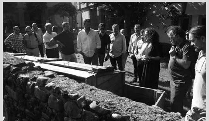
Aldundiko nahiz mankomunitateetako ordezkariak izan dira Usurbilen.

Usurbilgo hondakinen kudeaketa eredugarria da ez bakarrik herri, eskualde, Gipuzkoa edota Euskal Herri mailan, baita urrunago ere. Jakinmina eta interesa pizten jarraitzen du, herri hau zero zabor norabidean jorratzen ari den bideak. Horren lekuko ondoko argazkia. Duela astebete, Sevillako Al-