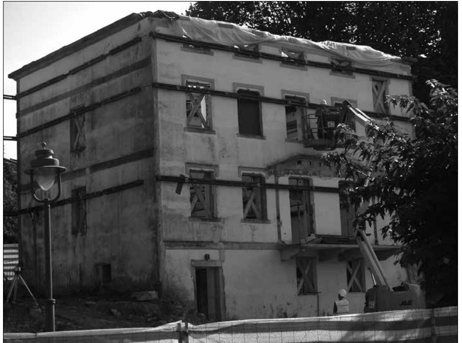
Urtebeteko epean amaitu beharko dituzte obrak.

Urtebeteko epean amaitu beharko dituzte obrak. Bitartean, iaz bezala, abiatzear duten ikasturte berri honetan ere, Udarregi Ikastola, Santueneko frontoi ondoko lokala eta Puntapax kaleko egoitza baliatzen segiko du Zumartek.