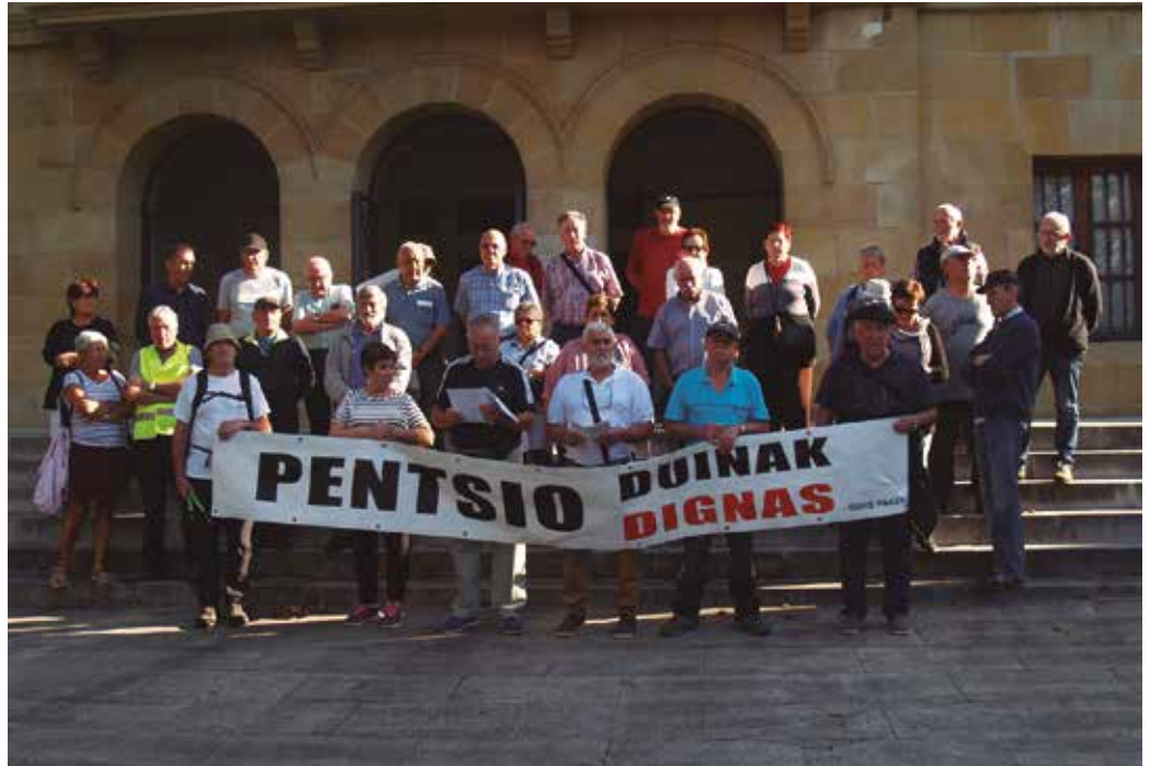
Gipuzkoako Pentsiodunen Birarekin bat eginez, pentsio eta bizi duinen aldeko biran hartu zuten parte hainbat herritarrek. Geldialdi bat egin zuten udaletxe aurrean.

Troian egin zuten bigarren geldialdia. Zonalde honetako N-634-ko pasabidean dagoen segurtasun falta salatzeke errepidea moztu zuten.