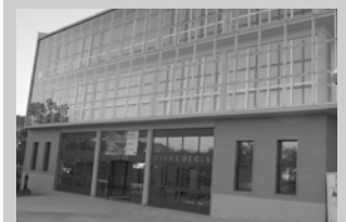
Igerileku txikia handitu eta irisgarriago egingo dute.

Iraila amaieratik itxita dago Oiarde Kiroldegiko igerilekua. Eta hala segiko du datozen hilabeteotan. Igerileku txikia handitu eta irisgarri bihurtzeko lanak bideratuko dituzte. Itxierak ez du eraginik izango abonueetan, “eta %20ko konpentsazioa berdin-berdin aplikatuko die Udalak Kiroldegiko abonatuiei”.