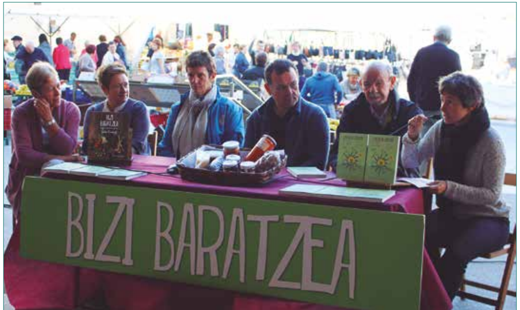
Errezilgo Azokako Emakumeekin batera egin zuten 'Landareak lantzen 2019' liburuaren aurkezpen ekitaldia. Argitalpen berria Alkartasuna kooperatiban, Lizardin eta Laurok dendetan eskura daiteke.