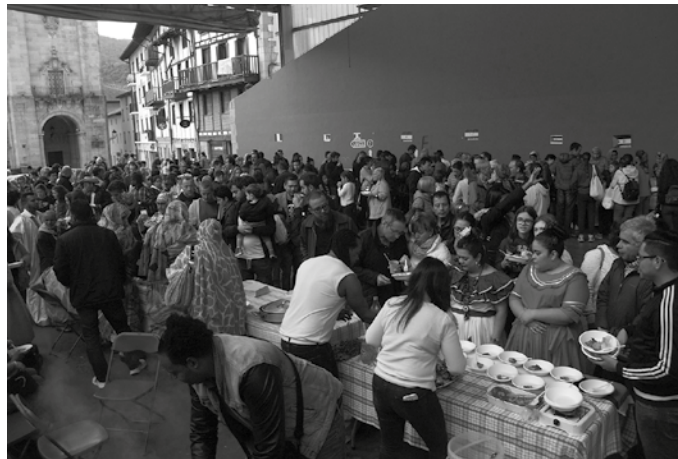
Jaki ezberdinak dastatzeko aukera izango da eguerdi partean.

“Garabide Elkartek gonbidatuta, hizkuntza gutxituetako hiztun diren hogeitaz indigena egongo dira Euskal Herrian aurtengo iraila bukaeratik abendura “Hizkuntza Biziberritzeko Estrategiak Aditu” Ikastaroaren IV. edizioan. Usurbilgo Udalaren laguntzaz gauzatzen ditugun hizkuntza lankidetzako proiektuetako bat da ikastaroa, baina, Euskal Herrikan kanpo ere bide luzea egiten ari gara. Hain zuzen ere, hizkuntza komunitate horietara hurbiltzeko argazki erakusketa bat osatu dugu Mundualdia jaialdiaren baitan, leihobat ireki nahi dugu mundura, elkarrengandik asko baitauka-