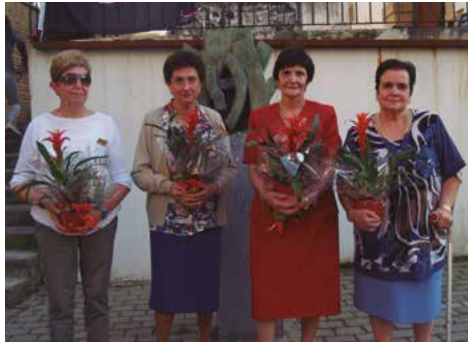
Eiza eta Etxebesteak lore sorta bana jaso zuten.

Gure Agiña txiki honetan ikur izan dugu Eiza lehengairen bat falta ezker edonorentzat geriza horko emakume prestuengatik jasoz tratua bria langile oso finak direla antzean liteke aixa omenaldia eginda gero txit merezi duten gisa