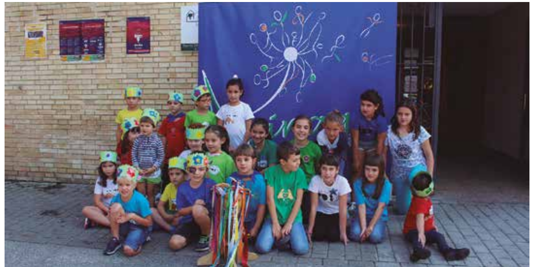
Gipuzkoako Eskola Txikien Eguneko logoa aurkeztu dute. Irudian ikusi daitekeen moduan, kolore urdina da nagusi.

Kamisetak eta jertseak egin dituzte propio ekainaren 9ko fes-