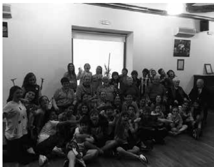
Ziortza Gazte Elkarteko LH5-6 ko gazteak Gure Pakea elkarteko kideekin batu ziren maiatzean.