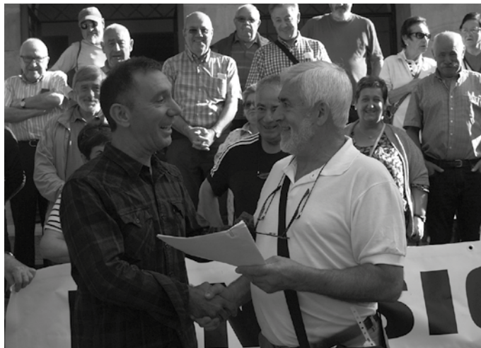
Udaletxean eskaera zerrenda bat aurkeztu zuten.