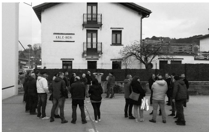
Yoko-Garbitik iragarri dutenez, elkartearen egoitza berria Alamandegi etxean kokatuko da.

“Familia bonoiez gozatzeko aukera, jubilatuei deskontu bereziak...” eskaintzen zaizkie. Informazio gehiago behar duenak ere lehen aipaturiko helbide horretara idatzi