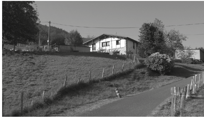
Igartzazabal baserrikoek aditzera eman digutenez, “itxitura dagoen lekutik ez du inork zertan pasa beharrik, baimendutakoek bakarrik”. Halere pasatzen direnei, “gutxienez errespetatzea nahi dut, ez dut besterik nahi”. Artaldea bertan ez duenean, kendu egiten du kandadua.

Lehenago, duela urte batzuk motor zaletuekin izan zituzten arazoak. Artaldean hainbat arazo pairatu behar izan zituzten, tartean, “ume hilak botatzen hainbat ardi”. Halere, NOAA! bidez, lerrootan jakinarazi nahi duen moduan, une honetan badu bestelako kezkarik. Ardiak dituzten lur eremuko itxiturekin gertatzen