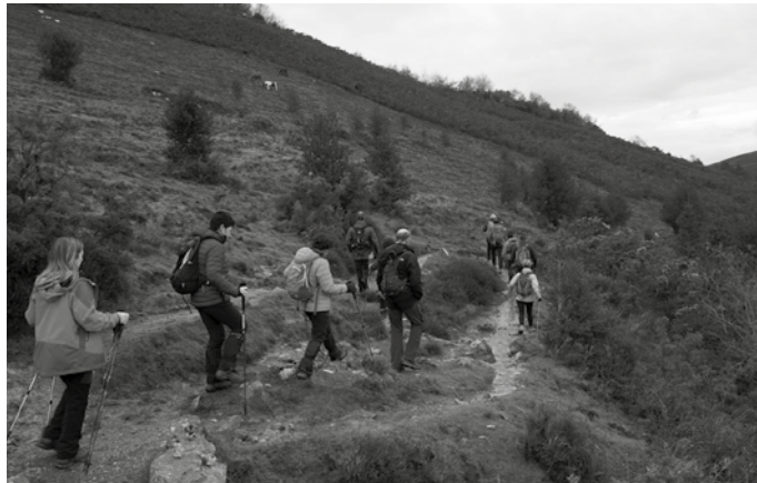
Andoain, Urnieta, Lasarte-Oria eta Usurbil herrietako bideetatik barrena osteratxoa egiteko gonbita luzatzen dute.