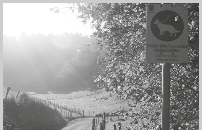
Igartzazabal baserrikoek ditenez, kartelari ez zaio kasu handiegirik egiten.

Andatza denona dela argi utzi arren, gogoraraten du, “itxitura horiek guretzat eginak daude. Azienda neure lur sailean izan behar dut. Guk hor eskubideak ditugu aziendarekin ibiltzeko. Baina ezin da azienda tartean ibili”.