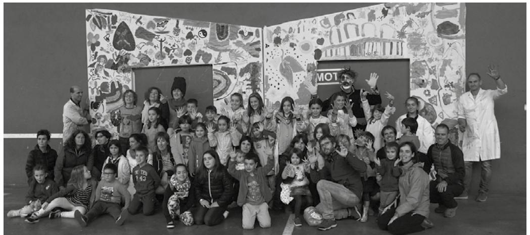
90 haurretik gora, lagun arte giro lasaian aritu ziren margotzen frontoian.

Sormen faktoria ederrean bilakatu zuen GuraSOSeK Usurbilgo frontoia eta Sutegi, urriaren 7an. Haur eta gaztetxoek duten aurrera begirako ikuspegia, etorkizuna marraztu zuten, kolore biziz gainera. Eta hitza ere jarri zioten. Sormenerako eta jolaserako txokoak antolatu zizkion guraso taldeak etorkizuneko belaualdiari. “Idatzi eta margotu eta etorkizuna kolore biziz”, hortxe luzatu zieten gonbita.