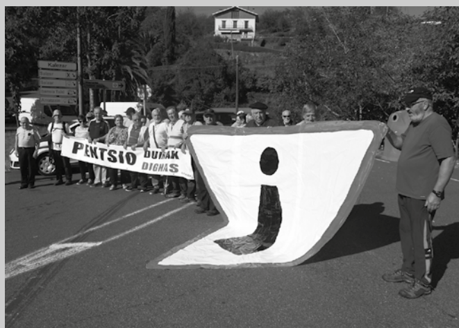
N-634 errepidea moztu zuten Troia parean, Usurbil seguru eta jasangarria nahi dutela aldarrikatzeko.

Gogoan izan, segurtasunaren ikuspuntutik, Troiako pasabidea dela herrian dugun puntu beltzetako bat. Egunerokoan hainbat oinezko nahiz bizikleta erabiltzaileek baliatzen duten pasabide arrisku-tsu honetan, ibilgailuen joan-etorria eta trenbidea zeharkatu behar dute, Usurbildik Zubieta