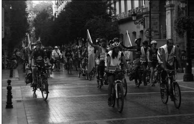
“Aldaketa klimatikoa eragiten duten gas igoerle nagusian bilakatuko da erraustegia”, Donostian salatu zuten.

Asteburuan Baionan helmugaratu eta Alternatiben Herria ekimena ospatu aurretik, Donostian egin zieten harre-ra, Gipuzkoako Foru Aldundi atarian, Gipuzkoa plazan. Donostian aurreikusiak dauden etorkizuneko bi proiektu salatu zituzten; “interes ekonomikoen mende dauden soluzio faltsu”