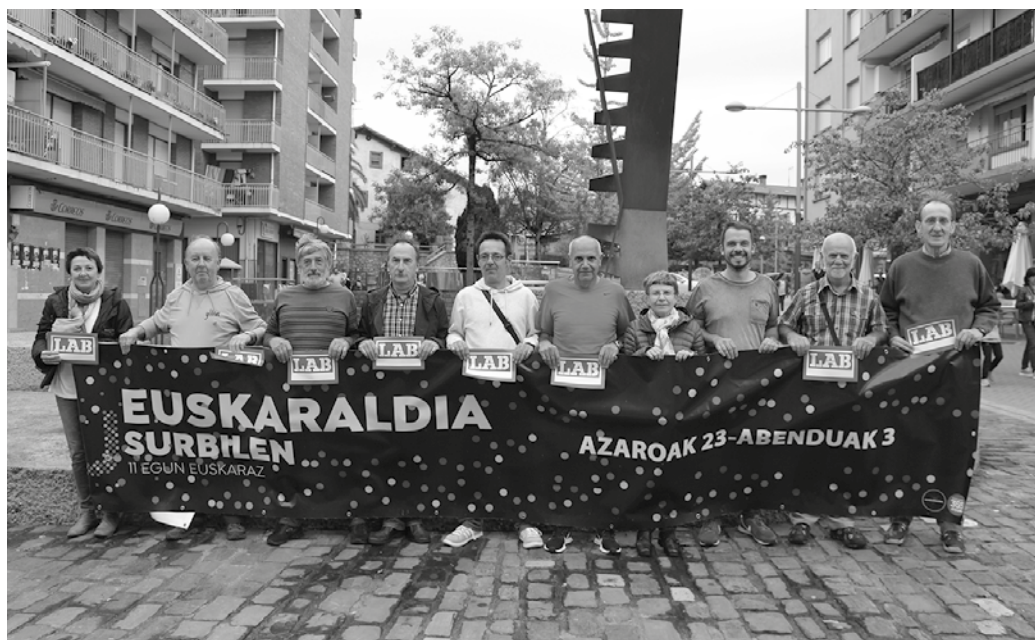
LAB sindikatua, Euskaraldiarekin bat. Azaroaren 23tik abenduaren 3ra bitarteko kanpainarekin bat egitera animatu nahi dituzte herritarrak.

usurbil@euskaraldia.eus usurbil.euskaraldia.eus Facebook: Euskaraldia Usurbil Twitter: @EuskaraldiaUsur Youtube: Euskaraldia Usurbil