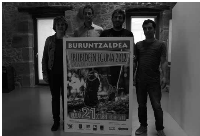
Igande honetan ospatuko da Buruntzaldeko XI. Ibilbide Eguna.

Partaide bakoitzak abiatzen denean txartel bat jasoko du, irteerako herriak zigilatuta. Bi ibilbide egiten dituenak