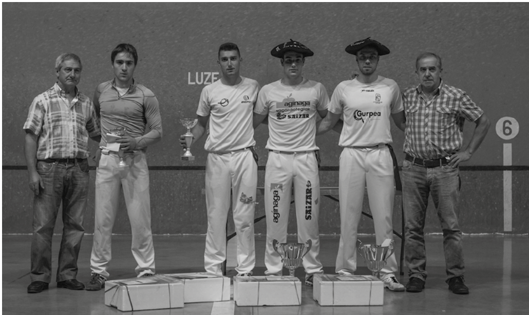
Txapela jantzita ageri den bikotea aise nagusitu zen finaleko partidari. Exposito-Alduntzin 22 / Prieto-Zezeaga 9, azken emaitza.