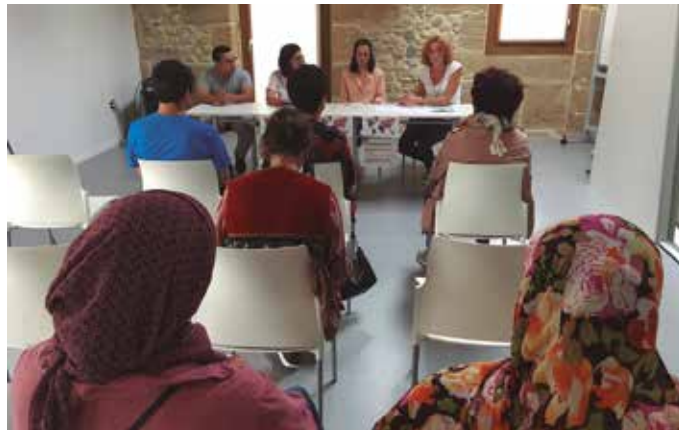
‘Usurbilgo jatorri aniztasuna zenbakitan 2018’ azterketaren berri eman zuten Mundualdiaren aurkezpen ekitaldian.

Jaiolekua eta sexua alderatuz gero, multzo gehienak orekatuak dira, hau da, gutxi gorabehera emakumezko adina gi-