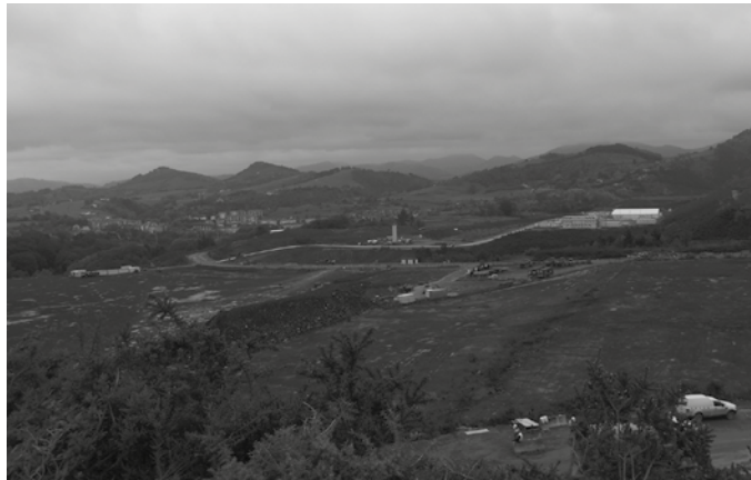
EAJ-ren galderari erantzunez, Grande-Marlaskak Martuteneko espetxea itxiko dutela azaldu zuen, “Zubietakoa eraikitakoan”.

Baietz erantzun zion Grande-Marlaskak EAJ-ren galderari. Martuteneko espetxea itxiko dutela, Zubietakoa eraikitakoan. Azkenean Zubietan 200-300 presoentzako kartzela eta gizarteratze zentro bat eraikiko dutela iragarri zuen. Espainiako Gobernuak itxi, lekuz aldatu edo berregituratu beharreko espetxeen gaineko plan bat lantzen ari dela adierazi zuen barne ministroak. Mercedes Gallizo buru duen departamentuak aipatu egitasmo hau laster ezagutaraziko duela. “Aurreratu dezaket, Martuteneko espetxearen itxiera berrikuntza nagusietakoa izango dela”, iragarri zuen. Eta abuztuan bestelakorik zabaldu zen