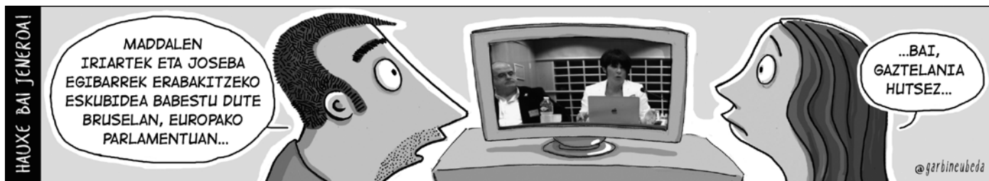
TOKIKOMeko hainbat hedabidek sustaturiko tira komikoa.

* Ika Mika atalerako idatziak gehenez 2.000 karaktere izango ditu. NOAUA!k ez du bere gain hartzen Ika Mika atalean adierazitako esanen eta iritzien erantzunkizunik. Ezizena ere onar daiteke, baina idatziaren egile den gizabanakoaren edo elkartearen IFK edo baliokidea egiaztatuta eta gero. Zuzenean beste pertsona bati zuzenduta dagoenean, izen-abizenekin argitaratuko da ika-mikarako idatzia. Hurrengo alea: urriak 26. Idatzia ekartzeko azken eguna: urriak 22.