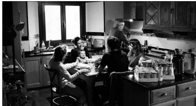
Batutako diruaren %25a Nafarroa hegoaldeko euskalgintza suspertzera bideratuko dute.

Erositako kutxetatik jasotako laguntzaren %25a Nafarroa hegoaldeko euskalgintza suspertzera bideratuko dute. Aipatzekoa, ekimen honek ere ate joka dugun Euskaraldiarekin bat egin duela. Euskararen erabilera suspertzera helburu