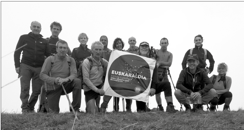
Pasa den asteburuan, Hecho inguruan ibili ziren Andatza mendi taldekoak. Cuta mendiaren gailurrean egina dago argazkia.