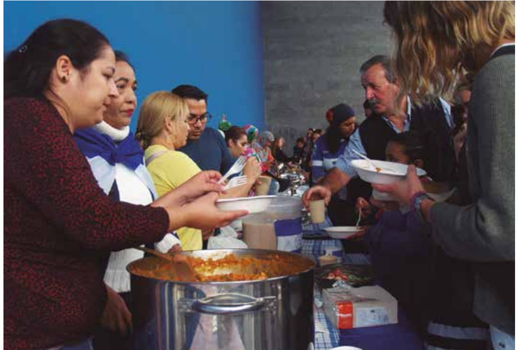
“Sortu daitezkeen nahi eta beharrei erantzuna eman eta horrela Usurbil inklusibo eta integratzailea sortzen ere gure indarrak jarri nahi ditugu”, Tadamun elkarteko kideek aditzera eman digutenez. Iazko Mundualdikoa da argazkia.

Taldeak bideratu asmo duen jardunaren ardatz nagusiak aurreratu dizkiote aldizkari honi. “Alde batetik herrien errealitate ezberdinak ezagutzuz gure buruak elikatu eta beraiekiko elkarlana sustatu. Horretarako hitzaldi ezberdinak ekarriko ditugu herrira, solasaldi ezberdinak, mahai inguru ezberdinak. Beste alde batetik, Usurbilen munduko beste herrietatik bizitzera etorri diren pertsonekin harremanak egin, sendotu eta guztion elkargune izan nahi du Tadamunek. Sortu daitezkeen nahi eta beharrei erantzuna eman eta horrela Usurbil inklusibo