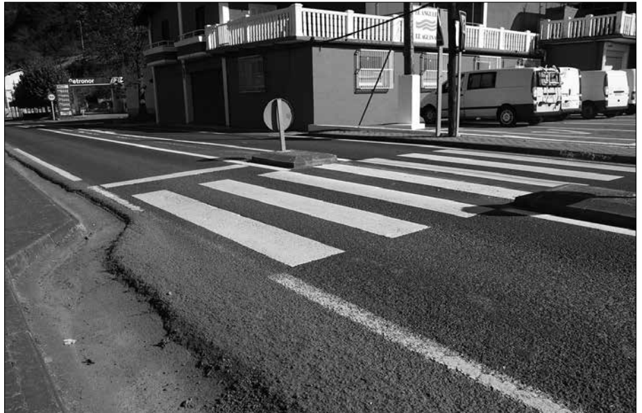
Haur-kotxeekin joanez gero, errepidea eta espaloia- ren artean dagoen tartea gaintzea ez da erraza.

Aginaga bitan zatitzen du N-634-ak eta "horrek batetik bestera modu seguruan zeharkatzeko arazo ugari sortzen ditu. Abiadura gutxitzeko hainbat neurri hartu baziren ere, ez dira aski, eta, neurri ge- hiago eta eraginkorragoen beharra dago" gogorarazten zuen aipatu herri platafor- mak martxoan frontoian egin zuen lehen agerraldian. Jai hauetan ere nabaritu da. Oinezkoek errepidea zeharkatzeko kontu handia izan behar autoen abiadura zela eta. Eta horrekin batera, ondoko argaz-