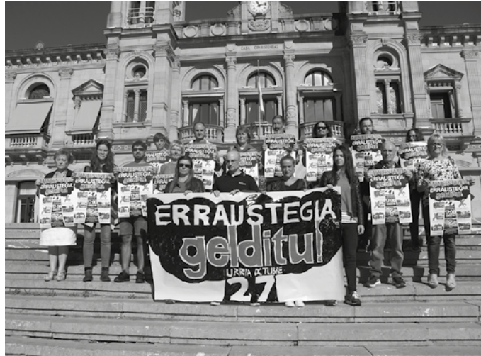
Erraustegia geratzeko manifestazio bateratua deitu dute. Urriaren 27an, arratsaldeko 17:00etan abiatuko dira Amarako Mendeurren plazatik.

Eragile guztiok nabarmendu dute, albiste honen ostean, erraustegia geratzeko urriaren 27rako Donostian deitua duten manifestazioaren garrantzia. “Urriaren 27an ospatuko dugu “Erraustegia gelditu!” manifestazioarekin! Gora Ainhoa eta