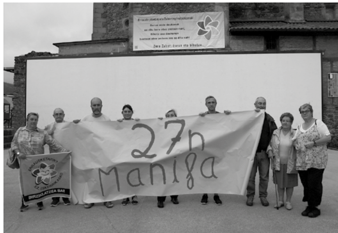
Eragile anitzek erraustegia geratzeko Donostian antolatua duten manifestazioarekin bat egin dute Zubietan. Usurbildarren txanda ostegunean izango da, 19:30ean Mikel Laboa plazan.

Ikusten ari gara nola jokatzeko ari diren bai Donostiako EAJ-PSE udal gobernu eta Gipuzkoako Foru Aldundia. Halako ingurune natural bat babestu eta altxor moduan tra-