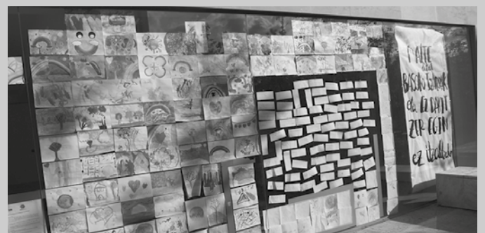
Sortze lan hauetako batzuk latoizko kutxak apainduko dituzte.