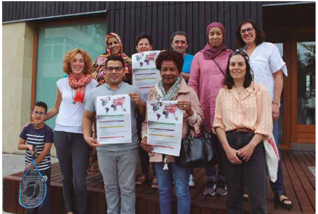
Mundualdia 2018 egitaraua aurkeztu zuten aurreko astean Potxoenean. “Elkarrengandik asko dugu ikasteko. Partekatze. Baina berdinetik berdiner”.