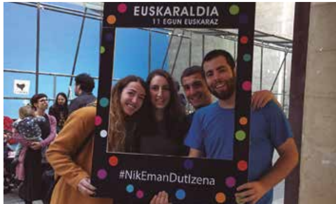
Jendea hasi da Ahobizi nahiz Belarriprest gisa izena ematen. “Belarriprest gisa parte har dezake, euskaraz hitz egiten moldatu ez baina ulertzen duenak, edota baita euskara ahoz ere primeran menderatzen duen orok”.

Belarripresten egitekoaz zerbait zalantza sortu dira azken aldian. Ez ahaztu, Ahobiziek euskara ulertzen duten guztiei euskaraz aritzeko konpromi-