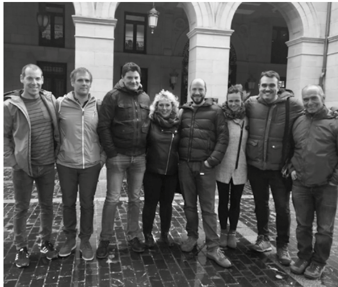
Diru publikoa herritarren interesen alde erabili beharrean, bi pertsonen mendekurako baliatzea zuzena ote den galdetu zien Intxaurrendietak GHK-ko kideei.

Intxaurrendietak gogorazten duenez, “banketxeen kontrako swapen auzian, sententzia ez zuten errekurritu nahi izan. Orduan erabili zuten argudioa, abokatuetan diru asko gastatuko zela izan zen. Jakitun ziren swapetan xahututako milioi euro guztiak, banketxeak kobratzen ari direnak, soilik haiek itzul zitzaizkela. Orain ordea, diru publikoarekin, eta abokatuetan zenbat gastatuko duten begiratu ere egin gabe, gure kontrako errekurtsua jartzea erabaki dute, badakiten arren ez dutela sekula gugandik dirutza hori berreskuratuko”.