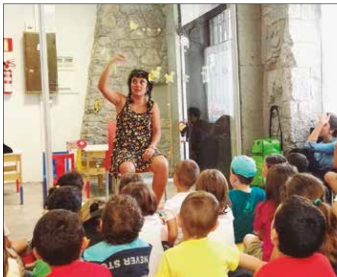
HH5 mailako gazteentzako saioa eskainiko du Sutegin.