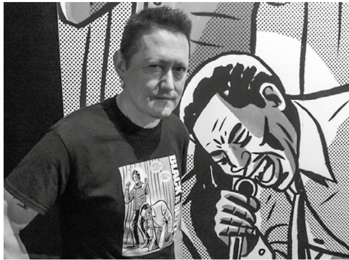
“Black is beltza” Fermin Muguruzak zuzenduriko animaziozko filma Sutegin ikus ahal izango dugu igande honetan.

Igande honetan (azaroak 11) proiektatuko dugu filma 19:00etan Sutegin. Proiektziozko zuzendaria bera gonbidatu