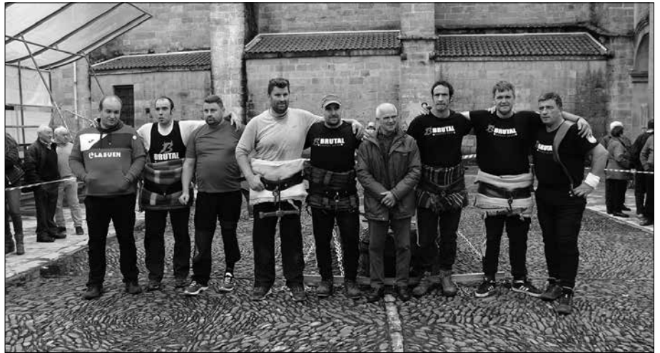
Plaza bat, hiru zinta eta 30 zentimetroko distantzia osatu zuten 20 minutuko proban.

etorritako seina laguneko bost talde aritu ziren. Bizkaiko bi eta Araba, Iparraldea eta Gipuzkoatik bana lehiatu ziren. Orduko hartan Markinako taldea gailendu zen, ia bi plaza osatuta.