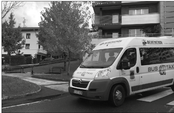
Azaroaren 1ean hilerrira joateko ohitura dago. Udalak autobus zerbitzu berezia antolatatu zuen propio. Eguerdira arte aritu zen, joan-etorrian.

Urtero moduan, Gipuzkoak dituen bi taxi elkarteek 2019rako taxi tarifa berrien eskaintza helarazi zien Buruntzaldeko udalei, guztiok biltzen dituen Buruntzaldeko Taxiaren Eskualdeako Batzordeak iraila amaieran egin zuen bilkuran. G. Taxi Gipuzkoako Taxien Elkargoak %2,5eko igoera aplikatzea proposatu zuen, Agitaxek %2,3koa. Batzordeak aho batez %2,3ko igoera aplikatzea adostu zuen. Batzordearen proposamena da eskualdeko udaletara heldu dena, tartean Usurbilgora.