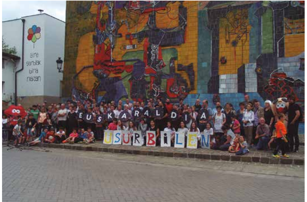
Norbanakoek soilik ez, 30 herri eragiletik gora dira dagoeneko atxikimendua adierazia diotenak Euskaraldiari.

Zenbakietatik haratago joan nahi du ordea Euskaraldia Usurbilen sustatzeko hilabe-