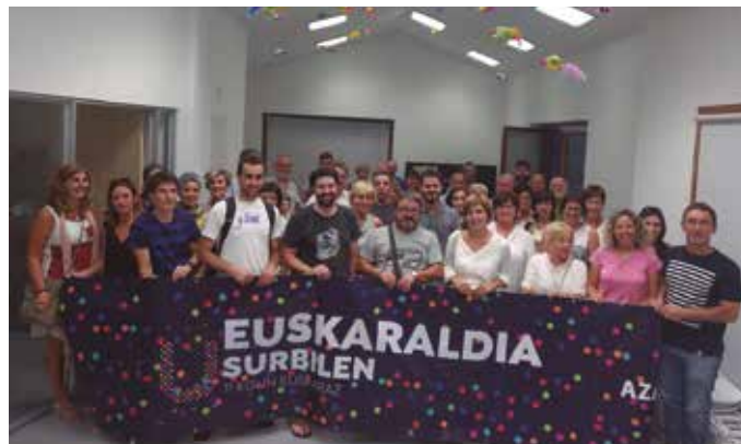
Euskaraldia egitasmoa martxan da. Dagoeneko eman daiteke izena usurbil.euskaraldia.eus web orrialdean.

Ikerketek erakutsi dute etxeak eragin handia duela hizkuntza bat ala beste erabiltzeko joera finkatzean; euskara erabiltzen duenak erabiliko du etxetik kanpo ere. Beraz, familia transmisioaz ari garelarik, seme-alabei hizkuntzaren ezagutza transmititzeaz gain, etxeko