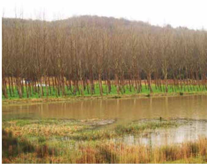
'Neguko irudiak', aurtengo lehiaketarako gaia. Argazkiak Santuenea Kultur Elkarte-ko egoitzan aurkeztu behar dira.