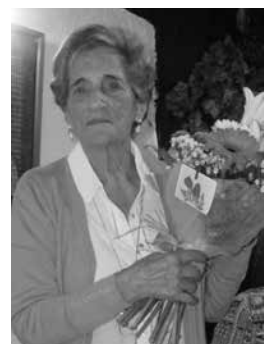
Zorionak Amoni! Egun ederra pasa genuen, zure urtebetetze egunean. Mila esker zure bizipoxarengatik!