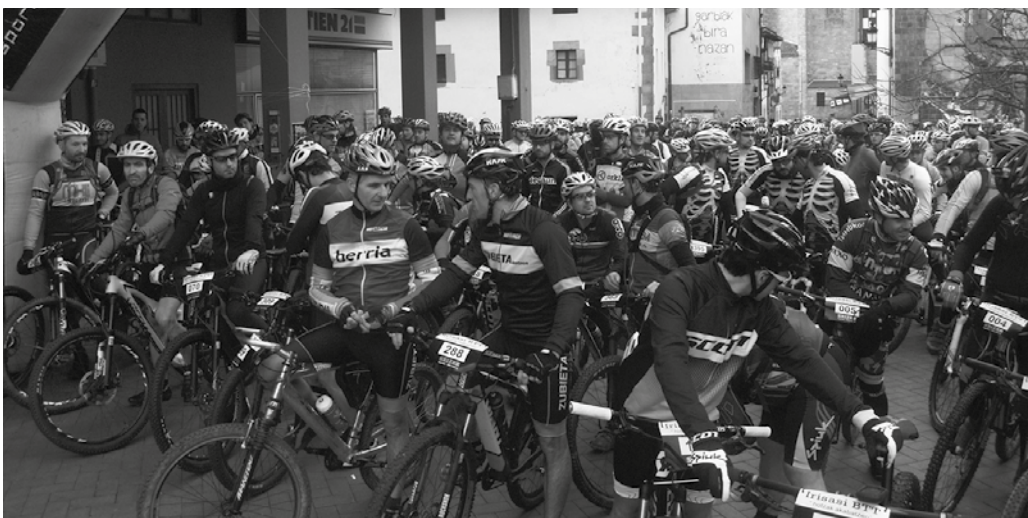
2019ko lasterketa urtarrilaren 27an ospatuko da.

Negu partean ospatu ohi den mendi bizikleta gaineko proba herrikoia data zein