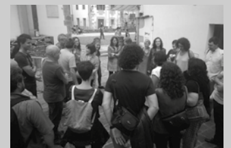
Igande honetan, Harria hitz bisita gidatua. Aurrez eman behar da izena.

■ Informazioa eta erreserbak: 688 818 017 info@kultour.pro