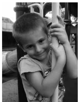
Zorionak Liherr! Zure bost urteak ospatzeko eguna iritsi da!