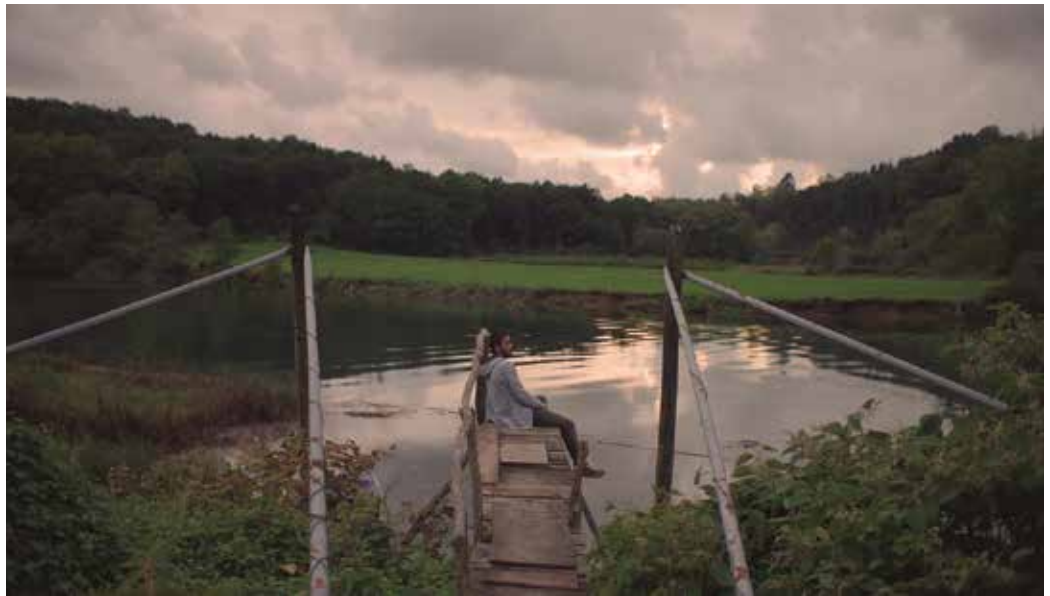
Aginaga eta Usurbil aldean grabatu ziren “Oreina” pelikulako eszena gehienak.