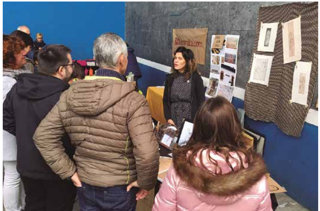
Frontoira hurbildu zirenek artisauen azalpenak entzuteko aukera izan zuten.

GuraSOsek antolatutako tailerretan sortutako marrazkiekin eta hitzekin apainduak daude babes-kutzak, eta barruan