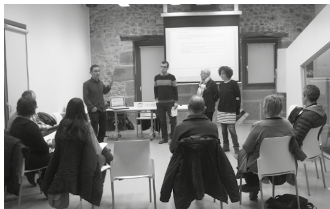
Arratsaldeko 18:00etan hasiko da bilera.

Azaroaren 14rako deitu du Usurbilgo Udalak “Usurbil 0.0” plangintzaren jarraipena egiteko seiheroko batzarra, 18:00etan Potxoenean. Batzar irekia izango da, edonork parte hartu ahalko du. Egitasmo honen baitan azken hilabeteotan emandako urratsen eta 2019rako aurreikusen diren egitasmoen berri emango da, bertaratzen diren herritarren ekarpenak biltzearekin batera. Hitzordu honen harira, Usurbilgo hondakinen kudeaketari lotutako 2018ko lehen seiheroko datuak plazaratu ditu Udalak.