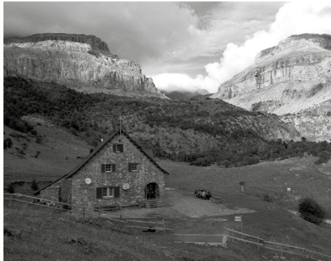
Urrian, Hecho inguruan ibili ziren Andatza mendi taldekoak. Igande honetan Otsondo-Bidarrai bidea osatuko dute.

Abiatzeko hitzordua: 7:30ean Oiarde Kirolegitik autobusez. Ibilbidea: 19 kilometro.