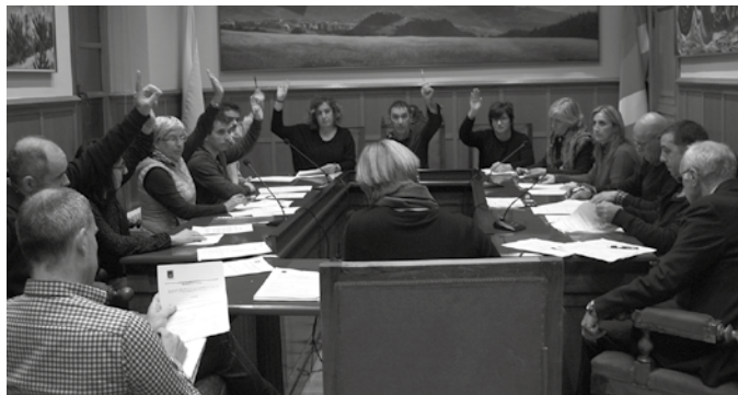
Oro har, %1,75eko igoera aplikatzea proposatzen du udal gobernu taldeak.

Badira ordea urtero moduan, salbuespenak. Tartean, bere horretan mantenduko dituzten ordenantza fiskalak. Besteak beste, “jarduera ekonomikoaren gaineko zerga (IAE); eraikuntza, instalazio eta obrei