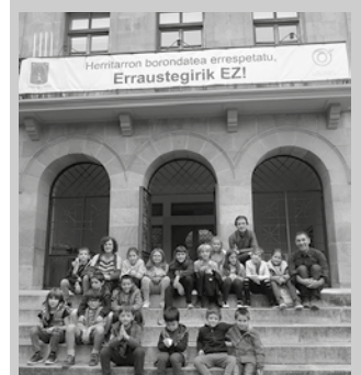
"Udaletxeko funtzionamendua ezagutu genuen".

Udal zerbitzuetan bisitariak izan dituzte berriki; Zubietako Eskolako kideak. "Zubietako haurrek Usurbilgo Liburutegia eta Udaletxera bisita egin genuen. Bateko zein besteko funtzionamendua eta erabilera erakutsi ziguten", azaldu diote NOAUA!ri. "Liburutegian, eskola liburutegiko kidea egin zen. Udaletxean, funtzionamendua, langileak, alkatea, eta dagozkien lanak ezagutu genituen. Eskaera eraman genuen".