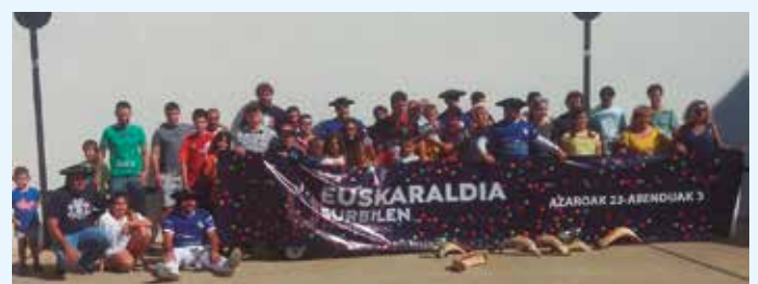
Zubietako Pilota Elkarteak.