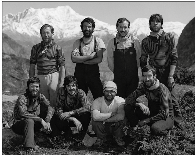
Azpeitiko zortzi mendizalek Annapurnako (Nepal) gailurrera igotzeko saiakera egin zuten 1986an. Dokumentala ostegun honetan emango dute.