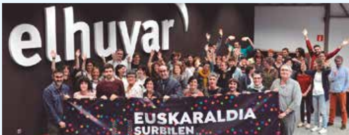
Elhuyarreko lan taldea.