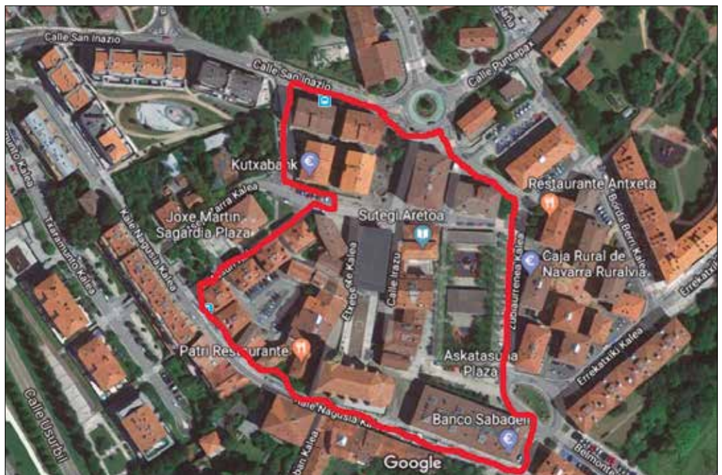
“Topaketa honetan familiako edonork parte har dezake, familia plana da”, ohartarazi dutenez.

Ezkutatze eremua Kaxkora mugatuko da. Kale Nagusia, Irutasuna kalea, San inazio eta Zubiaurrenea kaleek osatzen duten lauki formako inguruetik ezingo da atera. “Kalean (aire librean) ezkutatu beharko da”, ez inongo leku estalietan. Ezkutaketan aritzeko dinamika honakoa izango da. “Hiru hezitzaileko taldeak 3 minutu itzarongo du frontoian eta denbora tarte hori pasatzean