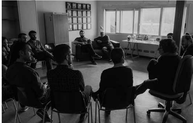
Eskaerak aztertu ostean, aurkezturiko eskabideen gaineko behin behineko ebazpena kaleratu du orain Usurbilgo Udalak.