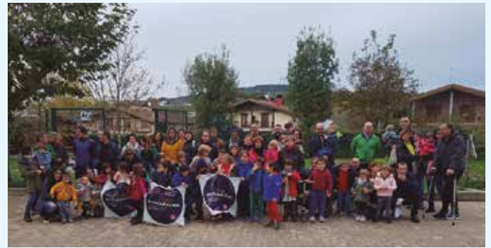
Zubietako Guraso Elkartea.