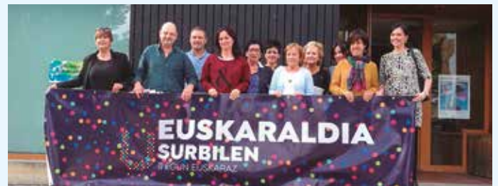
Hurbilago merkataria eta ostalari elkarteak.