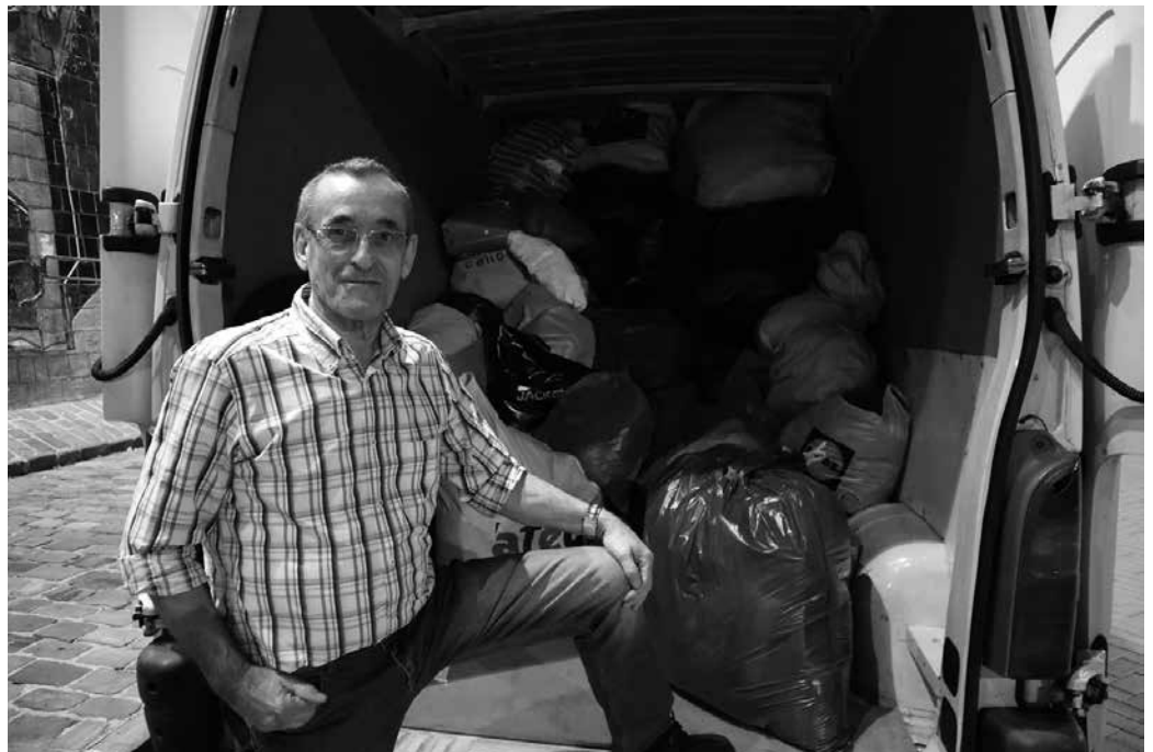
Zaporeak ekimeneko kideak arropa batzen aritu dira. Usurbilen, azaroaren 15ean aritu ziren neguko arropa biltzen.

Usurbilen jasotakoa, Euskal Herriko gainerako txokoetan bildutakoarekin batera, neguko arropa behar larrian diren Greziako Lesbos eta Chios uharteetako errefuxiatuei helaraziko zaie, palet ezberdinetan. Bakoitzak 150 euroko gastua eragingo du. Gastuei aurre egiteko laguntza eskatu dute, bestela, "ez du ezertarako balio arropa biltzeak, ezin badugu garaiz bidali".