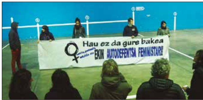
Elkarretaratzea deitu dute igande honetarako. 12:30ean frontoian.

bakean utzi!” antzezlanaren antolatuta, Sutegiko auditorioan.