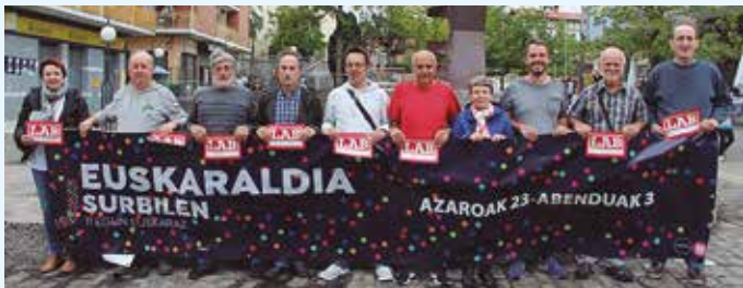
LAB sindikatuko ordezkaririk.