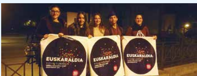
Zubietako Jai Batzordea.