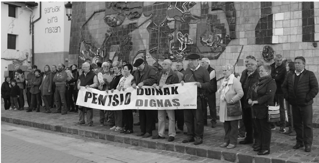
Urriaren egin zuten bezalaxe, azaroko azken ostegunean batuko dira Mikel Laboa plazan, "Pentsio duinak" aldarriean.

P entsio duinak defendatzen segitzeko hitzordua finkatu dute azaroko azken ostegunerako. Bigarren