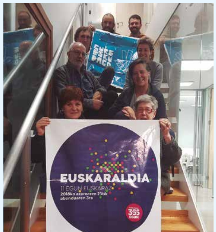
Usubilgo Gure Esku Dago taldea.