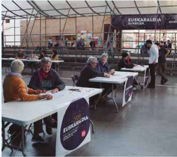
Herritarrek hasi dira Ahobizi eta Belarriprest txapak eskuratzen.

■ Zure portaera ulertzen edo onartzen ez duen norbait egin