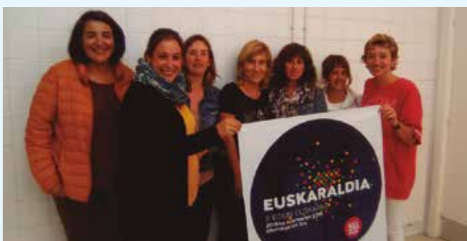
Hitz Aho guraso taldeko partaideak.