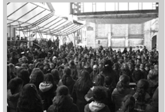
Azaroko 11 kanta abestu zuten LH 4, 5 eta 6. mailako ikasleek.

Txerria omenduz ospatu zuten azaroaren 11ko San Martin Eguna Udarregi Ikastolako HH eta LH-ko ikasleek bi egun lehenago, hilaren 9an Agerialdeko patioan. "Gure Kurrintxo, urtero ateratzen dugun txerria paretan itsatsi dugu". Horrekin batera, "Azaroak 11" kanta abestu zuten, LH 4, 5, eta 6 mailako ikasleek txirula jotzen zuten artean. Borobiletan jarrita, dantzan amaitu zuten ekitaldia eta klaseen astea.