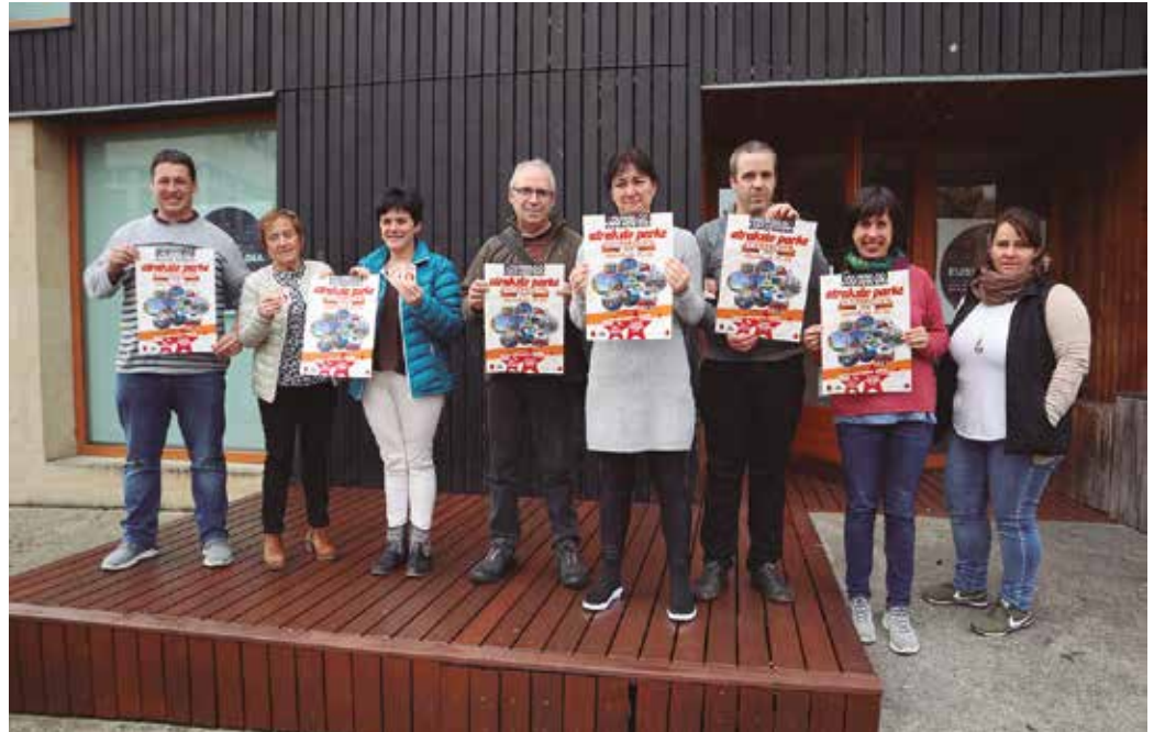
Abenduaren 29an eta 30an, jolas parke bihurtuko dira frontoia, Dema, Askatasuna eta Mikel Laboa plazak. “Sekulako tramankuluak” iragarri dituzte Hurbilagokoeak, “jolas parke benetan erraldoia”.

Aipatu moduan, joko guztiotaz gozatzeko bi egun finkatu dituzte, abenduaren 29a eta 30a. Egun bakoitzerako sarrera 15