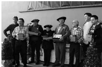
Igandean, Erle Eguna. Azoka 11:00etan hasiko da eta sari banaketa eguerdiko 13:30ean.

Gozogintzako irabazleak/ Marrazki lehiaketarako irabazleak. Ezti desberdinen dastaketa Euskal Herriko XX. Ezti lehiaketa eta gozogintza lehiaketa. Antolatzailea: Erle Lagunak.