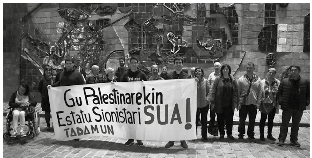
Palestinari elkartasuna adierazteko elkarretaratzea egin zuten azaroaren 16an Mikel Laboa plazan.

"Azaroaren 11n Israelgo Estatu Sionistak komando operazio bati ekin zion. *Nour Baraka* Hamas-eko buruzagi militarra bahitu asmoz. Baina bai bera eta berarekin zeuden militanteek gogor eutsi zioten eta azkenean erahil egin zituzten. Palestinarrak komando burua akabatu zuten eta beste bat larriki zauritu. Ondoren Israel Gaza bonbardatzen hasi zen. Bitartean Gazako Faktzio guztiak bat eginik aurre egiteko intentzioa azaldu