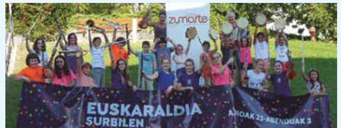
Zumarte Musika Eskolako kideak.