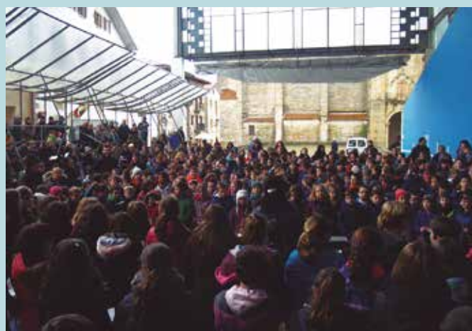
Musikaz ere girotuko dituzte datozen 11 egunak.

buletinaren baitan, Hizkuntz Proiektua lantzeko taldeak (HIZPRO) duen atalean, Euskaraldian parte hartzeko gonbita zabaltzen. Ahobizi nahiz Belarriprest txapak soinean dituztela arituko da beharrezko ikastolako lan taldea, azaroaren 23tik abenduaren 3ra. Musikaz ere girotuko dituzte datozen 11 egunok. Jolasgarrian, nahiz ikastolako sartu-irteera orduetan, Euskaraldiko abestia entzungai izango da.