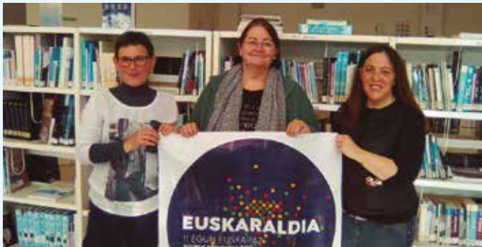
Udal liburutegiko kideak.