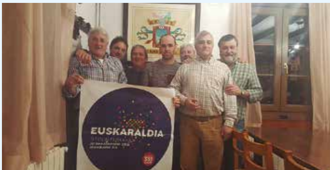
Mahaspildegi elkarteko kideak.