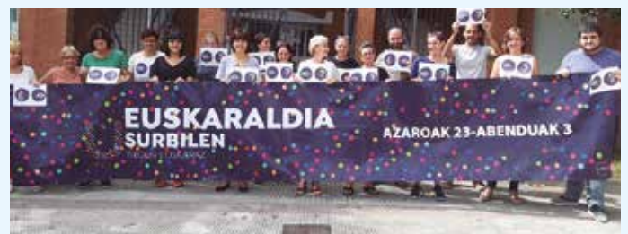
Udarregi ikastolako irakasleak (II).