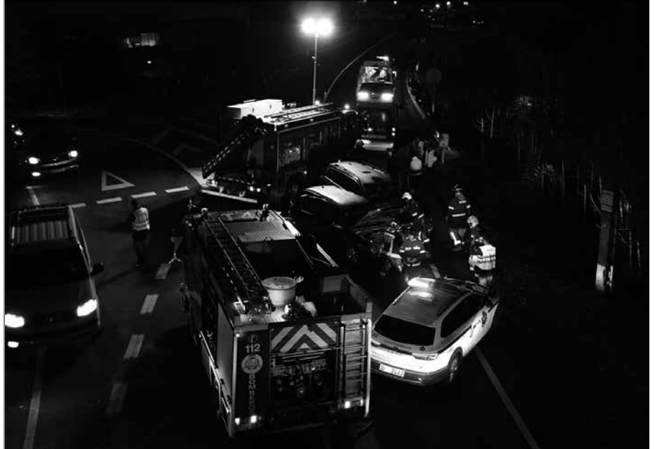
Bi autok elkar jo zuten azaroaren 13an N634 errepidean, Osinalde eta Zumartegi industriaguneen sarbidearen ondoan. Biharamunean beste istripu bat jazo zen Aginagan.

Biharamunean beste istripu bat jazo zen errepide berean Aginagan. Eta Txikierritik Troiara bidean erreil bat itxi behar izan zutenez, auto ilara luzeak. Udazken hasieran egin lanak egin zituzten ingurune berean izan zen. Errepide bazterrean jauzi ziren zuhaitz puskak bildu eta ingurua garbitzeko itxi zuten errepideko erreil bat. Auto ilara luzeak eragin zituen.