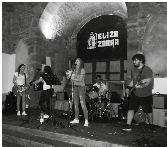
Larrian Gozo taldea eta Dj Faktori arituko dira gauetz.

■ 18:30 DJ Ibiltaria. Eguraldiak laguntzen badu, Askatasuna plazatik hasiko da bira.