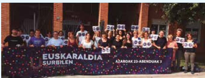
Udarregi ikastolako irakasleak (I).