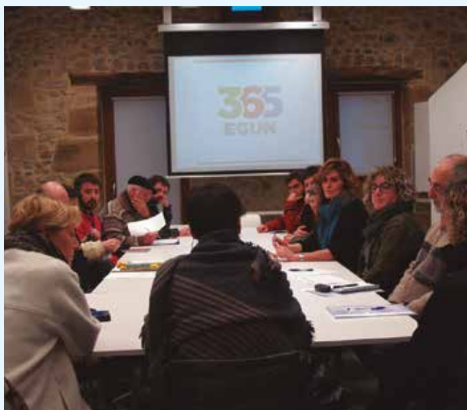
Urte hasieran egin ziren lehen bilerak.

Udaberritik aurrera: lanerako tresnak eta baliabideak eskaintzeko, eta Ahobizi eta Belarriprestak prestatzeko forma-