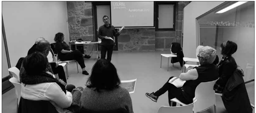
Udal gobernuak ostegun honetan aurkeztuko du udal aurrekontu proposamena Kalezarren eta Zubietan.

Udal taldeek ere ekarpenak egiteko 10 eguneko tartea dute. Gero, hilaren 28ko udal ordezkariak bilduko dituen Ogasun Batzordean aztertuko dituzte. Ekarpenekin osatuko