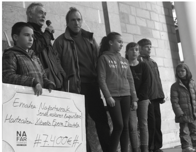
Otarrak orain eskatu behar dira eta jaso, San Tomas eguneko azokan.

Produktu sorta: ardi gazta zatia (450 g), ahate gibela (125 g), gurinezko galleta paketea (150 g), ezitia (500 g), euskal xerriki pateia (200 g), euskal xerriki odolkia (200 g). Prezioa: 40 euro.