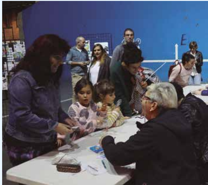
Ehunka lagunek jo zuten azaroaren 16an frontoian antolaturiko Txipli Txapa Pum ekimenera.

Ehunka lagunek jo zuten azaroaren 16an frontoian antolaturiko Txipli Txapa Pum ekimenera. Goizean zehar Potxoenean eta NOAUA! K.E.-