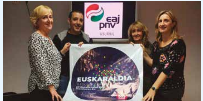
EAJ alderdiko ordezkariak.