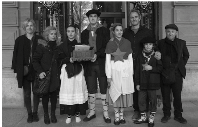
Donostiako Gipuzkoa plazan eginiko agerraldiaren ostean erregistratu zuten haur eta gurasoek sinaturiko Hitzartu plana Diputazio barruan.

“Ez gatoz liskar bila, proposamenak egitera gatoz, urte luze batean egindako lan bat