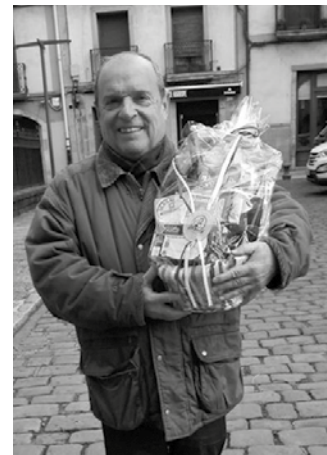
Javier Azpiazurentzat izan zen otar txikia.