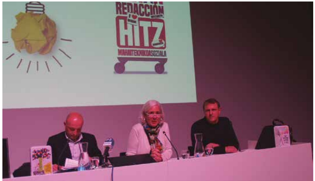
Bizkaiko Foru Aldundiak metodologia hau jarri du martxan Artigas instalazioetan, GuraSOsek abenduaren 29ko agerraldian aditzera eman zuenez.

Abenduaren 29an aurkeztu zuen GuraSOsek Hernaniko Oronako auditorioan antolatu zuen jardunaldiaren baitan, erraustegia eta zabortege berrien eraikitzea alboratzen duen proposamen berri hau. Hondakinaren kudeaketarekin