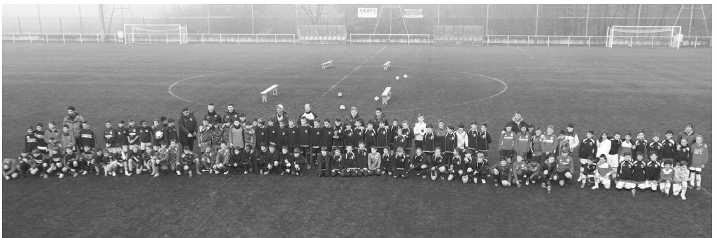
Talde bakoitzak antolakuntzaren oroigarri bana jaso eta taldeko argazkia aterata ekin zioten jardunaldiari.

Harane futbolari gaztetxoek lagun arteko joko zelaian bi- lakatu zuten abenduaren 29an, Usurbil F.T.-k antolatuta eta Kutxabank-en laguntzaz, Ga- bonetako 5. Futbol Txapelke- tari esker.