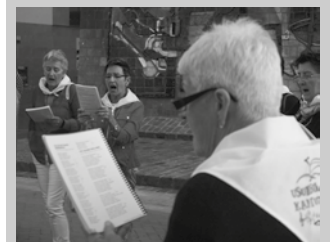
Urtarrilaren 14an hasiko dituzte entseguak Agerialden.

Hilabeteko azken larunbatean ospatuko dute bestalde, kantu-jira. Oraingoan eguerdian; urtarrilaren 26an abiatuko dira 12:30ean Mikel Laboa plazatik.