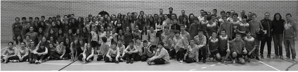
Sari banaketarekin amaitu zen Oiardoko eskubaloi jardunaldia.

M irotzen omeneko infantilen arteko 11. Eskubaloi Txapelketa jokatu zen abenduaren 29an Oiardo Kirolegian. Primerako giroa bizi izan zen goizeko 9:00etan hasi eta 20:00ak arte luzatu zen Usurbil K.E.-k antolaturiko jaialdian, eta egunean zehar jokatu ziren lagun arteko partidetan. Sari banaketarekin amaitu zuten jardunaldia.