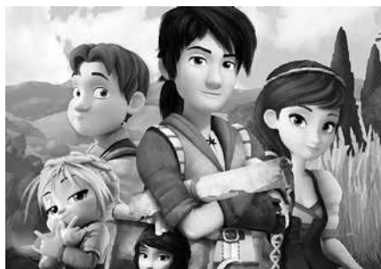
Sarrerak egunean bertan jarriko dira salgai, 3 eurotan.

Urtarrilaren 6ko jai eguna tarteko, astebete atzeratu da orainoan, negu parte honetarako abian den haurrentzako euskarazko zine zikloko hila-bete honetako proiektzioa; igande honetara (urtarrilak 13) hain zuzen. 17:00etan hasita Sutegin, "Leo Da Vinci: Mona Lisa misioa" pelikula. Usurbilgo Udalak Zior-tza G.E.-rekin elkarlanean antolaturiko emanaldirako sarrerak egunean bertan jarriko dira salgai 3 eurotan.