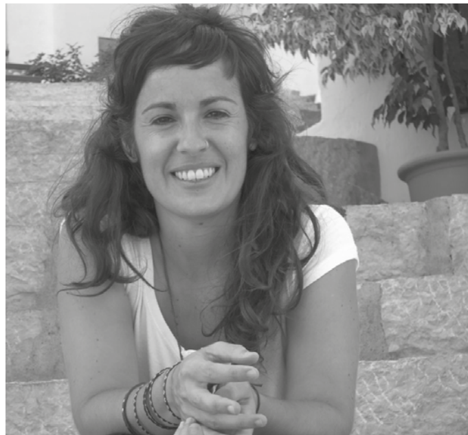
Elen Kortaxarenak biodantza ikastaroa eskainiko du Oiardo kiroldegian.

Usurbilgo Udaleko Parekidetasuna Saila, 943 377 110, parekidetasuna@usurbil.eus