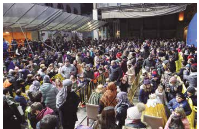
Azken asteotako irudi bilduma osoa esteka honetan topatuko duzue: noaua.eus/argazkitegia