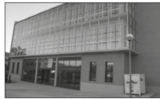
Apirilean zabalduko dute igerilekua.

2018an eginiko inbertsio ga- rrantzitsuena izan dela nabar- mentzen dute Udaletik; guztira, 767.642 euro. Foru Aldundiak 257.800 euroekin lagunduko du egitasmoa. Urriaz geroztik egiten ari diren hobekuntza lanen “helburua da igerileku txikia irisgarri bihurtzea eta handitzea, eta modu horre- tan egungo erabilera-mugak konpontzea. Horretarako, ba- tetik, igerileku txikira sartzeko