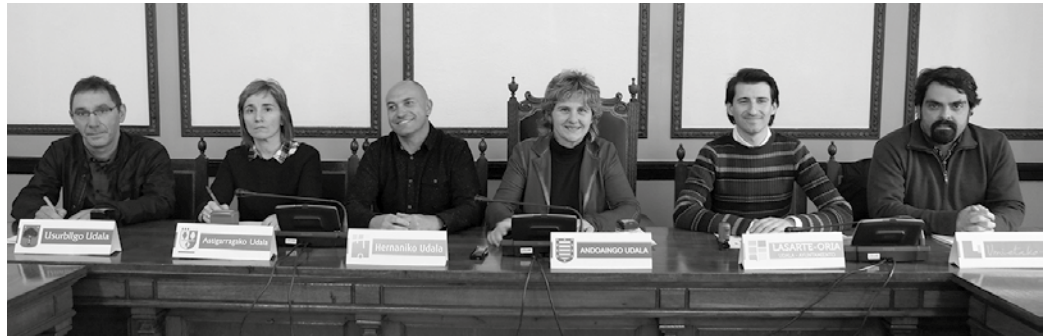
Bi hitzarmen sinatuko dituzte Beterri-Buruntzako udalek, eskualdean gizarte-bazterketa egoeran dauden pertsonak laguntzeko.

Beterri-Buruntza eskualdean bazterketa egoeran dauden pertsonentzako gizarterate eta laneratzeko zerbitzu berri bat abiatzeko hitzarmena onartu