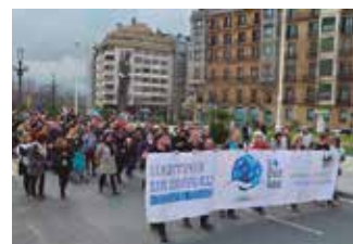
Antiguako tuneletik abiatuko da.

tuneletik abiatuko dela aurreratu zuten. “Herritarrok esango diegu une honetan agintean daudenei nola nahi ditugun gauzak; hitz eginda, elkarrizketaren bidetik eta akordioak lortuz, baina beti ere gizartea eta herritarrak kontuan hartuta”.