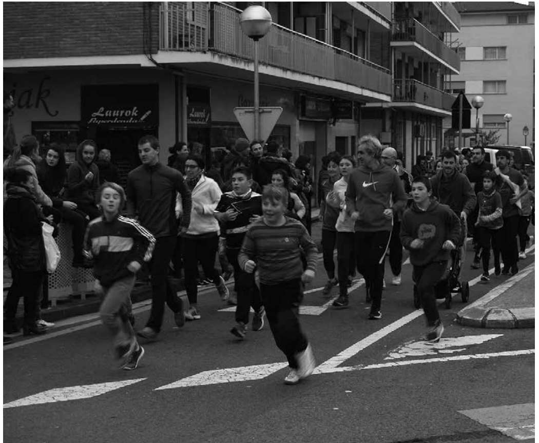
Abenduaren 31n, haur, gazte eta heldu ikusi genituen lasterka bizian. Hurbilago San Silbestre Herri Lasterketaren ondoren egin zen sari banaketa.

Giro ederrean egin zuten itzulia; gabonetako zuhaitza soinean zeramala ikusi genituen bi lagun. Edota 2019ra jarritakorik ere izan zen. Orbeldi Dantza Taldeko bi kideek apirilaren 13an ospatuko den 7. Dantza Eguna iragartzen zuen kartelarekin osatu zuten ibilbidea.